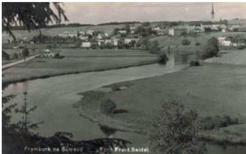
Frymburk před napuštěním Lipenské přehrady.

Jednání probíhají úspěšně a rýsuje se reálná možnost, že synagoga bude v rámci projektu kompletně opravena a začleněna do projektu, který vrátí Krumlovu důležitou součást jeho minulosti a paměti. Vedle