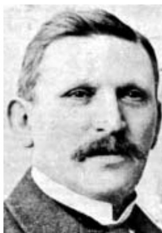
Rabín Adolf Brüll.

met LeJisrael) a komise Světové sionistické organizace. V letech 1910-12 a 1927 až 1938 vydával měsíčník Palästina , psal články např. pro Jüdische Rundschau a různé spisy o Palestině; jeho hlavním dílem jsou dvousvazkové Geschichte der zionistischen Bewegung (Dějiny sionistického hnutí).