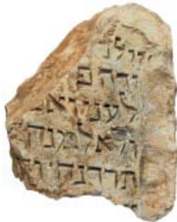
Dva fragmenty náhrobků ze Zahrady židovské, 13. stol.–1477, ŽMP 177.710, 177.713.

až k Sionské bráně na jihu (960 m), druhá (Davidova/Chrámová) vede od Jafské brány na západě téměř do středu chrámového okrsku na východě (582 m, včetně okrsku 865 m). V horním Novém Městě probíhá podobně v severojižním směru Štěpánská ulice z Václavského až na Kateřinské náměstí (948 m), ve východozápadním směru protíná tuto část města neobvykle široká (27 m) a přímá Ječná ulice od brány sv. Jana (Svinská, Slepá, na náměstí I. P. Pavlova) přímo do středu Karlova náměstí (585 m) a dále na zvýšenou terasu staré pobřežní cesty Na Zderaze (860 m). Tuto představu podporují i další doklady: Svinská brána v Ječné ulici byla jako jediná z městských bran zbudována jako samostatná pevnost (30 x 18 m), inspirovaná