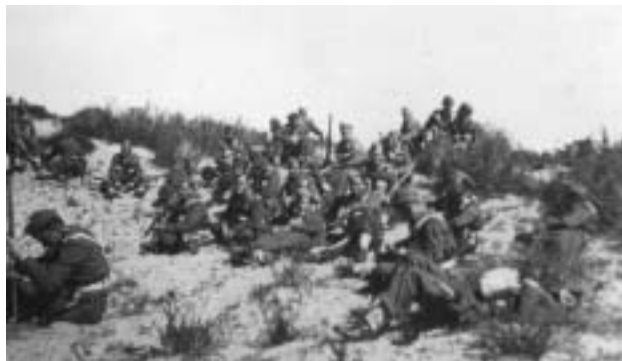
Čs. jednotka při přesunu.

Ten příkaz o zákazu vzbudit pozornost byl ovšem nejdokonaleji nepochopen pány lajtnanty, není vyloučeno, že úmyslně. V sobotu ráno bylo shromážděno mužstvo na nejvyšší palubě a podrobena dotazu, kdo prý je Žid a touží po ukojení náboženských tužeb v capetownské synagoze. Židů byla nesporná většina, ale přidalo se k nám i hodně jinověrců i chlapů bez vyznání. Za pochod Kapským Městem to rozhodně stálo. Hlavně nevzbudit pozornost. Proto asi v čele průvodu kráčela česká dechovka a hrála bez ustání píseň o zelené travičce a na ní kvítí. My pak tu nenápadnou dechovku posílili hromovým řvaním, které upozornilo holičičku, že musím jít, protože trubač volá pod prapory a ozvěnou se chvějí hory. A když jsme konečně bez pohromy dorazili do synagogy, vyslechli jsme ve vzorné kázní šabesovou řeč pana vrchního rabína Her-