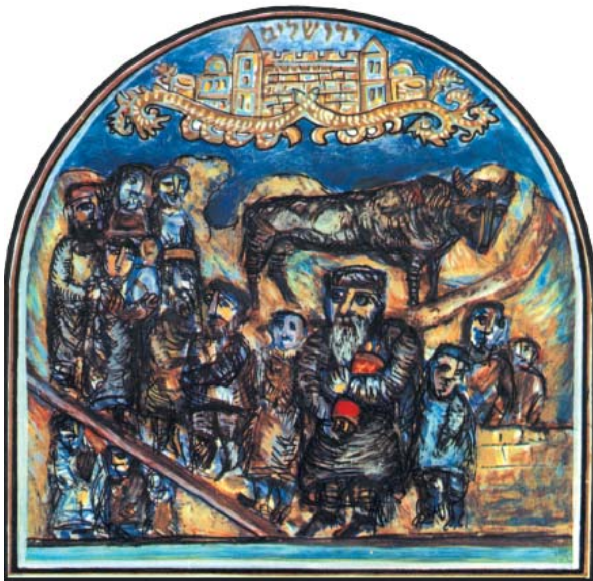
PESACH 5766 KAŠER VE SAMEACH (Ilustrace Šmuela Buny k pesachové Hagadě, Jeruzalém 1984.)

VĚSTNÍK ŽIDOVSKÝCH NÁBOŽENSKÝCH OBCÍ V ČESKÝCH ZEMÍCH A NA SLOVENSKU