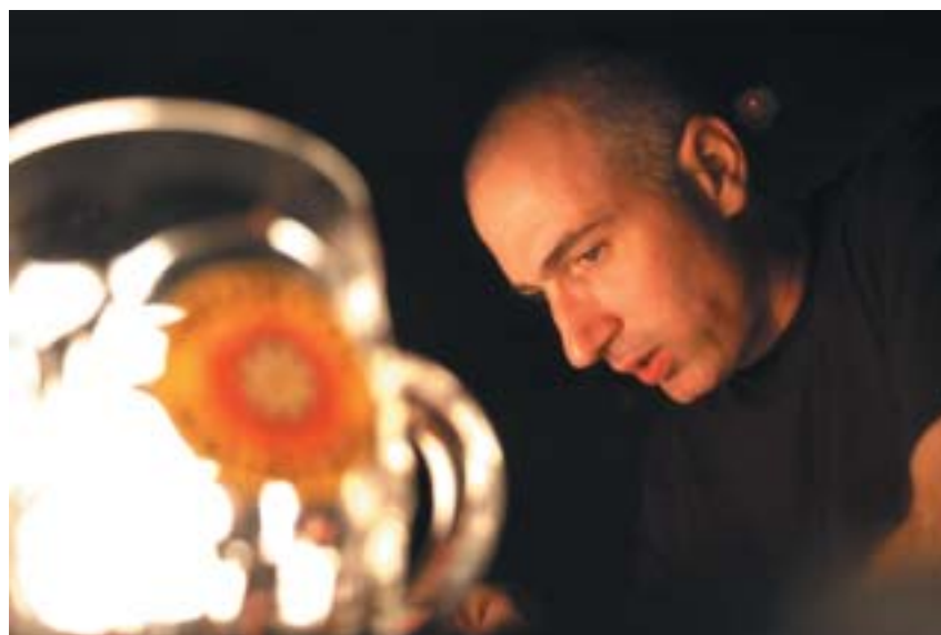
Záběr z filmu Chůze po vodě .

Do historie Státu Izrael se vrací i další z filmů, který se v Ponrepu představil, snímek Kipur (2000) světově uznávaného režiséra Amose Gitaie, kterého čeští diváci