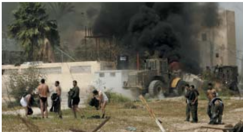
Po vítězství Hamasu byla situace ve věznici neudržitelná.