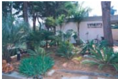
Budova Bejt Terezin v Givat Chajim Ichud.

I z neúplné informace o aktivitách Bejt Terezin je jasné, že pro uchování památky terezínských obětí a pro vzdělávání o holocaustu dělá opravdu hodně. Na otázku, zda evropská muzea šoa či například nové jeruzalémské Muzeum holocaustu věnují existenci terezínského