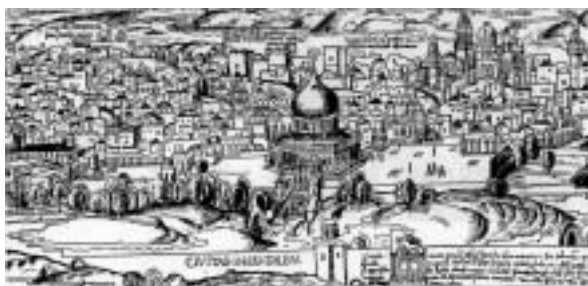
Při založení Nového Města pražského se Karel IV. inspiroval Jeruzalémem. Zřetelné je to ještě dnes v prostoru kolem Karlova náměstí, které se mělo stát hlavním centrem Prahy. Blíže viz v kapitole „Nový Jeruzalém“. Na prvním obrázku je výřez ze Sadelerova prospektu Prahy (1606) s kaplí Božího těla, Ječnou ulicí a kostelem sv. Štěpána. Na druhém pohled na jeruzalémské Staré Město (dřevoryt, 13.–15. století).

kých zemích se zřejmě dočasně uklidnila. Jinak tomu bylo v říši, kde Karel IV. častěji platil své dluhy na účet židovských obcí s tím, že mohou být vyrovnány při nejbližším pogromu. K pogromu pak přirozeně došlo (viz Rch 9/2005). Také Václav IV., který byl svými oponenty označován za „přítele Židů“, zrušil roku 1385 židovské dluhy ve 38 říšských městech a o pět let později v celé říši dlužníkům úroky z úroků. Vyvrcholením náboženské nesnášenlivosti i konkurenčního boje se stal pražský velikonoční pogrom z 18. dubna 1389, při kterém zahynuly stovky obyvatel ghetta. Znovu byla řada Židů v ghettu obviněna z rouhání se křesťanství roku 1399 a mnozí byli údajně popraveni. Všem těmto skutečnostem příliš neodpovídá tvrzení pořadatelů pražské výstavy o „konfesijní toleranci