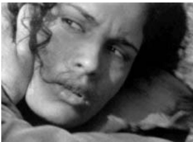
Záběr z filmu Žlutý asfalt .

vodě ( Lalechet al ha-majim , 2003) izraelského režiséra narozeného v USA Eytana Foxe – tvůrce u nás opět nikoli zcela neznámého (během loňského Febiofestu byl uveden jeho starší snímek Josi a Jagger , který s Chůzí po vodě pojí tematika homosexuality). Příběh filmu, který je v oficiálních distributorských materiálech označován jako „road movie“, svádí dohromady zcela nepravděpodobnou a nesourodou trojici hrdinů, totiž mladého agenta Mosadu Ejala, potomka přeživších šoa a úspěšného pronásledovatele teroristů, a dva sourozence z Německa, Axela a Piu, vnučata dodnes se ukrývajícího nacistického zločince. Ejalova manželka spáchala sebevraždu, a tak mu nadřazení namísto náročnějších úkolů svěří raději méně nebezpečnou misi – vypátrat s využitím obou Němců, před nimiž se má vydávat za turistického průvodce, jejich dědečka, jehož stopa se ztrácí kdesi v Argentině. Zdánlivě špionážní zápletka však ani zdaleka nediktuje žánr filmu: ten je natočen velmi civilně a provádí nás spolu s hrdiny řetězcem vypjatých a také absurdních situací, dílem komických, dílem vážných, které originálním způsobem reflektují situaci dnešního Izraele, zejména jeho vztahy k vnějšímu světu, a to jak z hlediska současnosti (izraelsko-palestinský konflikt), tak i stínů minulosti (vztah s dnešním Německem). Obzvláště