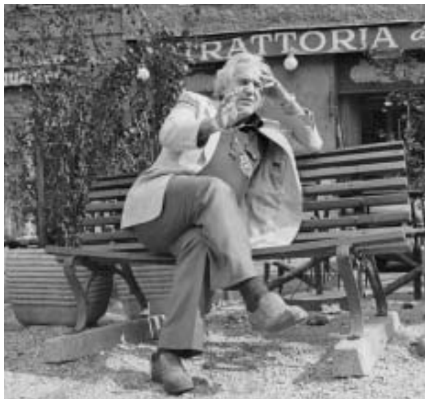
Irving Layton v Římě r. 1981.

Irving Layton se narodil roku 1912 v Rumunsku židovským rodičům (jeho původní příjmení je Lazarovič). Brzy poté se rodina přestěhovala do Montrealu. Když básník později na tu dobu vzpomínal, řekl, že ho léta dětství a dospívání naučila „podezřívavosti k literatuře i ke skutečnosti“. Básně začal psát brzy a na vysoké škole se proslavil svými nonkonformními, protipuritánskými a levicovými názory (natolik, že mu byl na patnáct let zakázán vstup do USA). Po absolvování školy pracoval jako učitel angličtiny, roku 1942 vstoupil do kanadské armády a za další rok z ní odešel a vrátil se do Montrealu. Stal se redaktorem v nakladatelství First Statement Press, v němž vyšla jeho první bás-