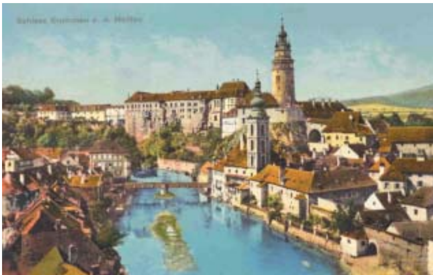
Český Krumlov z roku 1907.

Český Krumlov je město, jemuž je – kromě podivuhodné krásy, historie a atmosféry – vlastní i osud, který mu v průběhu 20. století vytrvale usiloval o duši i paměť.