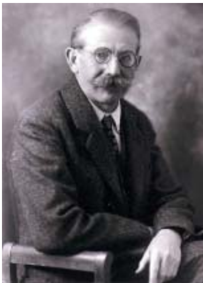
Fotograf Josef Seidel. Foto archiv.

likvidovány poslední zbytky samostatného podnikání v ČSR.