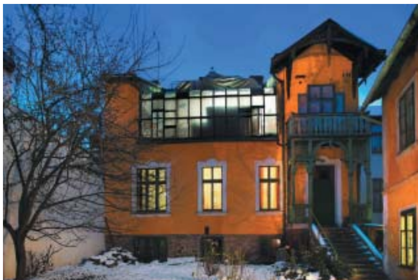
Seidelův dům a ateliér.