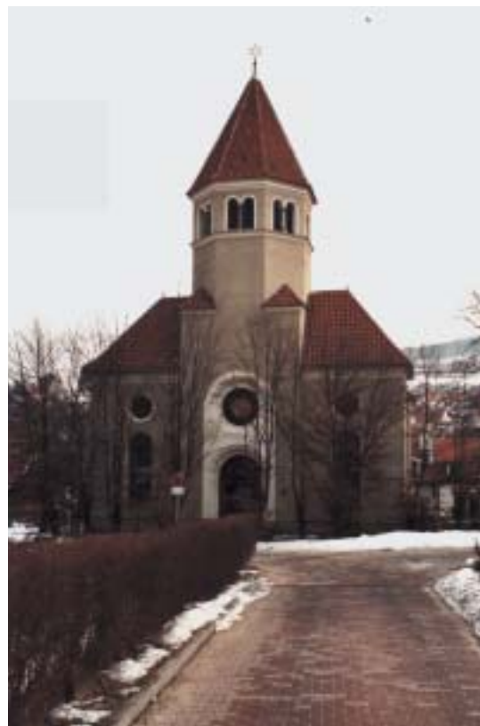
Synagoga v Českém Krumlově.