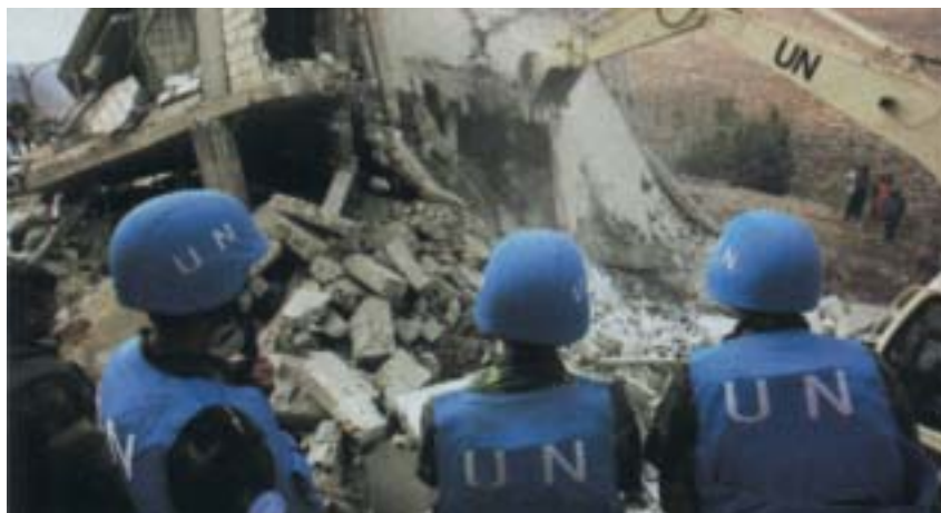
Vojáci jednotek UNIFIL.

Amos Harel v listu Ha'arec rozebírá poslední bitvu pod výmluvným titulkem „Proč ti vojáci zemřeli?“ na osudu 162. divize, jež za poslední tři dny bojů ztratila 33 mužů. Rozhodnutí na poslední chvíli o postupu k řece Litání považuje za nejspornější v této válce. Z celého kabinetu znal tamní terén pouze bývalý šéf generálního štábu Šaul Mofaz a ten se – nyní v roli ministra dopravy – pokoušel akci Ehudu Olmertovi rozmluvit. Marně. Tanky musely ve Wádí Saluki překonat čtyřistametrový svah se stometrovým