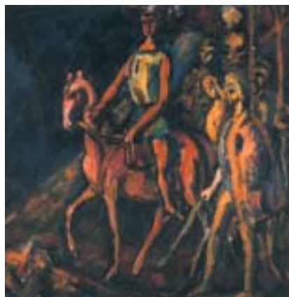
Válečníci, olej na plátně, 1905 nebo 1906.

V březnu 1911 se projevil nový atak tuberkulózy. Kahler musel zrušit plánovanou cestu do severní Afriky a byl hospitalizován. Během nemoci se uchyluje do vysněných rájů, které zachycuje v kresbách a akvarelech s orientálními motivy, zahradami s krásnými dívkami, milenci a zvířaty. Tyto práce spojuje silné poetické kouzlo, lyrická citlivost a snová atmosféra, orientální motivy a fantazijní scenerie. Ženské akty jsou zasazeny do bujně exotické vegetace, připomínající Gauguinovy tichomořské ráje, exotické krajiny Augusta Mackeho či pohádkové výjevy Kandinského. Na ně navazují jasně barevné kvaše