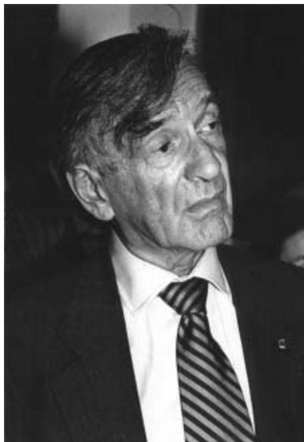
Elie Wiesel.

Je to tak. Dvacáté století bylo poznamenáno fanatismem politickým (Moskva) a rasovým (Berlín). V jednu chvíli se zdálo, že něco takového se už nemůže stát, že existuje „před“ a „po“. A pak přišla