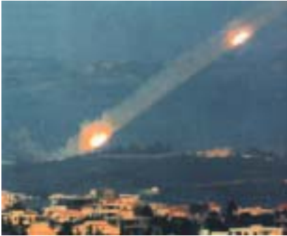
Rakety Hizballáhu letí na Haifu (6. srpen).

zbrojeným nepřítelem.“ „Důstojníci nazývali bojovníky Hizballáhu teroristy či primitivy. To bylo podcenění. Jsou to vycvičení, profesionální vojáci. Ačkoliv my jsme byli lepší, oni bojovali jako lvi.“ „Neměli jsme informace o protitankových střelách Hizballáhu.“