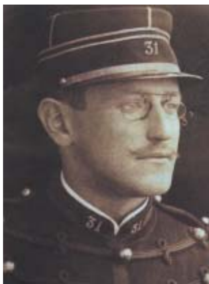
Alfred Dreyfus.

Alfred Dreyfus byl často líčen jako průměrný, své „Dreyfusovy aféry“ vlastně nehodný člověk. Leon Blum si dokonce kladl otázku, zda by nebyl Dreyfusem byl