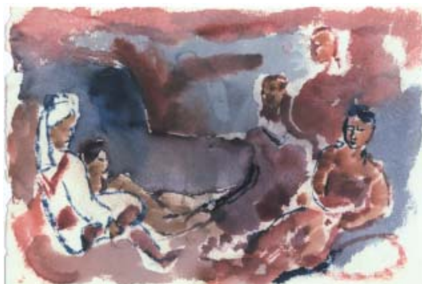
Tři postavy v krajině, akvarel, kolem 1909.