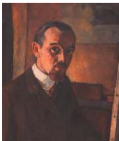
Autoportrét, olej na plátně, 1909.