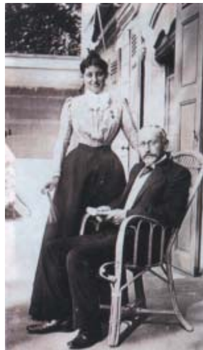
Alfred a Marie Dreyfusovi před domem v Carpentras.

Návrh je to celkem sympatický a odpovídá dojemné snaze řady historiků opět sjednotit kolem velkých mužů minulosti zmatený národ. Ale Dreyfus není, přesně řečeno, velký muž. Je to obdivuhodná oběť. Obětí i velkým mužům je třeba vzdát čest, ale ne stejným způsobem. Navíc v atmosféře rivality a žárlivosti, která dnes při klasifikování toho, kdo je vlastně