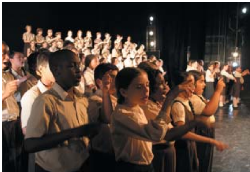
Společné představení ve Státní opeře 20. 6. 2006.

Důležité bylo, aby všichni zúčastnění dostali možnost obohatit ostatní o vlastní zkušenost a své vlastní kulturní dědictví. Nejprve vznikla příručka pro učitele, která dětem představila problematiku šoa pomocí literatury, hudby, dramatu či vizuálního umění. Studenti v jednotlivých zemích navštívili významné historické památky