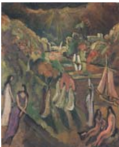
Krajina kolem Jordánu, olej na plátně, kolem 1909.

V té době se zhoršila Kahlerova plicní choroba a lékaři mu doporučili pobyt v pouštním klimatu. Od ledna do března 1908 proto cestuje po Egyptě, kde navští-