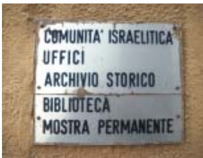
Označení Židovské obce v Casale.

„Postav si Piemonte, silnější forposty,“ zpívalo se v písničce, kterou si čeští vojáci v rakousko-uherské armádě ještě za první světové války připomínali bitvy, jež vedlo Rakousko v Itálii v 19. století. Zpíval ji i Švejk paní Müllerové, když byl povolán