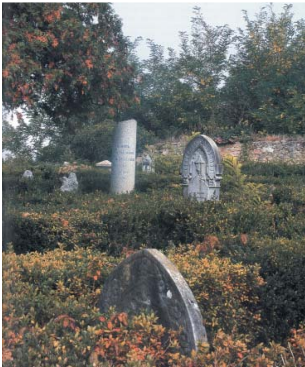
Starý hřbitov v piemontském Moncalvu. (K reportáži na str. 8–9.)

VĚSTNÍK ŽIDOVSKÝCH NÁBOŽENSKÝCH OBCÍ V ČESKÝCH ZEMÍCH A NA SLOVENSKU