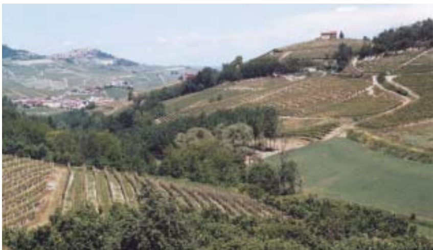
Vinice v oblasti Barola – Le Langhe.

Cestu po Langhe lze ukončit v jeho nej- jižnějším cípu, v městečku Mondovì. Z vr- cholu kopce kousek nad náměstím je krás- ný pohled na kopce Le Langhe i na jih na úpatí Alp. I tady najdeme na via Vico 65 malou synagogu z konce 18. století, která je pozůstatkem obce, založené v roce 1584.