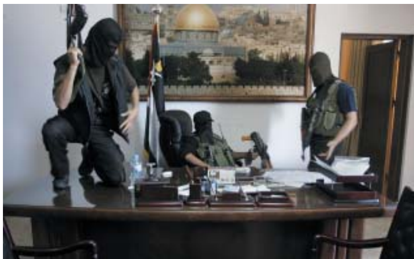
Bojovníci Hamásu v kanceláři palestinského prezidenta Mahmúda Abbáse (15. 6. 2007).