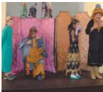
Divadlo Feigele v Hořovicích.