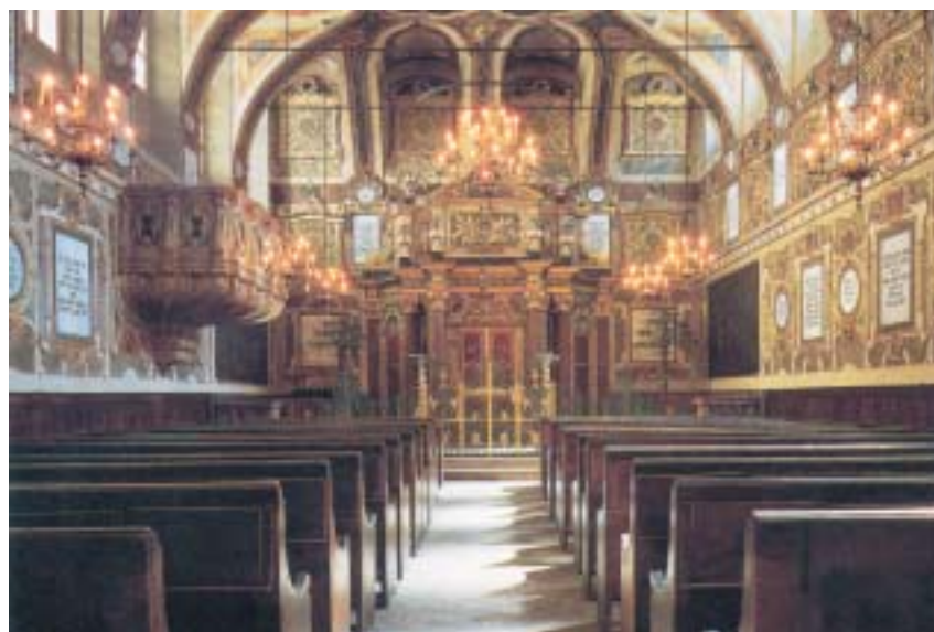
Synagoga v Casale Monferrato.

První Židé se v Casale usadili po vyhnání ze Španělska v r. 1492. Věnovali se obchodu se šperky, krajkami a brokátem; po určitou dobu měli monopol na prodej soli a – to je zajímavé – hracích karet. Postupně byli zatlačeni do ghetta, kde žilo v době, kdy Piemont obsadil Napoleon (1799 až 1814) 673 osob. Po Napoleonově porážce