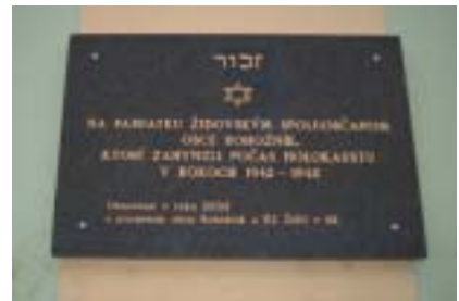
Budova synagógy a pamätna tabuľa.

v Rohožníku sa nepodarilo presne identifikovať, ale vieme, že záznamy o židovských obyvateľoch pochádzajú už z roku 1720. Koncom 18. storočia stála v obci budova murovanej synagógy spojenej so židovskou školou – chederom. Komunálne orgány v Rohožníku vydali pri príležitosti 600. výročia založenia obce publikáciu, ktorá zaznamenáva, že v roku 1939 žilo v obci 12 židovských obyvateľov popri 1273 slovenských, 36 nemeckých, 35 „cigánskych“ (rómskych), 14 českých, 4 maďarských a jednej osobe „inej národnosti“. Tá istá publikácia píše, že v povojnovom období už nežil v obci žiaden židovský obyvateľ. Tento stav ostáva dodnes nezmenený. Na margo cintorína a synagógy sú v citovanom zdroji uvedené nasledujúce vety: