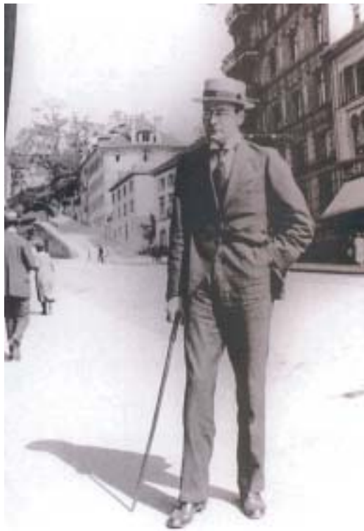
Walter Serner.

V prosinci 1919 uspořádal Serner v Ženevě „první světový kongres dadaistů“ a snad i „dada ples“, jehož se měl podle umělcovy fantazie zúčastnit i Charles Chaplin. Roku