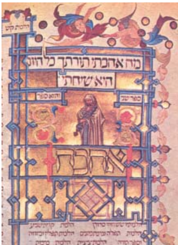
Maimonides – Mišnej Tora , rukopis na pergamenu, Provence kol. 1300.

své generaci, ale ve všech následujících, včetně té současné. Mojžíšův vliv se tímto krokem neoslabil, naopak, neboť jak říká vrchní britský rabin J. Sacks, když se od jedné svíce zapálí druhá, ta první září dále jasným plamenem, a navíc spojí svit se svou následovnicí.