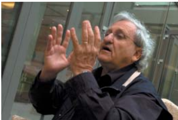
A. B. Jehošua, Festival spisovatelů Praha 2007.

Něco málo z mých knih si přeloženo bylo, ale musím s velikou lítostí říct, že dialog s Arabů vlastně neexistuje, určitě ne s Palestinci. U izraelských Arabů je situace trochu jiná, jsou s námi denně v kontaktu, znají nás. Ale popravdě řečeno, nemám vlastně představu o tom, kolik z nich