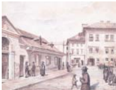
Krakov – Kazimierz, dobová pohlednice.