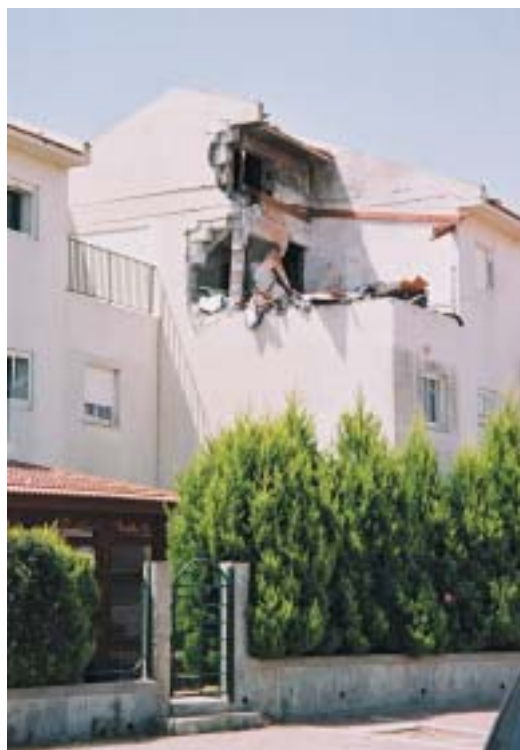
Dům ve Sderot zasažený raketou z Gazy (29. 5. 2007).

Ehud Barak byl do čela Strany práce zvolen v primárkách ještě předtím, než Hamás ovládl celou Gazu, ale již v atmosféře zesíleného ostřelování raketami, tedy očividně jako „muž do nepohody“. Přitom izraelský tisk se už delší čas pozastavoval nad tím, že nikdo přesně neví, na jakém byznysu Barak zbohatl za šest let, co odešel z vysoké politiky (byl premiérem v letech 1999–2001, poté založil společnost