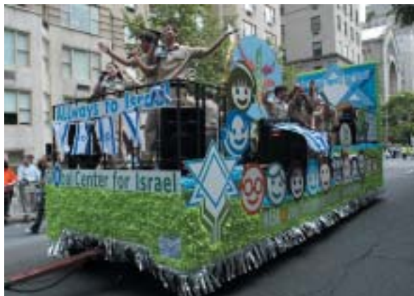
Alegorický vůz v průvodu Israel Parade v New Yorku.

Velkým tématem nejen pro AJC je energetická závislost. Problémům s tím spojeným byla věnována řada přednášek a diskusí. Bývalý ředitel CIA James Woolsey dal současnou krizi do souvislostí s válkou proti terorismu, s „dlouhou válkou“, jak se jí zde začíná říkat. Některé země Střední-