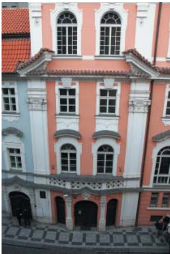
Pražská Židovská radnice, sídlo obce i její košer restaurace Shalom.

ci – izraelská rodina. Matka okamžitě protestovala, proč mají sedět se mnou, když by raději jedli sami. Abych nějak načal rozhovor, zeptal jsem se jich, zda žijí v Praze? „Cože? Za co by nás měli