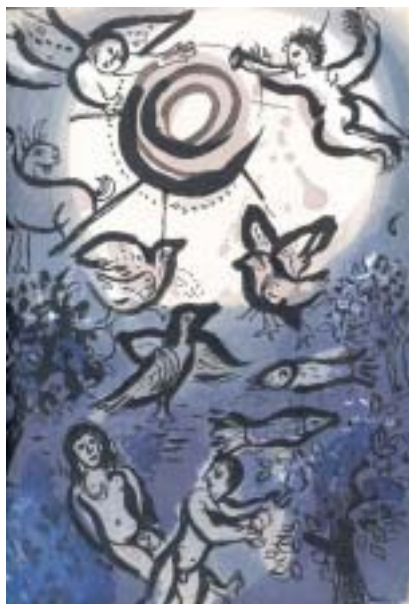
Marc Chagall: Stvoření . Z ilustrací k Bibli, 1960.

kteřý vznikl ze slova rechem , což znamená lůno. Hospodin nás miluje stejně jako matka dítě, které vzešlo z jejího lůna. Zvuk šofaru je lidským nářkem po lásce. Kajicné modlitby jsou Hospodinova soucitná odpověď na naši litostnou žádost.