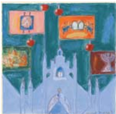
Mark Podwal, Maiselově synagoze k Simchat Tóra . Všechny Podwalovy ilustrace v tomto čísle (na obálce Staronová synagoga a přání na str. 24) jsou převzaty z kalendáře 5769, který vydalo ŽMP.