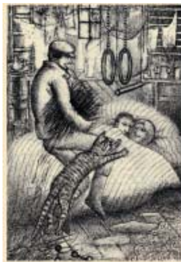
Ilustrace k Zámku , 1977/78.

Na kafkovský cyklus navázala Mařanová 12 litografiemi k dramatu Georga Büchnera