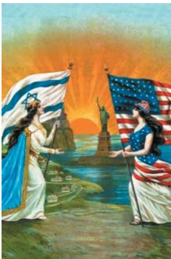
Tak nám vypukla studená válka, paní Kohnová. Ilustrace archiv.

I Benn zdůrazňuje historický význam první americké základny na izraelském území. Izrael měl vždy výhrady i k samotné možnosti amerického vojenského angažmá na svém teritoriu a preferoval „obranu vlastními silami“, čímž si uchovával maximální operační volnost. Nyní se rozhodl pro americký radar. Proč vlastně? Benn to