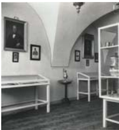
Pohled do hlavní místnosti expozice Židovského ústředního muzea v Mikulově, 1936.

Mikulov, po staletí sídlo moravského zemského rabinátu, patřil k nejvýznamnějším židovským sídlištím v českých zemích a také k sídlištím nejlidnatějším: v době největšího rozkvetu (r. 1848) měla zdejší židovská obec 3670 obyvatel, kteří tvořili 39 % obyvatel města. Po polovině století Židé odcházeli houfně do velkých měst a hospodářský význam Mikulova upadal.