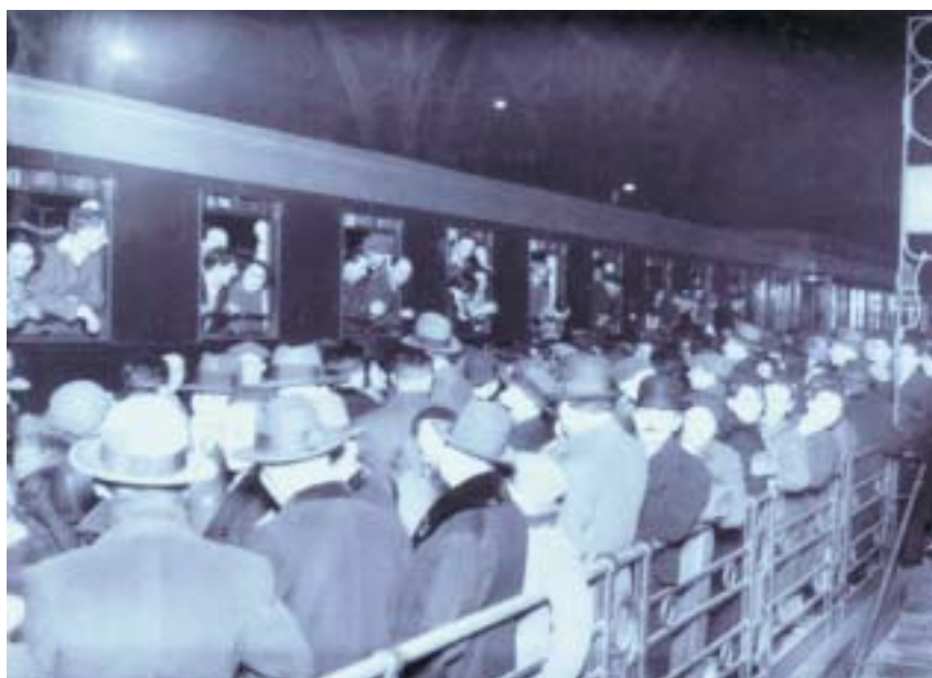
Židovští uprchlíci odjíždějí do Palestiny, Wilsonovo nádraží v Praze, 5. března 1934.

specifickým rysům pronásledování Židů a vůči jejich důvodům k útěku z Německa, ale také výrazně přispívala ke kriminalizaci židovských uprchlíků, které byli již dříve vystaveni polští či obecně „východní“ Židé. Jakmile nebyli považováni za skutečné uprchlíky, mohli být vypovídáni či trestáni za neoprávněné překročení hranic nebo za pobyt bez platných cestovních dokladů. Československo stále více ztěžova-