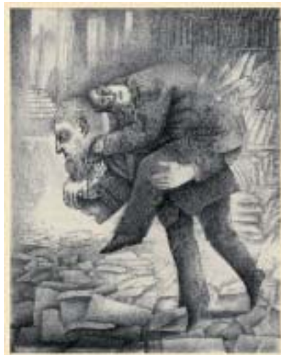
Ilustrace k Procesu , 1983.

Do Židovského muzea se opět vrátila v roce 1993, kdy zde představila početnou kolekci své tvorby, která vznikla v americkém exilu. V roce 1995 se účastnila výstavy Starozákonní motivy v českém umění 20. století v Roud-