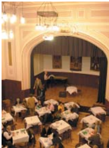
Interiér restaurace Shalom, Maiselova 18.

(Autor je vysokoškolský pedagog původem z Izraele působící v Evropě a v USA. Z angličtiny přeložila am, foto jd.)