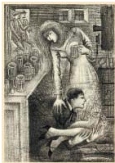
Ilustrace k Zámku , 1977/78.