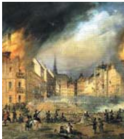
Vídeň, listopad 1848. Výřez z dobového obrazu.

Židovskou daň je obvykle nazývána pravidelný plat, který Židé odevzdávali za „ochranu“ panovníkovi, jenž byl při stanovení její výše omezen většinou jen ohledem na platební schopnosti svého „židovského regálu“. Od časů Vladislava II. postihovaly židovské obyvatelstvo u nás ještě další daně. Ukládaly je městské rady a šlechtická vrchnost, které mohly Židy, spadající pod jejich pravomoc, zatížit značnou částkou, převyšující někdy sumu placenou královské komoře. Rozsah dávek, které museli Židé platit, se postupem času rozšiřoval. Do-