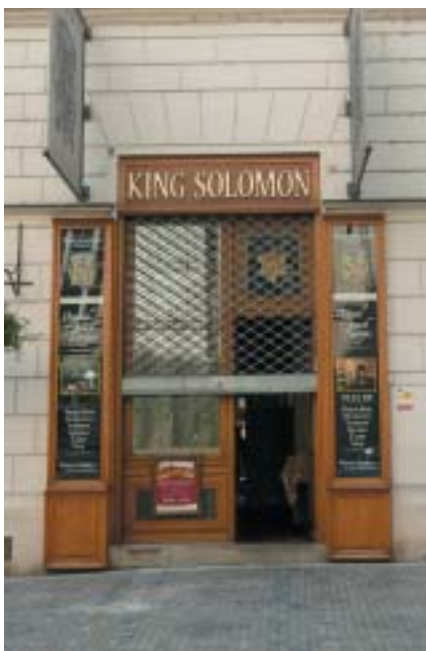
King Solomon právě otvírá.

Objednali jsme si jedno denní menu, a abychom prozkoumali židovštější aspekt nabídky, také jednu porci gefilte fiš a jednu porci pečeného kachního stehna se šouletem a smaženým zelím (katschke mit cholent und kroit). Denní nabídka začala zelnou polévkou s „domácími“ frankfurtskými párky (kroit zupp zerepetski). Byla celkem hustá a šťavnatá, se spoustou zelí. Co se párků týče, něco na nich nehrálo, protože chuť i složením připomínaly sójové „maso“. Předpokládám, že to byla známka jejich „domácí“ výroby.