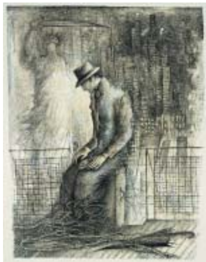
Ilustrace k Americe , 1977/78, monotyp.

v ilustracích pro bibliofilské vydání Kafkova Procesu a Zámku ve Franklin Library ve Filadelfii, za něž v roce 1984 získala čtyři ocenění od předních amerických grafických a uměleckých společností.