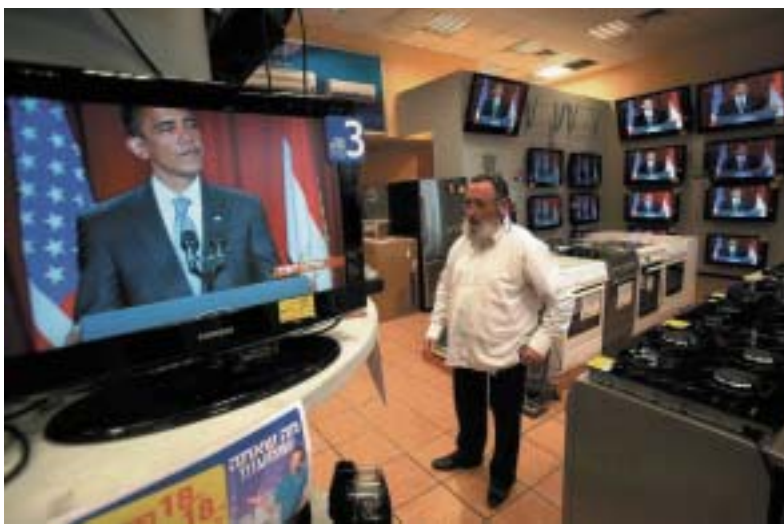
A co historické a religiální právo Židů na svůj kousek světa?

Špatné body jsou také tři. Obama sice zmínil holocaust a židovské utrpení, jenže vzápětí dodal „ale na druhou stranu“ na adresu utrpení palestinského. To už Keinona nadzvedlo. Jak „na druhou stranu“? Je tu snad místo pro srovnání genocidy, kterou Židé nikterak nevyvolali, s utrpením Palestinců, za něž oni sami nesou značný díl odpovědnosti? Použije-li se výraz „na druhé