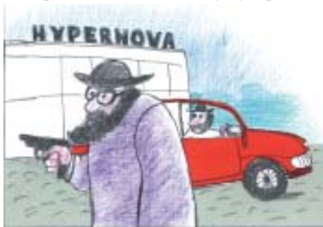
Kresby Antonín Sládek.

titulkem „Kouzelná procházka vzácnými Židy“ se Mladá fronta Dnes (29. 5.) roze-psala o židovské čtvrti v Třebíči. O den později deník informoval o tom, že je připraven projekt na rozsáhlou protipovodňovou ochranu na obou březích Jihlavy, která se vine centrem města. ■ V rámci seriálu „Velcí Češi, kteří změnili Česko“ a pod titulkem „Bonviván s křehkou duší“ otiskl týdeník Reflex (6. 6.) obsáhlý portrét herce Miloše Kopeckého. Piše se tu mj.: „Rok po smrti Jana Wericha, který zemřel