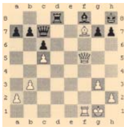
Koncovka slavné partie Réti vs. Bogoljubov, NY 1924.

Osudem se mu stala proslulá kavárna Central, ve které se scházeli význační umělci a hlavně šachisté. Vstoupil do Vídeňského šachového klubu. Hra ho stále více přitahovala, až nakonec dostala přednost před matematikou. Réti nedostudoval a začal se věnovat šachu profesionálně. Během první světové války přesídlil do Prahy a jeho velká šachová kariéra začala. Jak sám řekl, šachový život v Praze mu byl milejší než ve Vídni. „Šťěstí mi změ-