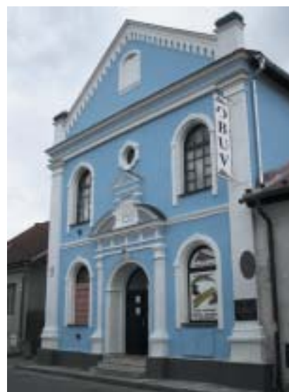
Synagoga v Trstene.

Mesto Trstená, ležiace tesne pri hraniciach s Poľskom, bolo založené roku 1609 kráľom Matejom II. Pod rozvoj mesta sa výrazne zapísala židovská komunita. Presný datum vzniku židovskej obce nepoznáme; založená bola, ako mnoho iných obcí na západe Slovenska, moravskými Židmi emigrujúcimi do Uhorska pod tlakom „famiľantského zákona“, ktorý v českých zemiach povoľoval založiť rodinu len prvorodenému synovi. Obec v Trstene bola