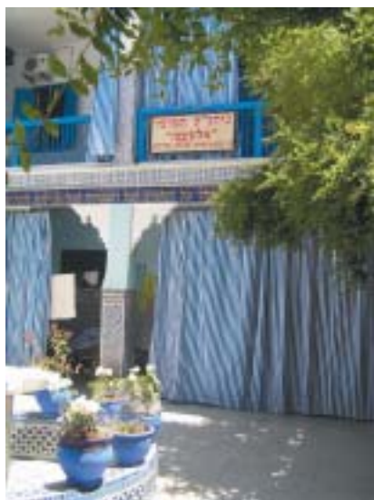
Sídlo marrákešské židovské obce.

Ještě před sto lety byl marrákešský mlach největším v Maroku. Fungovaly zde školy Alliance Israelite Universelles (od r. 1899) a další židovské vzdělávací instituce. Synagogy se tehdy nacházely v každé ulici, dnes fungují v celém městě podle domorodců jen dvě: Al Azma s tím modrookým gabajem , kterou jsme před chvílí navštívili, a jedna prý naproti trhu s klenoty, kde ještě několik židovských zlatníků vyrábí mimo jiné ruku Fatimy, židovský i muslimský symbol štěstí. Druhou synagogy jsme ale nenašli.