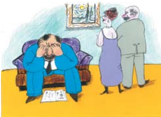
Kresby Antonín Sládek.

Ukázka z titulní prózy knihy Obchodník se sny a jiné Galilejské povídky, která právě vyšla v nakladatelství Sefer (208 stran, pevná vazba, barevná obálka). Doporučená cena 230 Kč, cena v redakci 180 Kč. O knize a autorovi viz rozhovor na str. 6–7 a text na str. 7.