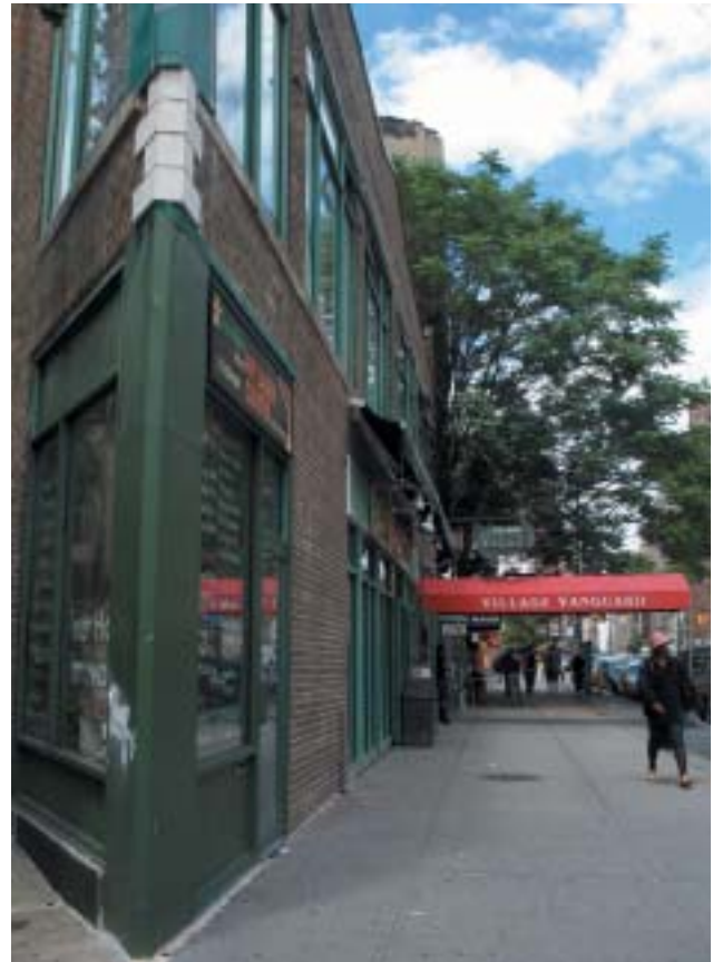
Trojúhelníkový dům, v němž sídlí klub Village Vanguard.