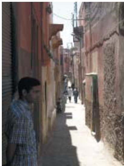
Ulička bývalé židovské čtvrti.

Židé se v Marrákeši usadili poprvé ve 12. století za vlády Almorávidů: dovolil jim to zakladatel města Jusuf Ibn Tašfin (1061–1106). Jeho následník je vyhnal, židovská obec se však po několika desetiletích obnovila a prosperovala, dokud se nedočkala další perzekuce za vlády militantních Almohadů. Židé se pak směli ve městě znovu usadit až po polovině 13. století. O sto let později se v Marrákeši usadilo mnoho Židů vyhnaných ze Španělska a Portugalska.