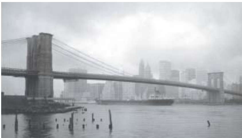
Richard Benson, Brooklynský most , 1980.

jsou dnes ceněny její černobílé snímky ze 40. a 50. let: fotografovala momentky z newyorských ulic, z chudších imigrant- ských čtvrtí, které znala z dětství: obyvate-