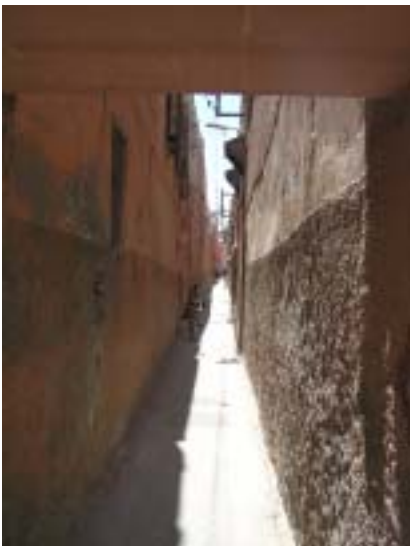
Typické marrákešské domy zvané rijády .

V 16. a 17. století za vlády Saadů, se Židům dařilo velmi dobře, na sklonku jejich vlády byl dokonce Žid guvernérem města. V tomto období vznikly dominanty Marrákeše – madrasa Ben Josef, palác El