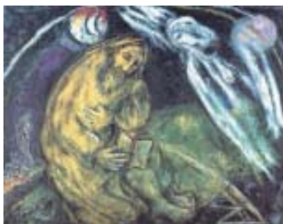
Marc Chagall: Prorok Jeremjáš . Olej, 1968.

dá.“ Proč je kompromis nebo smířící řízení hřích? Podle rabiho Eliezera „spravedlnost rozděljuje hory“ a pravda oslabená kompromisem by nikdy horu nerozdělila.