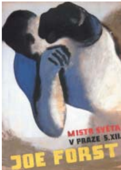
F. P. Kien: Návrh plakátu, 1939.

totiž hrozí táborovému komplexu, památníku utrpení a smrti milionu lidí, zejména Židů, zkáza.