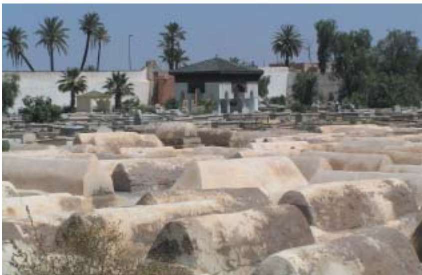
Židovský hřbitov v Marrákeši.

vou: obchodníci s černými jarmulkami tu odměřovali loktem hedvábí, v chederech se židovské děti divoce kymácely dopředu a dozadu a recitovaly vysokými hlásky: „Alef. Bet. Gimel.“ Zažil tu čtvrt velmi