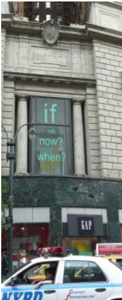
Talmudský citát jako reklama.

Na počest Franka Lloyda Wrighta je v galerii do konce srpna přístupna také velkory-