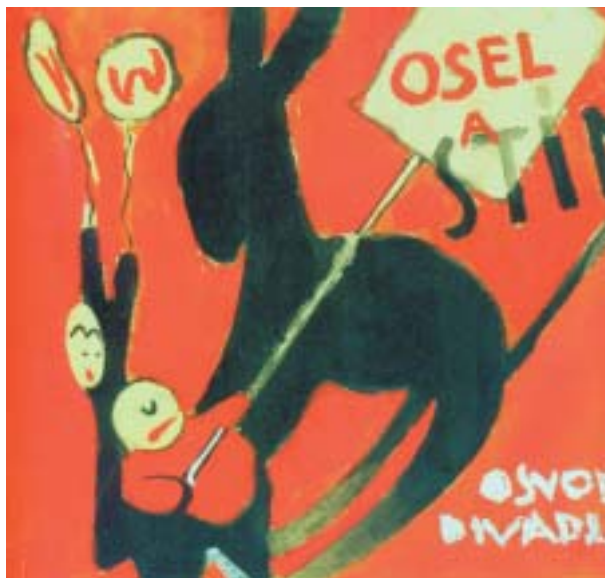
F. P. Kien: Návrh plakátu ke hře V&W Osel a stín , akvarel, 1940–1941.

Současná výstava na Malé pevnosti v Terezíně představuje téměř tři stovky Kienových výtvarných děl a dosud neznámých dokumentů a bude otevřena až do 14. září 2009. Architekt výstavy Georg Schrom se pokusil s pomocí dřevěných beden vytvořit instalaci, v níž se vizuální a verbální výraz, umění a literatura vzájemně prostupují a doplňují. Výstava je společným projektem Památníku Terezín a Izraelské Solidarity, sponzory projektu jsou Claims Conference, New York; International Task Force, Německo; Pär Stenberg, Švédsko; Ministerstvo kultury České republiky, Česká rada pro oběti nacismu a Židovské muzeum v Praze. K výstavě byla vydána obsáhlá a velmi zdařilá Kienova monografie od Jeleny Makarové a Iry Rabina, v níž se