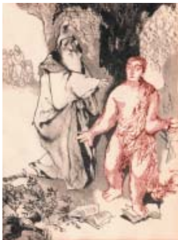
Jiří Trnka: Stvoření Golema , 1961.

V té době však již golem dávno žil i mimo židovské prostředí. Stal se oblíbeným tématem mnoha moderních spisovatelů, jako mocná metafora přitahoval umělce i vědce a v jejich fantazii dostával novou podobu, nezávislou na původních židovských vzorech. Dodnes asi nejslavnější verzi golemovského motivu (podpořenou sugestivními ilustracemi Huga Steinera-Prag) přinesl pražský německý spisovatel Gustav Meyrink: v jeho stejnojmenném románu (1915) představuje golem jakési zhmotnění pocitů úzkosti a strachu obyvatel pražského ghetta. České zpracování romantických příběhů o rabim Löwovi se naplno prosadilo už koncem 19. století. Začlenění golemovských legend do Starých pověstí českých Aloise Jiráka a Pražských pověstí Josefa Svátka nebo Adolfa Weniga nepochybně přispělo k popularitě rabihö Löwa a jeho golema pro všechny další generace (O golemovském motivu v českém výtvarném umění viz Rch 11–12/2002.)