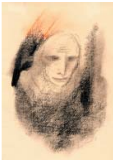
Hugo Steiner-Prag: Studie hlavy Golema, 1915.

Ačkoli si výstava Cesta života – rabi Jehuda Leva ben Becalel (kol. 1525–1609) v císařské konírně na Pražském hradě (o její první části jsme referovali v Rch 8/2009) klade za cíl přiblížit především život a duchovní odkaz historického Mahara-la, nelze pominout ani obraz, jaký si o tomto učenci vytvořily následující generace. V povědomí širší veřejnosti vděčí za svou popularitu především spojením s pověstí o golemovi, umělé bytosti, která svého domnělého tvůrce takřka úplně zastínila. V druhé části výstavy se proto dostalo pozornosti i legendám o rabim Löwovi a jeho golemovi, které poskytl bohatou inspiraci literatuře, dramatickému a výtvarnému umění.