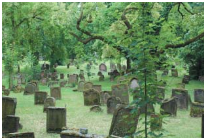
Heiligen Sand, nejstarší dochovaný židovský hřbitov v Evropě, nacisté zničit nestačili.

Alpy na cestě do Palestiny, kam se chtěla přemístit většina wormské obce, byl rabi Meir poznán, zatčen a na základě falešného obvinění uvězněn v alsaském Ensisheimu