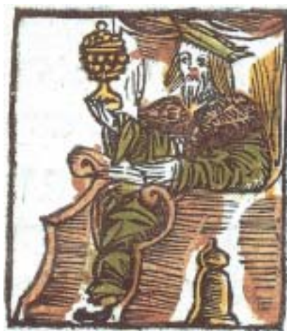
Seder zemivot u-birkat ha-mazon: Požeňání nad vínem, Praha 1514.

Nejen že se vinná réva musí zasadit a opečovávat, ale je nutné sklídit hrozny, oddělit bobule od stonků, vylisovat je a opatrně a pečlivě nechat kvasit, a to přesně tak, aby víno bylo co nejlepší a nejživější. Právě kvůli starostem, jež jsou s výrobou vína spojeny, se tento nápoj stal vyjádřením radosti i svatosti.