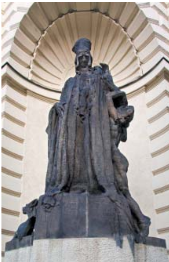
Ladislav Šaloun: Rabi Löw , 1911–1913.

O životě Jehudy Löwa nevíme mnoho. Zatímco v dílech mnoha jeho současníků