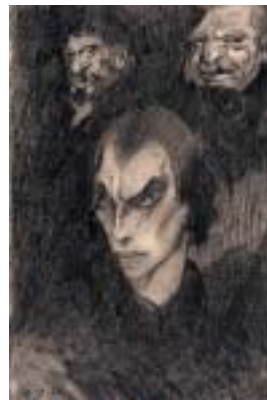
Hugo Steiner-Prag: Studie hlav ke Golemovi , 1915.

Novou podobu golemovi dává rovněž interaktivní instalace Petra Nikla na výstavě Golem. Hledej znak či slovo k jeho oživení v Galerii Roberta Guttmana, která potrvá až do 4. října. Nikl se zřejmě inspiroval některými středověkými mystickými rituály, které měly za cíl oživit podobu golema v myslí svého tvůrce. Prostřednictvím doty-