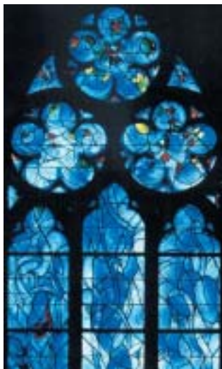
Horní část jednoho z postranních oken.

stitucionální rovině skutečností. Z politického aspektu je šoa historií, která, jak se všichni shodují, se nesmí nikdy zapomenout