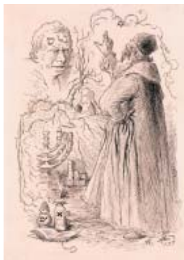
Mikoláš Aleš: Rabbi Löw a Golem, 1899.

Rabi Löw – v hebrejské literatuře známý spíše pod akronymem Maharal (Náš učitel a rabín Leva) je vedle Franze Kafky jistě nejproslulejší osobností židovské Prahy. Do obecného povědomí vešel díky mnoha legendám, jimiž ho opředla lidová tradice a folkloristé. Přitom jde o jednoho z mála