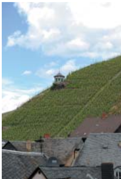
Rýnský ryzlink je dobré a pociťivé víno.

Porýní. Nejstarší náhrobní kámen je datovaný rokem 1076. Na hřbitově se dochoval také hrob Meira z Rothenburgu, známého jako Maharam, který zde byl pohřben v roce 1306; zemřel však už o 14 let dříve v žaláři Rudolfa I. Habsburského. Pronásledování a daním, které císař zavedl, se pokusili wormští Židé čelit obvyklým způsobem – odchodem na jiné, méně nepříznivé místo. V roce 1286 při pokusu překročit