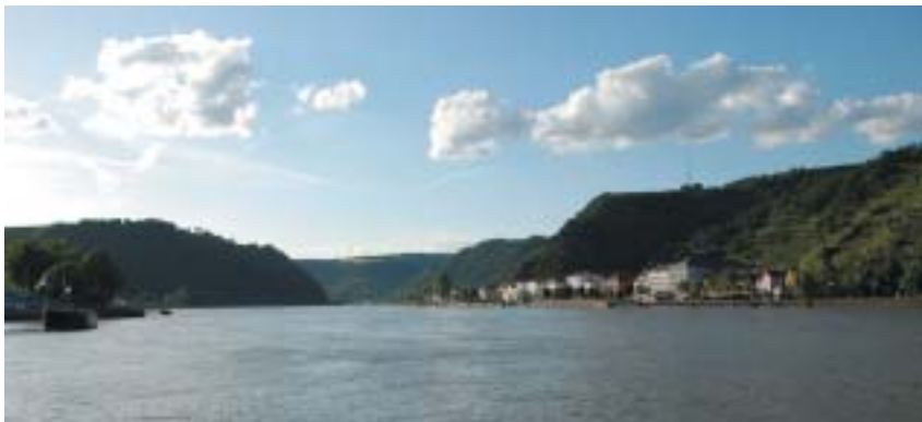
Rýn u St. Goaru, nedaleko Bacharachu a skály Loreley.

ciho v Mohuči (Magenza v jidiš), kde roku 1028 zemřel. V době, kdy Aškenázové představovali slabá tři procenta světové židovské populace, se jako představený zdejší ješivy a autor zásadních halachických rozhodnutí i komentářů k Tóře i k Talmudu