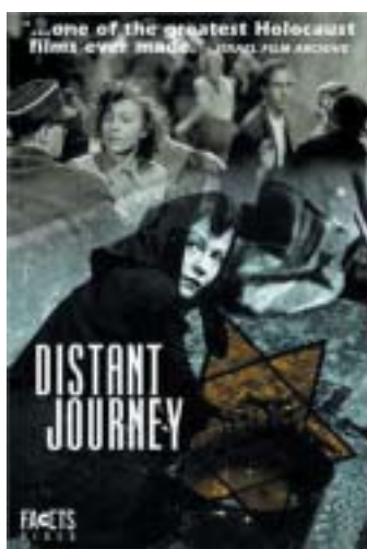
Daleká cesta měla velký úspěch v cizině.