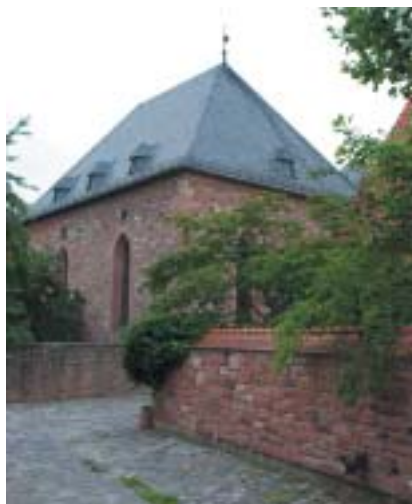
Synagoga ve Wormsu, znovu postavená v r. 1961.

V 19. a na začátku 20. století se směr pohybu mění. Aškenázští Židé z Polska, Haliče i z Ruska směřují před pronásledováním, bídou a válkou na západ a odtud většinou za oceán, do Ameriky. Někteří se občas v Německu usadí, ale jejich souvěrci, kteří mezitím