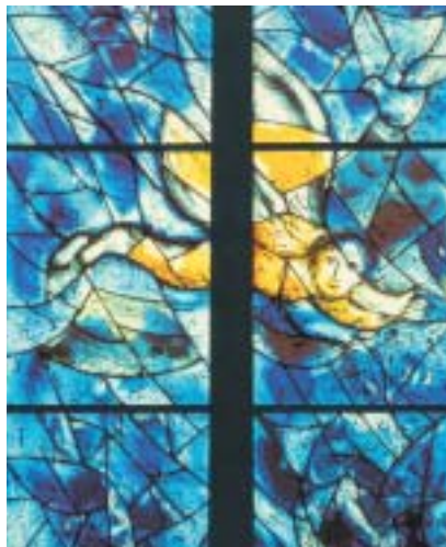
Marc Chagall: Anděl . Detail z vitráže v Mohuči.

spojené s Hamsunovým výročím se soustředí též na jeho nacistickou minulost, a tím poslouží i ke vzdělávání o šoa.