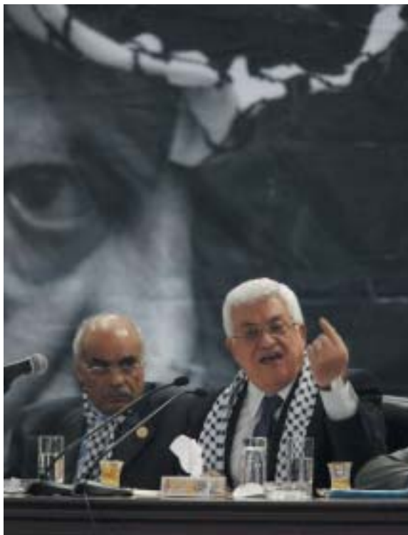
Prezident Abbás a Hamdan Ašur před Arafátovým portrétem.

Jak se ocitl na sjezdu muž odsouzený na dvanáct doživotních trestů? Snadno. Byl totiž propuštěn v rámci výměny vězňů, re-