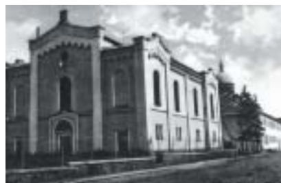
Synagoga v Kežmarku zbúraná r. 1961.

Rázovité mesto s bohatými tradíciami tvoriace centrum niekdajšieho „nemeckého Spiša“ (Zipfer Deutsch). Počtom dominantné nemecké mestské obyvateľstvo „slobodného kráľovského mesta Kežmarok“ dlho odopieralo Židom právo usadzovať sa v intraviláne mesta. Z tohto dôvodu je prítomnosť Židov v regióne oveľa staršia, ako vlastné dejiny židovskej náboženskej obce v Kežmarku. Židovským centrom Spiša a domovským miestom väčšiny miestnych Židov až do polovice 19. storočia bola malá obec Huncovce (Unsdorf),