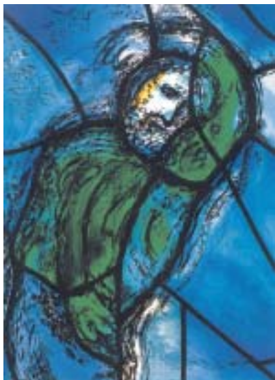
Marc Chagall: Jákobův sen , detail vitráže.

Tak jako k Wormsu, Bacharachu či Ahrweileru ke každému místu, spjatému s židovskou minulostí Porýní, patří vedle výčtu učenců a duchovních a hospodářských výkonů i příběh o násilí, pronásledování, nenávisti a zkáze, který vyústil v Německu, a poté ve velké části Evropy do holocaustu – dosud nevidané katastrofy. Je otázka, zda Německo udělalo všechno pro odhalení a potrestání nacistických vrahů, ale v rám-