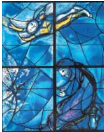
Marc Chagall: Prorok Eliáš , část vitráže.

Je to silný zážitek vidět, jak lidé v kontaktu s tím, co k nim světlem a barvou skrze okna promlouvá, odkládají svůj neosobní výraz, usedají do lavic nebo se tiše procházejí rozlehlým prostorem a současně, jak se dívají před sebe, se dívají i do vlastního nitra. Není nezbytně nutné převádět všechno do náboženské terminologie, ale jinak než jako jednu z podob modlitby to nazvat nelze.