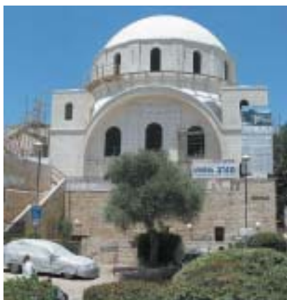
Churva krátce před dokončením prací.

„Obvykle historii zpodobňují, tady jsem se stal její součástí,“ řekl o práci v Churvě malíř Kilmenik. „Tak jsme se konečně dočkali, vždyť já se v původní synagoze ženil,“ komentuje stavbu střízlivěji místní starousedlík. Lidé, kteří kolem znovu vybudované synagogy proudí, směřují spíše