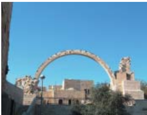
Pamětní oblouk nad ruinami Churvy.

„Může se ruinám říkat ruiny i poté, co byla budova znovu postavena?“ ptá se řečnický autor amerického deníku Forward v souvislosti se synagogou. Je jisté, že jméno Churva (ruiny, trosky) jí už zůstane a bude navždy připomínat její pohnutý osud. Před třemi sty deseti lety ji nechal postavit rabi Jehuda he-Chasid Segal ha-Levi, zvaný Juda Zbožný, původem z polského Siedlce. Proslavil se jako umírněný přívrženec šabatiánství, vyznavač asketického života a hlavně – nadšený agitátor alija, „výstupu“ do Svaté země. Roku 1697 se tam spolu se svou rodinou a přívrženci vydal z rodného Polska, jeho skupinu tvořilo nakonec asi tisíc lidí.