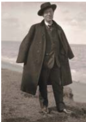
Guslav Mahler, 1906.

Mahlerovským výročí letošního léta bude jistě žít celý kulturní svět. S velkým předstihem se již objevila spousta článků v odborném tisku, ale i v populárních novinách a časopisech, určených široké veřejnosti, natáčí se filmy, televizní pořady, připravují se koncerty. A omílají se známá fakta – Gustav Mahler se narodil 7. července 1860, tedy před sto padesáti lety, v obci Kalištích na Vysočině v židovské, německy mluvící rodině, která se – záhy po jeho narození – odstěhovala do Jihlavy. Jeho hudební talent se projevil již v dětství, kdy ho ovlivňovali hlavně místní čeští hudebníci. Působil pak zejména v Praze, Lipsku, Budapešti a ve Vídni, angažmá získal i v new-