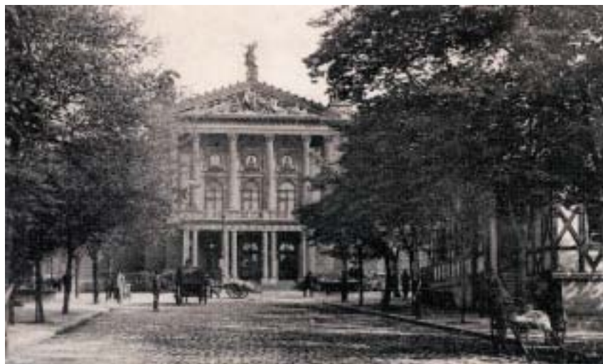
Nové německé divadlo v Praze (dnes Státní opera Praha).

Ale vraťme se k jeho pražskému účinkování. Smlouva s Německým divadlem se pomalu blížila ke konci. Angelo Neumann se ho pokoušel přesvědčit, aby zůstal, ale nešlo to. Ředitel lipské scény Stagemann