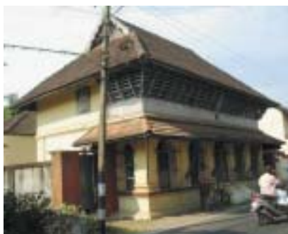
Synagoga Parur – stav před opravou.

komunita odjela do Izraele. Loni místní radnice rozhodla o její opravě. Část prostředků (náklady se odhadují na 1,8 milionu dolarů) poskytne Kérala, část federální vláda v Dillí. Odborníci pokládají synagogu Parur za jedinečnou, neboť její architekturu ovlivnila řada zdejších stavebních stylů. V současné době žije v oblasti asi 35 Židů.