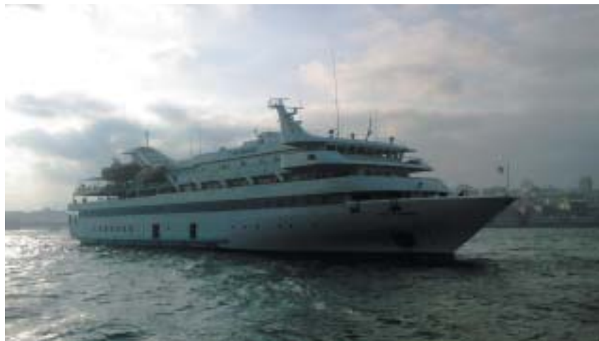
Turecká loď Mavi Marmara vyplouvá z Istanbulu.

Izrael předem věděl, že flotila, která se poskládala na Kypru, vyráží směrem do Gazy. Už před třemi lety vyhlásil, že blokáda Gazy coby dějiště konfliktu zasahuje i do mezinárodních vod. Ale když lodě