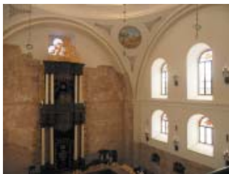
Interiér obnovené synagogy.

Meltzer obnovil budovu téměř „kámen po kameni“, včetně rekonstrukcí pozlaceného uměleckého kování, umných dřevorezeb na bimě a stupňovitém aronu ha-kodeš, barevných okenních vitráží, stovek dřevěných, kovaných a kamenných detailů. Pro přesnou rekonstrukci využil podobu troskek, dále dokumentaci, především