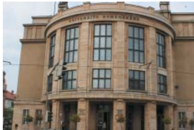
„V Bratislavě probíhaly čistky v roce 1948 pomaleji než v Praze...“