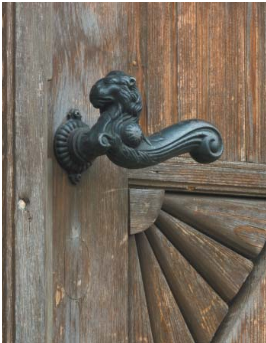
Synagoga v Brandýse nad Labem bude rekonstruována a obnovena. /Projekt Revitalizace židovských památek v ČR 2010–2013./

VĚSTNÍK ŽIDOVSKÝCH NÁBOŽENSKÝCH OBCÍ V ČESKÝCH ZEMÍCH A NA SLOVENSKU