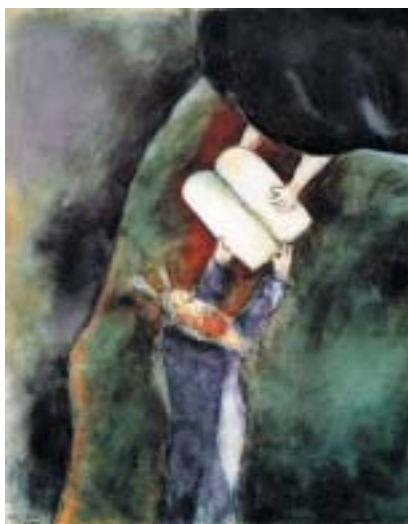
Marc Chagall: Moše přebírá desky smlouvy . 1931.

mužů, vůdců kmenů (5M 1,9–21). Teprve po této zdánlivě nevhodné odbočce se Mojžíš vrací k původnímu příběhu, jenž končí tím, že namísto odvahy projeví Izraelité zbabělost a místo vítězství se dočkali smrti v poušti. Jaký má zmíněná odbočka smysl? Jak se vztahuje k neúspěšné výpravě?