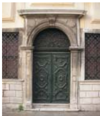
Scuola Levantine – portál.