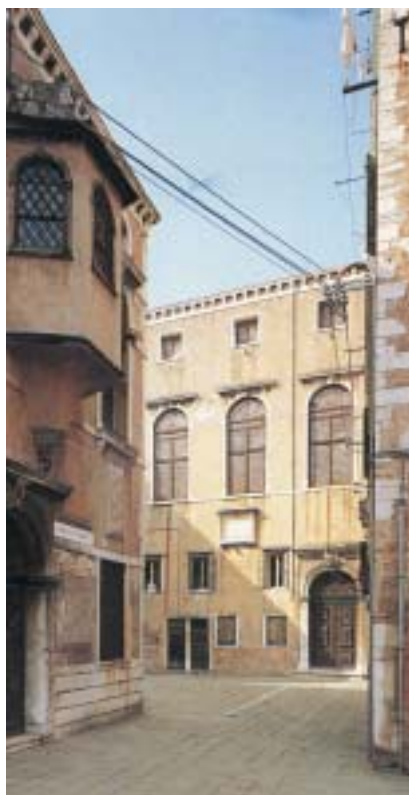
Scuola Levantine a Scuola Spagnola.

a výstavnější než synagogy v Ghetto Nuovo. První z nich, Scuola Spagnola (založená zřejmě v roce 1584), se díky přestavbě slavného benátského architekta Baldassareho Longheny (1635–1657) stala největší a nejokázalejší synagogou benátského ghetta. Jednoduchost exteriéru tu kontrastuje s nádherou vnitřního prostoru. Pod