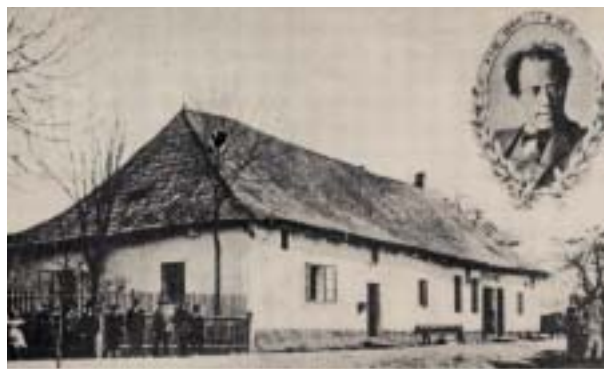
Rodný domek G. M. v Kalištích.

Mahler znal Prahu z doby svých gymnaziálních studií, která se tehdy moc nevyvedla. Teď, po třinácti letech, byla Praha jiná. A on se vrátil v jiné roli, než jakou měl jako někdejší neúspěšný student. Formálně se stal korepeticem a druhým dirigentem Královského zemského německého divadla, ve skutečnosti ale byl dirigentem prvním. Angelo Neumann – který měl obrovský čich na mladé talenty – mu okamžitě svěřil všechna významná představení od Mozartova Dona