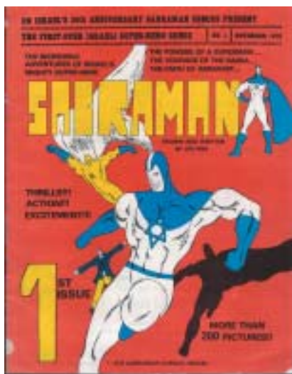
Uri Fink: Sabraman , 1978.

Sofie Gandarias s názvem Kafka – vizionář (do 16. 7.). Výstavu lze zhlédnout i v Českém centru Praha, Rytířská 31.