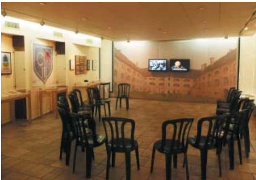
Liga Terezin: Výstavní a přednáškový sál s nástěnnou malbou Drážďanských kasáren.

i bance, která „fungovala“ v terezínském ghettu. Máme tu schované terezínské bankovky, záznamy o účtech. Nakonec z toho vznikly dvě výstavy: jedna je o terezínské bance a terezínském „managementu“, o tom, jak rada starších organizovala život a práci pro obyvatele ghetta. Já to pokládám za neuvěřitelný výkon. Postarat se skoro o šedesát tisíc lidí, kteří tam byli, to je jako