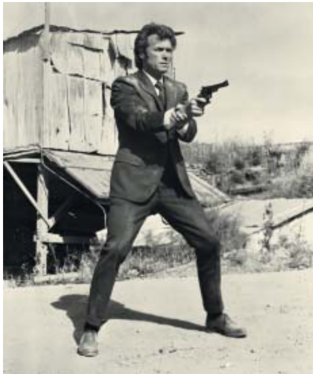
Clint Eastwood v roli inspektora Callahana alias Drsného Harryho.

To, že západní intelektuálové obdivují síly bojující proti Izraeli, je podle Smitha jasné. Konzumenti médií v USA dobře vědí, že Hamás a Hizballáh poskytují „sociální služby“ svým komunitám. A intelektuálové mezi tvůrci zpravodajství bagatelizují jejich skutečnou hrozbu třeba takto: „Ano, skandují ‚zabijte Židy!‘ a jednájí podle své rétoriky, ale též vychovávají své děti v čistých, dobře osvětlených školách.“ Takto salonně projevovaný respekt podle Smitha ukazuje míru tolerance k vražednému antisemitismu.