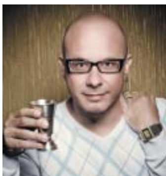
Kobi Oz.