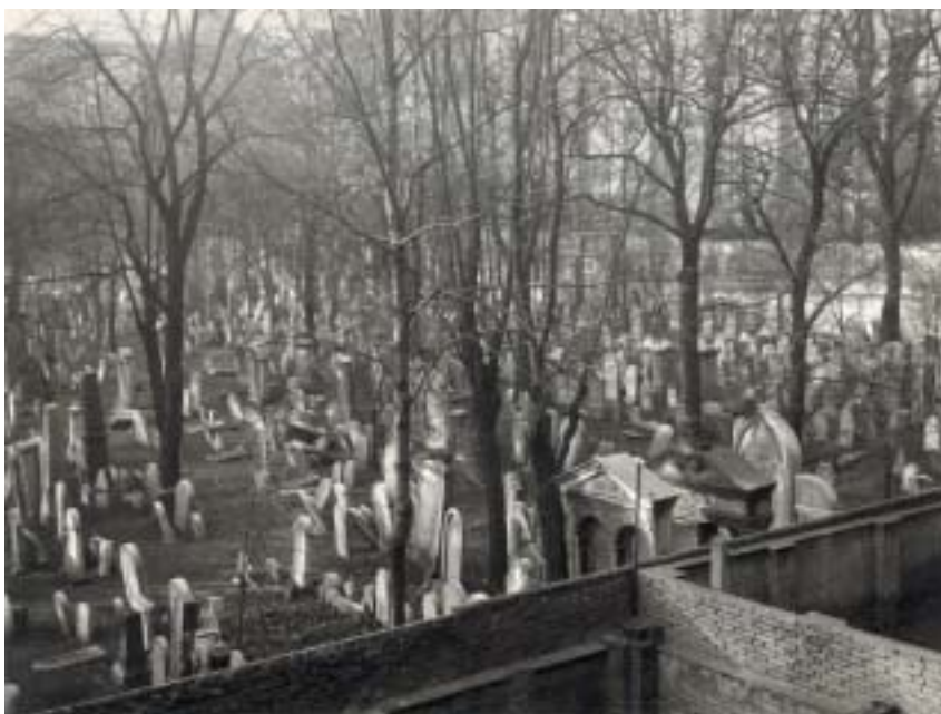
Celkový pohled na severovýchodní část hřbitova. Foto V. Hnízdo, 1956.

Když roku 1787 Josef II. zakázal pohřbívání uvnitř pražských měst, stal se (rozšířený) židovský morový hřbitov hlavním pohřebišťem pražské židovské obce a později také souvěrců z obcí na jihovýchodním okraji Prahy. Pohřby byly i nadále vypravovány z budovy chevra kadiša u Starého židovského hřbitova, pohřební průvody musely ale putovat přes celé město (nejspíš Dlouhou a Eliščinou třídou, Hyberskou, Seifertovou a ulicí U Rajské zahrady) a ještě kus cesty za jeho tehdejší obvod.