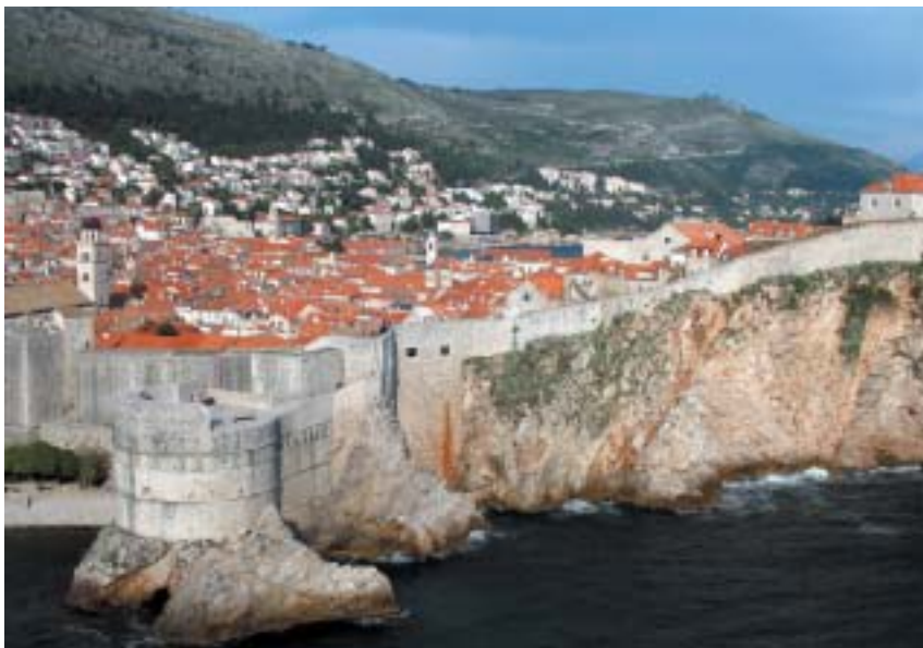
Panoráma Dubrovníku.