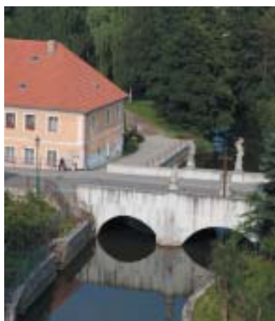
„Židovský“ most v Brtnici.

Jedním z mála brtnických Židů, kteří se zachránili, byl Vilém Pachner, kterému se podařilo emigrovat do USA. Z dopisů, které si po válce vyměňoval se svým brtnickým přítelem Josefem Křivánkem, stojí za to citovat: „Věř mi však, a to vím, že vě-