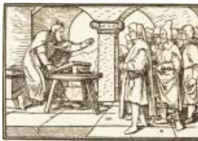
Hans Holbein ml.: Moše připomíná lidu, jak je třeba učit se Božím příkázáním (mezi 1523–1530).

v lidském napodobování Božích vlastností, ve snaze chovat se k ostatním tak, jak by se choval Hospodin.