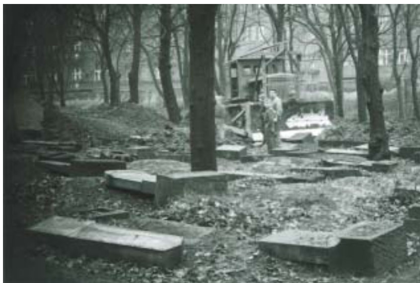
Devastace hřbitova, jak ji zachytila unikátní fotografie z r. 1961.

Další historie je ještě smutnější. Ačkoli se hřbitov dochoval poměrně v dobrém stavu, bylo koncem 50. let rozhodnuto o jeho zrušení. V roce 1960 byla zbořena vysoká obvodová zeď, náhrobky v jihovýchodní části byly povaleny a překryty zeminou a větší část pozemku byla přeměněna v park – Mahlerovy sady. Zachována zůstala pouze severní, nejstarší část hřbitova s nejceněnějšími náhrobky z období klasicismu a empíru. Daleko drastičtější důsledek měl zásah v le-