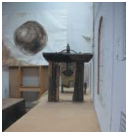
Aleš Veselý: Model projektu Tři brány ; měřítko 1:10.