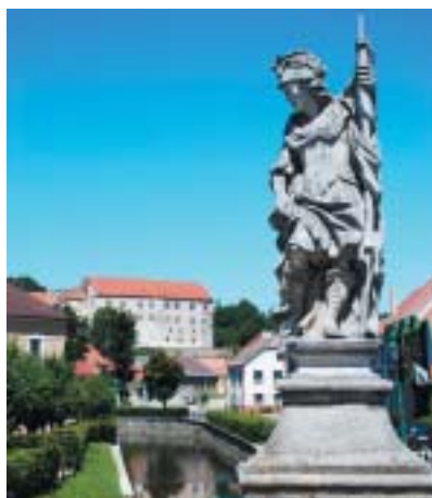
Zámek, pohled z mostu u radnice.

stavovského povstání zatčen a uvězněn na Špilberku, kde brzy nato zemřel. Panství s městečkem získal generál císařských vojsk Rombald Collalto, pocházející ze