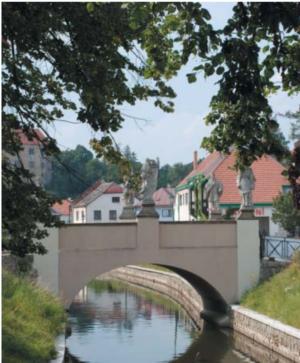
Brtnice u Jihlavy (k článku na str. 14–15).

VĚSTNÍK ŽIDOVSKÝCH NÁBOŽENSKÝCH OBCÍ V ČESKÝCH ZEMÍCH A NA SLOVENSKU