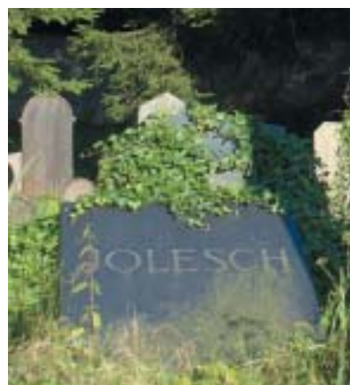
Jeden z náhrobků Joleschů na nejnovějším hřbitově.

Možná jsou na brtnickém hřbitově pouze příbuzní proslulé „Tate Jolesch“, která v knižní podobě a s podtitulem „Zánik evropské kultury v anekdotách“ okouzila už tolik čtenářů. Ale i tak je tady jméno Jolesch jako poukaz k naší společné rakousko-uherské minulosti a k jejímu židovskému (i ne-židovskému) občanstvu nějak zvláště v logice věcí i místa. V Brtnici se usídlila minulost způsobem, který se vymyká logice času a zapomínání. To, po čem se nám stýská a co se Torbergovi v jeho „knize stesku“ podařilo zachytit a uchovat, je tady v různé míře přítomno. Vnímavý návštěvník si to uvědomí ve chvíli, kdy zapomene na