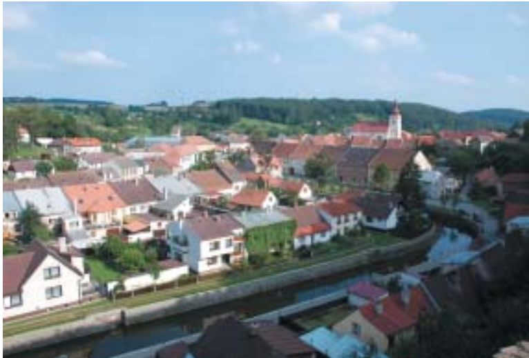
Brtnice, pohled od zámku.

nápis je z roku 1672), trvá cesta od „židovského mostu“ necelých patnáct minut. Má pěknou polohu na severní straně mezi silnicí a lesem a nachází se severovýchodně od města. Vzhledem k tomu, že v polovině 19. století byl už zcela naplněn, zřídila brtnická obec v bezprostřední