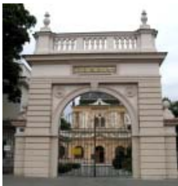
Brána Nového židovského hřbitova.

Hřbitovu dominuje budova obřadní síně, již postavil v novorenesančním slohu arch. B. Münzberger, další stavby nesou stopy módy o čtyřicet let pozdější: funkcionalisticky pojal dům správce hřbitova a urnový háj architekt L. Ehrmann. Hřbitov, který je zapsán na seznam chráněných kulturních památek, byl rozčleněn do hřbitovních polí, která byla postupně zaplňována, a tak nabízí nejen cestu po proudu času až k hrobům nejmladším, ale i výjimečnou přehlídku různých stylů a proměn vkusu v oblasti náhrobků a funérální plastiky. Náhrobky jsou často dílem vynikajících českých