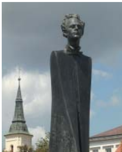
J. Koblasa, Gustav Mahler . Jihlava 2010.

ny na 500 000 Kč. A že mám tedy sdělit, kdo zajistí financování. Je to zvláštní věc: Výdaje na vybudování parku včetně uměleckých děl přišly na více než 42 milionů korun, ale na památník uvádějící jména zavražděných z období šoa peníze nezbyly. Park se přitom rozkládá na původně židovském pozemku, který Jihlava získala v důsledku totalitního barbar-