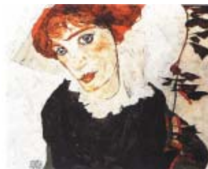
Egon Schiele: Portrét Wally , 1912.

skupina nechala vydat zatykač za údajně zločiny spáchané v Gaze. Dodatek by měl podobné situace značně zkomplikovat, především tím, že takovými případy by se měl zabývat výhradně korunní žalobce.