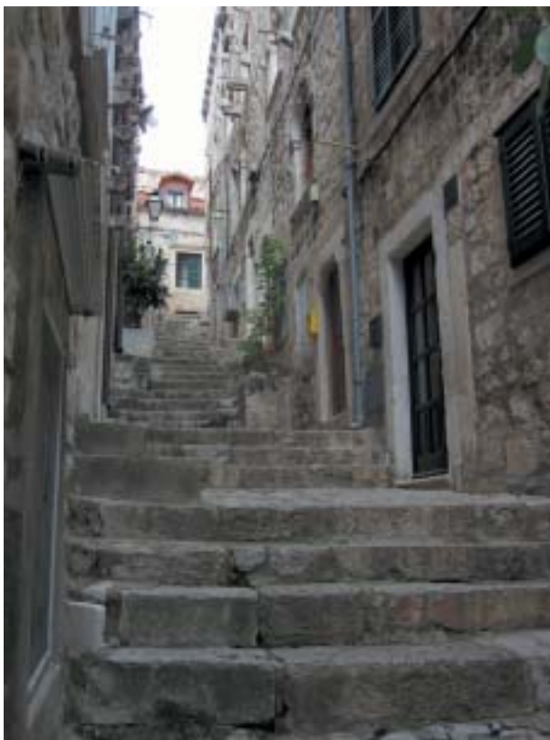
Ulice Žudioská.

Podle jedné z teorií vznikl Dubrovnik (italským jménem Ragusa) ve 12. století sloučením ostrovní osady Laus a pobřežní osady Dubrava, původně oddělených mořskou úžinou zhruba v místech dnešního městského korza Stradun. Novodobé archeologické průzkumy však existenci úžiny popírají a nabízejí teorii založení osady řeckými mořeplavci ještě před počátkem křesťanské éry. Politicky bylo město ve středověku pod střídavou ochranou či nadvládou byzantské říše a Srbska, od roku 1205 pak benátské republiky. Od poloviny 14. století byl Dubrovnik pod ochranou Uher coby samostatná městská republika a stal se významnou středomořskou námořní a obchodní mocností. Samostatným státem – městskou republikou pojmenovanou Res publica Ragusina, Republika Dubrovnik – byl až do Napoleonova obsazení Dalmácie v r. 1808.