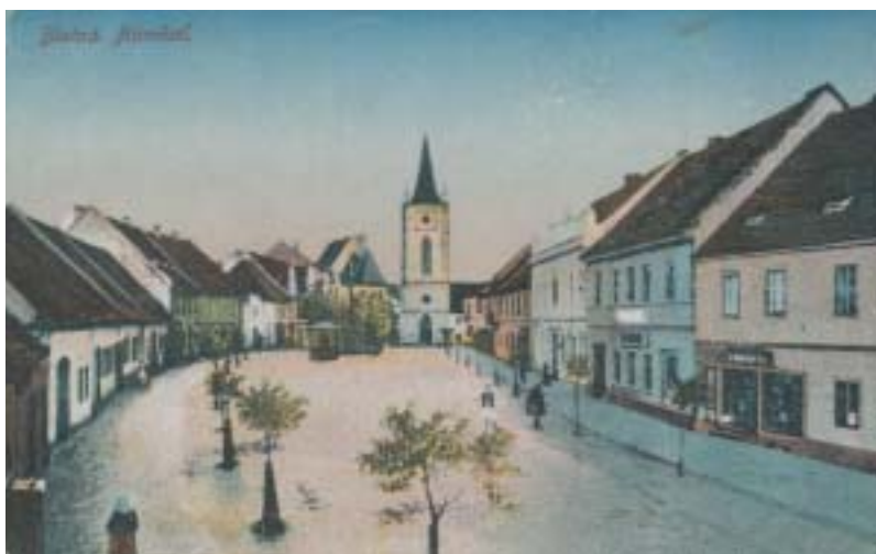
Náměstí v Blatné, dobová pohlednice.