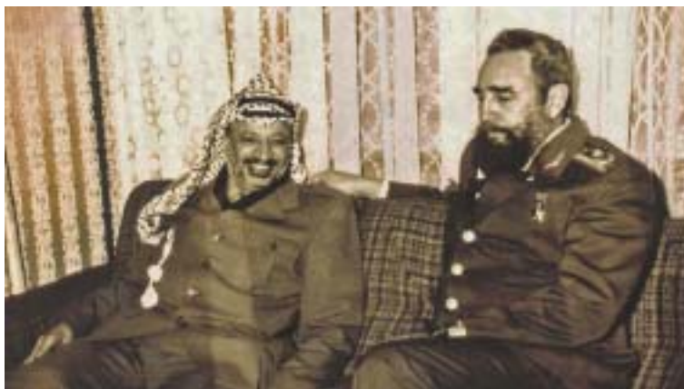
Jásir Arafat a Fidel Castro – přátelé a spojenci.

1959, revoluční vůdce vysvětlil, že osud obou států je podobný. Každý z nich se musí bránit nepříteli, který ho chce zničit: v případě Izraele je to arabský svět, v případě Kuby USA. Oficiální smutek, vyhlášený na Kubě v dubnu 1963 po úmrtí izraelského prezidenta Jicchaka Ben Cviho, vyvolal u arabských spojenců v čele s Ben Bellovým Alžírskem hněv a protesty,