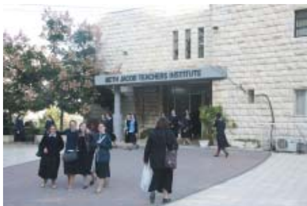
Učí se náboženství, matematiku, angličtinu...

Kromě základní středoškolské výuky a pedagogických předmětů nabízí škola