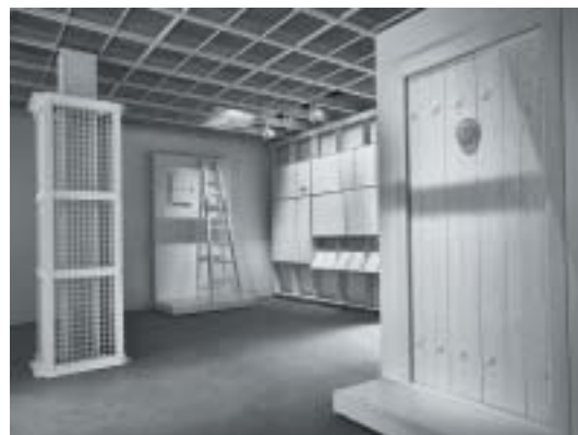
Síň svědectví s plynotěsnými dveřmi a okénkem vpravo.

kteří se rozprostírala Room of Evidence , tedy Komora (s poukazem na vyhlazování) či Síň (s poukazem na soudní síň) svědectví. Uprostřed ní stály repliky tří klíčových důkazů z procesu v životní velikosti: 1) Pletivový dutý sloup plynové komory, jenž se skládal ze tří částí: vnější