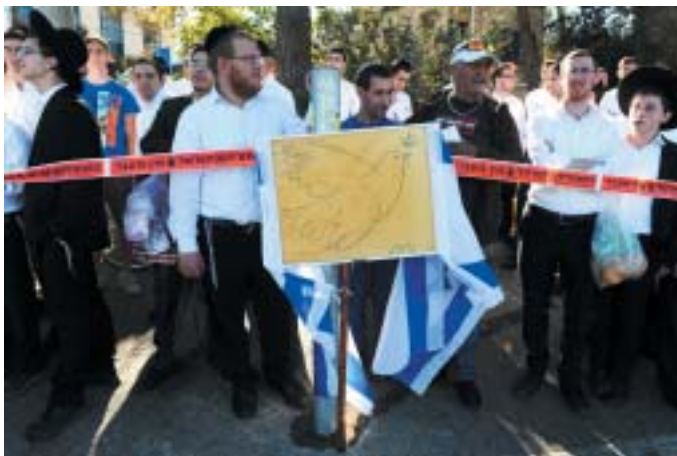
Jádrum konfliktu nejsou osady, nýbrž „palestinské odmítnutí uznat židovský stát a jeho právo na jakýkoli kus země západně od řeky Jordán“.

Izraelské vnímání shrnuje Dore Gold, bývalý ředitel ministerstva zahraničních věcí (a českým čtenářům známý jako autor knihy Boj o Jeruzalém ), na webu Jeruzalémského centra pro veřejné záležitosti. Připomíná, jak v roce 2011 tehdejší americké veto podobné rezoluci zdůvodňovala velvyslankyně Susan Riceová. Zprv: rezoluce by jen utvrdila