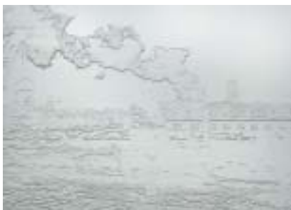
Sádrový reliéf osvětimského krematoria.

V krátkosti připomeňme, oč tenkrát šlo: popírač holokaustu, britský historik David Irving zažaloval roku 1996 u londýnského Nejvyššího soudu americkou historičku Deborah Lipstadvou za to, že ho ve své knize Popírání holocaustu. Silící útok na pravdu a paměť (č. 2001, 2006) označila za lháře a překrucovače historie. Vzhledem k tomu, že dle brit-