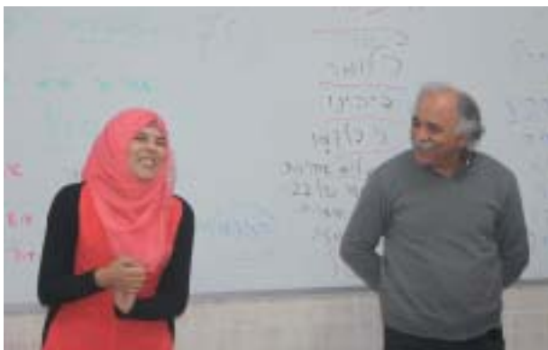
Hlavní je umět hebrejsky.