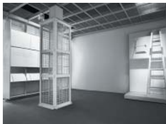
Síň svědectví se smrtícím pletivovým dutým sloupem vlevo.

(„ochranné“), pevné vnitřní, která procházela otvorem ve střeše krematoria, a pohyblivé části uprostřed s kalíškem. Kalíšek naplnil lékař SS stojící na střeše krematoria cyklonem B a spustil ho do duté vnitřní části válce v komoře. V teple vytvořeném natlačenými lidmi se uvolnil z krystalů cyklonu B kyanid a pletivem pronikal do komory a zabíjel. 2) Plynotěsné dvoře plynové komory s kulatým okénkem, které bylo zevnitř chráněno pletivem, aby ho vězni nerozbili. Podle zachovaných plánů krematoria II se tyto dveře původně otevíraly dovnitř do márníce, ale když se prostor přeměnil na ply-