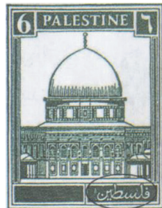
Originální a upravená známka.