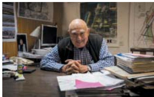
„Trochu dlouhá odpověď na vaši otázku, co?“