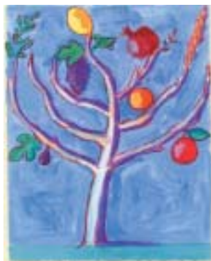
Mark Podwal: Sedm plodů země Izrael.

Arjemu stvořit? Prohlídka: Staronová synagoga. Jednotné vstupné 50 Kč.