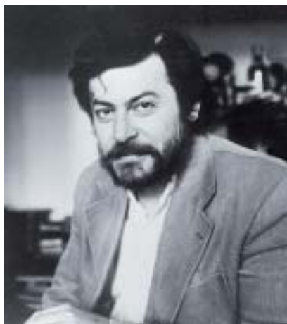
Karol Sidon, 70. léta.

Rozhovor s rabínem Karolem Sidonem o Chartě 77