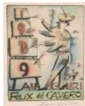
Novoročenka na rok 1939, kolorovaný lept.

Pod titulem Symbolismus v grafickém díle Michela Fingestena se od 12. ledna do 7. dubna koná v madridském sídle Centra Sefarad-Israel rozsáhlá výstava tohoto grafika a malíře, rodáka z českého Slezska, který před druhou světovou válkou patřil k nejznámějším berlínským umělcům a koncem 20. let pobýval ve Španělsku, kde se nechal inspirovat tamní krajinou. Po nástupu nacistů chtěl Fingesten emigrovat do