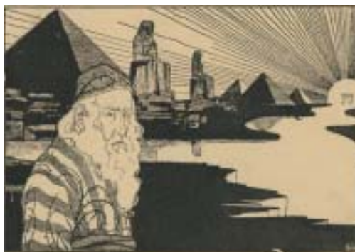
Kresba: Moses Efraim Lilien.

„ Já, Hospodin, dělám to vše. “ Ale proč by mělo Bohu záležet na tom, zda si nějaký Egyptaně nebo lidé vůbec jsou vě-