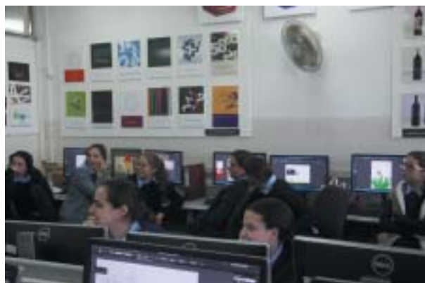
...a také účetnictví a počítačové programy (i pro vyšívání).

Ale možná, že než se provdají, poměry mezi charedim se změní. O to alespoň usiluje nedaleká průkopnická instituce, a sice úřad pro nezaměstnané ultraortodoxní muže, Kivun Centre, podporovaný nadací Kemach Foundation. Zatímco nyní tvoří charedim zhruba 10 procent obyvatel Izraele, očekává se, že v roce 2059 to bude již 27 procent. Zhruba polo-