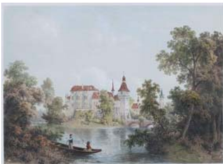
August Carl Haun: Zámek v Blatné, litografie, 1860.

Zikmund Drucker (1856–1943) patřil bezesporu nejen mezi úspěšné a solidní blatenské obchodníky textilem, ale i mezi první sportovní rybáře v našem městě. Totéž, v práci i rybaření, platilo