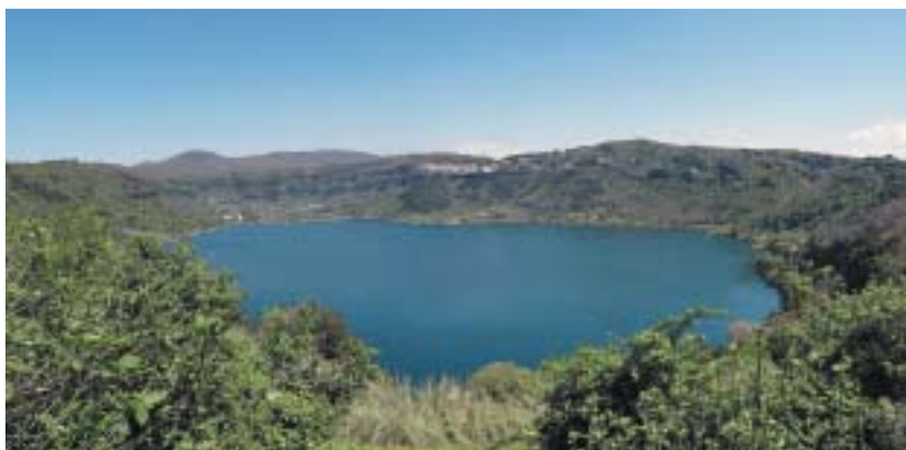
Lago di Nemi. Foto archiv.

Palestrina stojí na základech starobylého Praeneste, založeného před téměř třemi tisíci lety Etrusky, města, kde stál nesmírně rozlehlý chrám bohyně Fortuny, jehož pozůstatky jako kosti pravěkého obra prostupují celým historickým centrem, ležícím na řadě teras v příkrém svahu. Tyto terasy jsou většinou autenticky zachovalé součásti původního chrámu, jehož velikost si sotva dokážeme představit. Na nejvyšší z nich, kde bývala horní část svatyně, dnes stojí palác Colonna-Barberini z 11. století, do značné míry