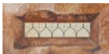
Ženský pohled na věc.

Táta tam byl dvakrát, v roce 1967 a 1968. V tom osmašedesátém měsíci maloval v Janově, namaloval deset obrazů, které si tam nechali, a tím jsme měli zaplacený pobyt. Objeli jsme všechna ta krásná města v Toskánsku, bylo to úžasný. Když pak v srpnu přijeli Rusové, byli rodiče v Německu, kde