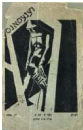
Návrh obálky časopisu Renans .