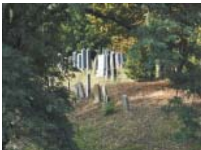
Pohled do židovského hřbitova v Mirovicích.

Máloco je přírodou tak důmyslně stvořeno k tomu, aby to člověk, který nepochází z přímo odtamtud, tak snadno a beznadějně zaměňoval, jako jihočeské Mirovice