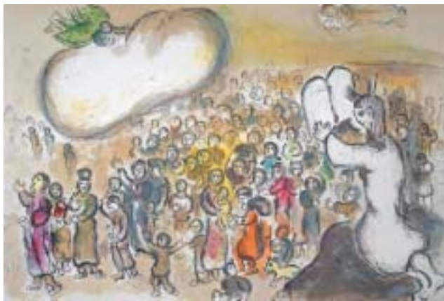
Zjevení na Sinaji. Kresba Marc Chagall.

jednotněm jako „o tom, kdo atd.“ – tedy ne o celé generaci, nýbrž o jednotlivcích.