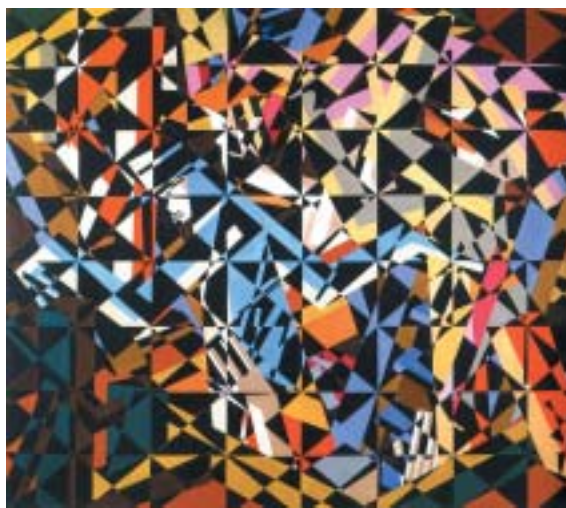
V nákladovém prostoru, 1913–1914.

Po odchodu z akademie se kurátorsky podílel na výstavě Umění dvacátého století: Přehled moderních proudů , kde měl, spolu se sochařem Jacobem Epsteinem, na starosti „židovskou sekci“. V rámci přípravy expozice odjeli do Paříže a setkali se s řadou umělců, mj. s Modiglianem či Soutinem. Pokusili se představit židovskou avantgardu, jak britskou (hlavně své vrstevníky z Whitechapelu), tak právě francouzskou – kromě Modiglianiho pozvali Julese Pascina či Moise Kislinga. Z vlastních děl vystavoval obraz, jenž vzbudil velkou pozornost. Pomenoval ho In the Hold (český název by zněl nepoeticky – V nákladovém prostoru), pravděpodobně jako narážku na cestu, již podnikli jeho rodiče, prchající z Polska do Anglie. Obraz roztržštěný na řadu barevných polí vyjadřuje zmatek čerstvě příchozích imigrantů a současně jejich naděje a energii nachystanou pro nový život. Jeho jméno se definitivně stalo synonymem pro britský kubismus.