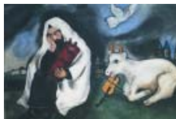
Jom kipur, kresba Marc Chagall.

Kabalat šabat každý pátek od 18.30 hodin.