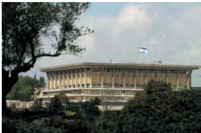
V praktickém životě se zákon asi moc neprojeví.

Tady jsme u prvního emotivnějšího bodu. Zákon výslovně říká, že právo na národní sebeurčení ve Státu Izrael mají pouze Židé. Jinými slovy, že Židé v něm mají skupinové právo na státnost, kdežto ostatní občané mají jen svá individuální práva. Poněkud to připomíná ustanovení Československa před 100 lety, kdy „národ československý“ požíval skupi-