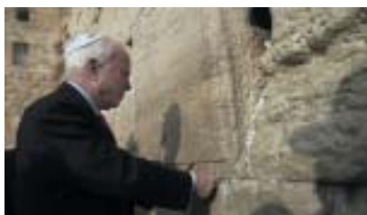
John McCain v Jeruzalémě.

mi válečnými zajatci, odmítl, i když ho drželi v příšerných podmínkách.