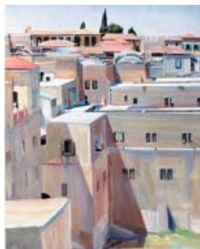
Ezechiášův rybník, 1925.