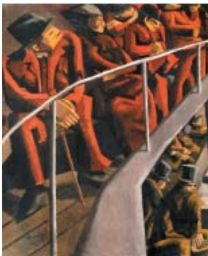
Divadlo v ghettu, 1920.

Ihned poté, co Británie vstoupila do války, se D. Bomberg dobrovolně přihlásil do boje, byl však odmítnut – kvůli cize znějícímu jménu a vousům. Povolali ho až v létě 1916, kdy měl za sebou první válečný rok téměř bez práce, ale také svatbu, a poslali ho na frontu do Francie. V zákopech nedokázal