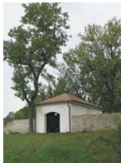
Márnice a současně vstup na mirotický hřbitov.

Můžeme si tady, ve stínu velkého dubu, který je spolu se hřbitovem památkově chráněný, odpočinout, protože už nemáme kam zabloudit. Za ohradní zdi dole teče řeka, naproti za ní vystupuje věž kostela a střechy domů, paprsky světla se odrážejí od bílých kamenů a už není kam spěchat. Skončila cesta z Mirovic do Mirotic. Nebo