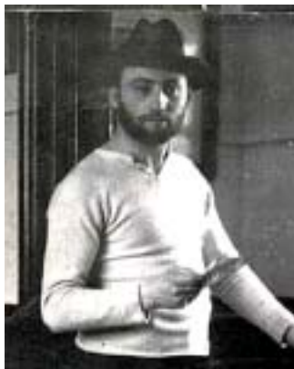
David Bomberg.

Britský židovský malíř David Bomberg (1890–1957) se během života neprosлавil. Po nadějných začátcích ve dvacátých letech zůstal opomíjen, byl pokládán za nesrozumitelného a podivného malíře, nedostával mnoho zakázek, a nakonec se živil spíše pedagogickou činností než vlastní tvorbou. Jeho dílo – v souvislosti s činností celé umělecké skupiny tzv. Whitechapel Boys, židovských malířů a sochařů, kteří vyrůstali nebo chodili do škol v této čtvrti ve východním Londýně – oceňuje více až současné publikum a kritická