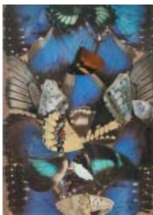
Koláž z motýlích křídel, detail.

Dělám koláže z motýlů. Do skleníku Fata Morgana v Botanické zahradě v Troji každý rok přivezou z Anglie motýlí vajíčka, vylíhnou se tam a jsou z nich opravdu překrásní motýli. Když jsem to viděla, zeptala jsem se, co pak dělají s mrtvými motýly. Odpověděli, že je zametou a vyhodí. Poprosila jsem je, aby mi křídla nechali, a používám je na koláže. Křídla nebo jejich útržky si roztřídím, vytvořím si nějakou rámcovou představu a pak je sestavuji a vkládám mezi dvě skla. Přitom se to trochu hne, takže výsledný tvar úplně neovlivním,