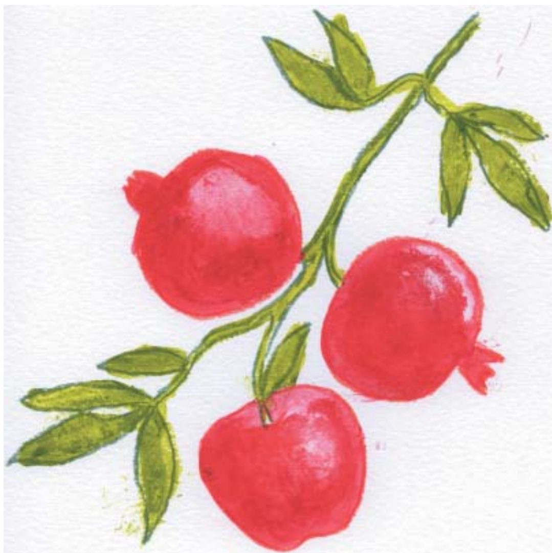
Novoroční kresba Marka Podwala.

VĚSTNÍK ŽIDOVSKÝCH NÁBOŽENSKÝCH OBCÍ V ČESKÝCH ZEMÍCH A NA SLOVENSKU