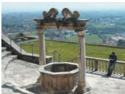
Campagna di Roma, pohled od paláce Colonna, Palestrina.

papežského státu s Římem jako správním centrem má, stejně jako Toskánsko, Kampánie, Benátsko, ale vlastně i všechna ostatní historická území, z nichž se dnešní Itálie skládá, svůj charakter a osobitost. V užším slova je římským venkovem Campagna di Roma, rozsáhlá, mírně zvlněná plocha obklopující město ze všech stran, ohraničená na jihu mořem a na pevnině tam, kde se terén začíná zvedat do kopců a pohoří. Mnohým z nich daly jména kmeny a malé národy, jež tam kdysi žily a které Řím a čas pohltily nebo převedly na společného jmenovatele, takže po nich zůstaly jen míst-