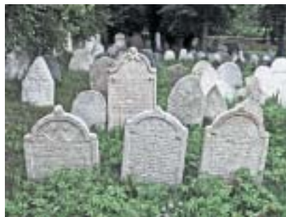
Skupina náhrobních kamenů na hřbitově v Mirovicích.

Když projdeme městečko a vydáme se po polní cestě směrem ke vsi Myslín, dojdeme asi po čtvrt hodině chůze k mirovickému židovskému hřbitovu, založenému ve svahu nad říčkou Skalicí na počátku 18. století. Dochovalo se na něm přes 200 náhrobních kamenů, od barokních až po novodobé z první poloviny 20. století. Pochováni jsou tu Židé z Mirovic i okolních obcí a o místo jejich posledního odpočinku je celkem dobře pečováno.