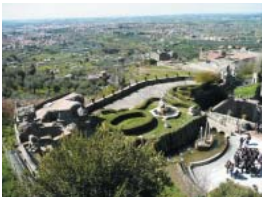
Campagna di Roma, pohled od Tivoli.

Pro většinu lidí je tohle malé město s přibližně dvaceti tisíci obyvateli, spojené se jménem Giovanniho Pierluigiho da Palestriny, velkého skladatele a reformátora církevní hudby 16. století, pojmem hudebním. Ale dnešní