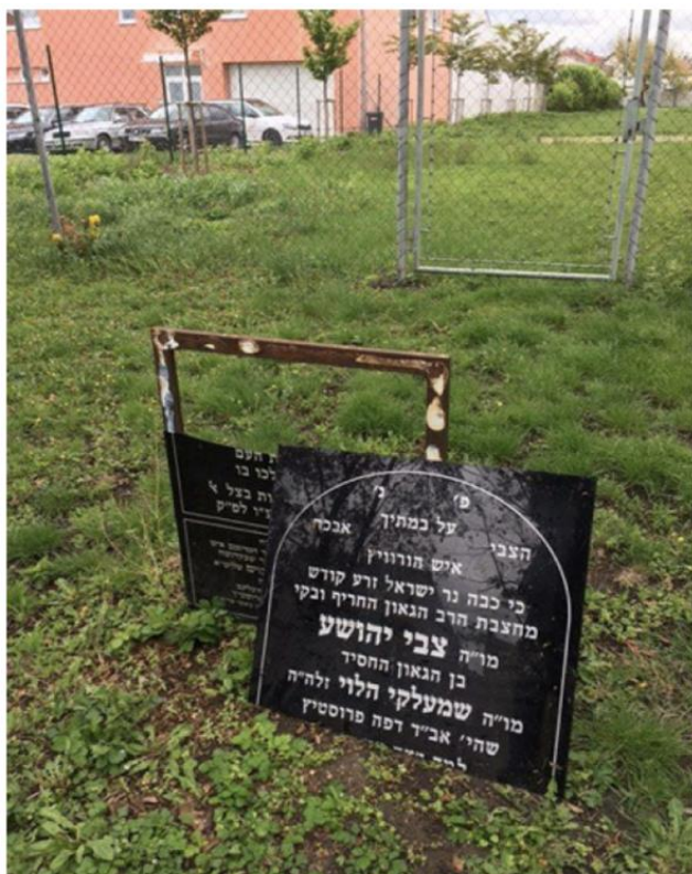
Znesvěcení památníku v dubnu 2017