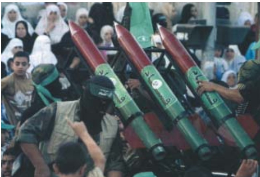
Ostřelování izraelského území z pásma Gazy raketami je realitou.

Palestinci tvrdí, že oběti zabil izraelský granát ráže 155 mm. Izraelské vyšetřování (mimo jiné tři zraněných se střepinami v tělech) zjistilo, že střepiny pocházely z bomby, ne z granátu, že kráter vznikl výbuchem zdola, ne dopadem shora a že Hamás pláž zaminoval na ochranu před izraelskými komandami – že tedy šlo o výbuch miny Hamásu. Generální tajemník OSN Kofi Annan ale podle svých slov nevěří tomu, že by Palestinci zaminovali veřejnou pláž, a žádá nezávislé vyšetření. Když pak telefonoval Olmertovi, ten mu odpověděl: „Proč jste mi nezavolal a nežádal vyšetření, když na Izrael dopadlo třicet raket?“ Ha'arec vidí vyznění skepticky: „V minulosti Izrael občas uspěl ve vyvracení přiřknuté odpovědnosti, například v roce 2002 za údajný masakr Palestinců v Džanínú. Ale tentokrát je to již zřejmě prohrané.“