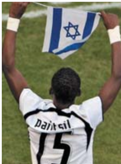
Ghanský fotbalista s izraelskou vlajkou.