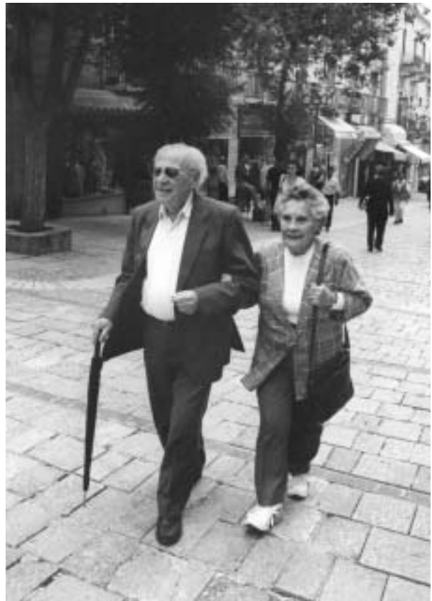
Jeruzalém, 2001.

Viktor Fischl psal až do konce života, přestože ve stáří přestával vidět. Žil a zemřel v Jeruzalémě.