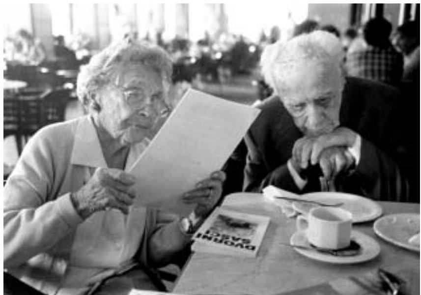
Praha, kavárna Slavia, 2003.