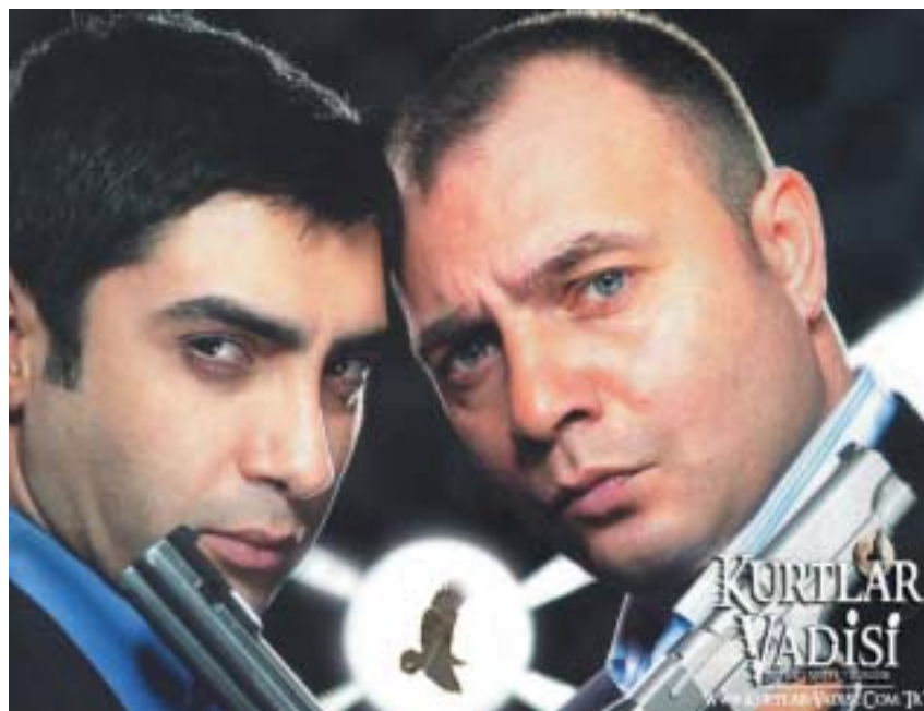
Turecký hrdina Polat Alemdar a americký zloduch Sam Marshall – hlavní postavy filmu Údolí vlků.

Při pohledu na tento kolosální kýč jsem myslel na Osvětím a na Evropu. A řekl jsem si: ne, Evropa se nezrodila v Osvětím. Osvětím není událost, jež odděluje Evropu od ní samotné a nutí ji definovat se nikoli svou výjimečností, svou identitou, ale komplexností, univerzalismem a kosmopolitismem svých norem a hodnot. Osvětím neodtrhla Evropu od vlastní minulosti a historických kořenů. Osvětím se udála Evropě v Evropě. Evropa je traumatizovaná. Toto trauma ale není univerzální.