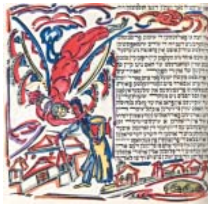
El Lissickij, Siches chulin (Světské povídky), Moskva 1917.

Užití formy svitku se neomezuje jen na tex- ty náboženské povahy. K této formě se ob- rátil například i avantgardní ruský židovský výtvarník El Lissickij (1890–1941). Roku 1917 vyšla v Moskvě kniha Siches chulin (Světské povídky), poetický záznam legen- dy z pera jidiš básníka a divadelního režisé- ra Mošeho Broderzona (1890–1956). Malá část nákladu (ŽMP vlastní jeden takový výtisk) dostala podobu svitku a Lissickij ji ručně koloroval. Ilustrace protkávají text psaný profesionálním soferem „písmem asyrským“, s jehož krásou chce malíř svou ornamentální kresbou splynout, a dosáhnout tak dokonalého souladu s obsahem i stylem vyprávění. Děj je částečně situ- ván do pražského ghetta, Lissickij ho ale