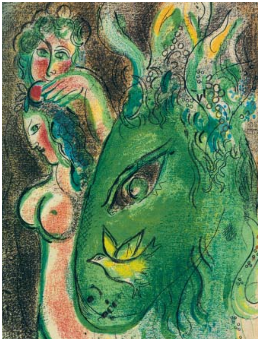
MARC CHAGALL: RÁJ – ZELENÝ OSEL, 1960.

VĚSTNÍK ŽIDOVSKÝCH NÁBOŽENSKÝCH OBCÍ V ČESKÝCH ZEMÍCH A NA SLOVENSKU