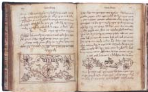
Rabi Jom Tov Lipmann Heller. Megilat Ejva (Svitek protivenství), Praha 1742-43.

Kromě Tóry má být podle Talmudu v synagoze z pergamenu svitku předčítána pouze Kniha Ester ( megilat Ester , dosl. „svitek Ester“) o svátku Purim. Fyzická podoba několika dalších biblických knih čtených v synagoze závisí v moderní době spíše na místní zvyklosti. (Sbírka ŽMP tak čítá malý počet svitků biblických knih Píseň písní, Rút a Kazatel a tzv. haftarot, tj. vybraných pasáží z prorockých knih Bible.) Rozměrné svitky bývají navi-