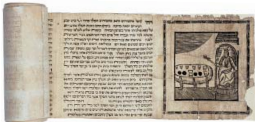
Svitek Ester, Praha(?), 2. polovina 18. století, knihtisk a dřevořez na papíru.

Za druhé světové války bylo v tehdejším Ústředním židovském muzeu v Praze shromážděno necelých 1800 svitků Tóry z českých a moravských synagog. Část byla po válce vrácena obnoveným kongregacím, většina, téměř 1600 svitků, byla v roce 1964 československými úřady prodána soukromému kupci do Anglie, kde o jejich „druhý život“ pečuje speciálně založený Memorial Scrolls Trust se sídlem v Londýně. Odtud jsou svitky jako památníky obětí šoa z českých zemí zapůjčovány do židovských institucí po celém světě.