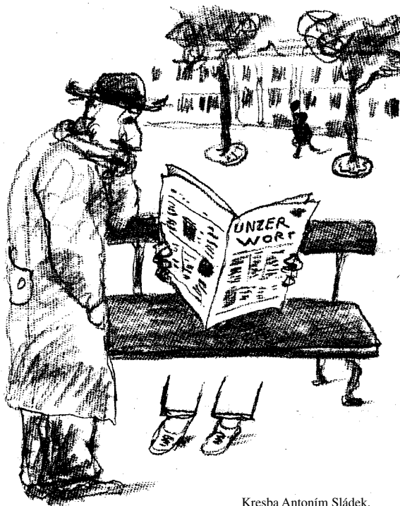
Kresba Antonín Sládek.

Max udělal vyhýbavé gesto a odcházel, s novinami vykukujícími z kapsy běžového kabátu. Trotzkind ho dohonil a chytil za rukáv: