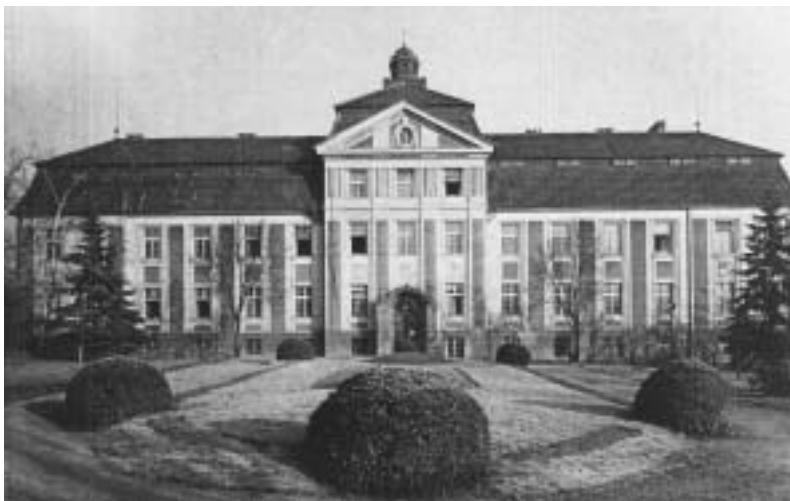
Budova Hagiboru na začátku 20. století.

Thorsche, Seligmana Elboga a nadace Marka a Anny Bondioových, založené MUDr. Šalamounem Bondim. V mezipatře budovy byla umístěna kancelář, společná jídelna, modlitebna pro 60 až 70 osob, v patrech lékařská ordinace, pokoj sester a koupelny, v suterénu prádelny, kotelna,