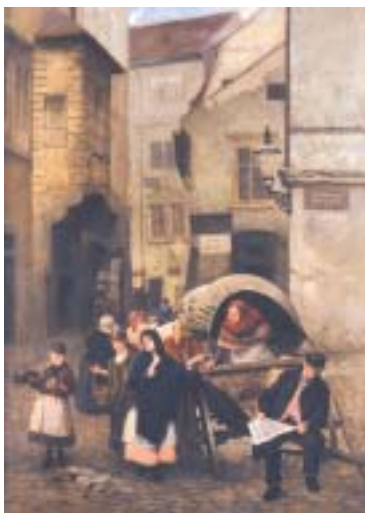
Alexander Jakesch: Rozlité mléko, olej, 1889. Z výstavy Pražské ghetto v obrazech v Muzeu HMP.