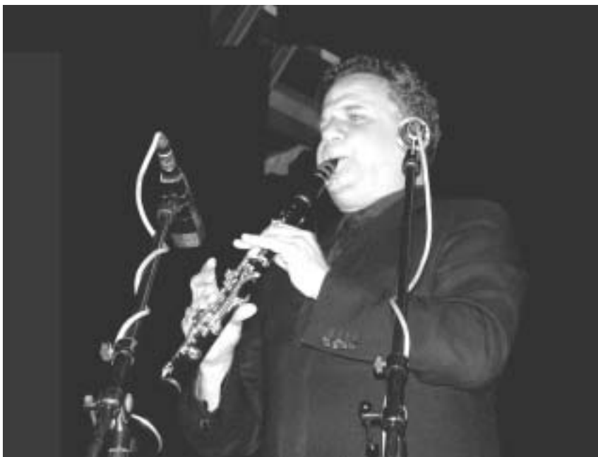
David Krakauer v Praze.

hudebníka. Když mi bylo přes dvacet, tak jsem od jazzu odešel a věnoval se jenom klasice. Veškerou energii jsem soustředil na klasiku, hrál jsem komorní hudbu, pak jsem se vypracoval jako sólista. Takže když jsem se dostal ke klezmeru – to bylo asi osm nebo devět let poté, co jsem přestal hrát jazz – tak jsem si najednou uvědomil, že tenhle typ muziky prostě nemůžu jen tak opustit, je to pro mě vašeň, improvizovat, vytvářet. Ale kulturně jsem si připadal s jazzem jak ryba na suchu, nějak jsem pořád nevěděl, jestli je to fakt moje kultura, připadal jsem si mimo. A navíc jsem nesmírně uctíval ty jazzový velikány, jako byli Sidney Bechet, Coleman Hawkins nebo John Coltrane, a říkal jsem si, copak já se jim někdy vyrovnám? Copak bych já uměl něco tak originálního jako oni?