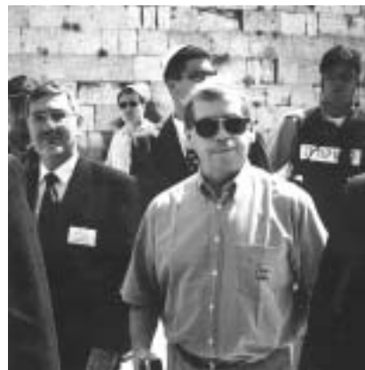
Václav Havel u Zdi nářků. Foto Karel Cudlín, 1996.

Toto přátelské gesto připomíná Izraelcům, kteří si někdy téměř zoufají nad instinktivně protiizraelskými postoji Evrop-