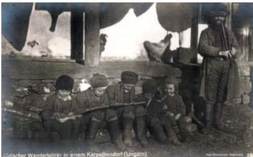
Židovský putující učitel ve vesnici v Karpatech, pohlednice, kolem 1920.

Zatímco na školskou reformu v Uhrách a Haliči stát brzy rezignoval, v Čechách a na Moravě byla školská reforma přes počáteční odpor úspěšná a poznamenala hlavní směr židovské asimilace až do konce 19. století. Židovské normální školy otevřeně nabízely němčinu jako hlavní prostředek dosažení rovnoprávnosti a společenského vzestupu. Ačkoli během 2. poloviny 19. století vznikaly četné nové veřejné školy české i německé, židovské normální školy i nadále přetrvávaly, protože Židé nechtěli posílat své děti do škol, kde působil silný vliv oficiálního katolicismu. K nejvíce navštěvovaným patřily ústavy v Plzni, Berouně, Kolíně, Mladé Boleslavi, Brandýse, Libochovicích, Hořicích, Náchodě, Táboře, Benešově, Voticích, Klatovech, Novém Bydžově, Jičíně, Humpolci, Horažďovicích, Strakonících a Táboře. V oblastech s převahou německy mluvících obyvatel se většina židovských škol přeměnila v německé školy veřejné, jejichž konfesionální charakter takřka vymizel a byl nahrazen oddělenou výukou náboženství. V roce 1896 jich tu bylo pouze 6, zatímco v krajích převážně českých 84. Tento fakt se stal terčem kritiky českožidovské veřejnosti: většina škol zanikla během pětiletého jazykového nařízení koncem 90. let, a zejména za hilsneriády, kdy se tyto ústavy stávaly prvním terčem národnostních sporů a výtržností. ARNO PAŘÍK