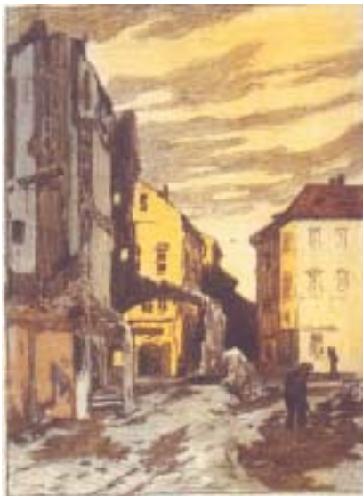
Emil Orlik, Finis, ghetto.

Šestadvacátého září tomu bylo přesně sto let, co se v Praze sešla ustavující schůze Spolku k založení a vydržování židovského muzea v Praze. To výročí mohl pominout jen naprostý ignorant: rok 2006 byl ozdoben skoro nepřetržitým pásem pořadů, výstav, koncertů, přednášek apod., které se více či méně vztahovaly k pozoruhodného