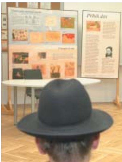
Výstava ve Vzdělávacím centru.

Kontakty: VKC Brno, třída Kapitána Jaroše 3, 602 00 Brno, telefon: 544 509 651, www.zob.cz, brno@jewishmuseum.cz, www.jewishmuseum.cz; objednávky do mikve přes e-mail: rabinat@zob.cz.