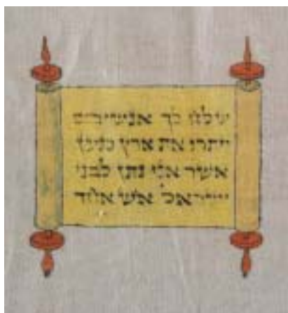
Detail z povijanu na Tóru, Čechy.