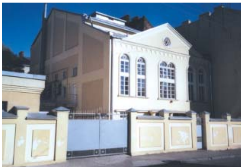
Cori Gilod je jediná funkční synagoga ve Lvově.

Existovaly zde dvě synagogy: starší, z roku 1582 v renesančním stylu, zvaná Zlatá růže, v sousedství pak Velká městská synagoga z let 1799–1801. Oba chrámy zničili nacisté, ze Zlaté růže stojí zbytky severní stěny.