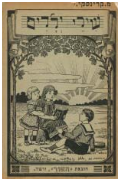
M. Krinsky: Širej jeladim (Pisně dětí), Varšava, 1910.

od učení zdržovány jinými povinnostmi. Počet žáků ve třídě nemá přesahovat 25 osob, k většímu počtu dětí musí být přítomný výpomocný učitel, při počtu nad 40 musí být učitelé dva. Máme-li volit mezi dvěma učiteli, z nichž jeden vyučuje více a druhý méně, ale důkladněji, dejme přednost tomu druhému. Chce-li někdo otevřít školu, nemá se mu v tom bránit, i kdyby byl již v sousedství jiný učitel. Podle této