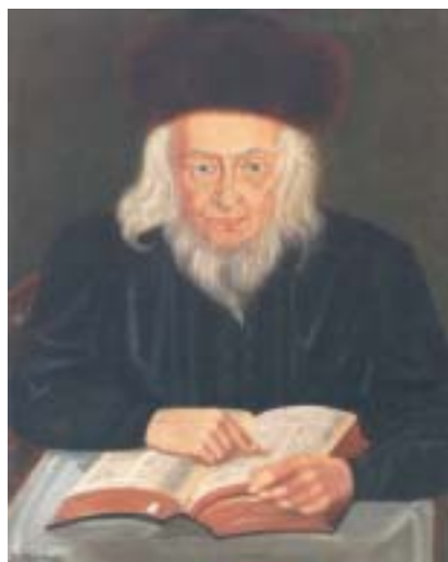
Josef Bindeles, Portrét rabína Efraima Löwa Katze Tewelese.

Jádrum publikace je přehledný katalog sbírkových předmětů ŽM v Praze z let 1906–1940: jde o soupis a stručné charakteristiky asi 760 předmětů; asi pětina z nich je navíc doplněna fotografiemi, odborným komentářem a vřazením do kontextu dnešního sbírkového fondu muzea. Fotografie jsou vybírány tak, aby si čtenář mohl vybavit celou šíři sbírkového fondu. Zdůrazňuje se tak instruktivní, vzdělávací funkce této publikace, která u nás stále ještě převažuje nad funkcí základní, jíž je u katalogu odborný záznam, popis. Této funkci slouží dílo velmi dobře (jde o první soupis svého druhu), kromě toho však – jak je tomu často v podobných případech – doplňuje i tento katalog obsažnější historické a odborné studie, které snad někdy vzniknou. Proto budou čtenáři katalogu jistě postrádat výčet základní literatury, který by jim pomohl k další orientaci. To je asi jediná podstatnější výtka autorce úvodních textů, kterou jí může laický čtenář adresovat. Jinak s ní bude po prohlídce katalogu jistě souhlasit, že sbírka v ŽM vznikla „Bestii navzdory – poprvé když se jejím prostřednictvím podařilo zachránit alespoň některé památky po řádění bestie v rámci asanace pražského Josefova, podruhé, když se hrála důležitou roli v úvahách o vytvoření Židovského ústředního muzea v Praze v období druhé světové vál-