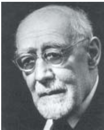
Rabín Leo Baeck.

Před 125 lety , 16. 11. 1881 , se v Malešově narodil HUGO MEISL . Pracoval jako bankovní úředník, jeho životním zájmem však byl fotbal. Byl hráčem a funkcionářem Prvního vídeňského fotbalového klubu od jeho založení (1904). Patřil k vedoucím představitelům rakouského fotbalu a dlouhou dobu vedl národní mužstvo. Rozhodoval také řadu mezinárodních zápasů, byl činný jako sportovní žurnalista. Zemřel ve Vídni 17. 2. 1937.