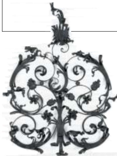
Mříž z Cikánovy synagogy.

zjistilo, že před rokem 1948 bylo místo používáno jako muslimský hřbitov, a že se tedy v půdě nacházejí lidské ostatky. V současné době je stavba muzea zastavena: řeší se žaloba, kterou podaly společnost Al-Aksá a Izraelské islámské hnutí. Zatím odmítají kompromis, který navrhlo Wiesenthalovo centrum – přesunout hroby a ostatky, vytvořit památník připomínající bývalý hřbitov a zrestaurovat náhrobky, které mohou na parcele zůstat.