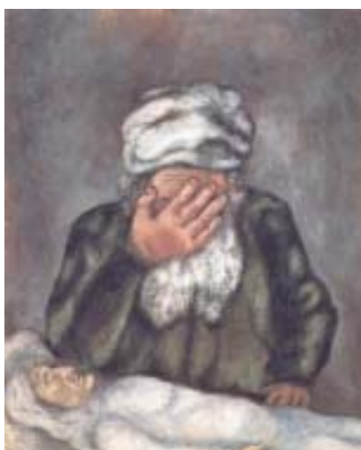
Marc Chagall, Abraham oplakává Sáru, kvaš, 1931.

bydlícím ve stanech.“ Vyvozuje z něj velmi závažné důsledky.