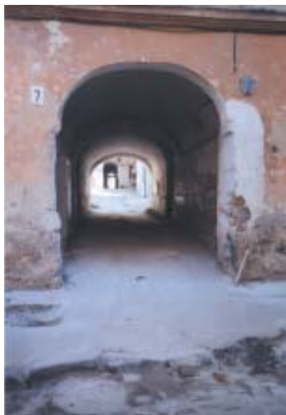
Průchody do dvorů ve Starojevrejské.

až čtyřpodlažní domy se příliš neliší od ostatní městské zástavby, jen u některých vstupních veřejí spatříme mezuzu, případně průchody do vnitřních dvorů. Kromě obytných domů bychom zde dřív též našli židovský špitál, vězení, rituální lázeň, náboženskou studovnu a prodejní kvelby.