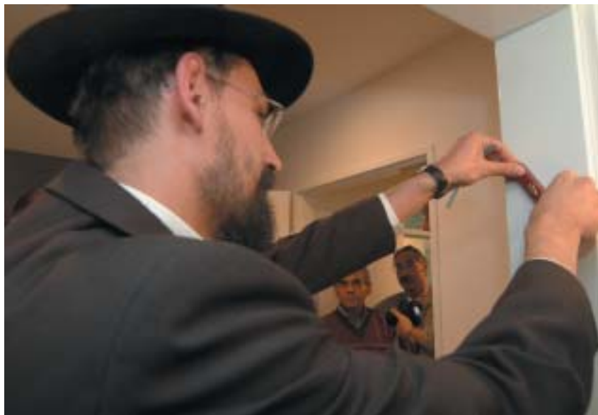
Chanukat habajit – připevnění mezuzy.

Během dílny nazvané „Hanin kuffík“ (podle knihy K. Levinové o pátrání po osudu dívky, která zahynula během šoa) děti na základě vlastního pátrání v dokumentech obsažených v archivní krabici rekonstruují osudy konkrétních osob za protektorátu.