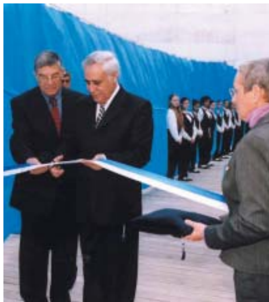
Moše Kacav otvírá Muzeum holocaustu v Jeruzalémě, 2005.