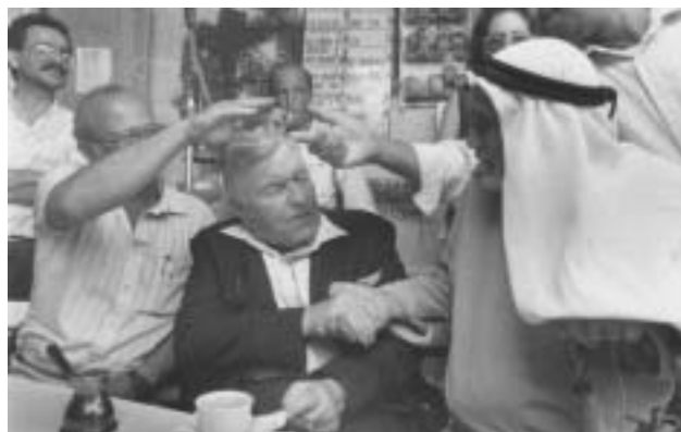
Teddy Kollek mezi jeruzalémskými přáteli.

Po válce shání zbraně a peníze pro Haganu. Uspěje u irských dokařů v New Yorku, kteří v Haganě spatřují „soudruhy ve zbraní proti Britům“. V Mexiku získá šek na milion dolarů, tehdy nesmírnou částku. Za