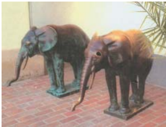
Zraněného slona vydal památkový ústav bez problémů.

Velmi složitě, protože musíme projít spoustu různých materiálů. Pátráme v archivních fondech, především v Národním archivu v Praze, v Archivu Ministerstva zahraničních věcí ČR, v Archivu Ministerstva vnitra ČR, v Archivu hl. m. Prahy a dalších domácích archivech. Věnujeme se také výzkumu v zahraničních archivech. Informace, které zjistíme, průběžně ukládáme do naší interní databáze. Vzhledem k nutnosti orientovat se ve velkém množství materiálů vypracováváme k do-