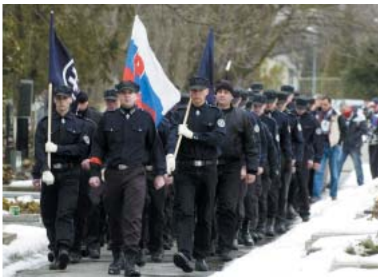
Martinský hřbitov 13. 3. 2005 v den 66. výročia vzniku Slovenského štátu.

A tu sme pri koreni udalostí, ktoré svojou absurdnosťou vyrážajú dych. SNS navrhla na post predsedu správnej rady ÚPN viacerých kandidátov. Charakterizovala ich príslušnosť k „Zväzu protikomunistického odboja“. Táto organizácia chápe pojem protikomunistický odboj trochu svojrázne. Priamo povedané, členov Hlinkovej gardy, Pohotovostných oddielov HG a sympati-