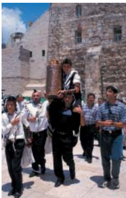
Ilustrační foto Karel Cudlín, 2006.

a jsou mezi nimi lidé ochotní pomáhat jako Jitro.