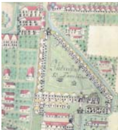
Židovská čtvrť v plánu města J. Zimfusse 1750–77.

To nejzajímavější zjištění jsem si nechal na konec. Ve větších židovských čtvrtích městského typu s vysokou hustotou zástavby domovních bloků v úzkých uličkách existovaly u nás v 18. a 19. století kromě vnějších komunikací podél front domů ještě vnitřní veřejné průchody napříč domy. Bylo tomu tak i v Polné, kde průchod fungoval až ve 20. domech (dnes existuje jen průjezd obecním domem, ostatní průchody jsou veřejnosti nepřístupné). Polná má navíc naprostý unikát: boční propojení řad domů v úrovni patra. Realizovalo se dveřními prostupy ve štítových zdech poblíž průčelí do Karlova náměstí, případný výškový rozdíl podlah – domy stojí na mírném svahu – upravoval schod. Zmíněné prostupy jsou fyzicky zdokumentovány zatím na čtyřech místech. Ten-