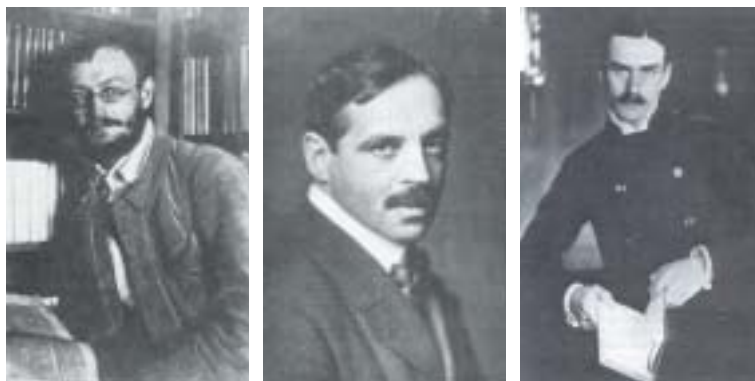
Kmenoví autoři S. Fischer Verlag: Hermann Hesse, Jakob Wassermann a Thomas Mann.