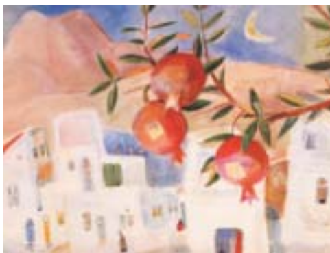
TU BIŠVAT SAMEACH (3. 2. 2007). Kresba Nahum Gutman.