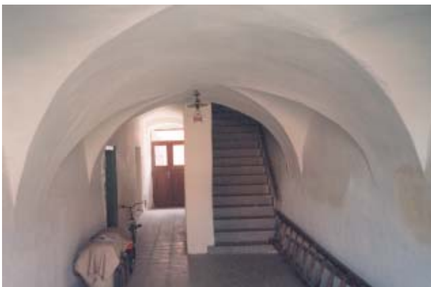
Klenutý mázhaus v domě čp. 550.

Na průčelí domů zahlédneme stylové dveře, kamenné ostění, fragment štukové výzdoby fasády, kruhové terakotové okénko k větrání půd, balkon na kamenných krakorcích či kamenné korytko u okapních svodů. Po zhoubném požáru v roce 1863 nám však názornou představu o původním vzhledu zástavby ghetta poskytne už jen jediný dům (538): členěná pozdně barokní fasáda, na průčelí předstupuje rizalít s klenutým loubím. Rozdílný tvar oken a barvy