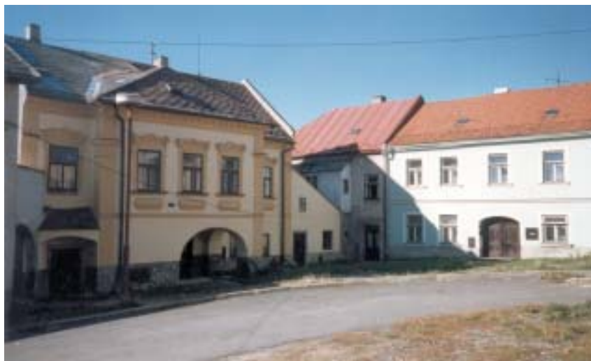
Celek ghetta se zachoval téměř neporušený.

ských obcí v ČR a Národního památkového ústavu Brno k dohodě, že by polenské ghetto mělo být samostatně prohlášeno alespoň za nemovitou kulturní památku, aby byla zajištěna jeho adekvátní právní ochrana. Prvním krokem na této cestě se