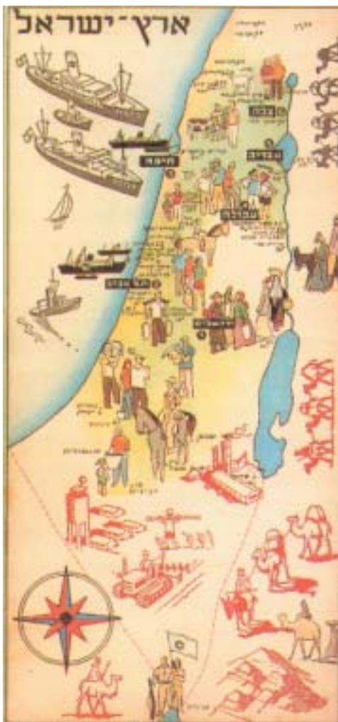
Školní mapa z r. 1967.

Vypadá to divně i v Česku, v zemi, kde už tři roky platí Lex Beneš, zákon deklarující, že „Edvard Beneš se zasloužil o stát“. Ale právě z českého pohledu se můžeme nad izraelskou novinkou hned dvakrát zamyslet. Představme si, že je čtyřicet let po válce a na českých školních (ne historických) mapách je znázorněna linie vyčleňující většinově ně-