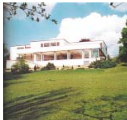
Vila má i velkou zahradu.

Pozornost veřejnosti k sobě vzácná památka přitáhla opět v průběhu minulého roku. Po schválení záměru města Brna investovat nemalou částku do nezbytné rekonstrukce bylo vypsáno výběrové řízení na projekt, které jeden uchazeč vyhrál – a druhý napadl soudně a vyhrál zase tam. A v tuto chvíli vstupuje na scénu dcera,