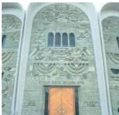
Jhuda synagoga v Tel Avivu.

zoval především americkou vládu a její představitele, tiskly některé jeho články i české komunistické listy (články kritizující země sovětského bloku samozřejmě ignorovaly).