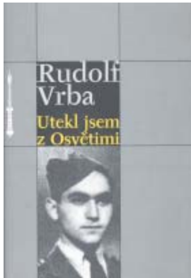
V tyto dny přichází na knihkupecké pulty druhé vydání strhující autobiografické prózy Rudolfa Vrby Utekl jsem z Osvětimi , kterou znovu vydalo nakladatelství Sefer.

Fakt, že utečenci sú ocenení rôznym vyznamenaním, súvisí len s formálnou stránkou veci. Podľa štatútu dostávajú iné vyznamenania osoby žijúce v zahraničí a iné sú určené pre domácich laureátov.