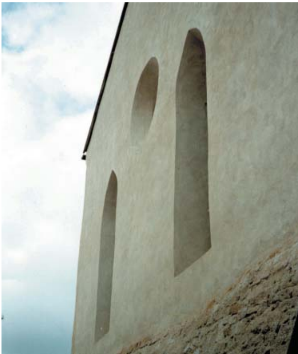
Synagoga v ghettu v Polné – východní stěna.

VĚSTNÍK ŽIDOVSKÝCH NÁBOŽENSKÝCH OBCÍ V ČESKÝCH ZEMÍCH A NA SLOVENSKU