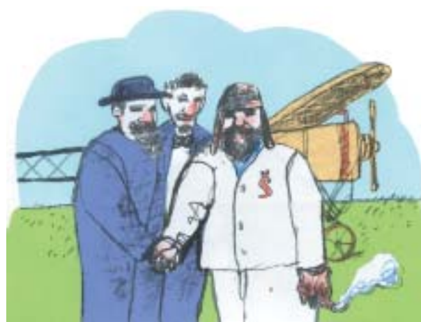
Kresby Antonín Sládek.

„Nescházejí vám už nápady, když jste toho tolik napsal?“ odpověděl čerstvý osmdesátník Arnošt Lustig mj.: „Tolik? To je velice relativní... Já mám dojem, že teprve začnu psát.“ A nakonec: „Mou ctižádostí bylo dožít se roku 2000, ale brzy mě to přešlo, protože mě chtěli zabít. Začal jsem si vážit každého dne, který jsem přežil. A to, že jsem se dožil osmdesáti, mně připadá srandovní. Abych se s tím smířil, říkám si, že je to jen čtyřikrát dvacet.“ ■ V rubrice „Česko – země neznámá“ přinesl deník Právo (12. 1.) souhrn známých informací o pevnosti Terezín. ■ MfD (28. 12.) referovala obsáhle o historii plzeňské Velké synagogy, „největší v ČR, druhé největší v Evropě a třetí na světě“.