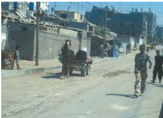
Ulice v Gaze.