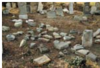
Čížkovice: Co k čemu a kam patří?

Postupně byla zahájena celková stavební a restaurátorská obnova synagog v Březnici (1995), Písku (1995), Čáslavi (1996), Nové Cerekvi (1998) a Jičíně (2002) a hřbitovů (Brandýs nad Labem, Černovice, Humpolec, Kolín, Mladá Boleslav a mnoha dalších). Podobně se v rámci možností