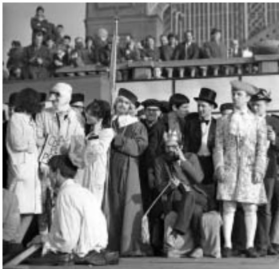
V polovině 60. let režim povoloval uzdu. Jen tak se mohlo stát, že básník Allen Ginsberg mohl být zvolen králem Majálesu (na snímku z r. 1965) a židovská mládež ho nesla na ramenou do Staronové synagogy. Jenže všechno bylo jinak: Ginsberga komunisté z Prahy vypověděli a brzy nato ho do ciziny následovaly zástupy emigrantů včetně židovských.

Je to ženatý muž s vysokoškolským vzděláním; pravděpodobnost, že žije ve smíšeném manželství, je velmi vysoká. Oba rodiče prošli koncentračními tábory a o tom, že je Žid, se dozvěděl už jako dítě. Řekli mu to rodiče, ale současně pochopil, že se s tím mimo rodinu a úzký okruh rodinných přátel, většinou též Židů, moc chlubit nemusí, zrovna jako s tím, že má příbuzné v kapitalistické cizině nebo v Izraeli. Své židovství tak prožíval v dětství a dospívání hlavně prostřednictvím umění a kultury, především literatury;