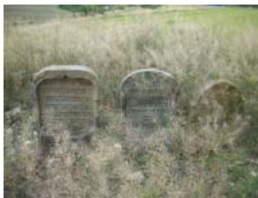
Hřbitov v Čížkovicích.

K článku o stavu židovských památek v České republice (str. 12–13).