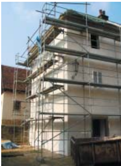
Ústěk – rekonstrukce rabínského domu.

Podíváme-li se s odstupem času na to, jak se po roce 1989 Federace ŽO i jednotlivé židovské obce staraly o záchranu židovských památek v České republice, můžeme hovořit o několika etapách.