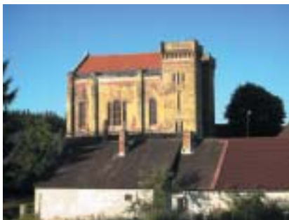
Synagoga v Nové Cerekvi z. pol. 19. stol.

správ i iniciativa občanských sdružení či jednotlivců jsou významnou a důle-