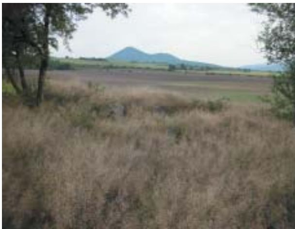
Hřbitov v Čížkovicích u Litoměřic, po vyčištění zarostlý travou..

Pro první etapu, trvající zhruba pět let, bylo charakteristické především úsilí zmapovat právní a faktický stav dochovaných synagog a hřbitovů, zamezit jejich dalšímu ničení a bourání snahou o restituci a v některých případech dohodou o vydání či koupi. Bylo