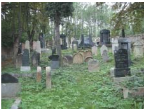
V poslední době byl opraven zcela zdevastovaný hřbitov v Úštěku.

Během pěti let, kdy projekt běží, se významnější práce uskutečnily už na 73 hřbitovech, 5 synagogách a 2 obecních domech. Zvlášť potěšující je, že se v některých místech daří zachránit