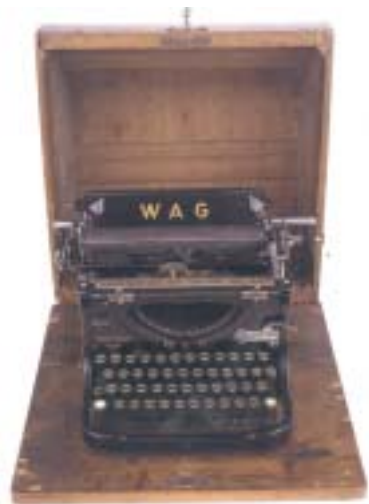
Psačí stroj upravený pro hebrejštinu.