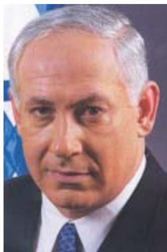
Benjamin Netanjahu.