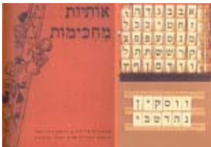
Hebrejský slabikář, M. Woskin.

rozsáhlou odbornou knihovnu a stal se znalcem židovské bibliografie. Za války narázově katalogizoval knihy Pohřebního ústavu uložené v Židovském ústředním muzeu. V červenci 1943 byl i s rodinou