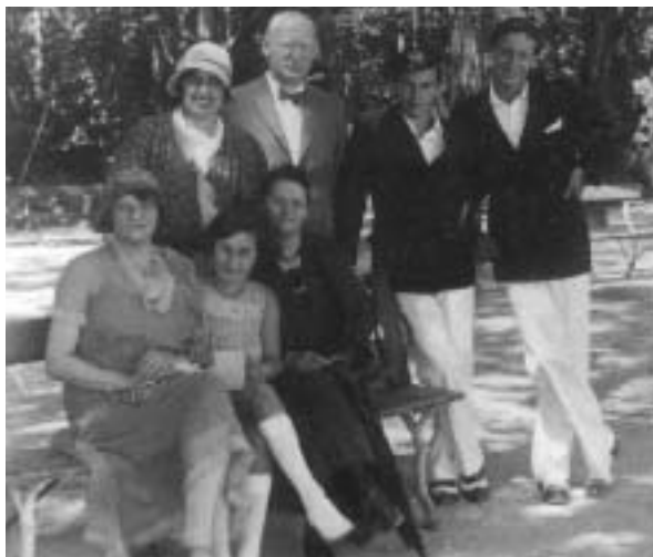
Rodinná fotografie, 30. léta, G. T. druhý zprava.

Já vlastně teď ani nevím, právě si to uvědomuju, kolik těch inscenací ještě do své smrti udělal, myslím ale, že jich mohlo být i víc, než jen ty dvě, ba možná víc než těch osm. Byl bych ho rád potkal i později, ale vlastně jsem ho už nechtěl obtěžovat, zdálo se mi, že je důležitější a vzácnější, když George Tabori píše nebo režisuje, než aby ztrácel čas poskytováním hovorů a rozpravami. A tak jsem se pak až dozvěděl, že teď, v 93 letech zemřel. Snad mu bylo dopřáno vytvořit všechno, o čem snil!