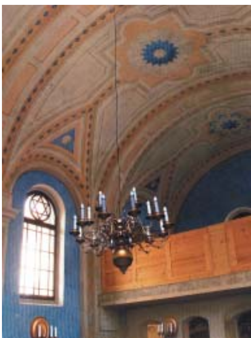
Synagoga v Jičíně.