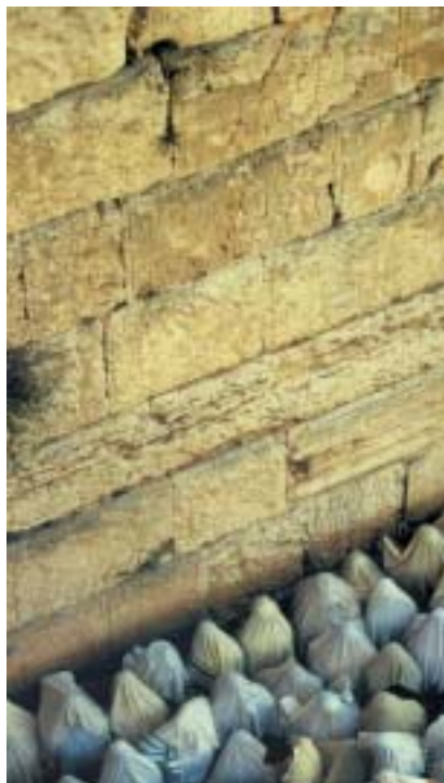
Modlitba u Západní zdi v Jeruzalémě.

Dvanáct etických příkazů má být vepsáno na kameny v sedmdesáti jazycích proto, aby si je mohl přečíst každý, kdo vstoupí do Izraele. Tato třetí smlouva je určena Židům, aby mohli hovořit s těmi, „kdo tu