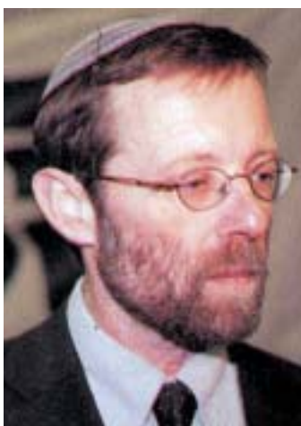
Moše Feiglin.