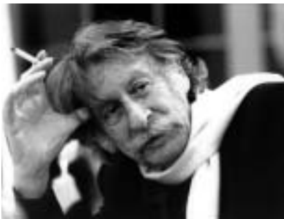
George Tabori.

Poprvé to bylo před lety, na sklonku pádu minulého režimu. Měl jsem nějaký hovor v rakouské televizi ohledně mé inscenace Kafkova „Procesu“ v tehdejší Hadivadle, poněvadž to bylo znovuuvedení Kafky, opět po letech zapovězení. Vzápětí mi volal někdo z jeho divadla Kreis ve Vídni, že pan Tabori připravuje též kafkovskou inscenaci a že bychom se mohli