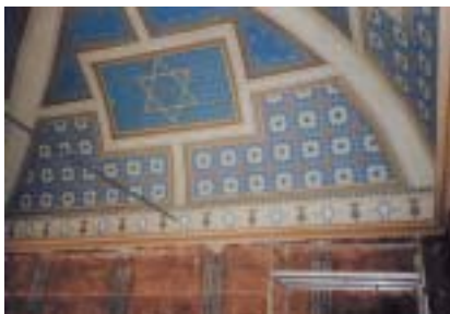
Restaurovaný strop strážnické synagogy.

Od roku 2002, kdy byl záměr radou FŽO schválen, bylo na federaci převedeno téměř 100 hřbitovů, 10 synagog a 3 obecní domy. Při FŽO vznikla expertní komise, která projekt sleduje