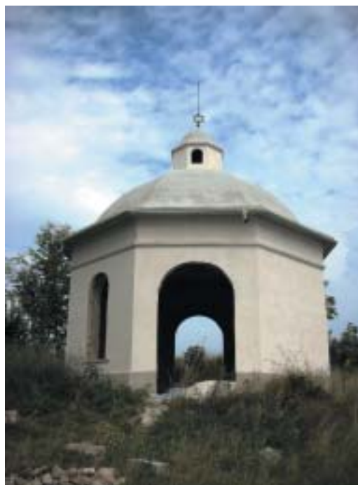
Obřadní síň v Radouňi.