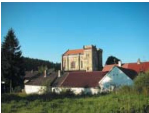
Synagoga v Nové Cerekvi.

VĚSTNÍK ŽIDOVSKÝCH NÁBOŽENSKÝCH OBCÍ V ČESKÝCH ZEMÍCH A NA SLOVENSKU