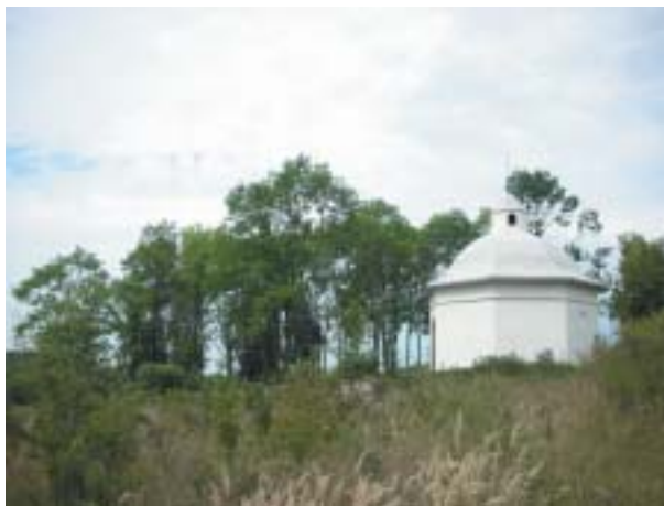
Obnovená obřadní síň hřbitova v Radouň u Štětí.

z převážné většiny plynul – a dodnes plyne – na záchranu památek. Tak už po řadu let může Praha investovat částku okolo osmi milionů korun ročně do 180 hřbitovů a více než dvou desítek synagog, které se nacházejí v oblasti jejího územního působení.