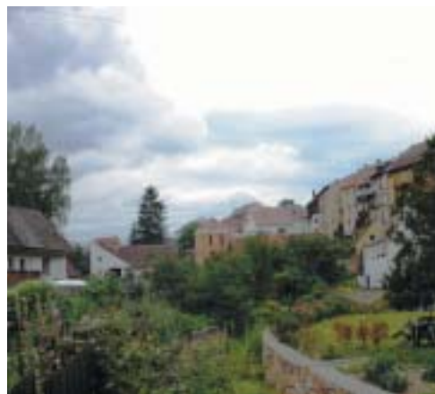
Synagoga v Úštěku je opět ozdobou města.

a restaurovat celý památkový fond v jeho rozmanitosti. Jako příklad může sloužit Úštěk, kde byla v letech 1993–2003 nákladem 5 milionů korun kompletně obnovena a do původního stavu navrácena synagoga, která již byla určena k demolici. (FŽO tu spolupracovala s nadačním fondem Zecher, který založila pro řešení nestandardních akcí na záchranu památek.) Současně je od roku 1996 opravován naprosto zdevastovaný hřbitov (zatím proinvestováno 1,3 milionu) a konečně roku 2002 byla zahájena celková rekonstrukce úštěckého rabínského domu (investice zatím 1,3 mil.). Podobně komplexně se daří postupovat v Krnově, Úsově, Strážnici a v Polné.