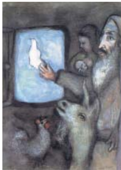
Marc Chagall: Noe vypouští holubici, 1931.

Mnoho lidí tvrdí, že kdyby zažili zázrak, začali by věřit v Boha. Svůj agnosticismus vysvětlují tak, že s nadějí očekávali nějaký mystický, magicky zázračný okamžik – ten že ale nepřišel. V této souvislosti je zajímavé zamyslet se nad naší denní modlitbou, amidou, kterou složili muži Velkého shromáždění před více než 2000 lety a která obsahuje následující prohlášení díky: „Tobě budeme děkovat a rozpravět o tvé chvále za naše životy, vložené do tvých rukou, a za své duše tobě svěřené, a za tvé zázraky, které jsou s námi každý den, a za tvé divy a za tvá neustálá dobrodiní večer, ráno a v poledne.“ Jsou tedy