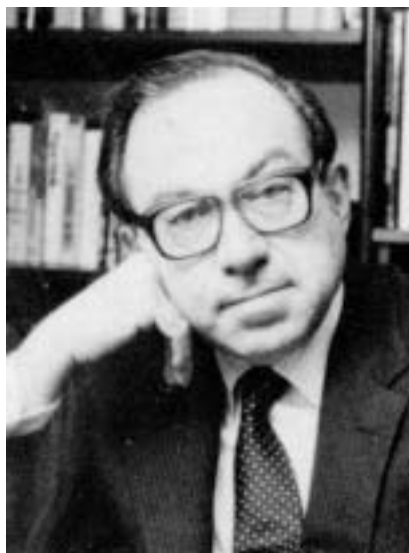
Raul Hilberg.

Přitom tohle dílo považované i svými kritiky za „monumentální a svrchované“ málem nespatrišlo světlo světa. Rukopis odmítalo nakladatelství za nakladatel-