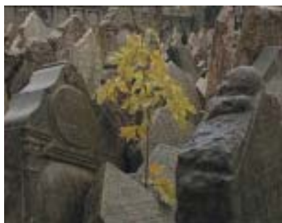
Záběr z filmu Dům života .