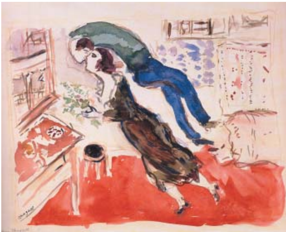
Marc Chagall: Narozeniny, 1915.

tím Nadace Pierra Giannady v r. 1991), zahrnuje vertikální panely pro výzdobu oken s alegorickými postavami představujícími tanec, hudbu, divadlo a poezii a osmimetrový horizontální panel s motivem svatební hostiny. Výstava dále zahrnuje i kompletní ilustrační cykly ke knihám, kromě jiného k vlastnímu životopisu Můj život , který vznikl v Moskvě již na začátku 20. let (česky 1969), a ke knize Chagalovy první ženy Belly Hořící světla (česky 2000, nakl. Argo), ilustrované na podnět dcery Idy po Bellině smrti v newyorském exilu ve 40. letech. Zvláštní místo mezi knihami ilustrovanými Chagallem má Bible, již autor chápe jako jedinečný, trvalý zdroj inspirace: „Vždy mi připadalo, že Bible byla od počátku nejúžasnějším zdrojem poezie ... Bible jako ozvěna přírody, tajemství, jež jsem se snažil sdělit.“ V galerii Nadace Pierra Gianaddy jsou vystaveny biblické ilustrace ve formě dvaceti rytin ze soukromé sbírky.