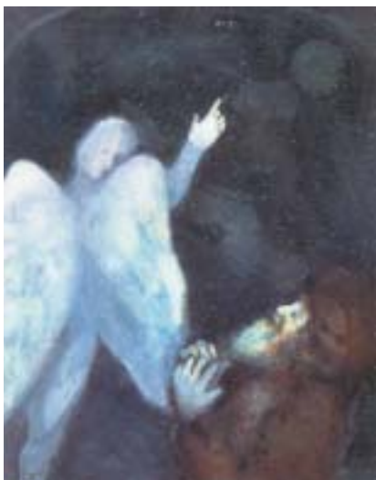
Marc Chagall: Noe dostává pokyn postavit archu, 1931.

Pražský Maharal vysvětluje, že zatímco Abraham se přel s Bohem kvůli zachování hříšných měst Sodomy a Gomory, zdá se,