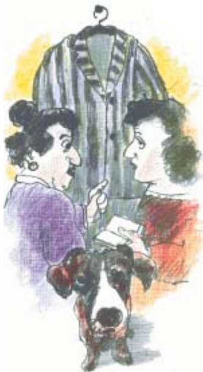
Kresby Antonín Sládek.

Otevře dveře do jejího pokoje. Frici klepe svým krysím ocasem o podlahu a koulí očima. Vezmu z věšáku šňůru, dám jí ko-