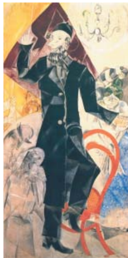
Marc Chagall: Divadlo, 1920.

Výjimečné a centrální místo v galerii má sedm velkoplošných panelů z r. 1920, jež tvořily avantgardní scénickou výpravu předního moskevské-