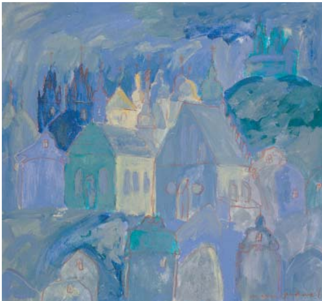
Mark Podwal: Pražské Židovské Město. (Kvaš na papíře, 2002.)

VĚSTNÍK ŽIDOVSKÝCH NÁBOŽENSKÝCH OBCÍ V ČESKÝCH ZEMÍCH A NA SLOVENSKU