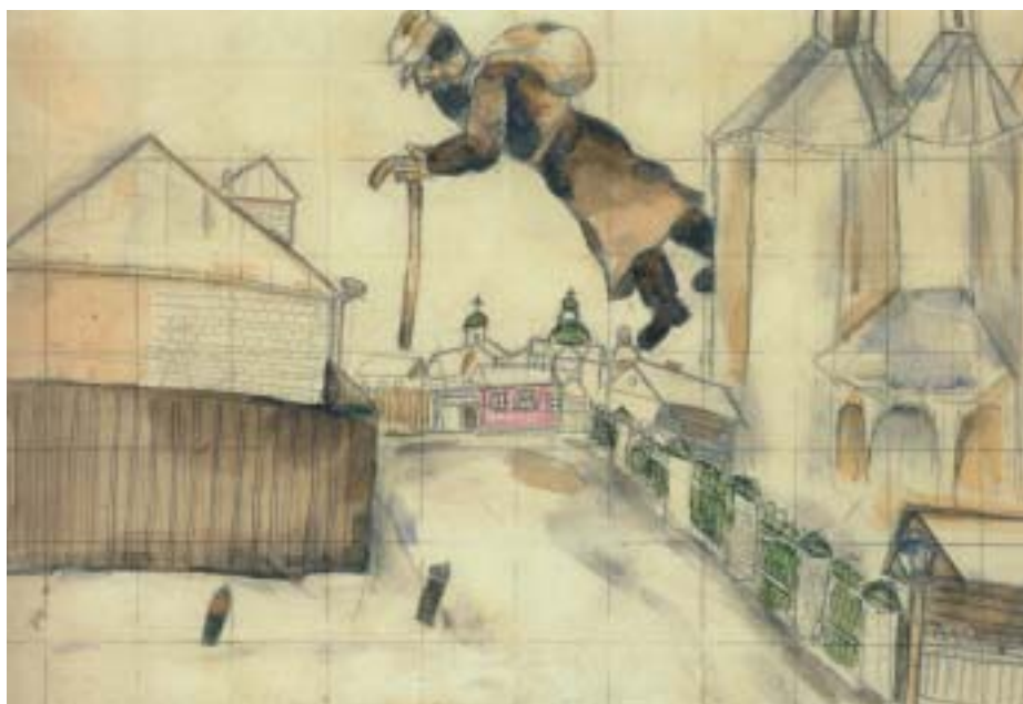
Marc Chagall: Předměstí Vitebska, 1914.

z r. 1973, popisujícím pocit osobního odcizení, úzkosti: „Někdy mi připadá, že jsem ve skutečnosti někým jiným, jako bych se narodil, dá-li se to tak říci, mezi nebem a zemí, že svět je pro mne jednou rozlehlou pouští, jíž se toulá má rozničená duše...“ Podobný životní pocit lze vyčíst i z Chagalových veršů: „Svět, jímž kráčím, je jak les /... /ze stromu za stromem listí padá/ jež budí mne a vyvolává strach.“