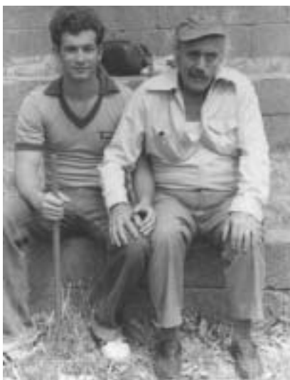
E. Janilov a I. Lichtenfeld, 70. léta.

Ač zní spojení slov krav maga jako kouzelnické zaříkadlo, jeho překlad z hebrejštiny zní prozaicky: boj zblízka. O existenci této bojové techniky u nás ví kromě několika fanoušků asi málokdo. Přitom se jedná o velmi rozšířený bojový princip určený především k sebeobraně, ceněný pro svou jednoduchost a účinnost. V současné době se učí v 25 zemích světa, v Evropě, USA, Asii a Austrálii: seznamují se s ním vojáci, policisté (mj. v USA a Velké Británii), lidé v bezpečnostních agenturách, ve speciálních jednotkách pro ochranu osob, v ochráncích na letištích a v letadlech,