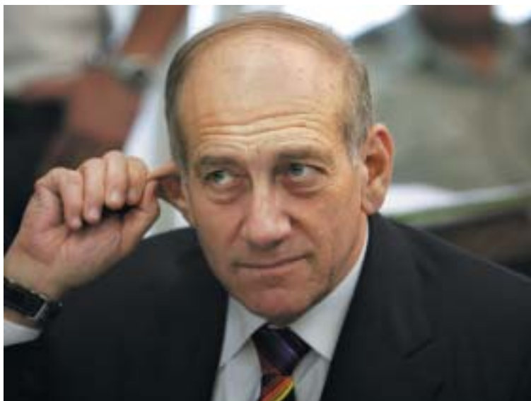
Ehud Olmert v Knesetu.

Ale o co vlastně šlo? Zajímavé je, že nikdo se oficiálně neptal, natož aby protestoval. Evropští diplomaté citovali syrského ministra zahraničí s tím, že izraelská akce nezpůsobila žádné škody. Prvním světovým médiem, které udělalo alespoň v hrubých rysech jasno, byla až 11. září americká televize CNN. V tomto kontextu je pak