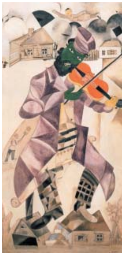
Marc Chagall: Hudba, 1920.

V červenci uplynulo 120 let od narození Marca Chagalla (1887–1985), malíře, který bývá charakterizován střídavě jako tvůrce buď vysoce origi-