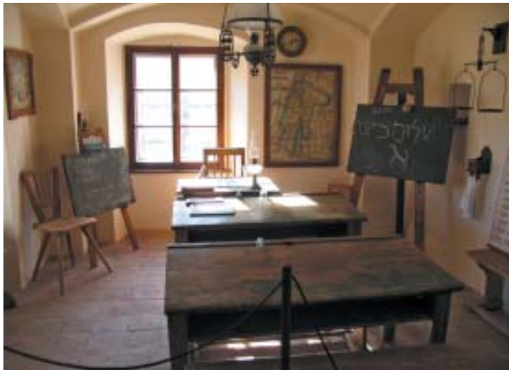
Expozice tradiční židovské školy v synagoze v Úštěku.

malová mimo jiné upozornila na změny, jimiž škola prošla během prázdnin. Na vstupní schodiště přibyla rampa s plošinou pro tělesně postižené, zásadní rekonstruk- cí prošla učebna chemie a dílčí změny ješ- tě vylepšily nedávno otevřenou učebnu počítačovou. Novinky jsou připraveny i ve výuce. Významné například je, že hebrej- ština se bude učit již od 1. třídy.