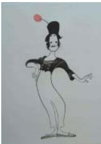
Marcel Marceau. Kresba Al Hirschfeld.