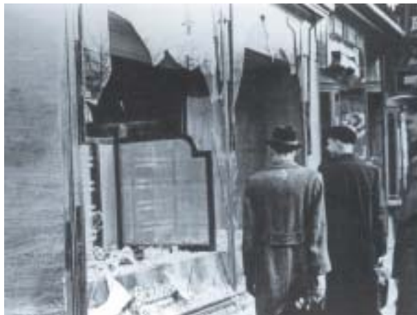
Před výklady židovských obchodů, 10. 11. 1938. Z fotopřílohy ke knize.

Jako protiváhu k příběhu německé krutosti Gilbert uvádí řadu příkladů obyčejných lidí, od domovníků po duchovní, kteří Židům pomáhali nebo proti jejich pronásledování veřejně vystoupili. Také v jeho líčení uprchlické politiky evropských států převažují příběhy jednotlivců, především konzulárních úředníků, kteří – často proti předpisům – Židům pomáhali. Jakkoli jsou tyto příklady obětavosti významné, zastiňují skutečnost, že většina Židů, kteří se snažili o emigraci, neměla to štěstí se s takovými lidmi setkat. Gilbert popisuje i restriktivní uprchlickou politiku a případy, kdy byli Židé odmítáni (např. loď Saint Louis), ale jeho