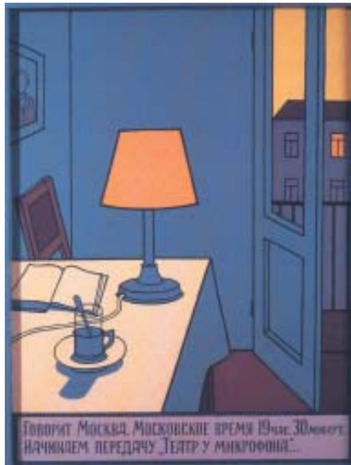
Viktor Pivovarov: Z cyklu „Pokoj 22“, 1992–1995.

technologii a fakticky neexistuje možnost, jak tomu zabránit. Půjde o fatální precedent, který s velkými obavami sledují i mnohé státy Blízkého východu. I ty se