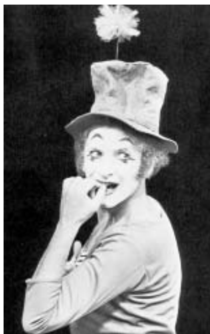
Bip, vždy s růží na .cylindru.

Když jsme legendu mezi kavárnami opouštěli, světil jsem se Josefovi s tajným přáním zeptat se Mistra, jaký je život s bílou maskou. V metru jsme si o ní povídali. Kdo se nikdy nenabítil, její magii nepochopí. Reflektory totiž tvář úplně rozsvítí! Diváci ji sledují s dětským úžasem! Maska nalíčenému po celý čas „čarování“ intenzivně voní. Jelikož součástí bílé masky jsou červeně líčená ústa, mim při produkci vnímá i její chuť. Mímy je poznat i v civilu podle časem neodličitelných očních linek. Červenožlutý Théâtre Antoine je na bulváru de Stras-