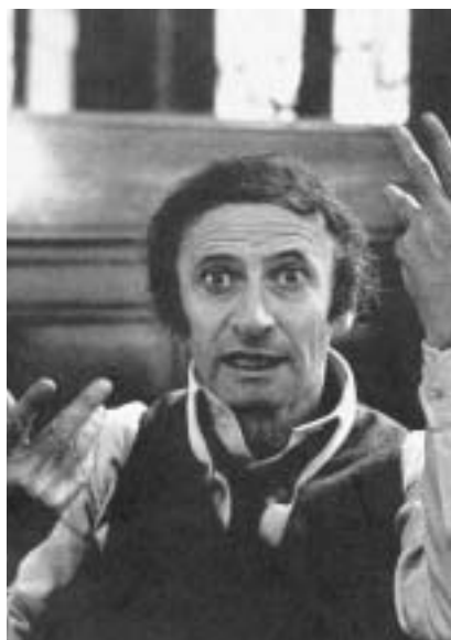
Marcel Marceau 1974.

žije v jeho blízkosti. Čas plyne a moudrý strom, člověku uvyklý, dokáže jen zavřít oči, když ruka vyrývá nožem do jeho těla milované litery. Ke konci etudy se pod jeho větvemi skrývá jeho mládenec před střelbou. Když je zasažen, potácí se a obejmeme peň. Zoufalý strom nekonečně pomalu obejmeme tělo umírajícího a zvolna, zvolna se