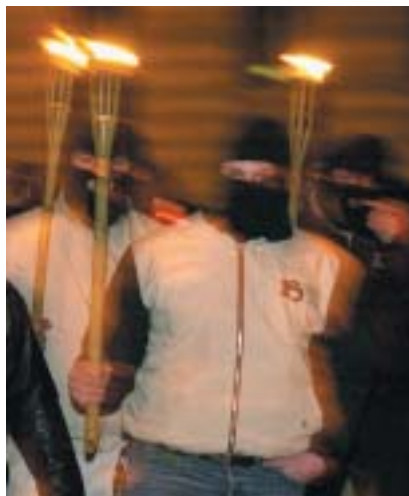
První pokus neonacistů o pochod židovskou čtvrtí se uskutečnil 11. ledna 2003.

28. září se do Kladna sjelo na 300 extremistů. Předtím dorazilo 1. května 500 extremistů do Brna. Když jejich demonstraci na základě požadavků veřejnosti správní úředník