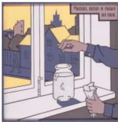
Viktor Pivovarov: Moskva, jaro a ryбка na okně. Z cyklu „Pokoj 22“, 1992–1995.