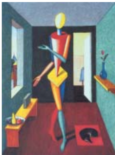
V. Pivovarov: Moskevská gotika, olej, 2000.