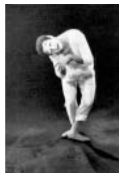
Čtyřminutový příběh – Narození, mládí, stáří a smrt.