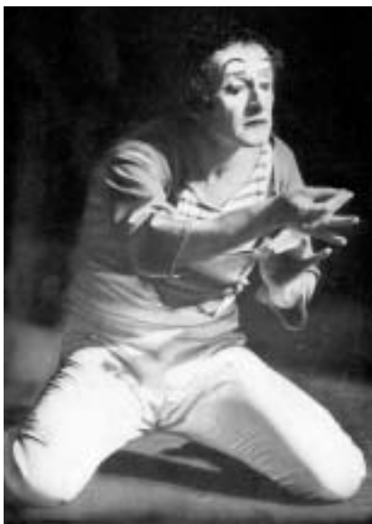
Bip jako zamilovaný krejčí.

Třetí setkání vidím jako dnes. Od kolegy Sochora se na katedře pantomimy HAMU