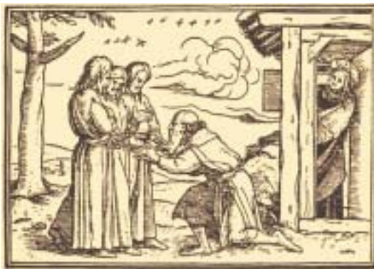
Abrahamovi je slíben Izák, Sára se tomu směje. Hans Holbein ml.

dne pozdvihl Abraham oči svých a viděl místo to z daleka“ (1M 22,4) není „místo“, ale „Bůh“ jako v útěšném pozdravu truchlícímu ( HaMakom menahem etchem... ). Abraham viděl Hospodina opravdu z dálky, když si neuvědomil, že náš Bůh by nikdy nežádal dětskou oběť! A faktem je, že po tomto incidentu už Bible neznamenává ani jeden rozhovor mezi Hospodinem a Abrahamem; praotec přitom žil ještě osmatřicet let.