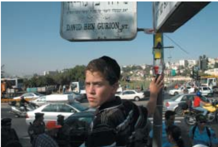
Nic proti Annapolisu, ale Jeruzalém dělit nechci.

Problém je zejména v tom, že vyjednávací agendu nelze házet do jednoho pytle. Pokud se tak stane (a chtějí to tak v podstatě všichni arabští partneři jednání), bude to cesta tam, kde před sedmi lety