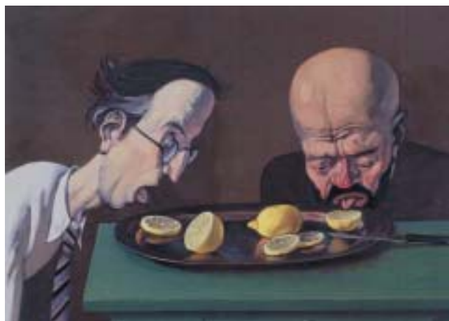
Viktor Pivovarov: Jedlící citronů, olej na plátně, 2006.