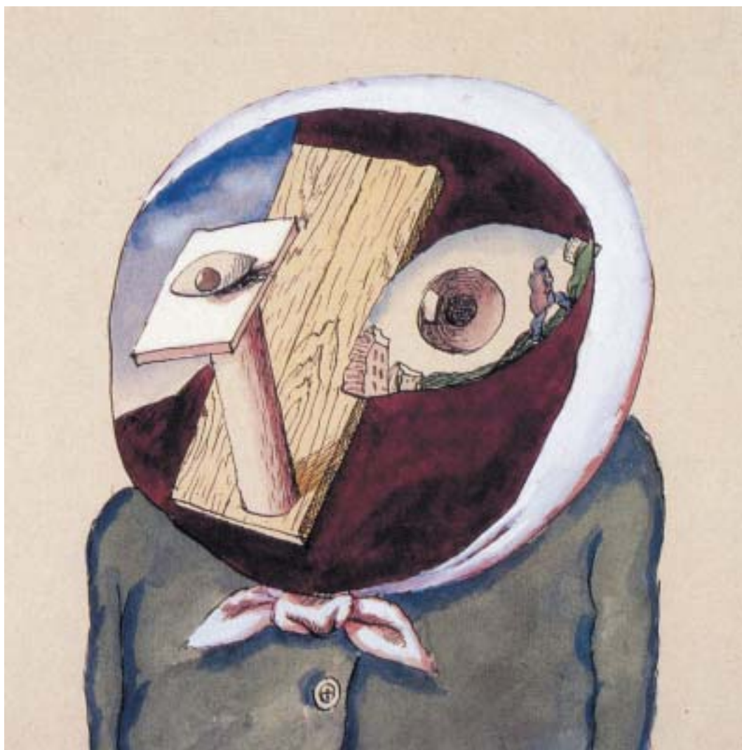
Viktor Pivovarov: Já na tebe čekám, a ty nejdeš a nejdeš... (Akwarel a tuš na papíře, 1996.)

VĚSTNÍK ŽIDOVSKÝCH NÁBOŽENSKÝCH OBCÍ V ČESKÝCH ZEMÍCH A NA SLOVENSKU