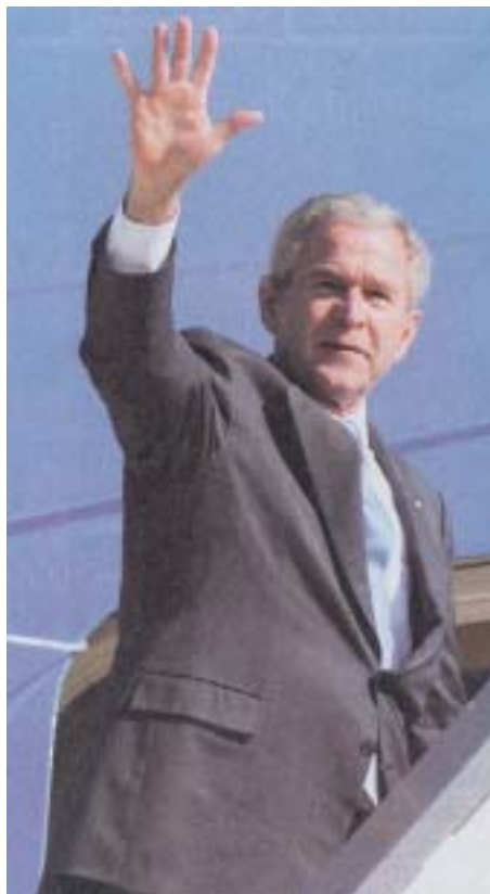
George W. Bush se loučí s Izraelem.

lidovce. Může ministryně zahraničí Cipi Livniová pokračovat ve vyjednávání zásadních věcí, ví-li, že Šas může následovat Liebermana? Odpověď je prostá: může a zřejmě i bude pokračovat v jednání, neboť pro Šas je jednou věcí jednání a zcela jinou věcí následná dohoda. Keinonův scénář vypadá takto: řádově měsíce bude vláda vyjednávat, Šas bude vyděračsky sklízet své ministerské prebendy a rozpočtové bonusy, ale těsně před hotoovou dohodou zváží, zda ji podepíše, nebo koalici opustí. Takže hlavní