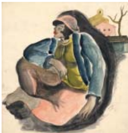
Hella Guthová, Sedící Cikánka, akvarel, 1931.

protože pracovníci archivu jim mohli předat něco výjimečného – malé hnědé obálky, kam Židé při příchodu do tábora odevzdali to, co měli u sebe. Obálky dostalo 22 rodin z Holandska, byly v nich hlavně rodinné fotografie, ale i další předměty, např. náprsní taška malíře, na které byly ještě stopy barvy. Většina materiálu v Bad Arolsenu ovšem sestává z formulářů, které vyplňovali nacisté. Bližší údaje o archivu lze nalézt na stránkách www.its-arolsen.org .