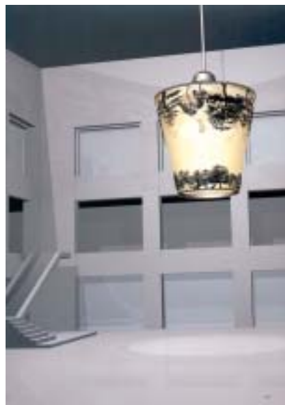
Lampa, počítačový obraz, různá média. 2003–2004.

Ti, co tam byli, hovořili o magnetické síle, kterou v pavilonu cítili. Všechno, co tam je, jsem sama vytvořila, dala jsem do toho svou energii. Líbilo se mi, když byli lidé zpočátku zmateni, brali instalaci jen jako estetickou zkušenost. Pak se ale pohroužili do prostoru a začali ho vnímat, vnímali i prázdný prostor mezi předměty. S tím vším pracuji – prázdný prostor, který tam je, je velmi důležitý, je to brána k dalšímu stupni vnímání. Řekla bych, že v Benátkách jsem udělala svůj nejprázdnější projekt, a přitom je tolik naplněný. Takže kdyby se někdo zeptal, co