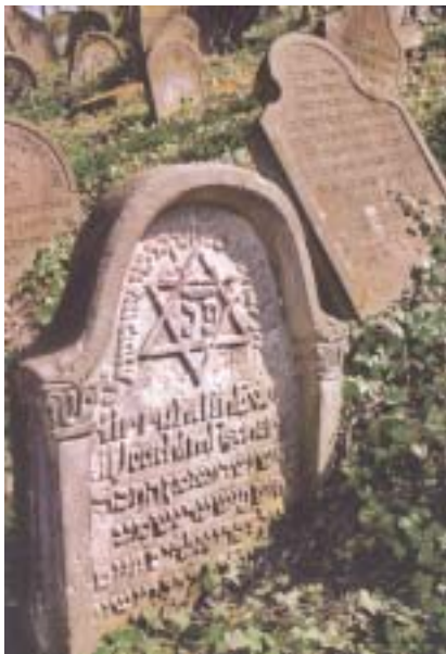
Starý hřbitov v Roudnici.

Spolu s tím, jak se správa věcí přesouvá na regionální centra, stoupá i zájem místních úřadů a nejrůznějších institucí o místní památky. V poslední době taky o památky židovské. Někde jde o významné urbanistické celky, stavby, hřbitovy, jinde už jen o pouhé zlomky, hmotné stíny vzpomínek na nepříliš početnou, ale ekonomicky a kulturně výraznou menšinu, kterou totalitní režimy z let 1939-89 větším dílem vyvražďily, zbytek pak skoro celý vyhnaly ze země. Zástupci regionů si uvědomují, že židovské památky svým zvláštním kouzlem, jistou exotičností a svého druhu opuštěností mohou přitahovat turisty, alespoň ty vnímavější, a mohou pomoci region, jak se teď pěkně říká, „zviditelnit“. Postupně proto věnují více pozornosti jejich propagaci. Roku 2006 vyšla česko-anglicko-hebrejská obrazová publikace Stopy Židů v Pardubickém kraji a teď nejnověji na severu Čech česko-anglicko-německý komplet ŽIDOVSKÉ PAMÁTKY ÚSTECKÉHO KRAJE , zahrnující informační brožuru, CD a DVD. Slovem i obrazem přináší zprávu o historii židovského osídlení kraje a základní historické a obrazové informace o dějinách a současném stavu památek v osmatřiceti lokalitách. Nejvýznamnější je samozřejmě Terezín a bývalé ghetto, pozornost zájemců však určitě přilákají také méně známá místa, kde se podařilo uchovat hmotné vzpomínky na každodenní, běžný život židovské menšiny, jako jsou Úštěk, Most, Děčín, Teplice (málokdo ví, že za první republiky měly po