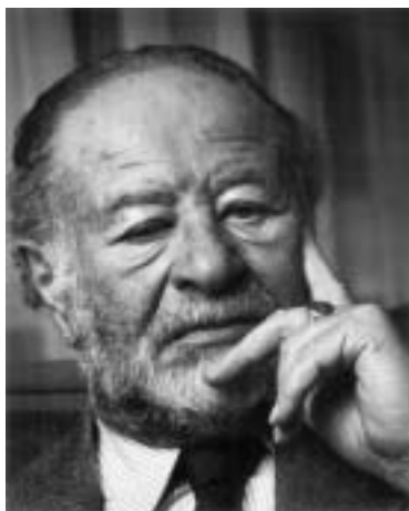
Bruno Kreisky

Vídeňské centrum fotografie Westlicht připravilo velice zajímavou a unikátní výstavu. Představí práci německé fotografky Herlinde Koelblové, která se věnovala mj. fotografování německy mluvících osobností židovského původu. Fotografie z let 1986–1989 autorka vytvořila při setkáních a rozmlouvách s významnými osobnostmi,