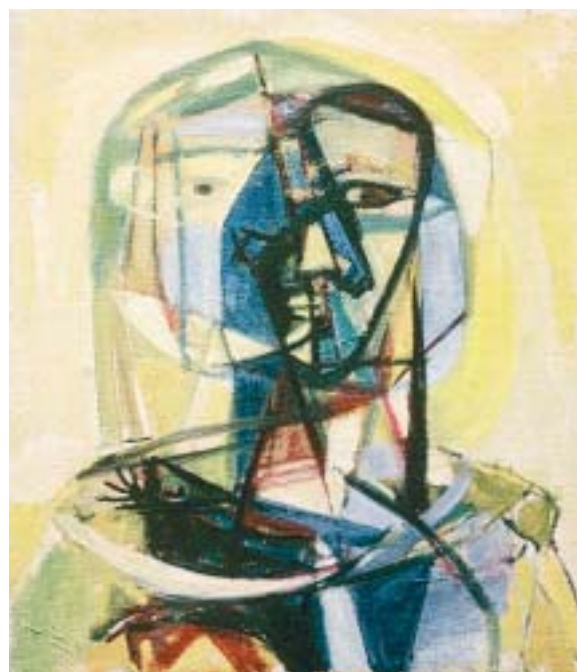
Hella Guthová: Hlava ženy ve žlutém , 1950/51, olej na plátně.

Rané malířské práce pařížského období Helly Guthové projevují zřetelně její sklon k lineární grafice. Na přelomovém