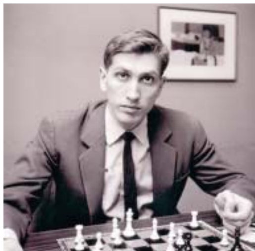
Bobby Fischer při partii v New Yorku v r. 1962.