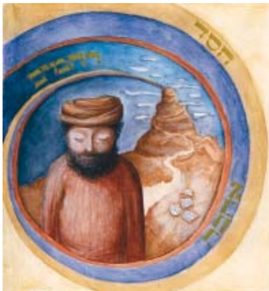
Moše rabenu. Kresba Carolina Sidon.

Možná, že tato myšlenka jde ještě hlouběji. Mišna (Sanhedrin, kapitola