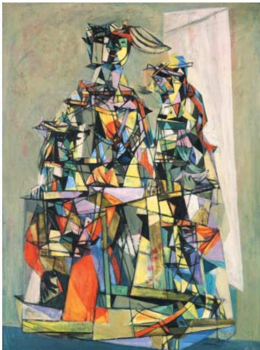
Hella Guthová, Radostná jízda , 1949, olej na plátně. (K článku na straně 12–13.)

VĚSTNÍK ŽIDOVSKÝCH NÁBOŽENSKÝCH OBCÍ V ČESKÝCH ZEMÍCH A NA SLOVENSKU