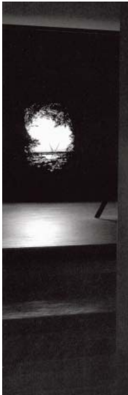
Z instalace Guardians of the Threshold , Benátky 2007.

jsem dělala. Byla to vlastně politická poezie. Ale ten politický smysl byl skrytý. Lidé se ptali, co je na tomhle díle izraelského? Hledali vizuální prvky, které by mohli snadno určit, jako třeba bezpečnostní zeď. Já myslím, že se musí jít hlouběji, ale chce to víc času a soustředění. To, co je