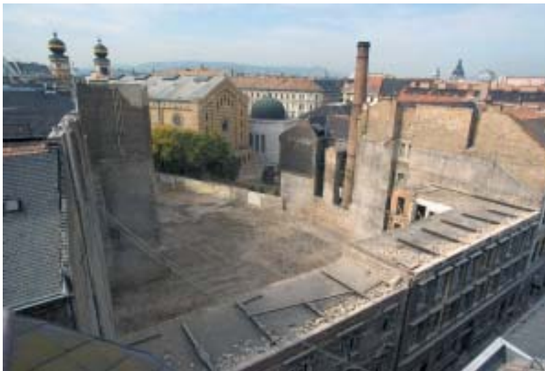
Proluka po zbořeném domě v sousedství synagogy na ulici Dohány.

bami, jejichž rozměr a podoba naprosto nezapadají do originálního koloritu zdejší čtvrti. Stavební práce pokračo-