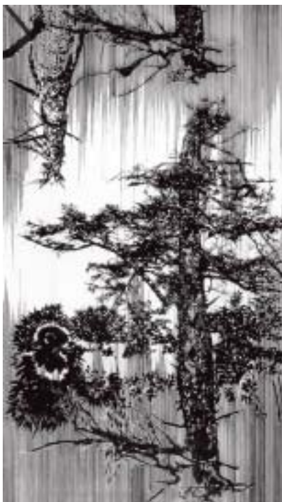
Vodní strom, tuš na papíře, 2005.

Tak třeba ty jehly, to je ozvěna dětství: každý večer jsem musela pomocí velkého magnetu sesbírat a uklidit jehly rozházené