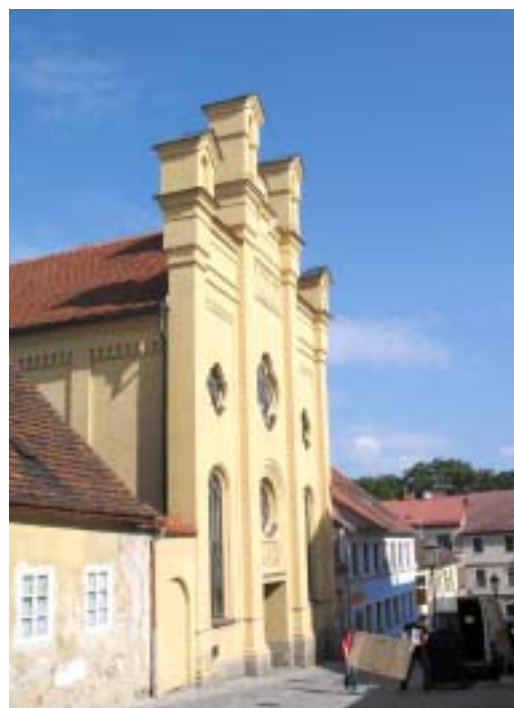
Také s píseckou synagogou se počítá.