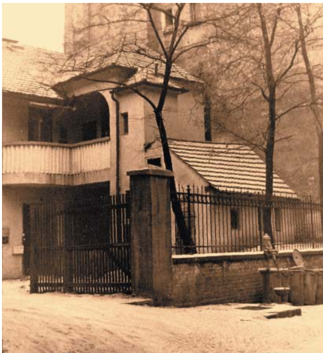
Zbořený libeňský rabinát. K rozhovoru na stranách 6–7. Foto archiv.

VĚSTNÍK ŽIDOVSKÝCH NÁBOŽENSKÝCH OBCÍ V ČESKÝCH ZEMÍCH A NA SLOVENSKU