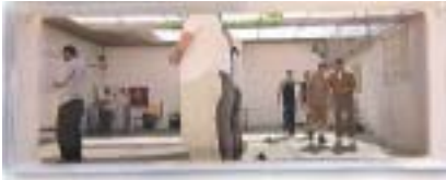
Záběr z filmu V Kotli .

zejména v ženském křídle věznice (snad nejmrazivějším momentem je výpověď ženy, která zorganizovala sebevražedný útok na jeruzalémskou restauraci a s širokým úsměvem na tváři a ostantativní lhostejností odpovídá na otázku, kolik při něm zemřelo dětí), film se soustředí spíše na ty, u nichž pobyt ve vězení znamenal určitou změnu způsobu myšlení. Izrael dnes podle statistik zadržuje asi desítku tisíc palestinských vězňů, z nichž většina byla odsouzena právě za účast na teroristických akcích. Jelikož bývalí i současní vězni vstupují významně do palestinské politiky a pobyt ve vězení je přímo předurčuje k politické dráze (to v dokumentu dosvědčují jak palestínští političtí představitelé, tak i výsledky voleb, v nichž úspěšně kandidovali i mnozí z uvězněných), je velmi důležité, jakým způsobem se budoucí politická elita ve vězeních formuje. Dotánův snímek naznačuje, že se Izraelcům