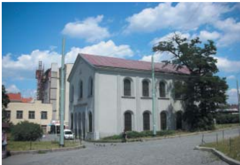
Novorománská libeňská synagoga, postavená v letech 1846–58. Foto Jiří Daniček, 2007.

Snažíme se, abychom uváděli programy přímo pro toto místo vytvořené, aby na něj nějakým způsobem reagovaly. Za těch patnáct let jsou to již dvě stovky jednotlivých projektů.