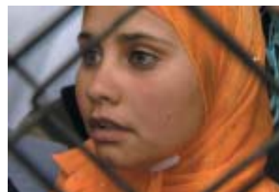
Záběr z filmu V kotli .

Oceňovaný snímek dokumentaristy a režiséra Šimona Dotana V kotli (Bitchonim, 2006) je jedinečný především tím, že nás zavádí na místa, která zůstávají z hlediska mediálního zájmu poněkud ve stínu. Sledujeme v něm zblízka život palestinských vězňů, kteří si odpykávají vysoké (často mnohonásobně doživotní) tresty za přímý či nepřímý podíl na teroristických útocích v jedné z nejtřeštěnějších izraelských věznic. A pohled do zákulisí vězeňského života je v mnohem ohledu překvapivý. První, čeho si všimneme, jsou komfortní a vstřícné podmínky, které trestancům izraelská správa poskytuje: nadstandardně vybavené cely včetně televize připomínají útulně zařízenou ubytovnu, Palestinci se těší interní samosprávě a jejich zvolení představitelé přátelsky komunikují s vedením věznice o každodenních potřebách. K dispozici je vlastní modlitebna s imámem, vězni mohou studovat na univerzitě a jejich rozdělení do cel respektuje politickou příslušnost, takže zvlášť bydlí stoupenci hnutí Hamás a zvlášť příslušníci Fatahu. Jestli si vůbec někdo z Palestinců stěžuje na postup izraelské strany, jsou to davy příbuzných přicházející na návštěvu a hořekující