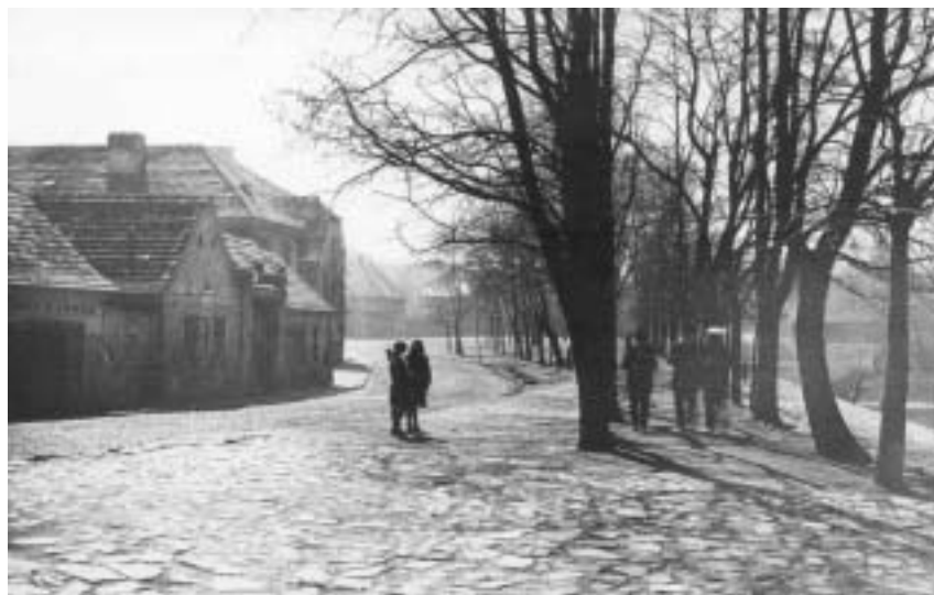
Zmizelé libeňské ghetto už revitalizovat nelze, ale synagogu se zachránit podařilo.

Programy v libeňské synagoze pořádáme pod mnohoznačným titulem Otevřeno . Pro