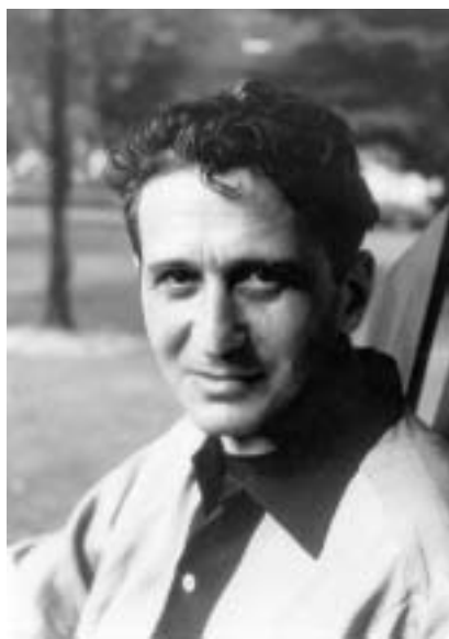
Egon Hostovský v r. 1953.

Dalším tématem, k němuž se autor často vrací, je konfrontace snu a skutečnosti, světa dospělých a dětí. (Např. v románu Černá tlupa , 1933, si děti vytvoří svůj autonomní snový svět na ochranu proti hrůzám válečného světa dospělých.) Právě v těchto prózách je Hostovský zřetelně