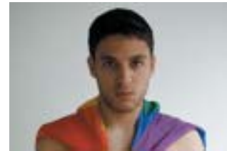
Záběr z filmu Svaté město uvádí .

surdně demonizují (viz kroužek postarších dam, které si vykládají o tom, že gayové vystřídají stovky partnerů ročně). Ale právě toto černobílé vidění, byť zčásti pochopitelné, je dokumentu na škodu. Nejen že se zde vůbec nezmiňují podmínky homosexualů v Izraeli, které jsou mnohem příznivější, než by se po zhlédnutí filmu