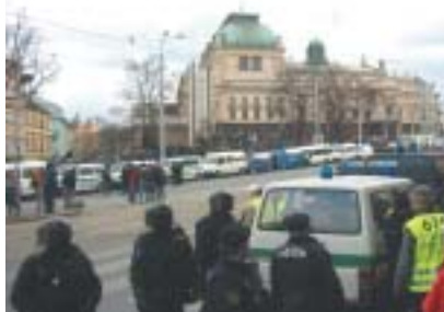
Policie čeká na obránce svobody slova.

V Plzni se ukázalo, jak málo jsou orgány místní správy připraveny na nestandardní situace, pokud jde o veřejný pořádek vůbec a extremismus nejrůznějšího druhu zejména. To, že existuje ohlašovací povinnost při pořádání veřejných shromáždění i možnost městských či obecních úřadů se k nim vyjádřit, přece znamená, že určitá pravidla tu existují. Jde o to je znát a být si jich vědom. Ve zdrcující většině případů – a to byl i případ plzeňského třetího obvodu – se úředníci nahlášenou akcí v podstatě nezabývají, zkontrolují formální náležitosti, a jsou-li v pořádku, v zákonem stanovené lhůtě se nevyjádří. Tím je pro ně věc vyřízena. Když se pak od jiných dozvedí, že se – jako tomu