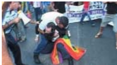
Záběr z filmu Svaté město uvádí .

Třetí izraelský snímek na Jednom světě, dokument Svaté město uvádí (Jerušalajim ge'a le hacig, 2007), se od politické tematiky obrací k tematice občanskoprávní: jeho námětem je uspořádání světového „pochodu hrdošti“ homosexuálů, takzvané Gay Pride Parade, v Jeruzalémě v roce 2006 a vlna odporu, která se proti němu zvedla v místní konzervativně-ortodoxní náboženské komunitě. Právě na kampaň proti pochodu, spíše než na záměr akce či její samotný průběh, se filmaři nejvíce soustřeďují – osmdesátiminutový dokument ukazuje těžkosti, jimž musí organizátoři čelit jak v rovině politické (jeruzalémská radnice složená převážně z příslušníků náboženských stran hodlá pochodu zabránit navzdory výroku soudu, který jej povolil), tak i osobní (letáky, anonymní korespondence a telefonáty vyhrožují účastníkům fyzickým napadením či dokonce smrtí, na kameru mluví chlapec, který byl během předchozího ročníku akce pobodán ortodoxním odpůrcem). Ačkoliv se pořadatelé zaručují, že pochod bude respektovat posvátnost Jeruzaléma a vyhne se všem obscénnostem a nahotě, kampaň vedená proti Gay Parade se stupňuje a vyvrcholí vlnou pouličního násilí, při němž je zraněno množství policistů. Nakonec do plánovaného data konání pochodu vstupuje válka s Hizballáhem a akce se uskuteční v mnohem skromnějším měřítku, na uzavřeném stadionu namísto v ulicích města. Film uzavírá několik plamenných proslovů o potřebě neustoupit a pokračovat v boji