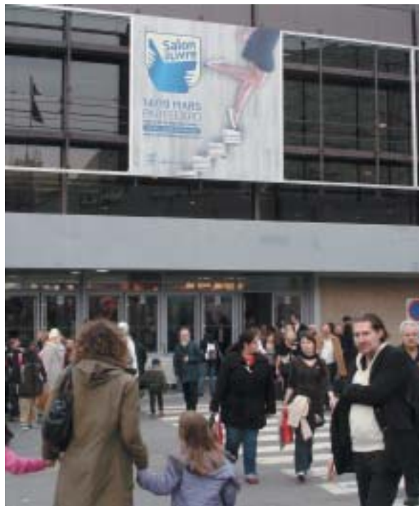
Paříž 15. března 2008.

Tiskové agentury dosti stereotypně opakují: za Sarkozyho se izraelsko-francouzské vztahy výrazně zlepšily. Zsvěcenější pohled ale nabízí Adar Primor v již citovaném Ha'arecu . Sarkozy podle něj už vstoupil do dveří poněkud pootevřených v posledních letech Chirakovy vlády – v roce 2002 Francie přestala vázat svůj poměr k Jeruzalému na „pokrok v mírovém procesu“, za Šaronovy návště-