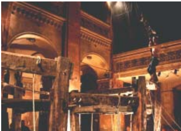
Z představení Jób (divadelní dílna Archa, libeňská synagoga 2006).

Byl v ní sklad kulis divadla S. K. Neumann a Hrabal jistý čas pracoval v diva-