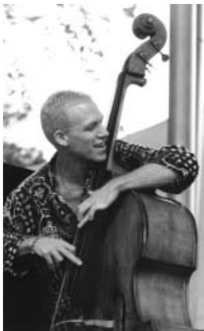
Avišaj Cohen.