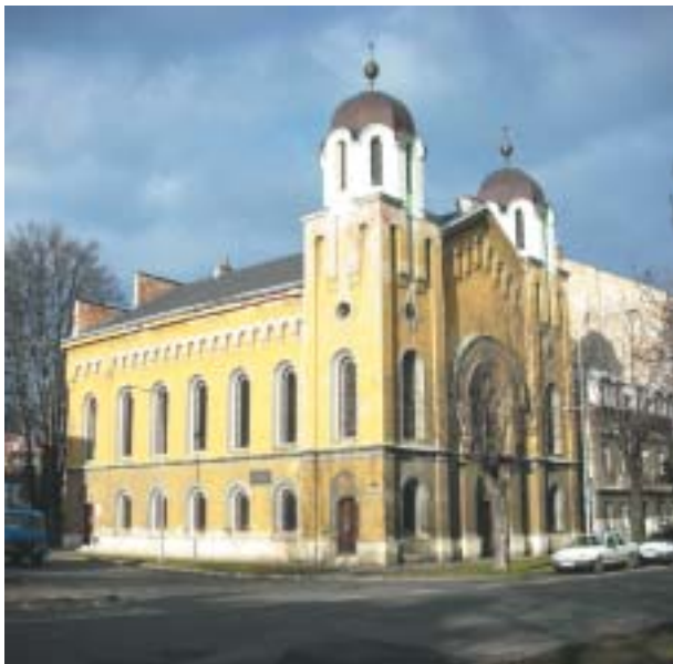
Jedním z vhodných objektů je synagoga v Krnově. Foto Jiří Daniček, 2008.

trozí jejich fyzický zánik. Tím jsou tyto jedinečné památky blokovány pro následné účinné využití jako plnohodnotná součást kulturního dědictví ČR.