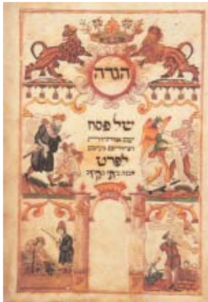
Titulní list Hagady, Vratislav, 1756.

ly dovážet levné solární vařiče, které ušetří ženám nebezpečné cesty mimo tábor. Organizace Jewish World Watch, pro niž laureátka ceny pracuje, navíc vyhlásila finanční sbírku, jejíž výnos (zatím 1 milion dolarů) je určen právě na výrobu a přepravu těchto vařičů k rodinám uprchlíků.