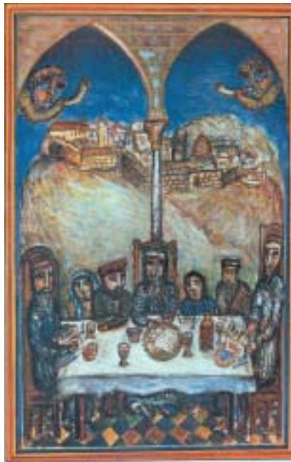
Samuel Bonneh: Seder, Jeruzalémská hagada, 1968

spravedlivého, který ví, že je spravedlivý.“ Zlobivé dítě je alespoň upřímné a vždycky se může napravit. Mírné dítě je třeba naivní a srdečné a to, které se „neumí zeptat“, se možná pohybuje v oblastech mimo logické chápání, jež se přibližují oblasti