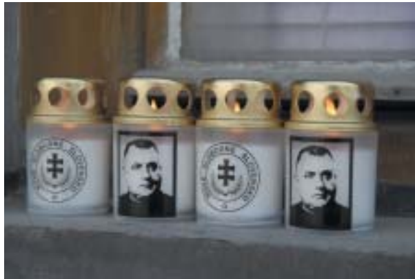
Špeciálne sviečky k 60. výročiu smrti Jozefa Tisa.

v súvislosti s oslavami žiadne aktivity politikov a jediný, kto si verejne uctil prezidenta Tisa, boli neonacisti, skinhedí a členovia Slovenskej pospolitosti, ktorí sa v počte asi 60 osôb stretli na údajnom hrobe Jozefa Tisa na Martinskom cintoríne v Bratislave. Na stretnutie dohliadalo asi desať policajtov. Druhú akciu ohlásili neonacisti na nasledujúci deň. Podľa tlače sa mal v sobotu 15. marca konať v Nitre „pochod proti drogám“, avšak tento pochod sa napokon neuskutočnil. Zabránila mu polícia, ktorá asi stopäťdesiat prívržencov neo-