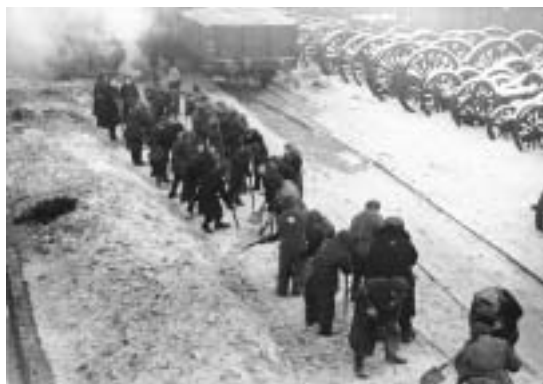
Židé v Minsku na nucené práci – foto použité ve filmu.