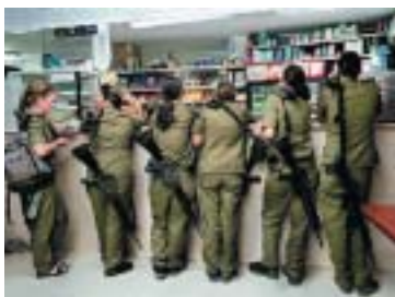
Záběr z filmu Jestli se usmívám .

z nich zastávala v armádě jinou pozici – najdeme tu zdravotnici, pozorovatelku, výchovnou pracovníci, stráž na checkpointu – jejich zkušenosti jsou však v mnohem ohledu podobné. Tím společným jmenovatelem je nejen jejich osamělost v drsném chlapském prostředí, ale také tíha odpovědnosti za nesmírnou moc, která jim byla svěřena, a lehkost jejího zneužití. Jedna z žen tak vzpomíná na to, jak jí palestinský terorista zastřelil kamarádka a jak druhý den nechala na kontrolním stanovišti stát frontu Palestinců ve