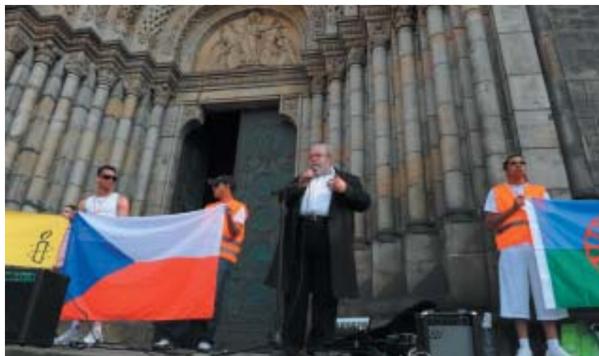
Rabín Karol Sidon na protestním shromáždění organizovaném Romy 3. května v Praze-Karlíně.