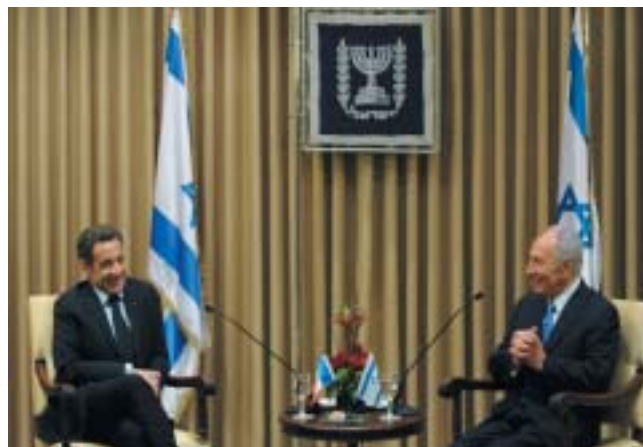
Vřelé setkání Nicolase Sarkozyho a Šimona Perese.

Nejlépe hodnotil vývoj ve Francii: „vřelý“ Sarkozy nahradil Chiracův „antagonistický režim“, což je největší plus od roku 1967, kdy de Gaulle zrušil zvláštní vztah s Izraelem. Italskou vládu vedl opět pro-