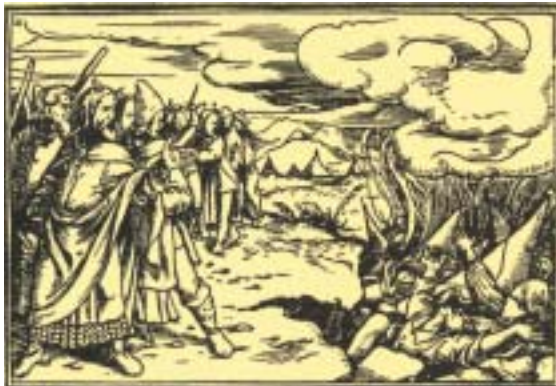
Hans Holbein ml.: Koracha a jeho stoupence pohltila zem , 1538.

kteřou si Mojžíš vzal za manželku. Raši cituje Sifrej , jež zaznamenává slova rabiho Natana, který vysvětluje, že Mirjam stála náhodou vedle Mojžíšovy ženy Cipory, když se Mojžíš dozvěděl, že dva muži v táboře, Eldad a Medad, začali věštit. Mirjam soucítla s manželkami Eldada a Medada,