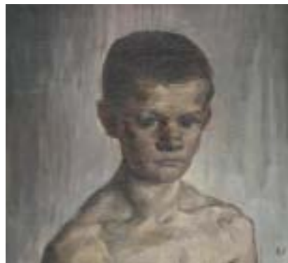
Podobizna chlapce (syna Josefa), kolem 1925. Olej na plátně, Muzeum a galerie Jičín.

noval. Je to ulice – bezejmenná ulice, červený štít domu, jehož fronta se ztrácí v nekonečnu, fronta, která nemá oken, v jakési zašpinavěle hnědi ostře kontrastuje se žlutavým nebem, zbrzděným fialovými mraky. Silueta ztemnělého strohořadí zakončuje obzor. V této Bohem opuštěné ulici kráčí několik lidí k neznámému cíli. Obraz není technicky dokonale namalován, ani snad Fischerovi o to nešlo, jemu šlo o vyjádření vlastní osob-