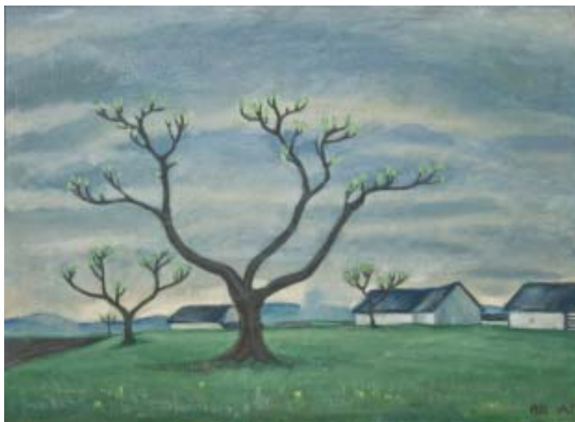
Melancholická krajina I , 1921. Olej na plátně, Muzeum a galerie Jičín.

a když se usmíval, bylo cosi melancholického v jeho úsměvu. V té době se však neusmíval vůbec. Byl Žid. Jeho dům byl označen... Z minulých zkušeností se dalo