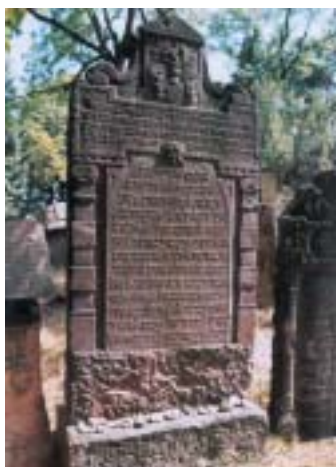
Baševiho náhrobek na židovském hřbitově v Mladé Boleslavi.

Brzy poté, co společnost zahájila činnost, začaly růst ceny stříbra. Zisky konsorcia klesaly a jeho členové začali snižovat hodnotu ražené mince. Základní ustanovení o devaluaci bylo zakotveno už ve smlouvě, nešlo tedy v plném slova smyslu o podvod, ale počínání konsorcia mělo tak neblahý vliv na ekonomiku země, že císař musel v roce 1623 nařídit snížení nominální hodnoty mince až o 91,89 %. Státní bankrot zruinoval majitele vyšších hotovostí a dlužníky a vyvolal všeobecnou drahotu. Podle