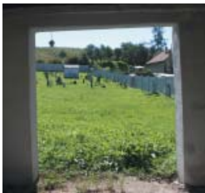
Celkový pohľad na cintorín.