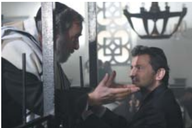
Ondřej Vetchý v roli otca.

( Nedodržaný slub , Produkcia: Genta Film s. r. o. Scenár: Ján Novák, réžia: Jiří Chlumský, kamera: Ján Ďuriš.)