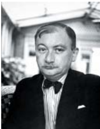
Joseph Roth v roce 1935.

proto, že už neexistuje úplná integrita a soudržnost světa proti zběsilosti exilu, integrita malého štetlu představujícího organický mikrokosmos, sám o sobě harmonický i ve své objektivní bídě, tedy mikrokosmos poskytující, byť v minimální míře, ochrannou přítomnost univerzálních