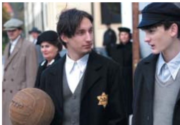
Hlavný hrdina (napravo) s kamarátom.

hľad na problematické stránky dejín Slovenska dostal do celovečerného filmového príbehu, asi je to prvýkrát, nespomínam si nič podobné. (Niektorí by snád v tej súvislosti citoval Obchod na korze , ale nazdávam sa, že je jemnejší a nemá takú výpovednú silu ako recenzovaný film.)