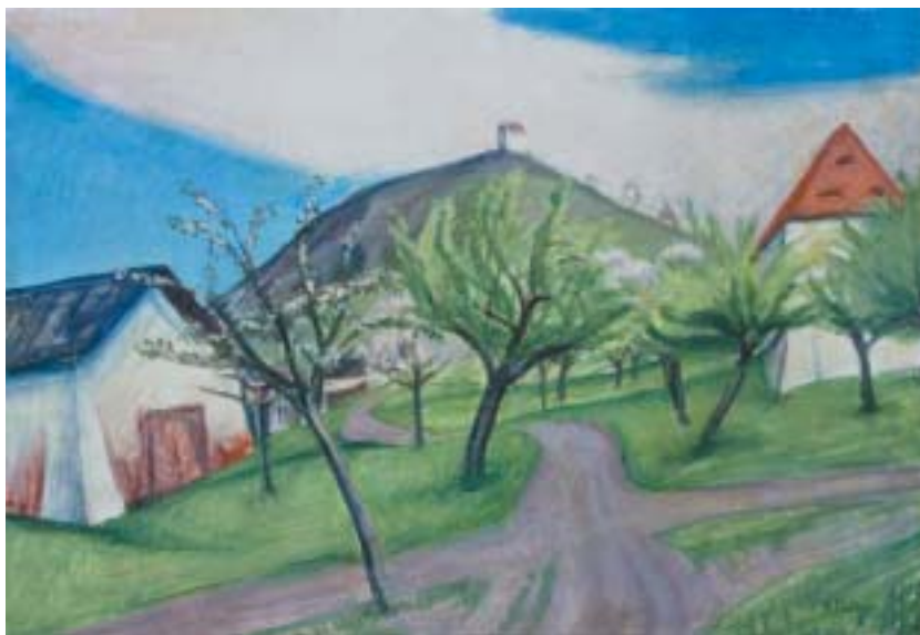
Jaro na Zebíně, kolem 1928. Olej na lepence, Muzeum a galerie Jičín.