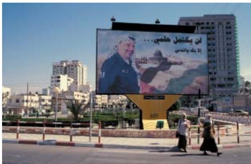
Vyřešme palestinský stát, a od toho se odvine i řešení ostatních problémů, hlavně Íránu.