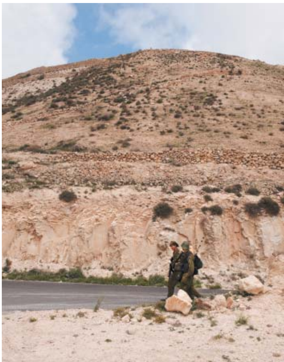
Fotografie Karla Cudlína k článku „Tři otázky“ na straně 3.

VĚSTNÍK ŽIDOVSKÝCH NÁBOŽENSKÝCH OBCÍ V ČESKÝCH ZEMÍCH A NA SLOVENSKU