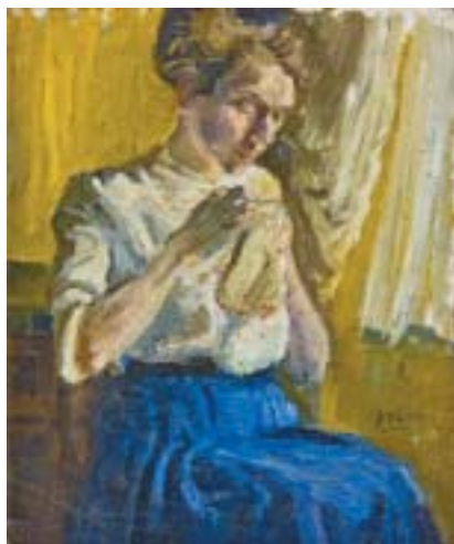
Portrét matky , kolem 1915. Olej na plátně, Muzeum v Lomnici nad Popelkou.

pohled jako dříve, ale zcela nehledaný záběr z okna, malovaný volnější rukou než v jeho předchozích obrazech. Fischerovy obrazy si vždy uchovávají úsporné malíř-