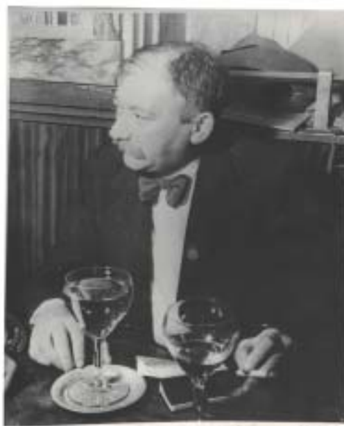
Joseph Roth v pařížské kavárně Tournon.

I z tohoto hlediska se Roth zřetelně odlišuje od dalších židovských laudatores vynášejících felix Austria, jako jsou Werfel nebo Zweig. Je zřejmé, že Židé, cizí národ mezi všemi, se hlásili s menšími obtížemi k nadnárodnímu státu, založenému, alespoň teoreticky nebo částečně, na překoná-