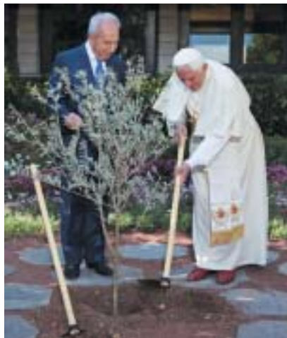
Benedikt XVI. a Šimon Peres sázejí stromek v zahradě prezidentského paláce v Jeruzalémě.