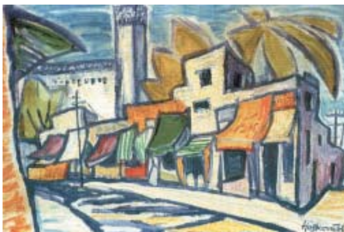
Haifa , olej na plátně, 1968.