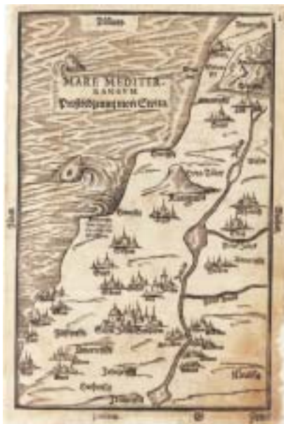
Mapa Svaté země v době příchodu Izraelitů, jeden z exponátů výstavy Cesta života . Praha 1592.