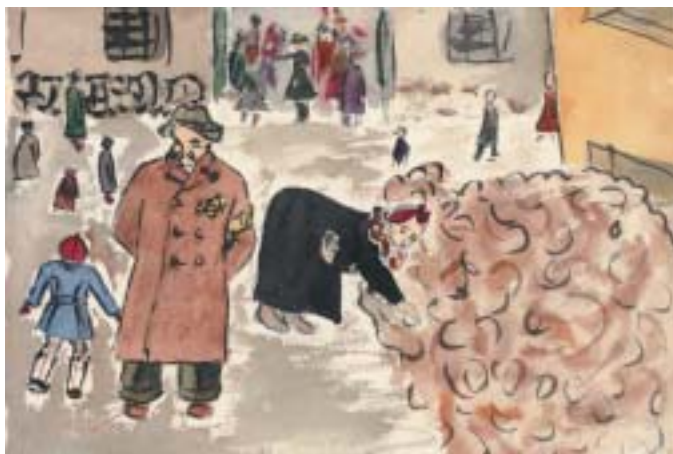
Sbírání odpadků , akvarel, Terezín, 13. 12. 1942.