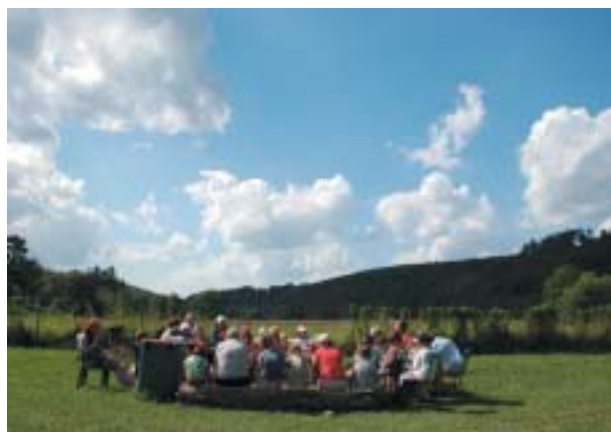
Letošní letní tábor pro židovské děti.