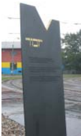
Pamětní deska památníku.

Vlak, který před sedmdesáti lety v půl deváté ráno vyjel z nádraží v Ostravě-Přívóze a jehož cílovou stanicí bylo Nisko nad Sanem, má v historii selhání evropské civilizace, kterému říkáme holocaust nebo také šoa, pochmurné privilegium. Byl to první z vlaků, které během druhé světové války ve stále větším počtu vyjížděly ze všech evropských zemí, obsazených nebo kontrolovaných německými nacisty a měly za úkol dopravit Židy „na východ“. Východ, to byla Osvětim, Treblinka, Majdanek, Sobibor... Vůbec poprvé se ale v tomto kontextu objevilo Nisko.