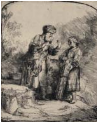
Rembrandt van Rijn: Abraham a Jicchak.

(1M 18,19). Takže není divu, že v očích Jicchaka byl otec Abraham hlavně rozhodná a tvrdá osobnost.