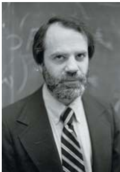
Saul Aaron Kripke.

Je zřejmé, že Maimonides a Spinoza by měli být zahrnuti na jakémkoli seznamu židovských filosofů. V tomto článku bych chtěl ukázat, že existují židovské způsoby filosofické argumentace, které vznikly v náboženských souvislostech, ale nejsou na nich závislé a mohou být používány a byly používány v sekulárních filosofických souvislostech bez jakýchkoli náboženských předpokladů. Filozofové s židovským vzděláním, kteří znali tyto způsoby argumentace z židovského náboženského kontextu, je „exportovali“ do obecné filosofie, když čelili problémům, které mohli vyřešit právě užitím varianty těchto tradič-