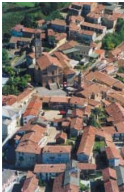
Střed městečka Castagnole Monferrato.

Stařec mlčí, nalévá mně i sobě další skleničku vína, zvedá ji, prohlíží si ji proti světlu, mocně upíjí a hladí si kníry – podle nyní ještě výraznějších vrásek na čele a trochu nepřítomného pohledu by se zdálo, že se snaží vzpomenout si na něco dávného. Potom několikrát pomalu a ze široka kyne rukou, jako by říkal „a teď mě poslouchej“, a spouští: „Vy Židé jste stvoření jako my.“ Naslouchám kmetově rozvážné řeči. Rukou opisuje nad hlavou kruh, jako by chtěl obhádnout celé stavení, a říká: