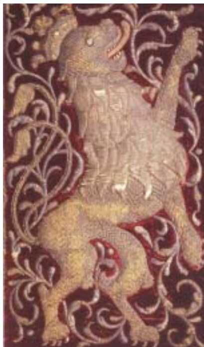
Detail opony, 1740, ŽMP. Z katalogu výstavy.

kulově v l. 1772–78) a racionalističtí židovští autoři 19. století, kteří byli zaujati proti vážnému studiu kabalistických děl (a také proti chasidismu), přecházeli Maharalovu osobnost až na výjimky téměř bez povšimnutí; pro nečetné historiky židovské mystiky se jeho dílo zase příliš odlišovalo od literatury vycházející z klasické safedské mystické školy (Moše Cordovero, Šelomo Luria aj.). Teprve v minulém století začali někteří autoři, především ti, kteří měli blízko k chasidismu (Martin Buber, Geršom Scholem), věnovat Maharalovi více pozornosti. Po