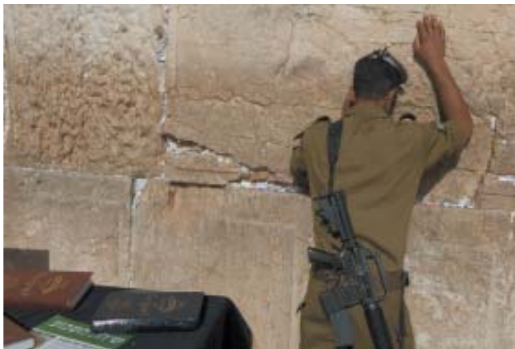
Máme se jen modlit, nebo se také vrátit ke strategii prevence?