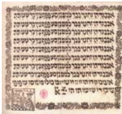
Abeceda pro židovské školy v Čechách, 18. století.

ly, vychovávat k tomu, že nesmí existovat nenávisť.“