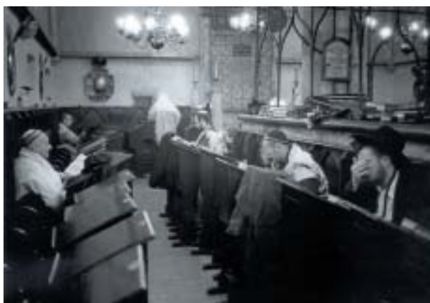
Ranní modlitba ve Staronové synagoze.

1/ Bez obav se hlásit ke své židovské víře a v ní klidně vychovávat naše čtyři děti.