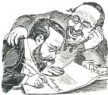
Dobová karikatura.

Zloba demonstrantů byla namířena proti vládě, Němcům a také, jak tomu bývá, proti Židům. Jazykové záležitosti byly mimořádně neuralgickým bodem česko-německých sporů, v očích Čechů a Němců už jen volba jazyka znamenala volbu jedné či druhé nepřátelské strany a Židé v českých zemích, kteří museli volit mezi němčinou a češtinou, se ocitli mezi dvěma mlýnskými kameny. Tak se mohlo stát, že když se poměry vyostřily, označovali je Němci za spojence Slovanů a Češi zase za spřísežence Němců. Jen jednou se