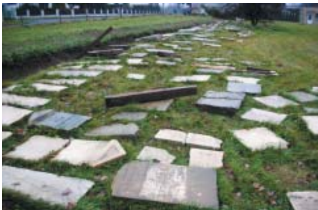
Nalezeno bylo 62 kamenů, 130 zlomků a množství drobných fragmentů.

Židovské hřbitovy v českých zemích z velké většiny vlastní a spravuje buď Federace židovských obcí v ČR, nebo některá z de-