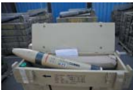
Munice nalezená na lodi Francop.

společnosti, ale pod vlajkou karibského souostroví Antigua a Barbuda. Globalizace jedna báseň. V noci ze 3. na 4. listopad na ni vtrhne izraelské námořní komando (jednotka Šajetet 13). Jedenáctičlenná posádka zprvu neví, co se děje, ale když se ukáže, že deklarovaný náklad jen maskuje kontejnery se stovkami tun výzbroje, nechá se snadno přesvědčit ke spolupráci a za izraelského doprovodu zamíří do přístavu Ašdod. Tak končí operace „Čtyři druhy“.