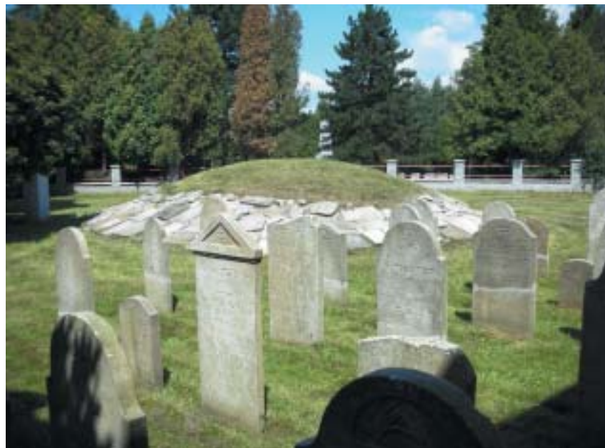
Pohled na částečně obnovený hřbitov s mohylou nad ostatky v pozadí.

Jenže Německo, do kterého se vraceli a v němž po dalších sedm let setrvali, bylo jiné než to, ze kterého odešli; bylo