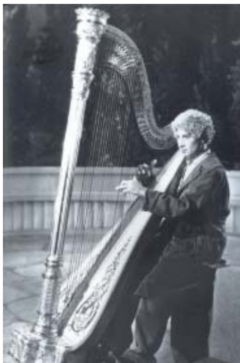
Harpo ve filmu Animal Crackers , 1930.

Když se s harfou pěkně zachází, má měkký tón, který se moc nerozléhá. Když se na ni hraje jemně, musí být v sále úplně ticho, jinak by ji nikdo neslyšel. Obe-