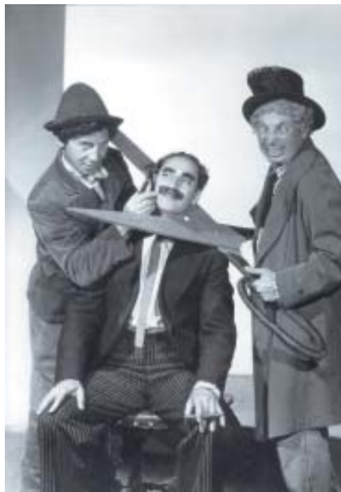
Chico, Groucho a Harpo, 1935.

Chico se mi rychle podíval přes rameno do karet. Dal mi znamení, abych netáhl, pak rychle obešel stůl a zmizel zadním východem. Čekal jsem. Za půl minuty