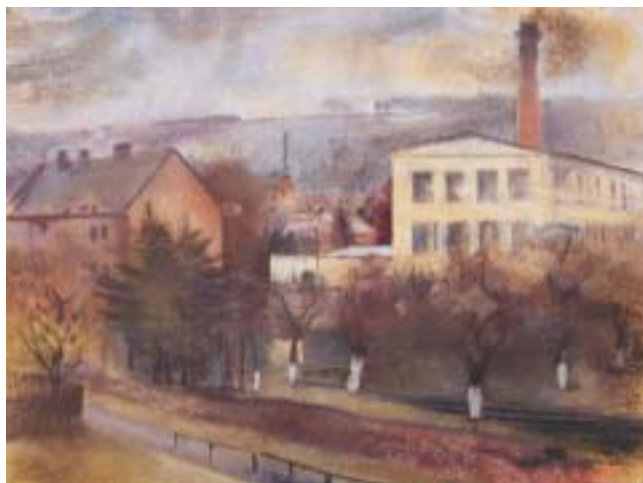
Friedl Dicker-Brandeisová: Hronov , pastel, 1938/42.

Friedl Dicker-Brandeisová bydlela na chodbě ve druhém patře dívčího domova v L 410, kde působila nejvíce, a zde také třídila a shromažďovala kresby svých svěřenců do dvou kufrů, které schovávala pod postelí. Po osvobození byly nalezeny na půdě L 410. Právě díky Friedl se dochovala proslulá sbírka dětských kreseb z Terezína (dnes v pražském Židovském muzeu), zcela unikátní soubor, který patří k nejpů-