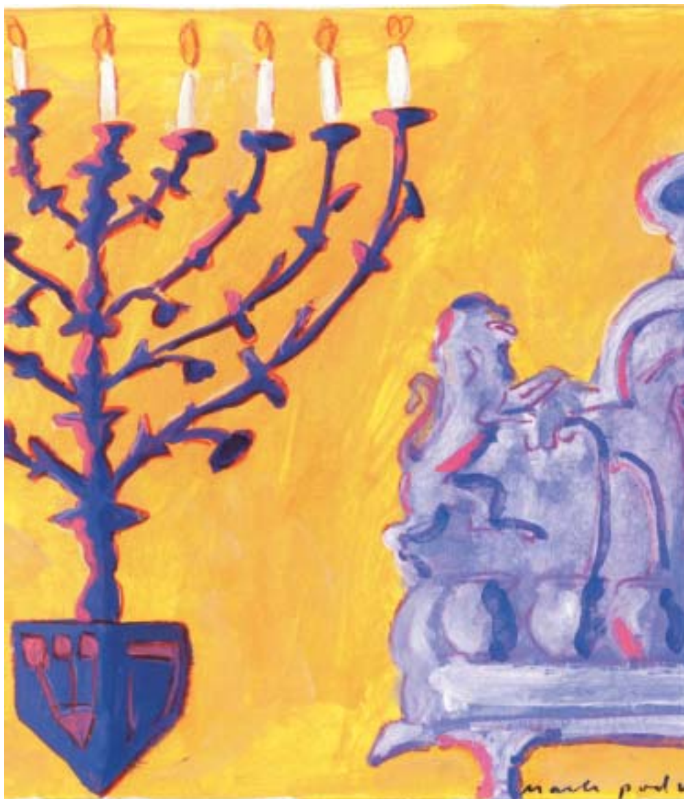
Mark Podwal: Chanuka , 2001.

VĚSTNÍK ŽIDOVSKÝCH NÁBOŽENSKÝCH OBCÍ V ČESKÝCH ZEMÍCH A NA SLOVENSKU