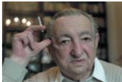
Marek Edelman.