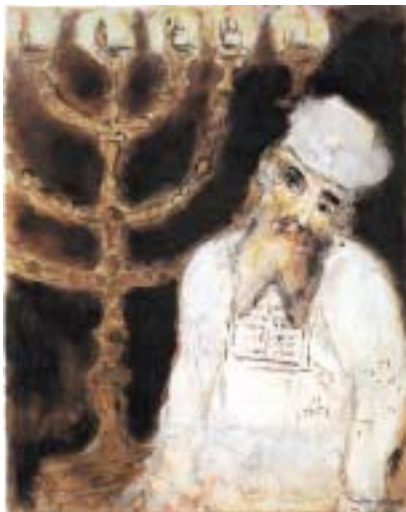
Marc Chagall: Aron před sedmiramenným svícem.

dla svému otci terafim – bůžky, kteří podle ní měli patřit Jakobovi. Jakob však své původní prohlášení před Labanem – „U koho však nalezeš bůžky své, (ten) nezůstane živ...“ (1M 31,32) – nezmění ani tváří v tvář smrti milované manželky.