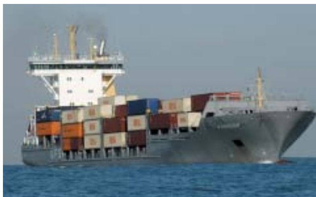
Loď Francop, kterou Izraelci zadrželi.

O jednom důležitém posunu se však Melman nezmiňuje. Když Izrael – na zákla-