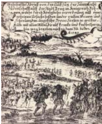
Anonym: Vyhnaní Židů z Prahy v r. 1745, mědiryt (výřez).

např. připomíná, že v y p o v í d a c í m u ediktu předcházel útoky pražských cechů proti konkurenci v ghettu, k vypovězení přispěly zřejmě také neúspěchy mezinárodní a vnitřní politiky Marie Terezie, která se po válečné porážce neodvážila plně potrestat ani přímou „velezradu“, které se dopustila většina české šlechty tím, že holdovala bavorskému