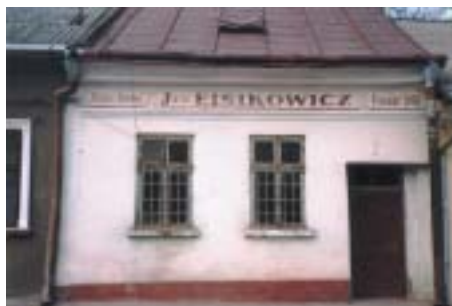
Firemní štít z bývalého štetlu.

Židovské osídlení Černovic bylo od počátku 19. století soustředěno zhruba mezi náměstím a pozdější železniční tratí. Jeho páteř tvořila ulice zvaná dříve Synagogy, dnes Barbjuse (podle spisovatele Henriho Barbuse), na niž navazovalo několik dalších uliček, což dohromady ve své době mohlo představovat typický východoevropský židovský štetl. Dnes je však již většina někdejšího koloritu, neřku-li atmosféry, nenávratně setřena. Jednu z malých výjimek tvoří domek v ulici Barbjuse 15 s originálním štítem firmy Eisikowicz. Nedaleko odtud stojí někdejší synagoga Chevra Tilim,