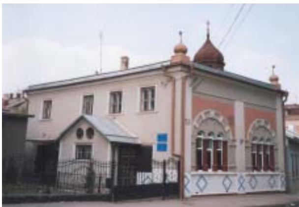
Jediná funkční synagoga v ulici L. Kobilicy 53.

Na nejvýchodnější výspě někdejší rakouské monarchie, na březích řeky Prut, leží město Černovice. Písemné zmínky o něm máme až z roku 1408, opevněné sídlo zde ale existovalo už ve 12. století (osídlení tu vzniklo při dálkové obchodní cestě z moldavské Suceavy do polského Lvova). V průběhu staletí město vystřídal mnoho majitelů a identit a není divu, že si až do