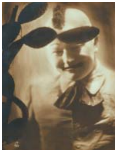
Jan Werich, 1931.