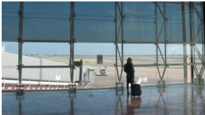
„Balila jste zavazadlo sama?“

„Balila jste zavazadlo sama?“ – „Ne.“ „Jaký je důvod vaší cesty do Izraele?“ – „Dovolená.“ „Jste vdaná?“ – „Ne.“ „Cestujete sama?“ – „Ano.“ „Je to vaše první cesta do ciziny?“ – „Ano.“ „Máte příbuzné v Izraeli?“ – „Ne.“ „Hodláte se v Izraeli s někým setkat?“ – „Ne.“