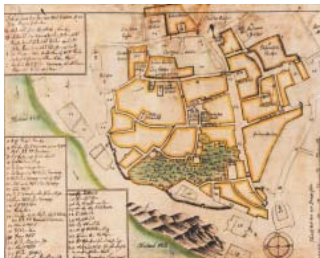
A. B. Klausner: Plán Židovského Města v Praze v roku 1690.

pohani. Cesta k vytvoření člověka je delší, protože v takovém případě jsou příslušné instrukce obšírnější – ale vzhledem k tomu, že se vejdou do každé lidské buňky, nemůže jich být dohromady zase tolik a rabín Arje tohle věděl, neboť kolem sebe viděl přicházet na svět