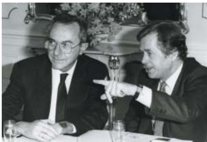
Moše Arens a Václav Havel v roce 1990 při jednání o obnově diplomatických styků.

Po Goldstückerovi jsme měli styky na úrovni chargé d'affaires, zatímco Izraelci se nějaký čas ještě snažili udržet v Praze své vyslance. Celkově Izrael o nějaké