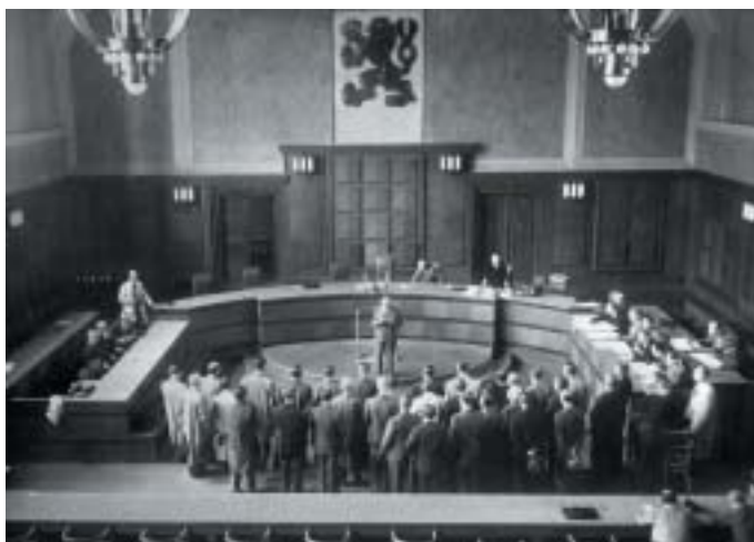
Přísaha lidových soudců v pankrácké věznici v Praze. 1. září 1945.

zkrácených procedur, podobně jako na válečném poli či za situace občanských nepokojů. Jak se později ukázalo, exiloví politici plánovali situaci, jež nikdy nenastala. Soudy začaly být oficiálně zřizovány teprve dva měsíce po skončení ozbrojeného konfliktu. Navíc v českých zemích řádění záškodnických band nebylo nepřátelské