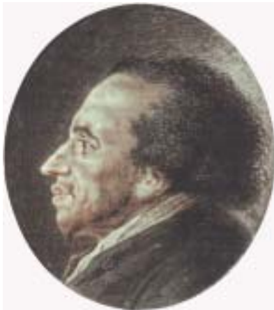
Moses Mendelssohn, zvaný Moses z Desavy; rytina kol. 1780.