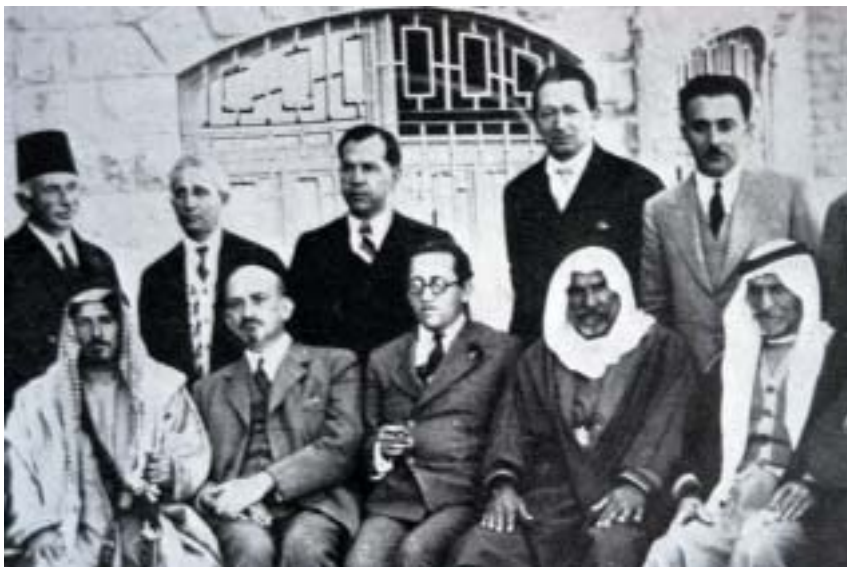
Chaim Arlosoroff (sedící uprostřed vedle Ch. Weizmana). Foto z jednání zástupců jišuvu a Arabů v r. 1933.

Vždycky se mi zdálo nezbytné přesvědčit se na vlastní oči, co se kolem děje, nezbytné pro vlastní obnovu a pro nové myšlenkové podněty. Toho je možné dosáhnout pobytem