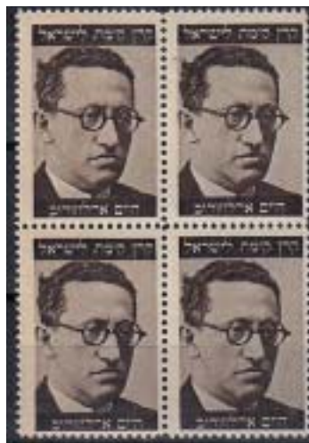
Arlosoroff na pamětní známce KKL.

Dnes už prakticky nikdo neusiluje o to, aby se z Izraele stal komunistický stát. Vraždu Arlosoroffa jako předobraz vraždy Jicchaka Rabina tak ale možné vnímat je. Velká část levicových Izraelců si stále myslí, že za jeho smrt je zodpovědná pravice. Bezpečně dokázáno je však jen jedno – podezřelí, kteří byli v roce 1933 zatčeni a souzeni, vrahy nebyli.