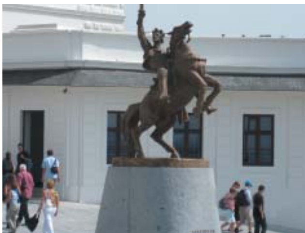
Jazdecká socha „kráľa starých Slovákov“ Svätopluka.

Na čele Slovenskej pospolitosti stojí osoba, ktorú oslovujú titulom „vodca“. Na internetovej stránke možno nájsť vyhlásenia SP, stanov, „prejavy vodcu“, symboly, množstvo fotografického materiálu a iné dokumenty dokazujúci ideovú prepojenosť SP so slovenským fašizmom rokov 1939 až 1945. V novembri 2008 podniklo Ministerstvo vnútra SR právne kroky proti Slovenskej pospolitosti a následne ju rozpustilo. Tento právny úkon sa však dotýkal len politickej strany, nie občianskeho združenia. Počas parlamentných volieb r. 2010 sa politická činnosť SP presunula do