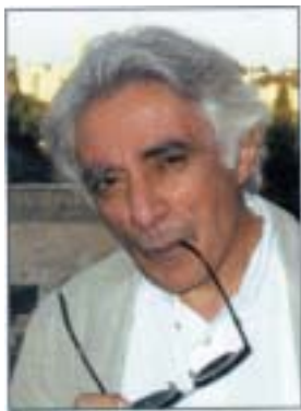
Tobie Nathan.

Rozhovor se spisovatelem a diplomatem Tobiem Nathanem