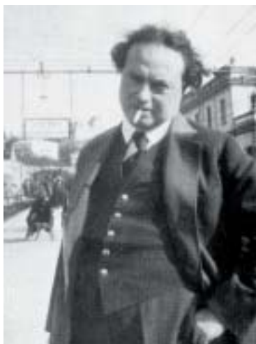
Franz Werfel v Santa Margheritě, asi v r. 1929.

Zdá se, že měl zvláštní schopnost a nadání patřit všem, a tak se dá pochopit jeho povzdech, že nemá nikde kořeny. Tedy alespoň, pokud je adresován jeho femme fatale, které by se jistě nelíbila vzpomínka (vedená v duchu poláčekovského bonmotu „Žid patří do kavárny“), již zaznamenal ve své skvělé knize Franz Werfel /Příběh života/ P. S.