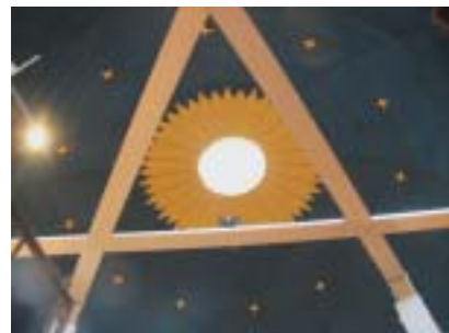
Kopule synagogy s obnovenou výmalbou.

náměstí a nové radnici. Náhradou nechal kníže Franz Židům z Wörlitzu a Oranienbaumu v letech 1789/90 vystavět na své náklady novou synagogu, která byla umístěna na kraji městečka, ale současně měla tvořit jednou z dominant vstupu do přírodního parku. Architekt Erdmannsdorff postavil synagogu na umělém pahorku jako