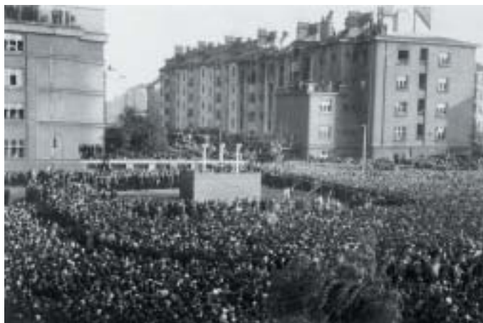
Veřejná poprava Josefa Pfitznera, které přihlíželo na 30 000 diváků. 6. září 1945.

ní soud konstatoval, vykonával všechny příkazy, které mu byly dány, a obzvláště ty, jež se týkaly protižidovských a protikomunistických opatření. Důsledné plnění zadaných úkolů nakonec Starinského vyneslo v roce 1941 do čela Ústřední státní bezpečnosti, kde mimo jiné dohlížel také na nechvalně proslulou slovenskou věznic v Ilavě. Byl odpovědným za výsledky politických vězňů