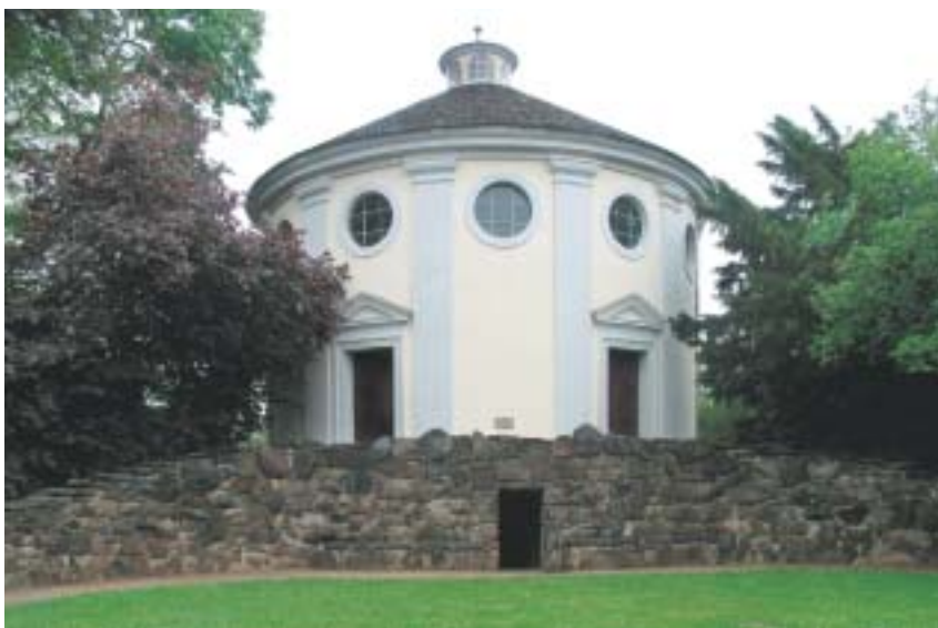
Synagoga ve wörlitzkém parku; pohled ze západu se vstupem do mikve v suterénu.

Zatímco z východní strany se synagoga tyčí nad jezerem jako dominanta přírodního