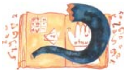
Kresba Mark Podwal