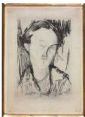
Autoportrét, kresba 1915.

Na závěr: Kdyby byla výstava umístěna v komornějším prostředí, třeba i s menším