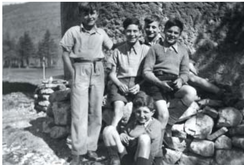
Ohrožení židovští chlapci v dětském domově La Hille v létě 1942. V době prvních transportů na východ (1942 až 1943) se jim podařilo s pomocí aktivistek Švýcarské dětské pomoci a francouzských odbojářů přejít hranice do Španělska nebo do Švýcarska.

Švýcaři se snažili osvobodit z internačních táborů co nejvíce dětí a dospělých