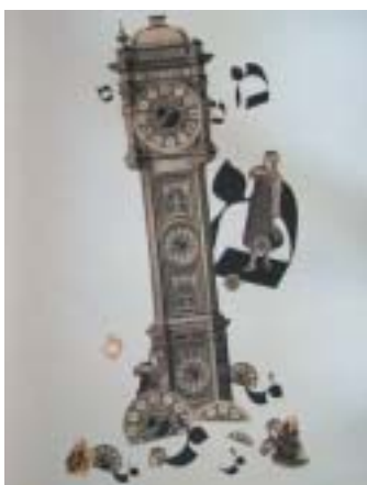
Pavel Holeka: Mem.

umožňuje spatřit ucelenou kolekci všech originálních ilustrací. Publikaci, oceněnou jako Nejkrásnější česká kniha r. 2009, bude možné zakoupit. Vstup volný. Výstava je pro veřejnost přístupná po–čt 10–15, pá 10–12, během večerních programů a po domluvě.