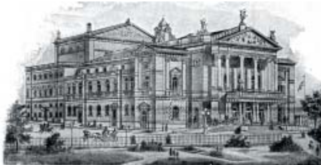
Das Neue Deutsche Theater (Landhaus) am 1. Juli 1889.