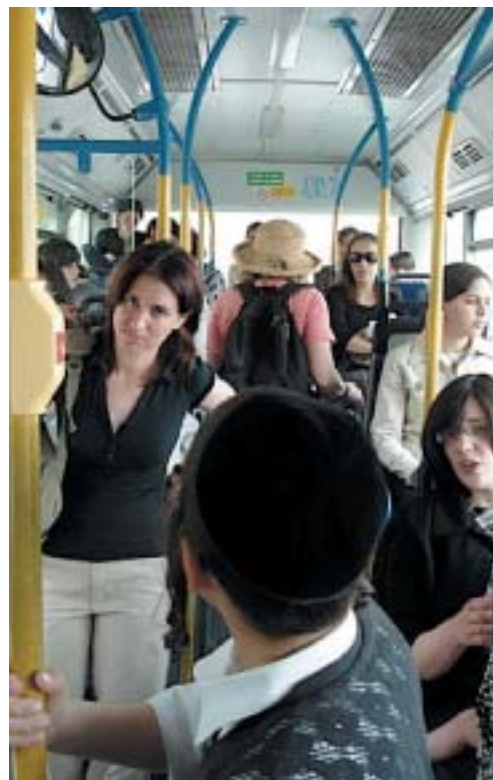
V autobuse mehadrin.

Na základě této petice přijal Nejvyšší soud 6. ledna ono šalamounské řešení: linky mehadrin sice formálně zakázal, ale povolil stav, kdy se cestující na určitých linkách segregují podle pohlaví sami a dobrovolně. (Na každém autobusu dotyčného přepravce pak musí být nápis: „Každý pasažér smí obsadit jakékoli místo podle své volby. Bude-li v této věci znepo-