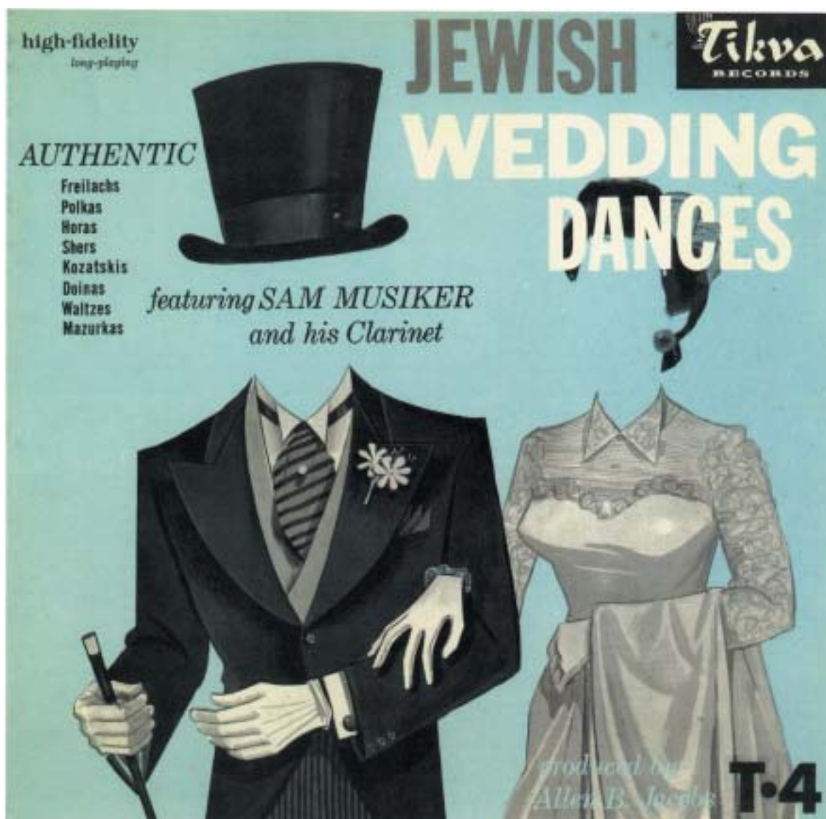
Obal gramofonové desky Židovské svatební tance , Tikva Records, 1960.

VĚSTNÍK ŽIDOVSKÝCH NÁBOŽENSKÝCH OBCÍ V ČESKÝCH ZEMÍCH A NA SLOVENSKU