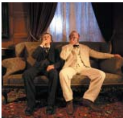
Záběr z filmu Mahler na pohovce.