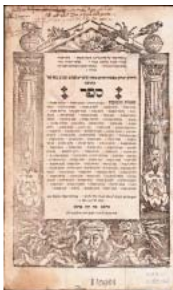
Titulní list z pražského tisku Meirových respons.

Pro Židy mohla být nová situace často relativně příznivá – při rozdrobenosti německého území umožňovala usadit se