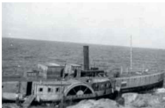
Loď Pentscho po ztroskotání.

Britové vyslali radiogram, na jehož základě byl zbytek transportu na ostrově zachráněn. Když dostávám otázku, co považuji za svůj nejzáslužnější čin svého života, odpovídám, že je to skutečnost, že jsem se vydal v záchranném člunu pro pomoc na Krétu. Nebýt toho, tak by ti lidé na ostrově zahynuli žízni a hladem.