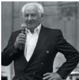
Arnošt Lustig.