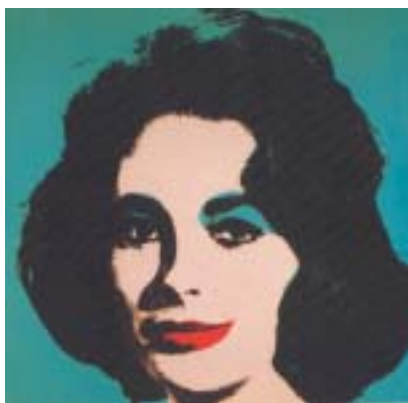
Andy Warhol: Elizabeth Taylor, 1961.