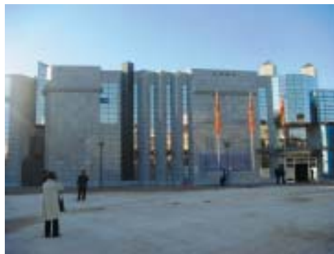
Budova památníku.