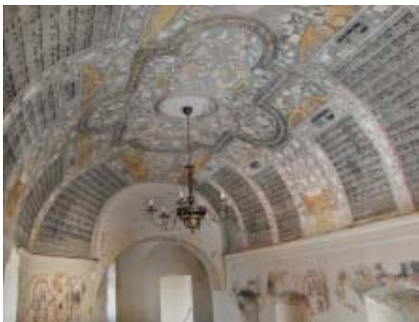
Boskovice, výzdoba západní galerie pro ženy (1704–5). Foto D. Cabanová, 2001.

Spolu s četnými uprchlíky za Chmelnického povstání zasáhl nový výzdobný styl také na Moravu, kde se ve své nejdokonalější podobě uplatnil v Boskovicích (1657–1667, 1704–1705), Dolních Kounicích (po 1656), Třebíči (1705–1707), Holešově (1737) nebo Úsově (1785). V Čechách se