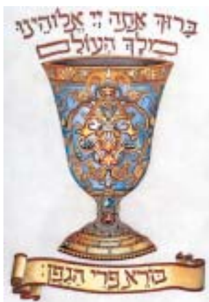
Ilustrace z pesachové Hagady ha-jovel.

vstupné 50 Kč. Více o nedělních dílnách na www.jewishmuseum.cz/vkc .