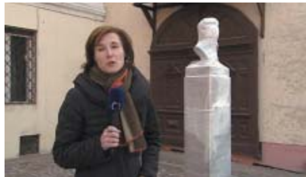
Zahalená busta Ferdinanda Ďurčanského.

Po vojne Esterházy protestoval u Gustáva Husáka proti kolektívnym protimaďarským opatreniam. Husáková reakcia bola, že ho dal zatknúť a vydal ho sovietskym orgánom, ktoré ho podľa svojich zvyklostí odsúdili na desať rokov nútených prác a odviekli do sovietskeho gulagu. V jeho