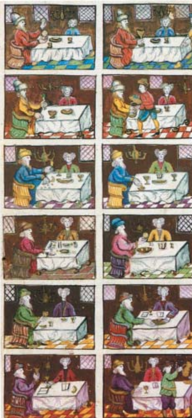
Seder, výjev z Kolínské hagady, 1739.