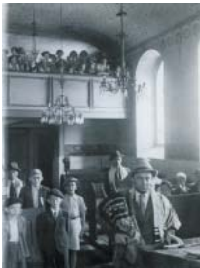
Děti v synagoze v Černovicích, kol. 1935, soukr. sbírka.

Nová výstava v Galerii Roberta Guttmanna