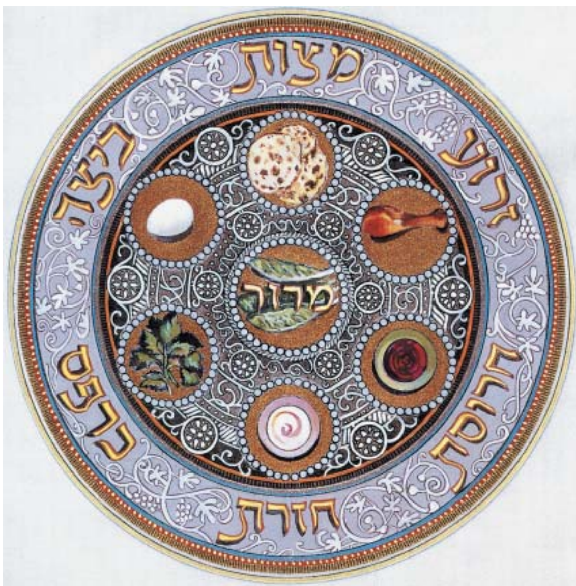
SEDEROVÝ TALÍŘ (Ilustrace z Hagady ha-jovel le-Jisrael)

VĚSTNÍK ŽIDOVSKÝCH NÁBOŽENSKÝCH OBCÍ V ČESKÝCH ZEMÍCH A NA SLOVENSKU