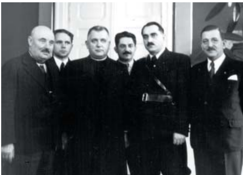
Zloženie 2. autonómnej vlády 1938–39 (zľava): minister spravodlivosti Miloš Vančo, minister školstva Matúš Černák, predseda vlády Jozef Tiso, minister dopravy a verejných prác Ferdinand Ďurčanský, podpredseda vlády Karol Sidor a minister financií, obchodu a poľnohospodárstva Pavol Teplanský.

„Chápeme, že potláčať verbálne prejavy čohokoľvek je ťažké, avšak jasne vidíme, že tolerovanie protižidovských výrokov na štadiónoch vedie k zvýšenej agresivite fanúšikov, ktorí hľadajú hranice, po ktoré môžu beztriestne postúpiť. Sme presvedčení, že koordinovaná snaha Polície SR a predstaviteľov futbalových klubov môže úspešne viesť k potlačeniu masových prejavov antisemitizmu na štadiónoch na marginálnu úroveň. Chýba nám však zo strany spomenutých