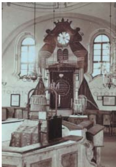
Synagoga v Janovicích nad Úhlavou, 1915.

Synagogy bývaly zdobeny mozaikami nebo malbami již ve starověku, jak dokazují četné archeologické nálezy synagog z 1. až 7. století v Izraeli a celém východním Středomoří. Nejstarší zprávy o novověkých malovaných synagogách však pocházejí z Polska, kde židovští malíři rozvíjeli italské renesanční vzory, přizpůsobovali je místní tradici a obohacovali židovskými motivy. Již v polovině 17. století byl systém synagogální výzdoby rozvinut do své klasické podoby, o čemž svědčí malované synagogy v Chodorově (1642) nebo Gwoździeci (1652). Zatímco klenby synagog byly zdobeny bohatou arabeskou spirálovitých rozvilin, stáječících se okolo hvězdicových květů spolu se symboly nebeské klenby nebo v kruhu s rozmístěnými znameními zodiaku, stěny koberecově pokrývala nápisová pole s texty hlavních hebrejských modliteb a Žalmů v ozdobných rámech. Tento způsob výzdoby se rozšířil po celém východním Polsku