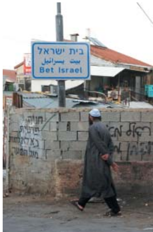
Rozšíření osad je krok, který sděluje, že útoky na civilisty a děti se nevyplácejí.

Za pozornost stojí i názory Bernarda Lewise. Tento doyen světové orientalistiky (v květnu mu bude 95 let), Žid narozený v Londýně a působící v USA, poskytl zásadní rozhovor listu The Jerusalem Post . Jak má Izrael, ptá se šéfredaktor David Horowitz, reagovat na změny v arabském světě? A Lewis doporučuje: vedle jaksi povinné opatrnosti hlavně vstřícnost. Tvrdí, že stále více Arabů pohlíží na Izrael s jistým obdivem k fungující svobodné a občanské společnosti a že jeden palestinský novinář