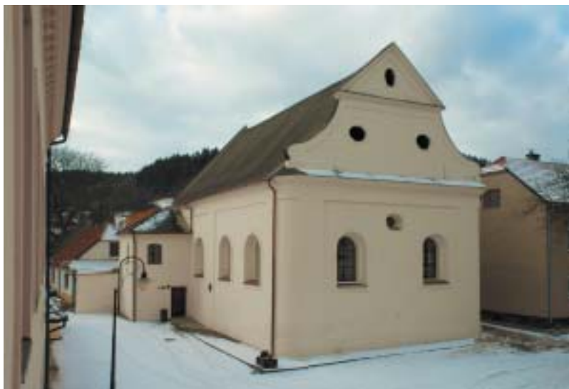
Lomnice, synagoga z roku 1785. Foto Jiří Stach, 2010.

U českých synagog 17. a 18. století však všeobecně převládala jednodolná podélná dispozice, sklenutá nejčastěji valenou klenbou s třemi páry lunet, kterým odpovídala tři vysoká půlkruhově zakončená okna po stranách a dvě ve východním průčelí. Tři klenební pole byla často oddělena klenebními pásy, které členily prostor synagogy na tři stejné části, dobře odpovídající tradičnímu využití synagogálního prostoru: vstupní západní část sloužila jako předšín (často s ženskou galerií v patře), ve střední části byla bima s pultem pro předčítání Tóry a sedadla rozmístěná podél bočních stěn, zatímco východní část byla určena pro aron ha-kodeš s přímým schodištěm a pultem pro kantora. Podobné třídílné členění vnitřního prostoru měla řada synagog