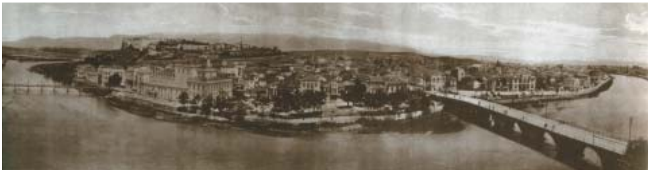
Pohled na Skopji s židovskou čtvrtí v popředí, 1930.

Bulharská vláda jednání s Němci, kteří chtěli zavést omezení pro bulharské Židy, protahovala. Když byla v srpnu 1942 v Bulharsku vyhlášena povinnost nosit Davidovu hvězdu, metropolit Stefan ve veřejném kázání ostře vystoupil proti perzekuci Židů.