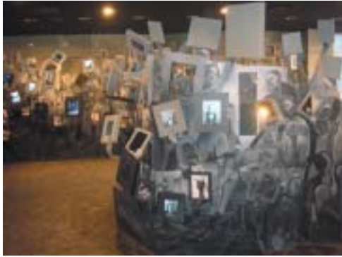
Památka makedonských Židů, pohled do expozice.

V roce 1998 slíbil makedonský prezident Kiro Gligorov, že stát vybuduje ve Skopji Muzeum šoa, aby připomněl osud Židů,