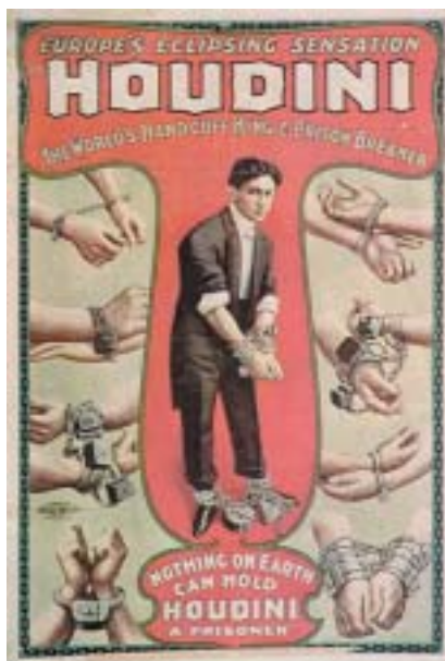
Plakát na evropské turné.

Není divu, že performer, jehož odvážné kousky spočívaly v překonávání tělesných a fyzikálních limitů, měl ohlas po další desítky let v oblastech od performance art a body art či literatury až po nejrůznější komerčně zábavní aktivity. Zábava je dnes obrovský byznys. Ale zkusme si vzpome-