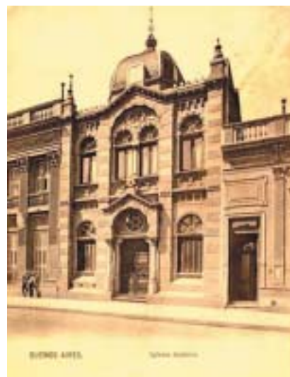
Synagoga v Buenos Aires, 1905. Dobová pohlednice.