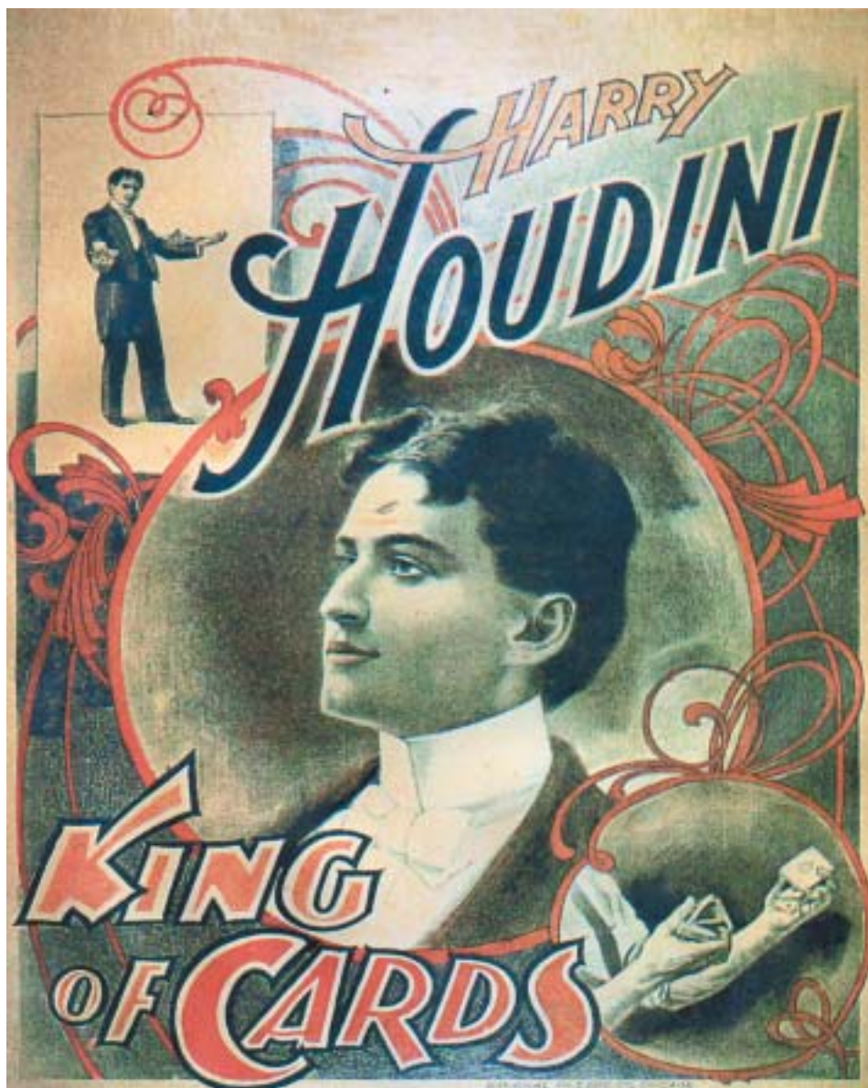
HARRY HOUDINI, KARETNÍ KRÁL (k článku na str. 16)

VĚSTNÍK ŽIDOVSKÝCH NÁBOŽENSKÝCH OBCÍ V ČESKÝCH ZEMÍCH A NA SLOVENSKU