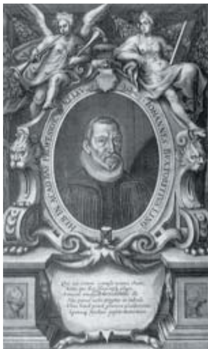
Portrét Johannese Buxtorfa (1564–1626).

roku vydal Buxtorf slovník hebrejských zkratk ( De abbreviaturis Hebraicis ). Tento spis vyšel později v rozšířené verzi péčí autorova syna Johanna Buxtorfa mladšího (1599–1664). Obě díla odrážejí nejen Buxtorfovu hlubokou znalost rabínské literatury, ale také vědomí historické změny v židovském náboženství. Například k rabínskému titulu morenu (doslova „náš učitel“) v pojednání o zkratkách píše: