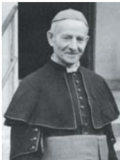
Spišský biskup Ján Vojtaššák.