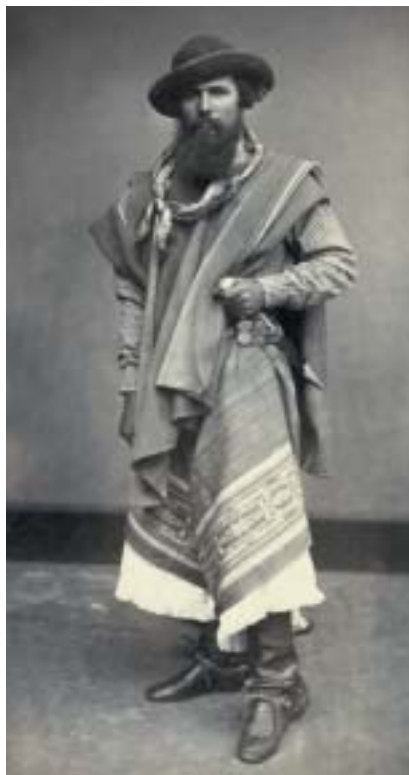
Legendární židovský gaucho, 1886.

Příliv Židů do měst dal podnět k vzniku nových náboženských, sociálních, výchovných apod. institucí. Židovský element se upevnil nejen v hlavním městě, kde vznikly