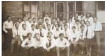
Židovští imigranti, 1929.

Dlouhá léta byl nejdůležitějším činitelem tohoto úřadu dokonce bývalý důstojník SS; to už bylo po válce, za vlády prezidenta-diktátora Juana Dominga Peróna (1946 až 1955). Tehdy se hranice otevřely (podle statistik v publikacích DAIA) pro 32 172 „uprchlíků před demokracií“, tedy nacisty různých národností. Celkem Argentina