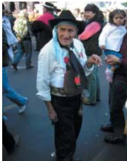
Židovský gaucho ještě nevmřel!