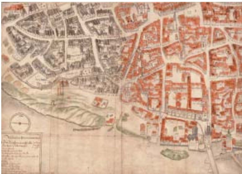
Tzv. křižovnický plán (Samuel Globic, kolem 1665) zobrazuje pražské Židovské Město v podobě, kterou mělo za života rabi Hellera. Červeně jsou vybarveny střechy patřící ke Starému Městu, černě střechy Židovského Města.

Nesmíme zamlčet, že Hellerova odpověď místokancléři ohledně problému Talmudu, křesťanství a modloslužebnictví byla diplomaticky opatrná, jak odpovídalo vysoce nebezpečné situaci. Tato odpověď se vyznačovala dokonce jistou výmluvností, nebyla však zdaleka upřímná. Ve svazku Maadanej melech z roku 1619