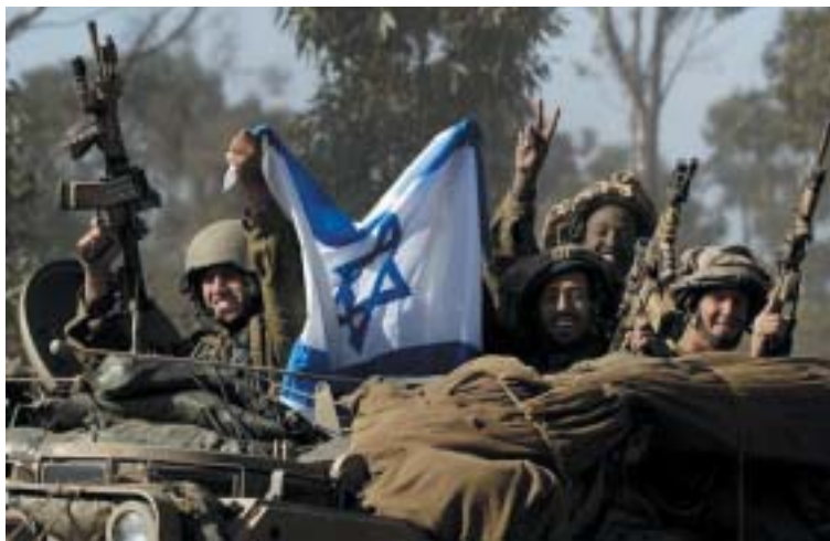
Cahal je armáda, která respektuje mezinárodní právo.

Nynější rozčilení se opírá hlavně o to, že nedůvěra k židovskému státu, jednou už