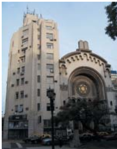
Hlavní synagoga a židovské centrum.