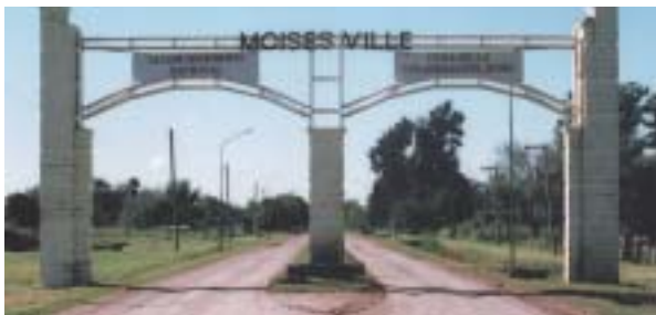
Brána první organizované židovské kolonie Moises Ville.

jako takový latinskému prostředí spíše cizí, byl vystřídán antiizraelskou orientací