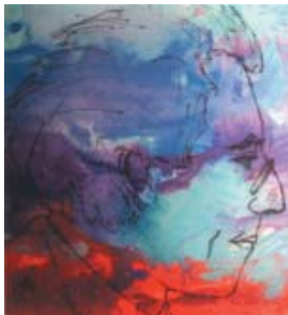
Gustav Mahler, kombinovaná technika.