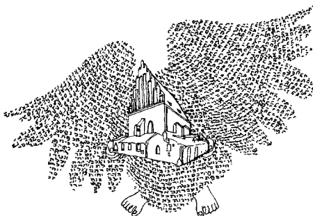
Svoboda znamená pohyb... Kresba Marcela Sidonová.

jim svobodu. Zločin byl podivný i proto, že pachatel neposkytl žádné potěšení (jako v případě styku s Midjánkami nebo orgiastických tanců kolem zlatého telete); vyjádřil tím jen trpký hněv a deziluzi.