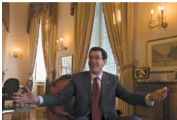
Norman L. Eisen.

Nejvíc si pamatuji na jomkipurovou válku, to už jsem byl starší. Sešli jsme se v synagoze a opravdu jsme se báli, že Izraeli hrozí bezprostřední zánik. Živě si pamatuji, jak jsme si v té synagoze povídali o tom, jak Izraeli pomoci, jak Spojené státy projevovaly své přátelství Izraeli a jak ho podporovaly.