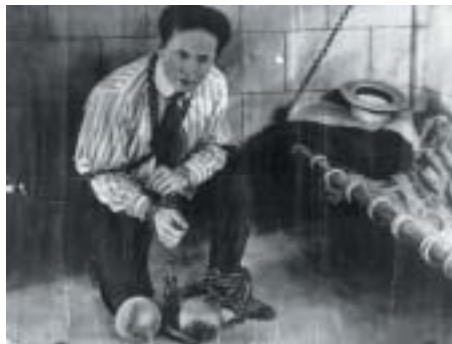
Houdini uniká z cely.