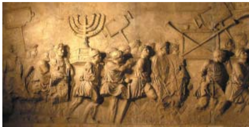
Levý reliéf oblouku: Židovští zajatci nesou sedmiramenný svícen a další trofeje z Chrámu.

převezen zpět do Jeruzaléma. Paul Veyne, francouzský archeolog a specialista na antický Řím, je toho mínění, že spočívá na mořském dně v úrovni Kartága. Po vydrancování Říma ho Vizigótové s ostatní kořistí naložili na loď, která pak při tažení do Afriky ztroskotala. Značně rozšířená je teze, podle které je menora stále ve Vatiká-