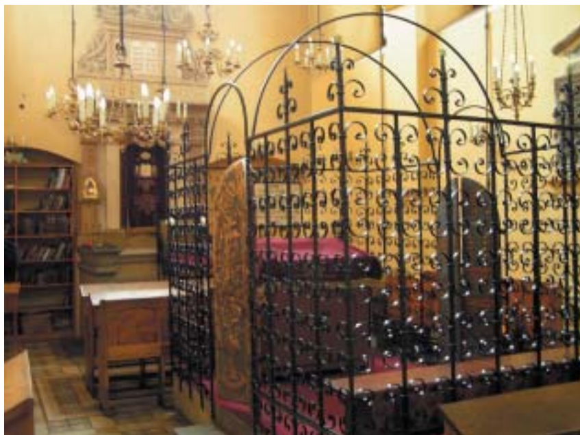
Interiér krakovské synagogy Remu, kterou Moše Isserles nechal postavit v roce 1553.

co se v něm podle popisu Mišny a Talmudu odehrávalo, jako symbolickou rovinu, odrážející jednak svět (makrokosmos), jednak každou jednotlivou lidskou bytost