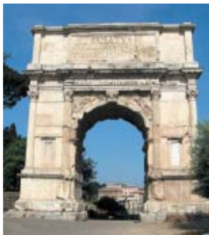
Titův oblouk na Fóru Romanu.

Také povídka Stefana Zweiga Pohřbený svícen není založena, jak Salomon Malka dokládá, pouze na fantazii slavného spisovatele. Podle některých historických pra-