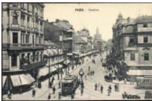
Příkopý – Graben, korzo německy mluvících Pražanů.

v heslech čteme o lidech, kteří byli mostem mezi kulturami předválečného Československa, i o těch, kteří hájili především zájmy svého národa. V lexikonu ožívají osudy lidí, kteří spo-