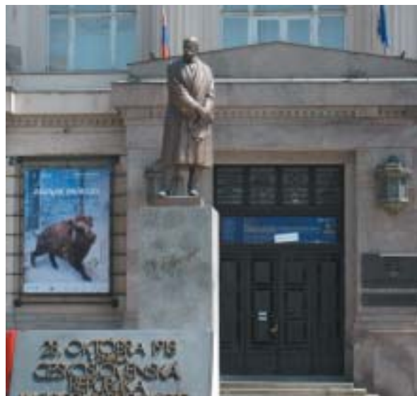
Pamätník československej štátnosti a socha T. G. Masaryka pred budovou Slovenského národného múzea.