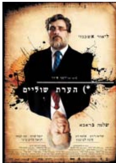
Plakát k filmu Poznámka pod čarou .

z dokumentů, které zahrnují muzejní archivy, a současně umožnit veřejnosti, aby tyto údaje neustále rozšiřovala. Na adrese worldmemoryproject.org se postupně objeví informace o více než sedmácti miliolech lidí, které postihla nacistická rasová politika a jejichž osudy má muzeum podchycené. Každý zájemce může poslat na zmíněnou adresu příběh své rodiny včetně fotografií.