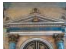
Áron ha-kodeš.

Většina lidí projíždí rovinu Pádu směrem k italskému jihu a jedině, co si přeje, je mít ji už konečně za sebou. Ale najdeme v ní ledacos, co stojí za zastávkou. Například komorní, krásnou a klidnou Sabbionetu, ideální město plné památek a s hezkou synagogou.