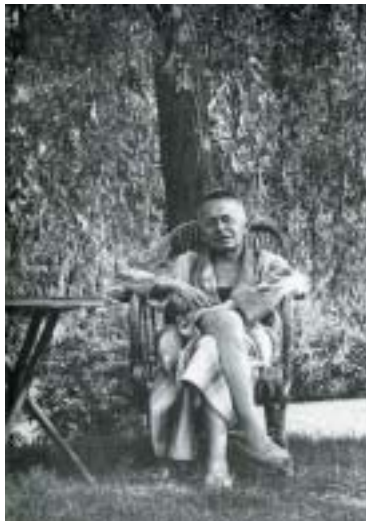
Šťastné dny v Janovicích (1933).

Do své rodné země se Karl Kraus často vracel, nejen na přednášky, jichž proslavil v Praze a Brně téměř šedesát. Jezdil především do Vrchotových Janovic; jeho dlouholetý vztah k majitelce tamního zámku a parku Sidonii Nádherné z Borutína patří k velkým evropským milostným příběhům a dodává obrazu tváře věčného ironika melancholický stín.