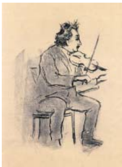
Emil Orlik: Albert Einstein hraje na housle . NY 1923.

zhlédnout i 18. června v Divadle pod Palmovkou. Kvůli ostatním akcím zašlete rezerviční e-mail na reservations@defiantrequiem.org.