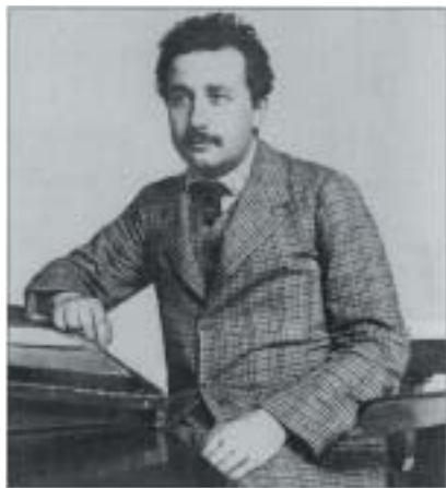
Albert Einstein před příjezdem do Prahy.

Slavný fyzik se stal brzy oblíbeným hostem úterních večerů v salonu Berty Fantové (1865–1918), mimořádně inteligentní a muzikální ženy, majitelky lékárny v pozdně gotickém domě U Jednorozce na Staroměst-