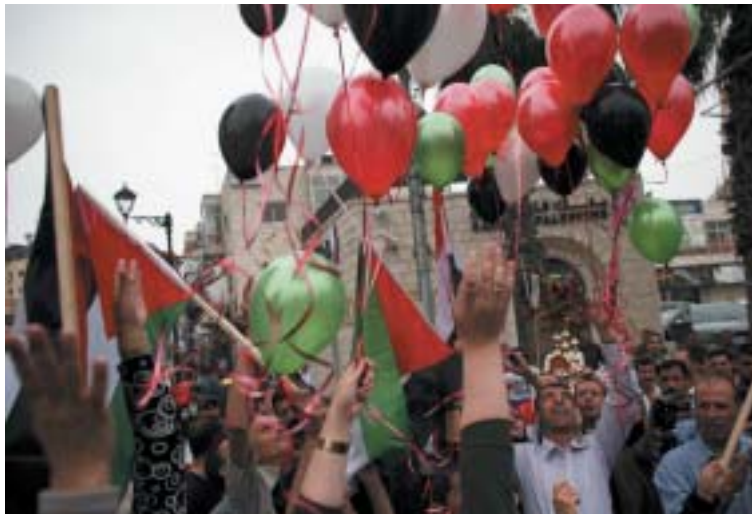
Konečně svoji!

Ano, zažili jsme to před dvaceti lety, když Saddám Husajn anektoval Kuvajt a právě Palestinci Jásira Arafáta patřili k hrstce těch, co stáli za agresorem Saddámem. Jenže ačkoliv se ocitli mimo světo-