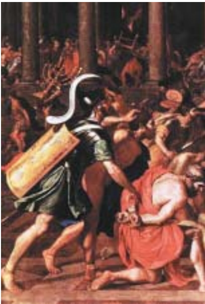
Detail Poussinova obrazu se svícenem.

A tvrzení, že svícen leží někde v obrovských depozitářích vatikánských muzeí? K tomu kniha uvádí, že oficiální