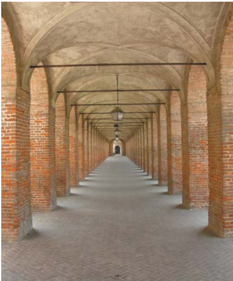
SABBIONETA: GALLERIA DEGLI ANTICHI (K článku na str. 15.)

VĚSTNÍK ŽIDOVSKÝCH NÁBOŽENSKÝCH OBCÍ V ČESKÝCH ZEMÍCH A NA SLOVENSKU