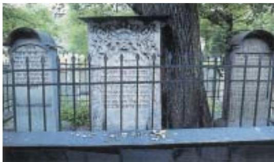
Hrob Moše Isserlese na Starém krakovském hřbitově.

kontrastu se zbožností spontánní, uskutečňovanou v modlitbě.