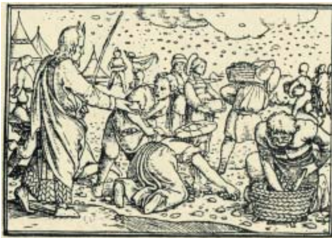
Izraelci reptají kvůli jídlu a Bůh jim sesílá mannu. Kresba Hans Holbein ml., 1538.

je příbuzné francouzskému „amour“, což znamená „láska“.