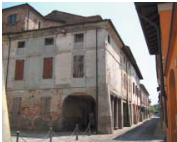
Budova na náměstí San Rocco se synagogou ve třetím patře.

Po smrti knížete Gonzagy žili Židé v městečku v různém počtu až do konce 19. století. Spontánně se (nikdy zde neexistovalo ghetto) soustředili do bloku domů mezi piazza San