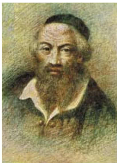
Moše Isserles, kresba z publikace Geonej Jisrael .

podle něž Tóru nelze chápat jako vyprávění profánních příběhů: „ Kdyby tomu tak bylo, i my bychom dnes uměli takovou Tóru ze světských vyprávění vytvořit. “ V souladu s tímto pojetím není Tóra literaturou, ale symbolickým sdělením hlubinných tajemství o Bohem stvořeném světě v jeho celistvosti. Charakter Tóry odráží polaritu a současně paralelnost dolního hmotného světa a vyšších duchovních světů. Aby mohlo zjevené tajemství o nehmotných rovinách stvořeného světa přetrvat ve