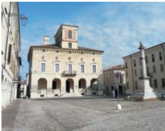
Sabbioneta: Knížecí palác na Knížecím náměstí.

Renesanční Itálie se svým ohromujícím rozvojem umění, písemnictví i architek-