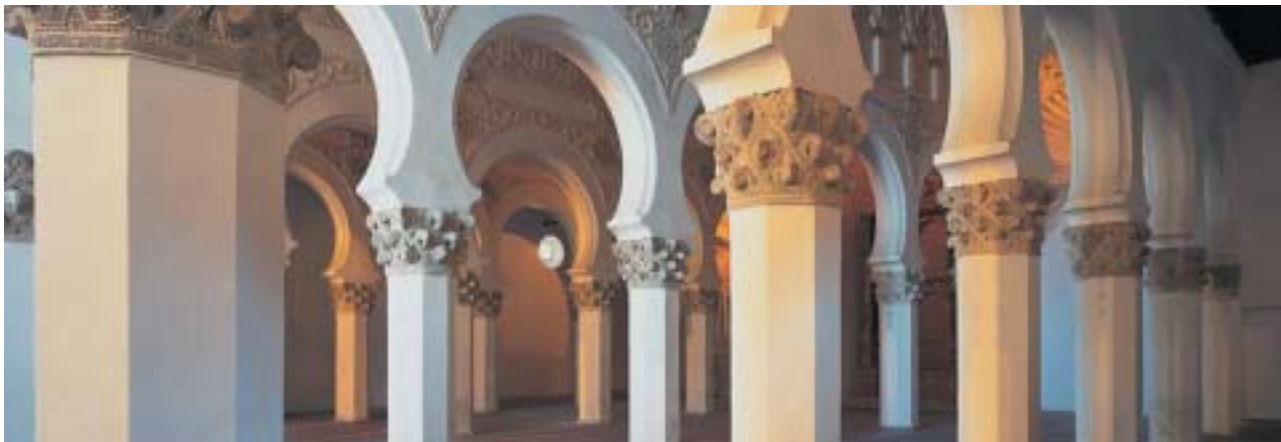
Pohled do bývalé toledské synagogy z konce 12. století, změněné v 15. století na křesťanský kostel.