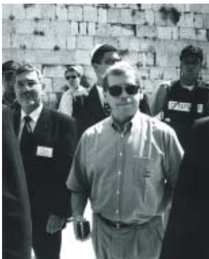
Václav Havel u Zdi nářků při druhé oficiální návštěvě Izraele. Foto Karel Cudlín, 1997.

Václav Havel patřil k lidem, kteří dobré vztahy mezi Čechy a Židy považovali za něco zcela normálního. Dokládá to i několik fotografií, které vybrala redakce Roš chodeš, a úryvek z Havlova poselství z února 1990.