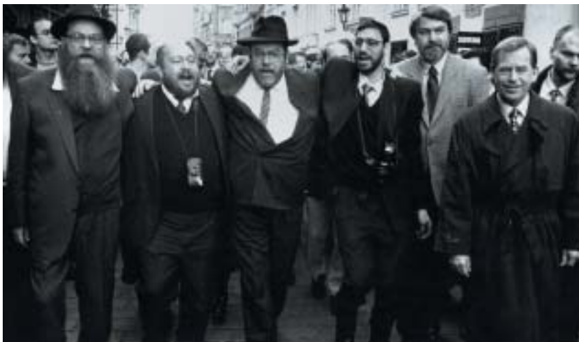
Mezi přáteli v Maislově ulici.

předchůdce T. G. Masaryka, který neohezkou vystoupil v aféře Hilsnerové a poté i Bejlisově. Riskoval svou popularitu, svůj časopis i své hnutí jen proto, aby byla zjištěna pravda. Podle jeho názoru každý, a zvláště malý národ musí mít mravní ideu, pro kterou žije a jíž přispívá k lepší souhře lidstva. Napsal: „Antisemitismus je podle mého soudu rána naše a vlastně jen naše, škodí nám, nás znemožňuje a zhrubuje...“ Jako prezident národa, který se právě zbavuje totalitního režimu, bych chtěl nakonec připomenout Masarykova slova: „Národ, který není v sobě mravný, pevný, politikou samou nemůže být spasen.“