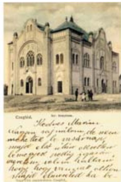
Synagoga v Czeglédu, Maďarsko, 1907.

Úspěšná výstava má již svoji historii – premiéru měla na jaře 2000 v zimní modlitelně ve Španělské synagoze. Odtud se vydala na cestu po střední Evropě. Téměř každý rok byla vystavována na jednom či několika místech a všude se těšila značné pozornosti. Hostovala v Lodži, Košicích, Kyjevě, Drážďanech, Berlíně a v Chemnitzu. Cestu na jih zahájila v Budapešti, následovala repríza v Miškolci, Skopji, kde byla vystavena v nově otevřeném památníku šoa, a v obnovené synagoze ze 14. století v Mariboru. S podporou Ministerstva kultury ČR byla výstava v roce 2007 uspořádána