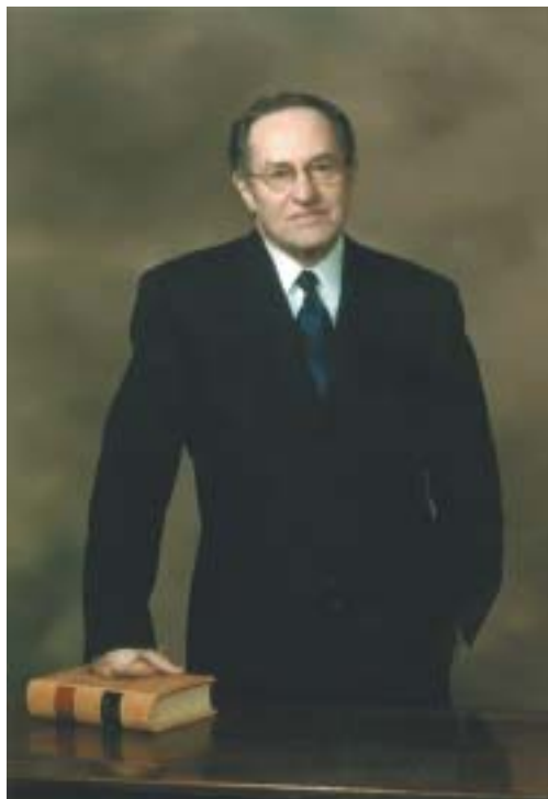
Alan Dershowitz.

stopřísežná prohlášení, která umožňovala imigraci, a všichni pak mohli z Brna odjet. Z devětadvaceti lidí se to podařilo dvaceti osmi, a to těsně předtím, než nacisté obsadili Československo. Pouze v jednom případě se to zkomplikovalo. Jednalo se o dívku, houslistku, která studovala na konzervatoři v Přemysli v Polsku. Ale děda požádal svého nejstaršího syna Me-