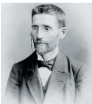
Eliezer Ben Jehuda.