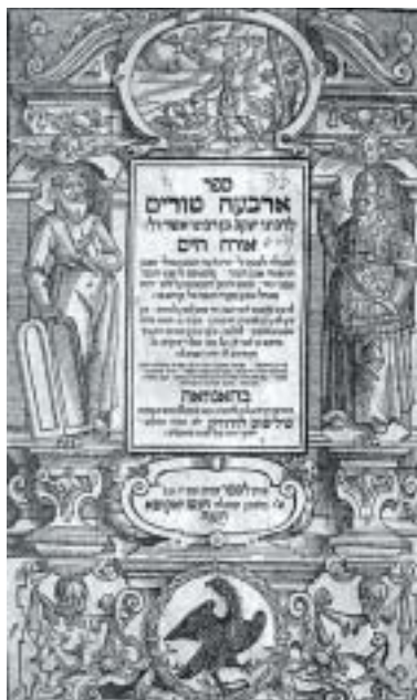
Titulní list první části Arbaa turim , Hanau, 1610.

Pro dějiny rabínského myšlení je významnější Judův starší bratr Jaakov ben Ašer (asi 1270–před 1340), který se rovněž narodil ještě v Německu. Jaakov se na rozdíl od svého otce nestavěl tak příkře proti náboženskoprávním kodifikacím, jak je zřejmé z toho, že pod názvem Piskej ha-