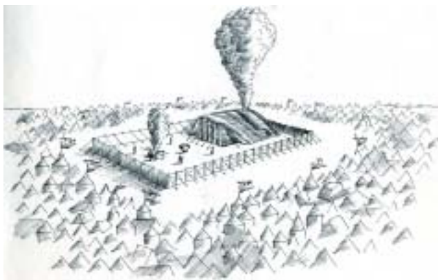
Mark Podwal: Svatostánek , 1978.

Tragédie Izraelitů spočívala v tom, že prožili exodus pouze povrchním zrakem, nikoli mnohem vnímavějším sluchem. Přímo před zjevením jim Hospodin domlou-