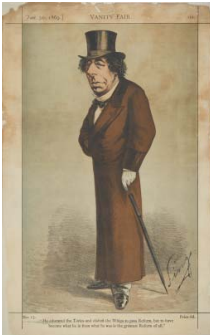
Karikatura premiéra Benjamin Disraeliho, jak ji roku 1869 otiskl časopis Vanity Fair . © ilustrací na str. 12–13: The Jewish Museum London.

mi k svátkům, se zobrazením domácích rituálů či s fotografiemi amerických a evropských synagog, ale také s motivy přistěhovalectví do Nového světa či obrázky s výjevem ze zemí tehdy nanejvýš exotických – ze života Židů v Maroku, Tunisku, ale také Palestiny. Americké pohlednice jsou vedené v moderním, optimistickém a spíše sekulárním duchu: na pohlednici k Roš hašana vytisknuté roku 1915 v New Yorku vidíme slečnu sedící v jednoplošníku, jak rozhazuje k Novému roku květiny;