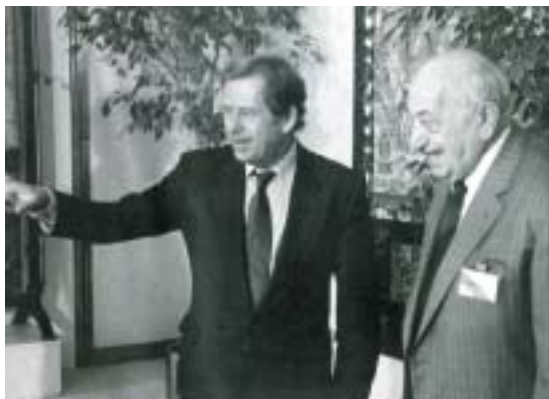
Se Simonem Wiesenthalem na Pražském hradě.

Jako prezident oceňuji spravedlnost, humánnost a objektivitu svého velkého