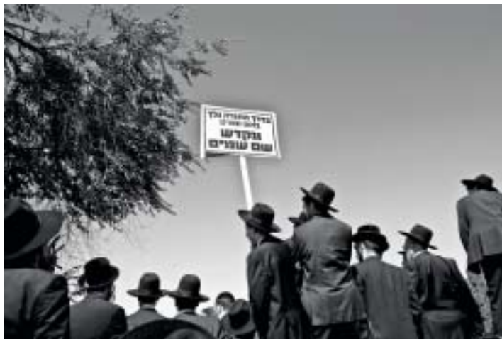
„Cestou Tóry půjdeš, ohněm i vodou, a posvětiš jméno nebes.“