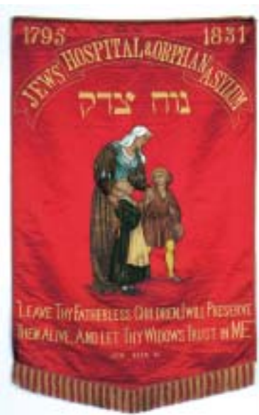
Prapor nemocnice a sirotčince pro židovské děti v Norwoodu.

Londýnské židovské muzeum v Camden Town není rozlehlé ani nejbohatší na ex-