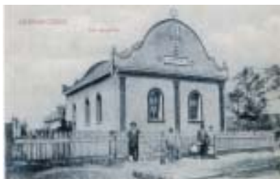
Synagoga v Čaně, 1914. (K článku na str. 14).

bi-švat . Prohlídka: Starý židovský hřbitov. Jednotné vstupné 50 Kč.