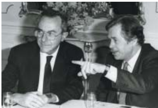
S izraelským ministrem zahraničí Moše Arensem v únoru 1990 při jednání o obnovení diplomatických styků.

Masarykův ideál humanitní jako náboženská myšlenka je možná stejně blízký židovství jako křesťanství, je to rovněž výraz národnosti, proto-