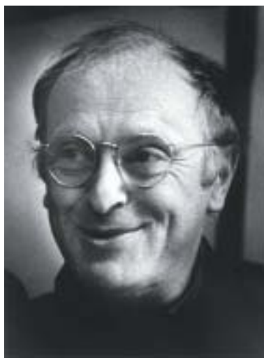
Josif Brodskij, 80. léta.

B: [...] Vždycky jsem měl a mám spoustu známých, jenže jsou buď starší, nebo mladší. A to není úplně ono. Šmakov byl takové mé, nechci říct přímo alter ego, ale v určitém smyslu člověk, kterému jsem měl důvod věřit víc než komukoli jinému. A nejen proto, že byl ve své době jedním z nejvdělanějších lidí, což samo o sobě bylo příčinou když ne úcty, tak přinejmenším důvěry. Nebylo to však tím, že všechno přečetl a všechno věděl, spíš jsme byli opravdu stejná krevní skupina, jak se říká. Stejný živočišný druh,