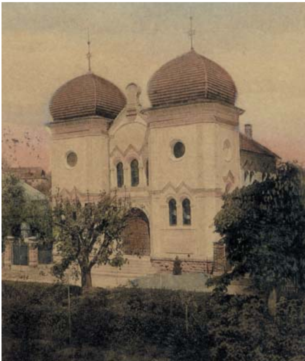
Synagoga v Litomyšli, pohlednice z roku 1910. K článku na str. 11.

VĚSTNÍK ŽIDOVSKÝCH NÁBOŽENSKÝCH OBCÍ V ČESKÝCH ZEMÍCH A NA SLOVENSKU