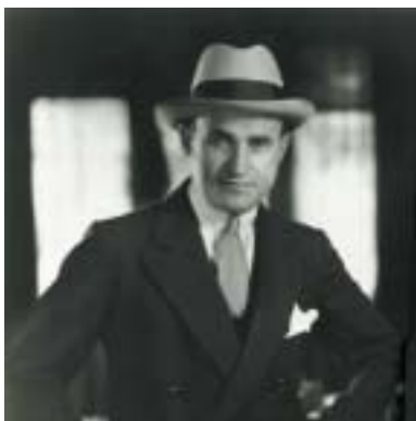
Samuel Goldwyn.

Nápadně velká účast Židů v americkém filmovém průmyslu, jež je námětem současné výstavy ve vídeňském Židovském muzeu (viz Hollywood ve Vídni , Rch 1/2012), byla již od 20. let horkým tématem veřejné diskuse, účastnili se jí Židé