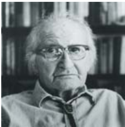
Henry Roth.

I když román Říkej tomu spánek (Call It Sleep) vyšel už roku 1934, literární a kulturní událostí se stal až o tři desetiletí poz-