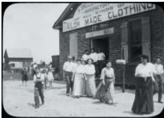
Zaměstnanci vycházejí z krejčovské dílny N. Snellenburg & Company, South Jersey Colonies.