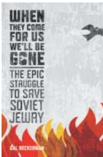
Obálka oceněné knihy.

něnému trestu vězení a pokutě 13 tisíc dolarů. Trest byl vyměřen za popírání zločinů proti lidskosti, když roku 2005 v časopiseckém rozhovoru prohlásil, že nacistická okupace „nebyla obzvlášť nelidská“. Původně byl Le Pen odsouzen již v roce 2009; odvolal se, vyšší instance rozsudek zrušila a poslala k odvolacímu soudu. Předsednicí funkce Národní fronty převzala v lednu 2011 Le Penova dcera Marine. Nesnaží se nyní o nic méně než zbavit ji „rasistického stigmatu“ a propagovat ji jako moderní, protievropskou stranu, jež ve světové „mizerii“ brání „zájmy Francouzů“.