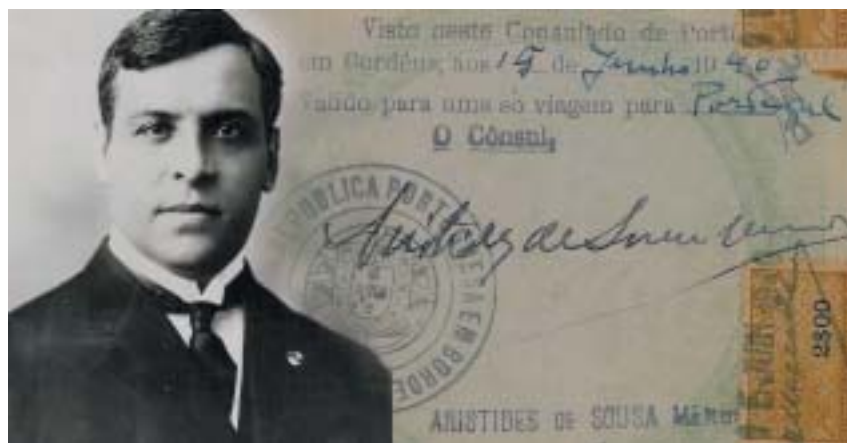
Aristides de Sousa Mendes jako portugalský konzul ve Francii, 1938.

Čtvrtého dne, 16. června 1940, se konzul rozhodl ignorovat nařízení portugalské vlá-