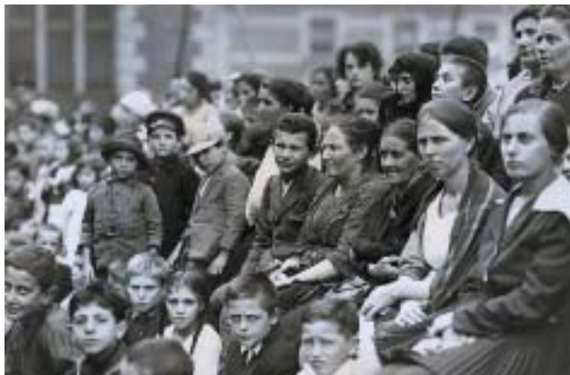
Přistěhovalci čekají na Ellis Islandu na zdravotní kontrolu, která rozhodne, zda budou vpuštěni do USA.

Je třeba si uvědomit, že v letech, kdy Roth vyrůstal, probíhal snad nejostřejší svár mezi stoupenci stoprocentní a rychlé asimilace, tedy plné amerikanizace, imigrantů a kulturními pluralisty, za něž nejhlasitěji promlouval další židovský přistěhovalec z Haliče, harvardský profesor filosofie Horace M. Kallen, autor vlivného traktátu Demokracie versus tavící kotel , který volal po zachování prvků původní kultury, jež neměla být potlačována a vymazávána, ale měla obohacovat pluralistickou kulturu americkou. A právě v tomto duchu je možné považovat román Henryho Rotha za velký americký román. Je přirozené, že na něj upozornili významní američtí židovští kritici (Leslie Fiedler, Alfred Kazin, Irving Howe) v době, kdy pluralita (včetně významného židovského