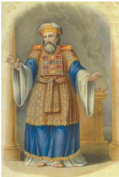
Velekněz v obřadním rouchu. Neznámý autor.

a zdokonalíme, že ho přeměníme ve skutečnou svatyni, aby se Hospodin mezi námi mohl cítit dobře. To je příkaz i výzva, model, poslání a hlavní smysl svatyně.