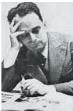
Karel Poláček.

Nevím proč tady, nad hrobem pána, který možná netušil, kým se stal, a že pomník trvalejší bronzou na brlení jeho hrobky vystavěl mu kdysi židovský redaktér — anebo možná vedl s tím redaktérkem soudní spor pro urážku na cti, nebo snad spolu chodili na Letnou a hráli si navzájem bubnová sóla deštníky na buňkách, když Káďa vsítíl branku bezmocně přihlížejícímu Pláničkovi... nevím proč tady, pod večerníci, která už nezve k modlitbám, neboť synagogy v tomto městě jsou opuštěny, pod tyrkysovou hvězdou v kostře podzimního stromu, v té relativní malosti člověka mezi pomníky přišla mi na mysl relativní velikost úspěšných spisovatelů, které zná velký svět. A probíral jsem je, na hrobě pana Načeradce, jejich knihy na papíře, o jakém se jemu ani nesnilo, překládané do mnoha tzv. kulturních řečí, předměty kritické chvály a reklamního bombastu, snobského obdivu a internacionální čtenářské koupěchtivosti, a srovnával jsem je s dílem muže, který na tomto světě nemá ani hrob, jehož kosti ani nespočívají v neznámé zemi, jenž se změnil v dým nějaké smrtící pece, v modré číslo vytetované do kůže, existují snad ještě někde v pečlivě ukrytých smolných knihách koncentráků. A vycházela mi rovnice velmi jednoznačná. Co mají tamti, co neměl on? Jedinou věc: píší velkými jazyky velkého světa, jež nežijí jen ve stavu mateřskosti, ale kterými mluví a čte a které láme celé kulturní lidstvo. A přitom oni, neonová jména efemérních glazurovaných magazínů neovládají své velké jazyky vůbec tak, jako to