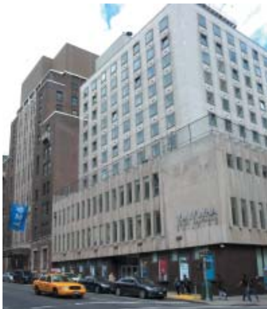
Sídlo 92nd Street Y.

Jsme ale otevřeni i jiné než židovské kultuře: měli jsme tu tříletý cyklus věnovaný Beethovenovi, teď máme dvouletý