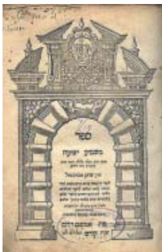
Mašmia ješua, Amsterdam 1644.