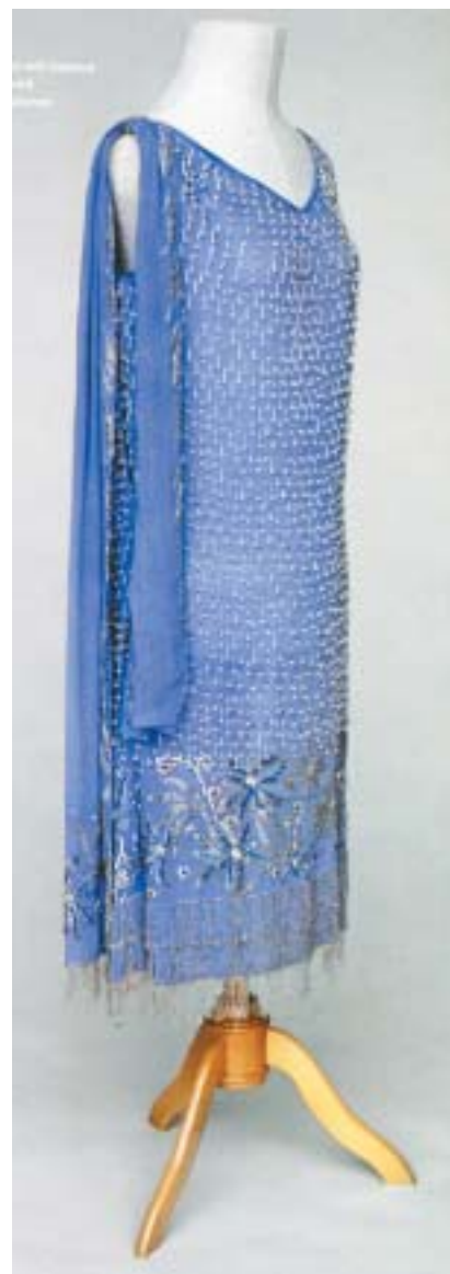
Rosenbaum: večerní šaty, 1926.