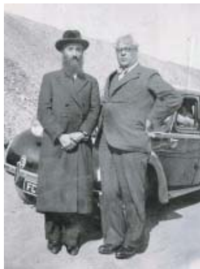
Rabi Chaim Kruger a Aristides de Sousa Mendes, 1940.

dy a začal vydávat bezplatně víza všem žadatelům bez rozdílu. Svolal pracovníky konzulátu a sdělil jim: „Má vláda odmítla všechny žádosti o víza, ale já nemohu poslat všechny ty lidi na smrt. Podle naší ústavy