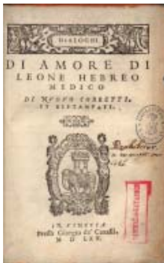
Dialoghi d'amore , Benátky 1565.

Ovlivnění Leona Hebraea italskou renesancí a humanismem je nejzřetelnější v jeho nejslavnějším díle nazvaném Dialoghi d'amore (Dialogy o lásce). Leone Hebreo se zde zcela v souladu s dialogickým žánrem platonské tradice, jež renesanční autoři měli ve vysoké oblibě, pokouší nalézt skutečnou podstatu lásky prostřednictvím fiktivního rozhovoru mezi dvěma postavami, Láskou (Filo) a Moudrostí (Sofia). První vydání Dialogů vyšlo roku 1535 v italštině (Řím), podle všeho již po smrti autora. O popularitě spisu svědčí skutečnost, že mezi lety 1535 a 1607 se objevilo dvacet pět vydání a ještě během 16. století byl vydán překlad do kastilštiny (Benátky 1568) a pod názvem Philosophie d'amour (Filosofie lásky) i překlad do francouzštiny (Lyon 1551, Paříž 1577). Druhé a třetí italské vydání označuje autora jako „Leone Medico di Natione Hebreo, et dipoi fatto Christiano“ (lékař Leone, židovského původu, následně učiněný křesťanem), a někteří starší historikové proto soudili, že Leone konvertoval ke křesťanství. Protože však jakékoli doklady kromě zmíněné titulatury chybí a v samotných Dialogích Leone tvrdí, že píše „pro všechny z nás, kteří věří v pravdivost Mojžíšova zákona“, jedná se nejspíše jen o pokus křesťanských tiskařů učinit knihu atraktivnější v očích nežidovských zákazníků. PAVEL SLÁDEK