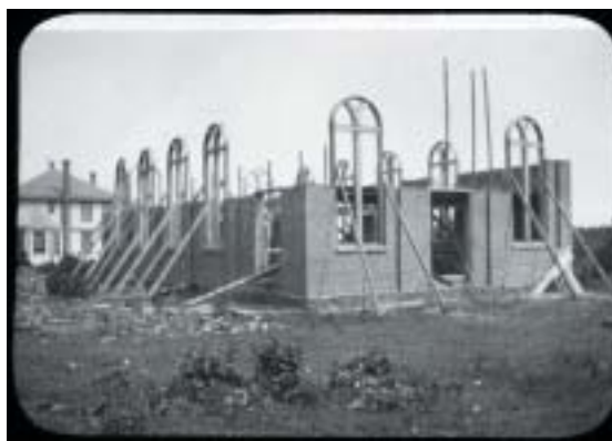
Stavba synagogy, zemědělská komunita Carmel, New Jersey.

nách, která se roku 1983 konala pod vedením historika Jakoba Oveda v izraelském Efalu. A tam se také zrodil takzvaný vývojový přístup ke komunám, který je důsledně uplatňován i v pro nás klíčovém článku o židovských zemědělských komunách v Americe. (Stručně vysvětlení: Členové některých kibuců, které před rokem 1948 sloužily jako židovská útočiště a posléze napomohly zabezpečit nezávislý Stát Izrael, měli v 80. letech pocit, že kibucy svůj někdejší účel splnily, a proto se rozhodli opustit disciplínu komunitního života. I na-