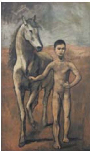
Pablo Picasso: Chlapec vede koně , 1905–6.

Na rozdíl od jiných sběratelů si Steinovi vytvořili se svými umělci úzké přátelské vztahy. Často se navštěvovali, chodili s Matissem jezdit na koních a plavat, zařídili hodiny francouzštiny pro své přátele u Picassovy družky Fernande Olivierové a mnoho jiných věcí. Leo často ve stejný den obědval s Matissem a večerel s Picasssem. Oba umělci posílali Steinovým kresby a vzkazy, které byly na newyorské výstavě také zastoupeny. Steinovi se v Paříži s radostí vzdali zvyků americké vyšší střední třídy a osvojili si bohémský způsob života. Leo se stal vegetariánem a zbavil se svého plnovousu, Gertruda ráda navštěvovala Picassa v Bateau-Lavoir, proslulá zchátralá prádelna s ateliéry umělců na Montmartru.