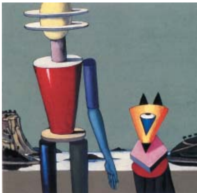
Viktor Pivovarov: Procházka ve dvou , 2000.

„Mám k tobě jednu obrovskou prosbu. Slib mi, že ji splníš.“