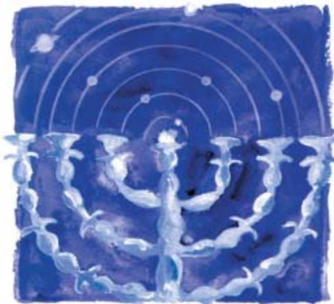
Mark Podwal: Planety , 1997.

Koneckonců Mojžíš si s Hebrejci už zabil své. Poté, co zabil egyptského strážce, který tloukl hebrejského otroka, zjistil, že se Židé hádají a za jeho obětavý skutek mu nejsou nijak vděční: „A kdo tebe nad námi ustanovil knížetem a soudcem? Přikážeš mne snad také zabít, jako jsi včera zabil toho Micrijce?“ (2M 2,14) Mojžíš poté