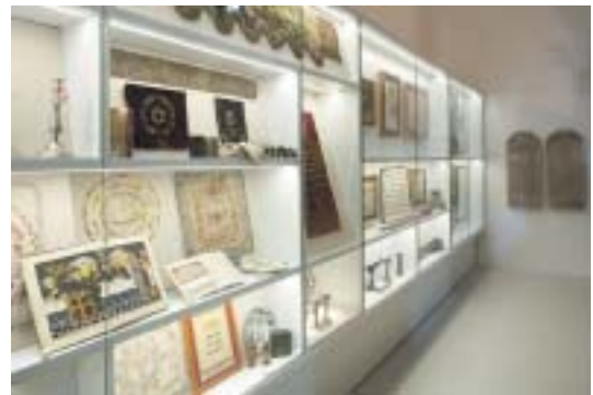
Expozície historických predmetů.

mentované sú aj niektoré významné udalosti zasahujúce do života komunity, ako ničivý požiar židovskej štvrte roku 1913, alebo originál pamätnej tabule s menami bratislavských židovských vojakov padlých počas svetovej vojny v rokoch 1914 až 1918. Malou kuriozitou je, že sa medzi zbierkovými predmetmi nachádzajú aj