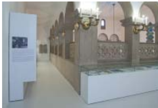
Nová úprava niekdajšej ženskej galérie.

Zbierkové predmety múzea boli vybrané jednak z depozitárov bratislavskej ŽNO, ale aj z ďalších domácich a zahraničných archívov a spravidla majú konotáciu na