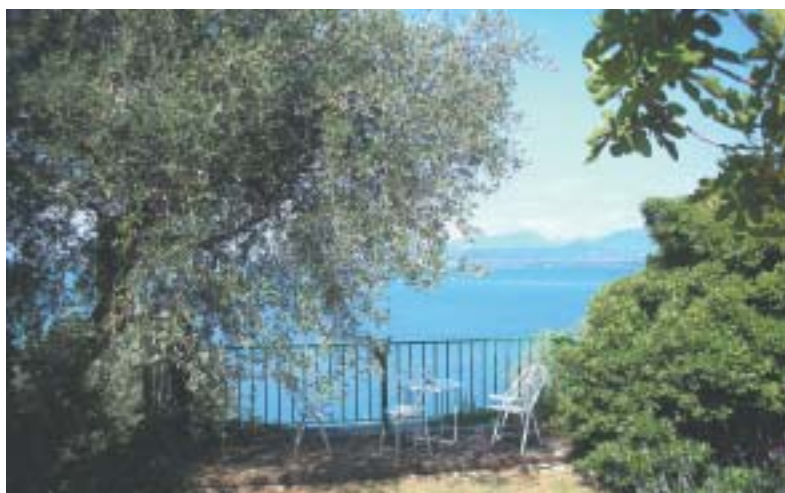
Lago di Garda, u San Vigilia.

Bylo mu jasné, kde je, a žádné politické ani dynastické zájmy ani úřední povinnos-