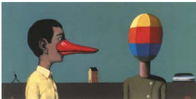
Viktor Pivovarov: Červený nos , 2000.