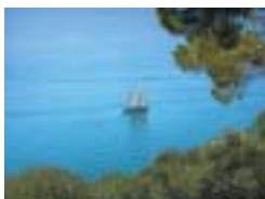
Lago di Garda.

A teď o mé plavbě po jezeře! Skončila šťastně, a nádhera vodního zrcadla a přilehlého brescijského pobřeží vsutku potěšila moji duši. Tam, kde na západní straně končí srázy pohoří a krajina padá k jezeru povolněji, rozkládá se v řadě za sebou, v délce přibližně půldruhé hodiny Gargnano, Bogliaco, Toscolano, Maderno, Gardone, Salò, samé vesměs protáhlé obce. Líbeznost této tak hustě osídlené krajiny nelze žádnými slovy vyjádřit. Dopoledne o půl desáté