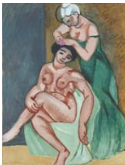
Henri Matisse: Kadeřnice, 1907.

Soustředila se na psaní a hledala nakladatele pro své experimentální texty. „Bylo by daleko příjemnější, kdybyste se více zajímal o mé dílo než o moji osobnost,“ řekla editorovi Vanity Fair . Její přátelé souhlasili, že v knihách jako Křehké knoflíky (1914, česky 2002) a The Making of Americans (1925) Gertruda „dělala to samé v literatuře jako Matisse a Picasso v umění“. Text je pro ni útvar budovaný z materiálu řeči, jako jsou obrazy Cézannovy, Matissovy nebo Picassovy budovány z materiálů vizuálních. Jediná její próza, která byla napsána