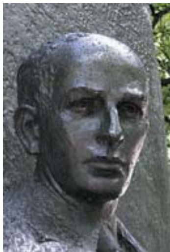
Wallenberg, Great Cumberland Place, Londýn.

Následující vzpomínky jsou vybrány z archivu svědectví umístěného na webové stránce Mezinárodní nadace Raoula Wal-