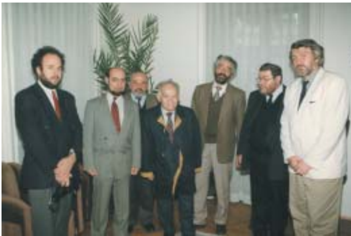
Jicchak Šamir se členy reprezentace FŽO při návštěvě Prahy v roce 1996.

Šamir v Palestině hned zpočátku dospěl k názoru, že Židé mohou spoléhat pouze sami na sebe a na svou vůli k sebeobraně. Proto se zapojil do boje proti Britům, do skupiny Lechi (známé i jako Sternův gang). Ta prováděla ozbrojené útoky a politické vraždy, de facto terorismus. Za největší hrozbu pro vznik židovského státu pokládali britskou mandátní správu (rozhodnutí omezit přístěhovalectví), ne boje v Evropě.