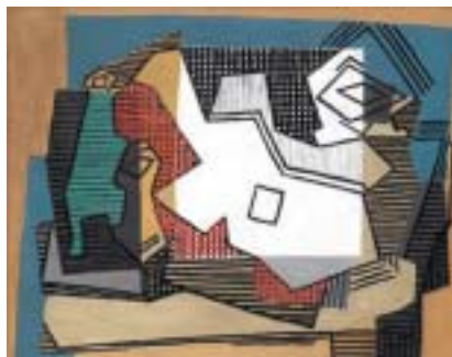
Pablo Picasso: Zátiší , 1922.