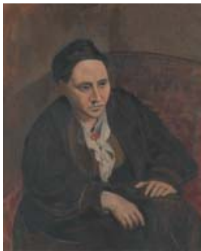
Pablo Picasso: Gertruda Steinová , 1905–6.

V Metropolitaním muzeu v New Yorku nedávno skončila neobyčejně úspěšná výstava Steinovi sbírají: Matisse, Picasso a pařížská avantgarda , která měla premiéru v Muzeu moderního umění v San Francisku a v Grand Palais v Paříži. Výstava představila více než 200 obrazů a dalších dokumentů z pařížské sbírky Gertrudy a Lea Steinových, legendárních mecenášů a sběratelů avantgardního umění z počátku 20. století, a ukázala jejich význam v době zrodu moderního umění, zejména tzv. „heroického období kubismu“ (Max Jacob). Součástí sbírky