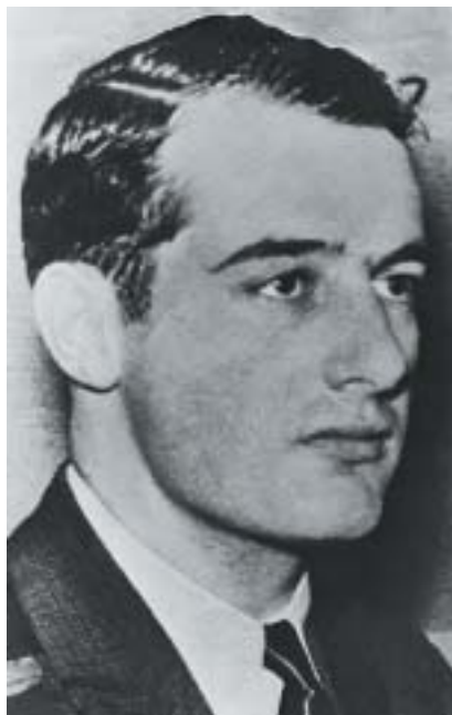
Raoul Wallenberg.

Proč přesně Rusové Wallenberga zatkli, jaké s ním měli úmysly a za jakých okolností zemřel, dodnes není jasné. Dlouhá léta to