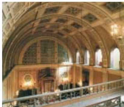
Veroná synagoga, východní stěna.

ky, které získaly Veronu v roce 1404 a držely ji téměř čtyři století, povolily ve městě Židům trvalý pobyt, něco, co nebylo v Itálii vůbec běžné. První zde usazení Židé byli Aškenázové z Německa, na počátku 17. století k nim přibýli Sefardé z Benátek a o dvě desetiletí po nich také marané, násilně pokřtění Židé ze Španělska. Všechny skupiny žily ve společném ghettu, ale zachovávaly