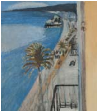
Henri Matisse: Pláž v Nice , 1916. (K článku na stranách 10–11.)