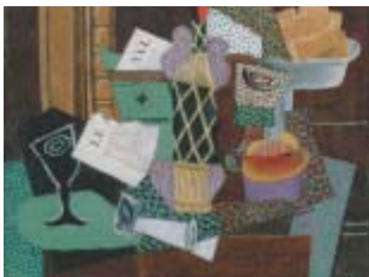
Pablo Picasso: Zátíší s lahví rumu, 1914.

počátku jejich umělecké dráhy. Picassův portrét Gertrudy Steinové, namalovaný v zimě 1905–06, je snad nejvýznamnějším malířovým dílem předkubistického období. Podle Fernandy Olivierové byl Picasso Gertrudou tak fascinován, že jí hned na první schůzce navrhl portrétování. Ačkoli normálně pracoval rychle, k dokončení tohoto obrazu potřeboval prý 80 či více sezení. Obraz se nikomu nelíbil, vyjma malíře a jeho modelu. „Každý říká, že tak nevypadá, ale na tom nezáleží, bude tak vypadat,“ řekl Picasso. Gertruda si s Picassem od prvního setkání rozuměla lépe než kdokoli jiný, oba měli velké ambice a oba chtěli odhalit tajemství nového umění. Portrét Gertrudy Steinové její dědici přenechali po její smrti v roce 1946 Metropolitnímu muzeu v New Yorku – byl to první Picasso ve sbírce této instituce. Gertruda a Leo Picassa podporo-