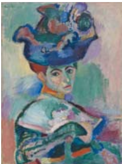
Henri Matisse: Žena v klobouku, 1905.

Pro Matisse a zvláště pro Picassa, který tehdy nikde nevystavoval, byli sourozenci Steinovi jistým zdrojem trvalých příjmů, který jim pomohl překonat nedostatek na