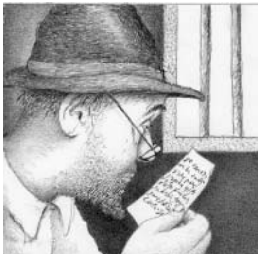
Ilustrace Jiří Stach.

Pak od nás vzali peníze a odeslali dva telegramy. Jeden telegram knihaři Mojšovi a jeho ženě, tlusté Pesji. Druhý pekaři Jonovi. A my jsme se mezi tím nasnídali. Snídaně nebyla nijak skvělá. Ten čaj, co nám podali, řekla Brocha, se dá krájet nožem. Zato nás