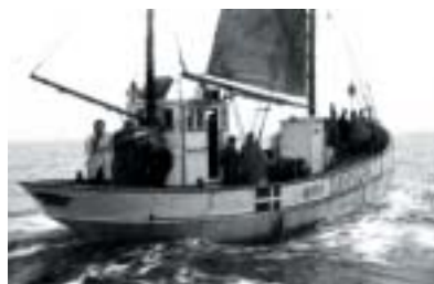
Cesta na svobodu pod dánskou vlajkou.

Matyášová sleduje osudy několika zachráněných, zjišťuje, jak se do Dánska dostali a jak na nové podmínky reagovali a jak přežili. Dokázala svest tyto staré záhadné drohromady a zapojuje do jejich válečné historie i jejich děti a vnuky. Autorka nenapsala přehlednou práci o záchrane českých Židů v Dánsku, ani to neplánovala. Její dílo je spíše autorská re-