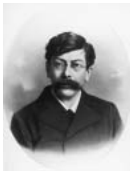
Viktor Adler

Pro podporu šíření sociálnědemokratických myšlenek pak Adler ve Vídni založil list, který později vstoupí do dějin jako Arbeiter-Zeitung . Za své politické názory a aktivity byl v osmdesátých letech úřady opětovně pronásledován. Byl celkem 17krát zatčen a 18 měsíců dokonce vězněn. Přesto nakonec jeho snaha slavila úspěch. Na přelomu let 1888/89 sjednotil roztržštěné rakouské levicové frakce a podílel se na založení Sozialdemokratische Arbeiterpartei Österreichs (Rakouské sociálnědemokratické strany) a byl zvolen jejím historicky prvním předsedou. Funkci zastával až do smrti.