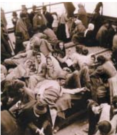
Vystěhovalci na palubě. Fotografie, kolem 1910.

při léčení očních zánětů (trachomů) a v boji s bílým otrokářstvím, které se ve městě stále více rozmáhalo. Její zaměstnanci kontrolovali kvalitu a ceny