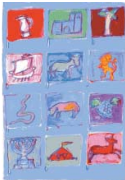
Mark Podwal: Dvanáct kmenů.

kova získává požehnání hojnosti: „Přijmi požehnání nebes shora, požehnání propasti dole ležící, požehnání prsu a lůna!“ (1M 49,25)