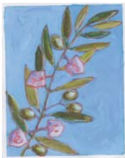
Mark Podwal, Chanuka , 2003.

týká venkovských Židů v českých zemích ve středoevropském kontextu. Přednáška bude v němčině bez tlumočení, diskuse proběhne v češtině. Vstup volný.