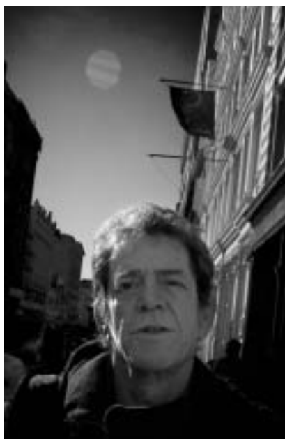
Lou Reed. New York 2006.