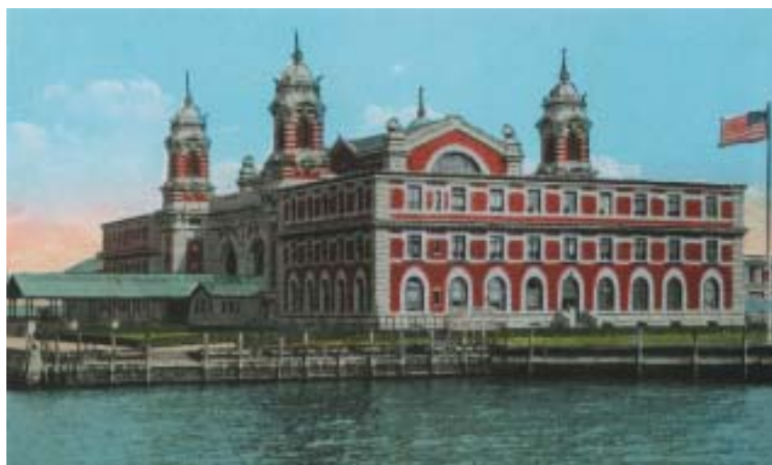
Ellis Island. Pohlednice, kolem 1925.

Kvůli nutnosti vyrovnat se s obrovským množstvím přistěhovalců bylo na Ellis Islandu roku 1892 postaveno několik budov okolo velké haly, v níž probíhaly