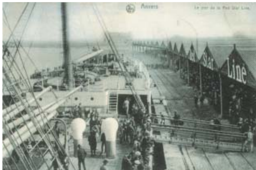
Lodí Finland společnosti RSL v antverpském přístavu. Pohlednice, kolem r. 1905.

Krvavé pogromy v Kišiněvě v roce 1903 vyvolaly ve východoevropských obcích naprostou paniku a vedly k ještě silnější vlně vystěhovalectví. Další pogromy následovaly po prohrané demokratické revoluci roku 1905 a přispěly k tomu, že do Ameriky emigrovala celkem asi jedna třetina židovského obyvatelstva východní Evropy a Ruska. Židé z Ukrajiny a jižního Ruska obvykle překročili rakousko-uherské hranice a pak směřovali do některého z hlav-