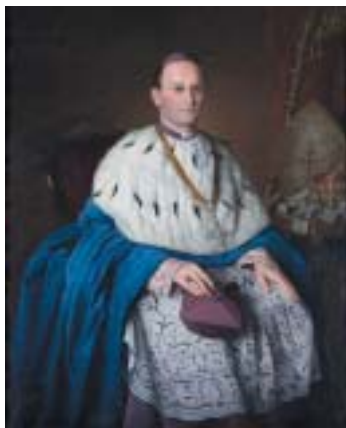
J. L. Šichan: Portrét arcibiskupa Kohna, 1893.

kouský i uherský parlament zaujal ihned nepřátelské stanovisko vůči mé osobě a rakouský premiér hrabě Taaffe uvítal mou volbu ušlechtilou otázkou: „Und hat er sich schon getauft lassen? (A dal se už pokřtít?)“ Byl jsem však nemálo překvapen, když i vídeňská nunciatura žádala křtící listy mých rodičů. Ale přesto jsem na své jméno hrdý, poněvadž jsem je zdědil po chudobných sice, avšak počestných rodičích.“