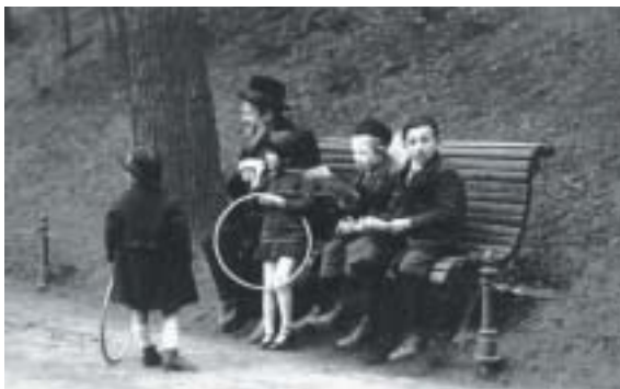
Na Plantach, jedna z fotografií z předválečného Krakova.

Na snímcích vidíme i desítky budov sloužících náboženským a vzdělávacím účelům: synagogy, školy, sirotčince. Zdejší náboženská škola pro dívky Bejs Jakov, již roku 1917 založila Sara Schenirer, patřila k prvním svého druhu a mladé židovské slečny tu získávaly jak náboženské, tak sekulární a praktické znalosti a dovednosti. Pozornost je vě-