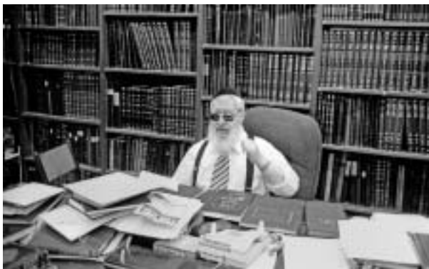
Rav Ovadja Josef doma.

I když Ovadju Josefa jako znalce halachy respektovaly židovské obce po ce-