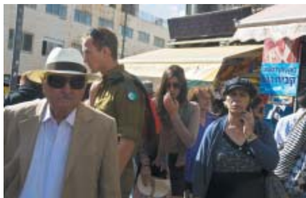
Většina Izraelců chce být holubicemi, ale... Foto Karel Cudlín, 2012.

To, že si západní státníci gratulují k odvrácení velké krize, je podle Avineriho oprávněné. Chybá je ale jejich víra, že dohoda jadernou hrozbu Íránu vyřešila. Jen naiva by věřil, že během šesti měsíců lze s Teheránem uzavřít dohodu definitivní (ta ženevská je jen prozatímní – na půl roku). Úhrnem: Dohoda není reprízou Mnichova z roku 1938, jak mnozí předhazují, ale vyprší-li bez