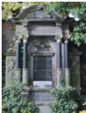
Hrobka Siegmunda Waldsteina.