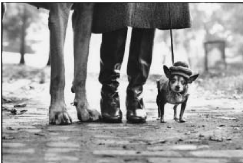
New York, 1974.

Léta fotografoval pro časopis Life a podílel se také na slavné expozici The Fami-