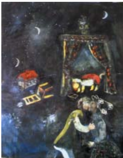
Neznámý obraz Marca Chagalla z Gurlittovy sbírky.