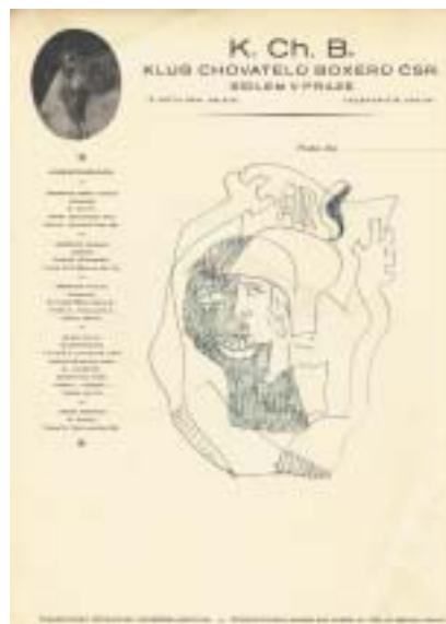
Kresba A. Justitze na tiskopise klubu.

členy KChB. Klub po svém ustavení založil ihned knihu původu a pozval na tehdejší kynologickou výstavu, kde bylo předvedeno 8 psů, soudce a pěstitele boxerů p. Millera z Mnichova, který posoudil zdejší chov a přispěl