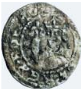
Mince z doby Přemysla Otakara II.

cet let vyučoval na Georgetown University ve Washingtonu. Zemřel roku 2000.