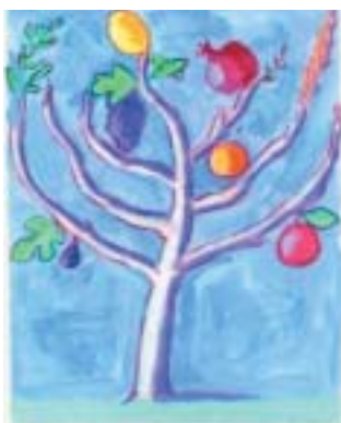
Mark Podwal: Tu bišvat .

na. Na projekci s anglickými titulky naváže diskuze s autorem v angličtině.