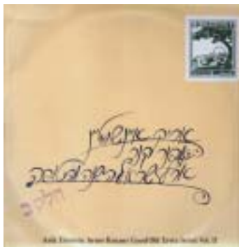
Starý dobrý Izrael, obal druhého dílu.

Arik Einstein tohle všechno dovedl, a nadto disponoval i nádherným hlasem. Z jeho písní, z rozhovorů poskytnutých médiím i z jeho autobiografické knihy vzpomínek, publikované před několika lety, vyvstává postava Arika Einsteina nejen jako velikého umělce, ale jako sympatického chlápka a slušného člověka – menč , jak by se řeklo v jidiš. Takové lidi dnešní Iz-