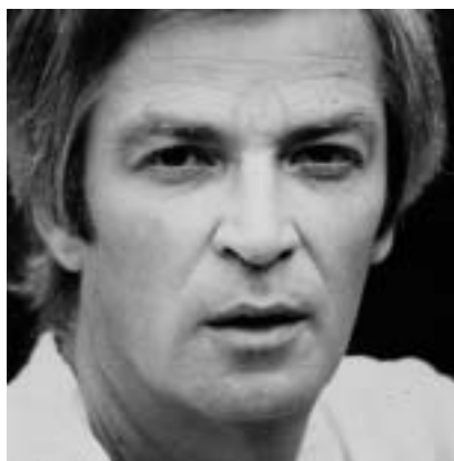
Arik Einstein.

se v mládí věnoval atletice, závodil ve skoku o tyči) nebo odpoledni strávenému s přáteli. Arik Einstein také hrál v několika kultovních izraelských filmech, v nichž se pro izraelské diváky stal ztělesněním postavy sabry – rodištěho Izraelce –, se kterým se tak rádi identifikovali: drzého, bystrého mladíka z Tel Avivu, svobodného a bez zábran; a jako herec a zpěvák se podílel