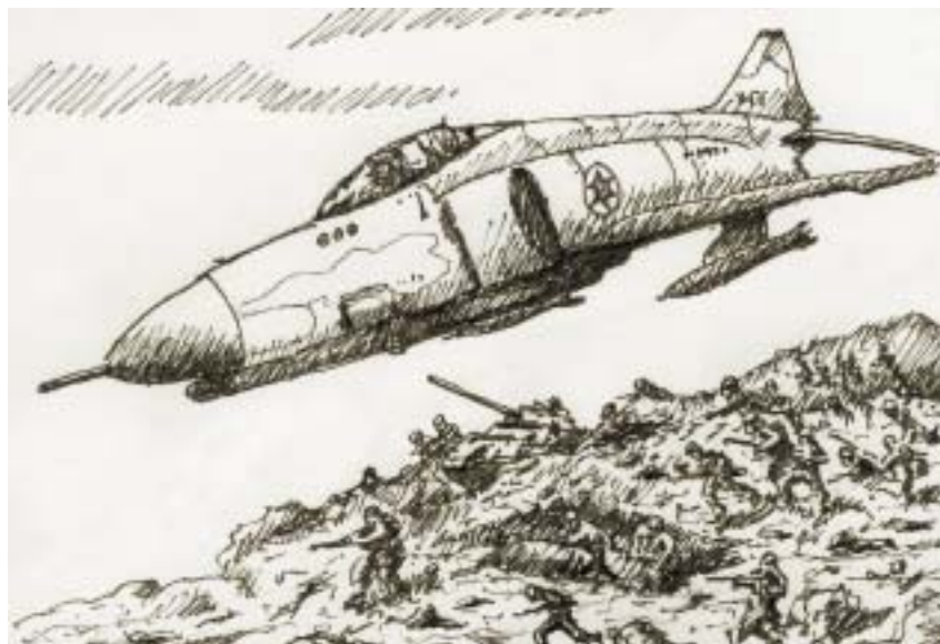
Kresby Jiří Stach.

„Proč větší počet?“ ptáme se. Nikde, kam oko dohlédne, se ze vzduchu na zem neútočí. Syřani se blíží, a jak je sledujeme, srdce nám svírá strach