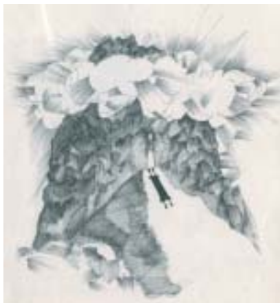
Přijdu k tobě ve sloupu mračna... Kresba Mark Podwal.

ský zpěv, neboť „ženský hlas vzbuzuje sexuální touhu“ (B. T. Brachot 24a). Vždyt izraelské noviny se plní debatami o pobožných vojácích, kteří odpochovali z vojenských ceremonií, když zaslechli, jak zpívají vojačky. Jeden vedoucí ješivy chesder (v níž muži plní vojenskou službu a současně studují) prohlásil, že člověk nesmí poslouchat ženský zpěv, i kdyby právě umíral (je pravda, že později uznal, že tohle kapku přehnal).