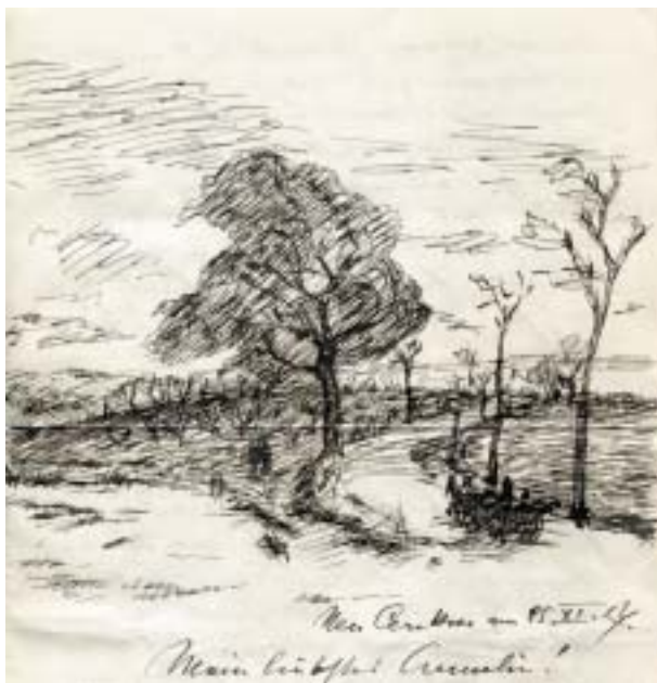
Kresba A. Justitze z okolí Nové Cerekve. Z dopisu A. Pollakové, 1917.

také židovskou školu, rituální lázeň, židovský špitál, chevru kadišu a pěvecký spolek Sion, uplatňující se pře-