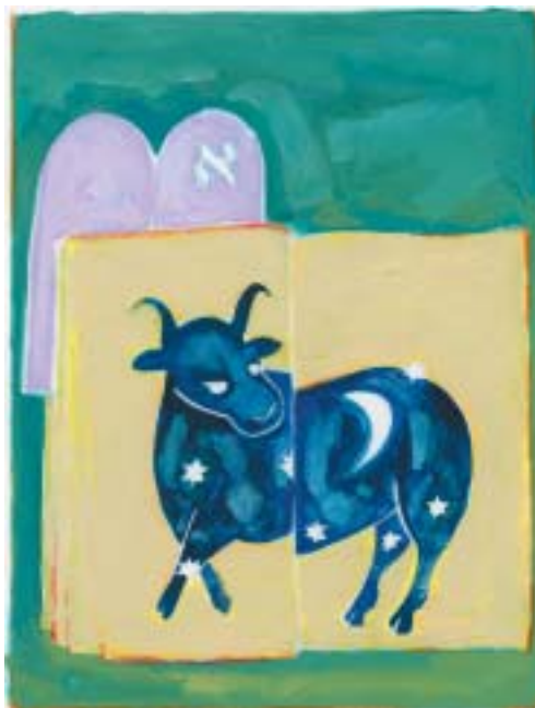
Mark Podwal: Hebrejský měsíc ijar.

Čas na to, abych pobýval mezi vámi, ještě nenastal, vysvětluje Hospodin. Je milující a milosrdný, ale má