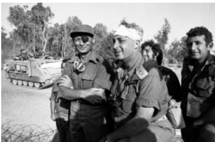
Moše Dajan a Ariel Šaron, 1973.

Narodil se 26. února 1928 v mošavu Kfar Malal a vyrůstal v zemědělském prostředí. Už tím se dost vyčleňoval z establishmentu otců zakladatelů Izraele. Ten tvořili většinou lidé ražení intelektuálním a levicovým prostředím Evropy. Šarona naopak razila práce na farmě. Jenže ač vyrůstal v mošavu, už příklad