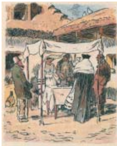
Židovská svatba, ilustrace Adolfa Kašpara ke knize Vojtěcha Rakouse Na rozcestí .

v Praze. Co se týče Moravy, žila převážná většina tamějších Židů původně v malých venkovských městech, odkud se později stěhovala do větších měst jako Brno nebo Moravská Ostrava, kde se až do roku 1848 nesměli usazovat. Avšak nejdůležitější cíl stěhování moravských Židů se nacházel mimo země Koruny české, v metropoli habsburské monarchie, ve Vídni. Tyto rapidní demografické změny se odehrály také v jiných oblastech střední Evropy, zejména v německých zemích, v Haliči, ale také třeba (poněkud dříve) v Alsasku.