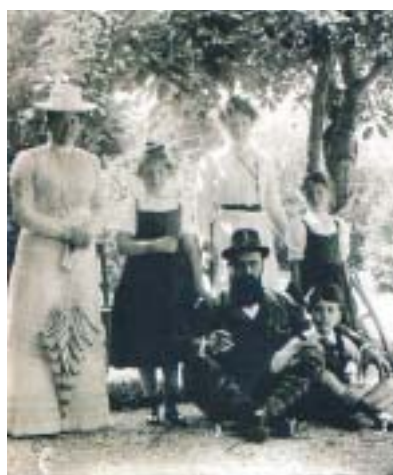
Theodor Herzl s rodinou.

(Ukázka z knihy Simona Sebaga Montefiora Jeruzalém. Dějiny svatého města je částí 42. kapitoly „Císař, 1898–1905“. Překlad Petruška Šustrová.)