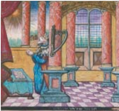
Král David, Amsterodamská hagada, 1739.