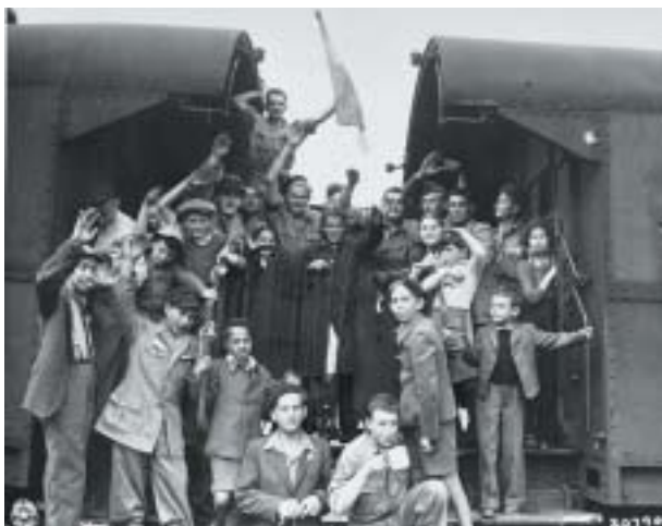
Děti z Buchenwaldu před odjezdem z osvobozeného tábora.