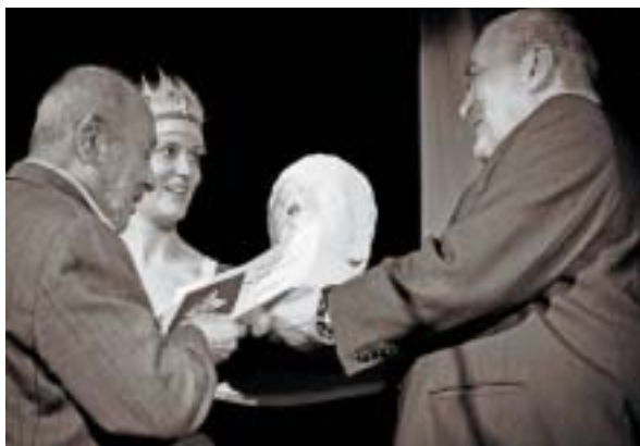
Předávání Ceny Ferdinanda Dobrotivého.