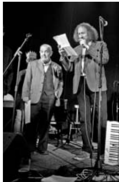
A v Baráčnické rychtě při laudatiu.

ambiciózní blbec“, nic netušil. V průběhu 60. let si ale věci vyjašňoval. Když se pak začalo otevřeně psát o komunistických zločinech a jeho otec tvrdil, že komunistická idea je dobrá, ale lidi to