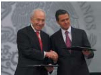
Izraelský a mexický prezident si rozuměli.