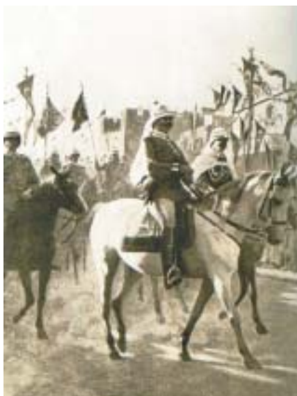
Císař Vilém II. v Jeruzalémě.

Druhého listopadu byl Herzl konečně povolán na audienci k císaři. Pětičlenná sionistická delegace byla tak nervózní,