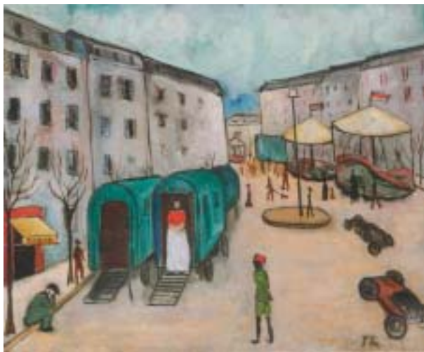
Mia Münzerová: Komedianti , kol. 1930, ŽMP. Mia Münzerová (1909–2003) studovala soukromě u Maxima Kopfa a na pražské akademii, pak žila v Paříži. V březnu 1939 prchla před nacisty do Itálie, Francie, Lisabonu a USA. V roce 2000 vyšly u nás její vzpomínky Stále sním o Praze .

v Norimberku, Stuttgartu, Düsseldorfu a Berlíně, navazující na velké celostátní přehlídky německočeského umění v Brně (1921, 1928) a Karlových Varech (1930). V roce 1933 vystavovala v Teplicích a opakovaně se účastnila