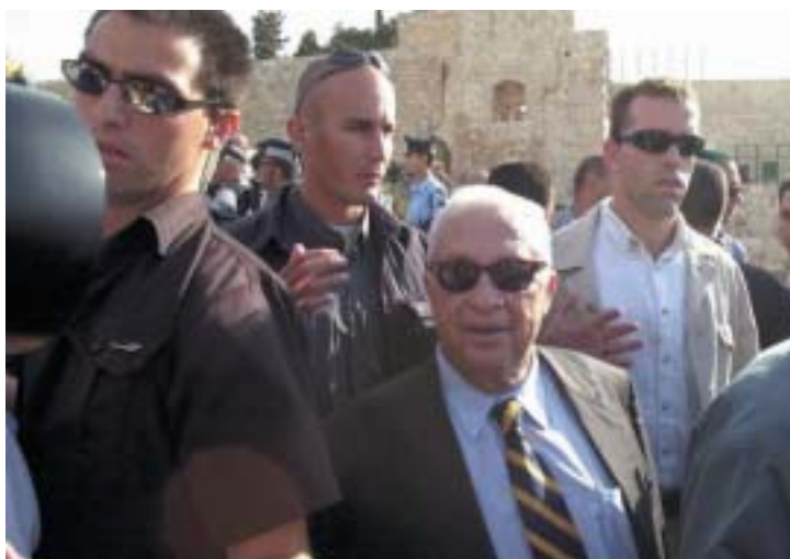
Ariel Šaron na Chrámové hoře, 2000.

Jeho role nepohodlného individualisty ale nekončí. Ministr obrany Moše Dajan označil svého svého úspěšného generála za „mimořádně neposlušného“. A z vojenských kruhů prý pochází okřídlený výrok, který se ukáže jako prorocký: „Kdo odmítá Arika jako náčelníka generálního štábu, dostane ho jako ministra obrany. A kdo ho odmítá jako ministra, dostane ho jako premiéra.“ Stalo se, ale to už se dostáváme k politické části Šaronovy životní dráhy.