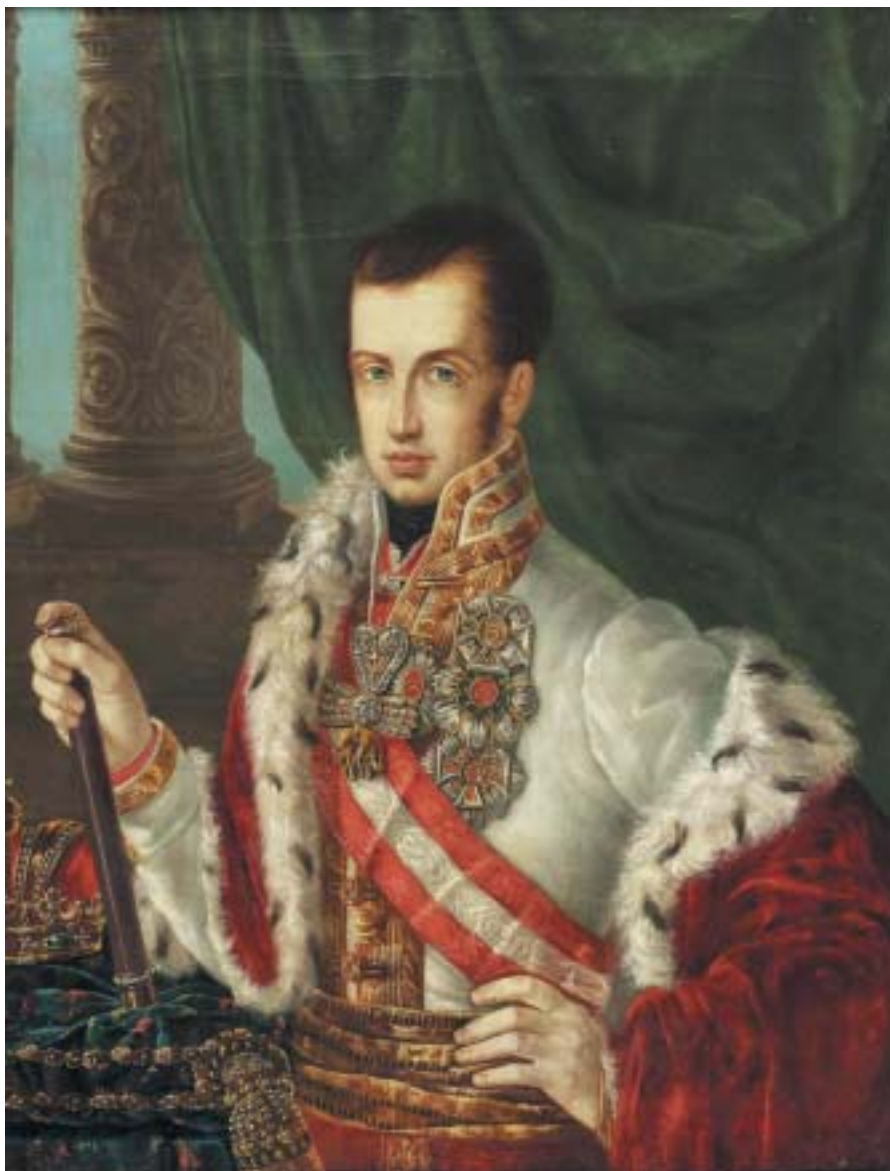
FERDINAND I. DOBROTIVÝ

VĚSTNÍK ŽIDOVSKÝCH NÁBOŽENSKÝCH OBCÍ V ČESKÝCH ZEMÍCH A NA SLOVENSKU