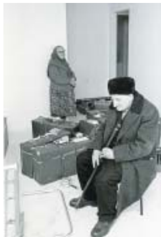
Ruští Židé v novém bytě v Aradu, 1972.

své země – Izraelskou cenu. Přijal ji s úctou a s respektem a úctou bral i své povolání. Jak sám říká, měl štěstí, že se mu za celou profesionální dráhu nic vážného nestalo; řada jeho kolegů byla zraněna nebo zahynula. Fotožurnalistismus vnímal jako snahu dokumentovat události, jak se dějí, a vyhýbat se přitom vypočítavému, efektnímu novinářství. Přál si, aby jeho snímky obsahovaly i něco víc než ono „tady a teď“, jež novinářská fotografie většinou zobrazuje. Jeho slovy: „Jestli mé snímky žijí jen těch pár dní, co jsou v novinách, selhal jsem. Přál bych si, aby alespoň jedna setina mých obrázků žila déle.“