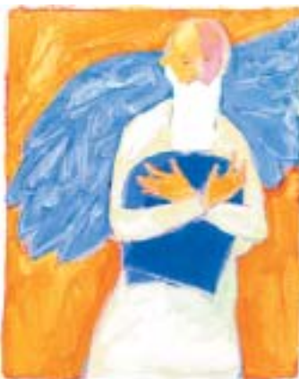
Mark Podwal: Moše rabejnu.

děťmi? Byl on, velký vůdce, v duchu zklamaný, že synové nezdedili jeho roli? Jaké hlubší poslání nám text sděluje? Co znamená Mojžíšovo zklamání? A utěšil ho nějak Hospodin?