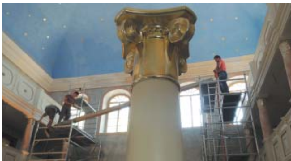
Revitalizace židovských památek v ČR – práce v Březnici a v Brandýse nad Labem. (K textům na stranách 3 a 8–11.)