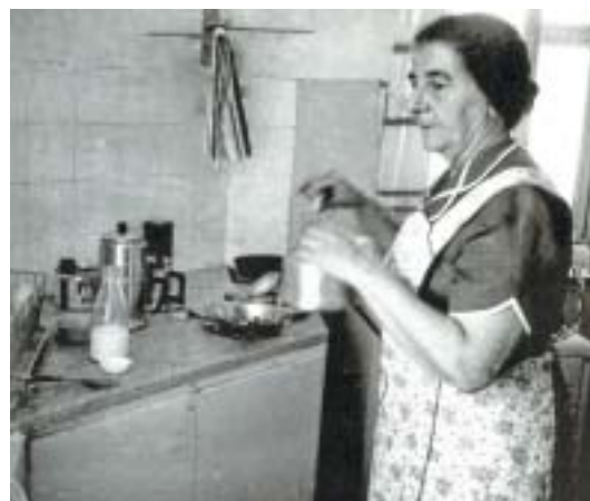
Budoucí premiérka Golda Meirová ve své kuchyni, 1956.

Jako reportér sledoval vše, co se od vzniku státu v zemi dělo. „Život v Izraeli není nikdy nudný a často ho žijeme na ostří nože. V jednu chvíli prožíváte všed-