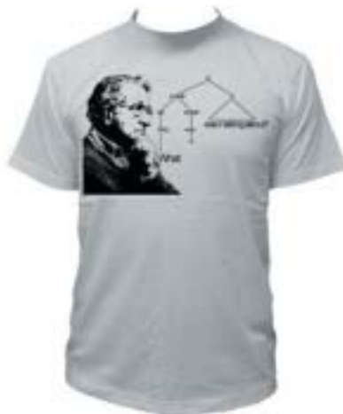
O čem jsem to mluvil?

Jak to jde dohromady? Poněkud zvláště. Chomsky přijímá odpovědnost za Spojené státy a Izrael, a proto k nim zaujímá hyperkritický postoj. Zároveň si pro sebe nárokuje luxus nezájmu o rozvojový