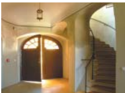
Obecní dům v Boskovicích – vstupní část.

Historické jádro Boskovic včetně ghetta je od roku 1990 městskou památkovou zónou. K významným pa-