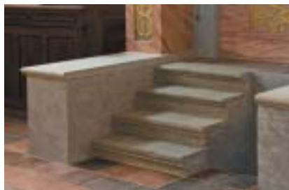
Stupně k aronu ha-kodeš.

však představovala do stavby pronikající vlhkost, kterou se podařilo odstranit až díky možnostem, které poskytl projekt revitalizace; teprve v rámci tohoto projektu mohla být ob-