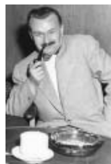
Alfréd Radok.

V roce 2011 se pod záštitou Václava Havla uskutečnil rozsáhlý projekt Odkaz Alfréda Radoka městu Valašské Meziříčí. Následovalo pojmenování základní umělecké školy po tomto umělci. Letos, kdy si připomínáme sto let od narození Alfréda Radoka, se k tomuto významnému výročí hlásí i tato škola: