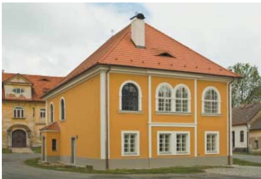
Krásná a cenná březnická synagoga.

zemích v souvislosti se životem březnické židovské obce a jejích institucí. Stranou nezůstane ani podíl židovského obyvatelstva na kulturním a hospo-