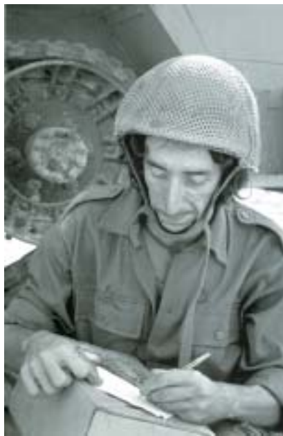
Jomkipurová válka, 1973.

nevěděl) kupovala v hospodě. Po anš-lusu otce při náhodné razii nacisti zatkli a poslali do Dachau, pak do Bu-