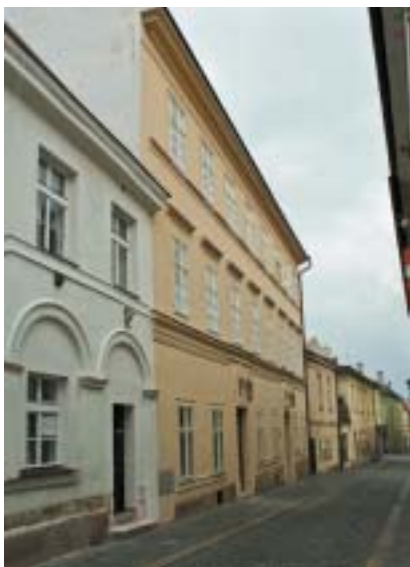
Židovská škola – fasáda do ulice.

Budova židovské školy s expozicí Židovští spisovatelé v českých zemích