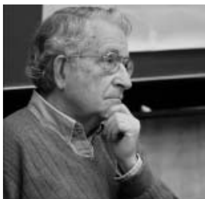
Noam Chomsky.

Jsou to argumenty často jednostranné, vyhocené i demagogické, ale společenský diskurz – jeho levicový segment – ovlivňují mnohem více, než by se mohlo zdát. U nás byly po celou generaci od listopadu 1989 značně oslabeny. Za čtyřicet let života v komunismu lidé získali