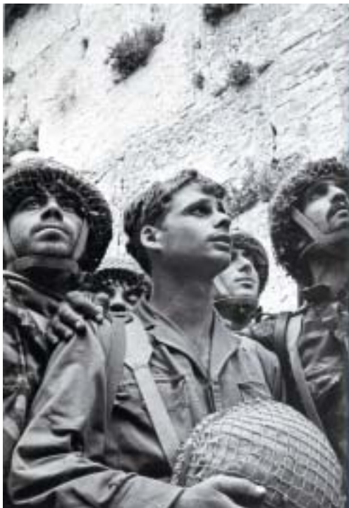
Izraelští parašutisté, několik minut poté, co dobyli Staré Město a stojí před Západní zdí, červen 1967.

nekonečná odolnost lidského ducha vůči opakovanému neštěstí," píše ve svých vzpomínkách. Jako válečný reportér fotografoval vojáky i raněné, Izraelce i Araby. K jeho nejsilnějším zážitkům patří jomkupiřová válka, kdy v listopadu roku 1973 Egypt a Sýrie zaútočily na Izrael. „Viděl jsem hořící tanky a mrtvá