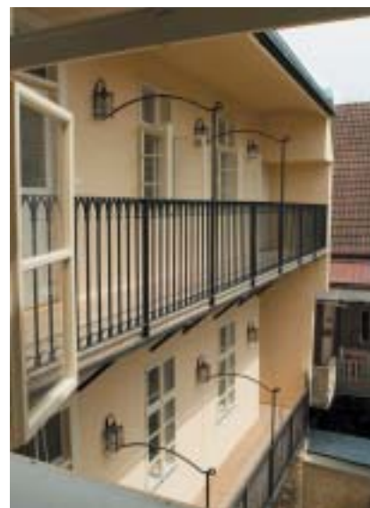
Židovská škola – pohled ze dvora.

nulých letech ji díky pochopení jičínské radnice získala Federace židovských obcí, která připravila celý projekt její obnovy a využití. Tato pozoruhodná pozdně empírová stavba byla zbudována jičínským stavitelem Josefem Opolzerem na místě starších domů po velkém požáru v roce 1840 jako výstavná dvouposchodová budo-