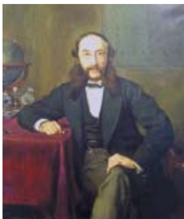
Paul Julius Reuter, 1869.

Většina regionálních novin, včetně některých celostátních, referovala o otevírací synagoga a expozic v projektu Revitalizace židovských památek v ČR. ■ V létě přiletí do České republiky Američan Sean Skinner, jeden z neuznávanějších hokejových trenérů mládeže na světě. Povede týdenní tréninkový kemp v Plzni, který pořádá hokejová agentura Surpass. V západočeské metropoli bude tento 42letý fenomén s českými kořeny trénovat od 29. června do 4. července v Kooperativa Aréně v Plzni na Košutce. Poprvé byl v České republice v roce 2011, kdy týden dohlížel na mladé hokejisty v Brně. „Je to profík na tisíc procent. On ty děcka samozřejmě za týden