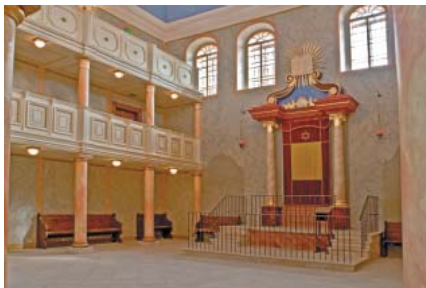
Výsledek stavebních a restaurátorských prací.

lu se stálou expozicí Prameny judaismu: rabínské písemnictví a vzdělanost zpřístupněny veřejnosti od června 2014.