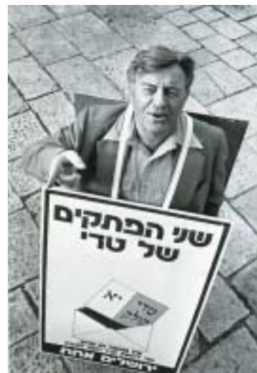
Teddy Kollek v předvolební kampani, 1978.