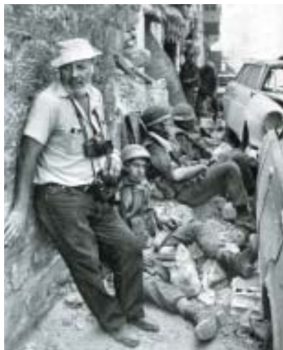
David Rubinger v akci při bojích v západním Bejrútu, 1982.

David Rubinger se narodil roku 1924 ve Vídni, otec obchodoval se šrotem, maminka byla doma. Žili v tradiční židovské domácnosti, malý David se od pěti let učil Talmud Tora a snil o tom, že jednoho dne bude tramvajákem. Ve svých memoárech nazvaných Israel Through My Lens, Sixty Years as a Photojournalist (Izrael mým ob-