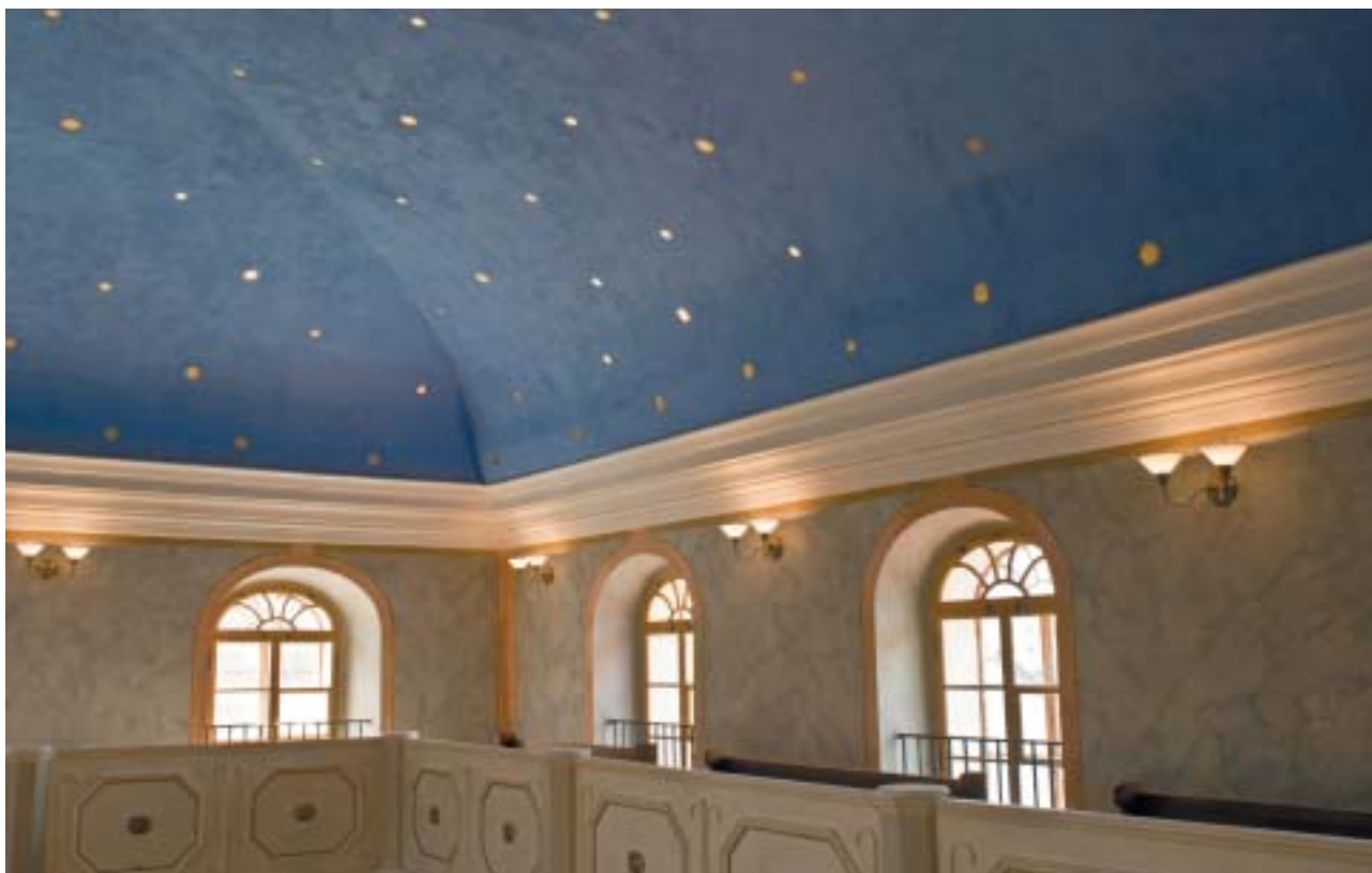
Synagoga v Brandýse nad Labem – druhá galerie a strop.

v malé židovské čtvrti žilo více než tři sta osob židovského vyznání. Zachovaná brandýská synagoga, zvenku nenápadná klasicistní budova z let 1828–1829, stojí asi 200 metrů severozápadně od