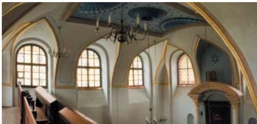
Obnovená výmalba stropu a zlacení.