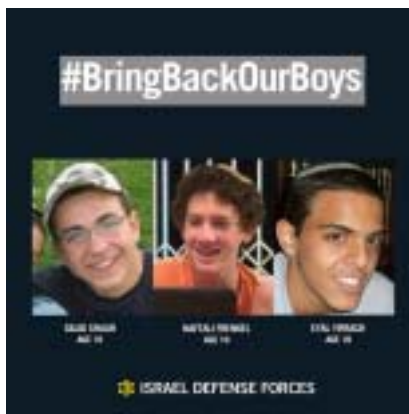
Vraťte naše chlapce.