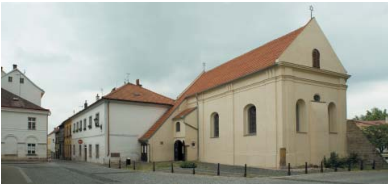
Jičínská synagoga s rabínským domem a Židovskou ulicí.