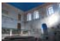
Synagoga v Brandýse – zahájení rekonstrukce.

v malé židovské čtvrti žilo více než tři sta osob židovského vyznání. Zachovaná brandýská synagoga, zvenku nenápadná klasicistní budova z let 1828–1829, stojí asi 200 metrů severozápadně od