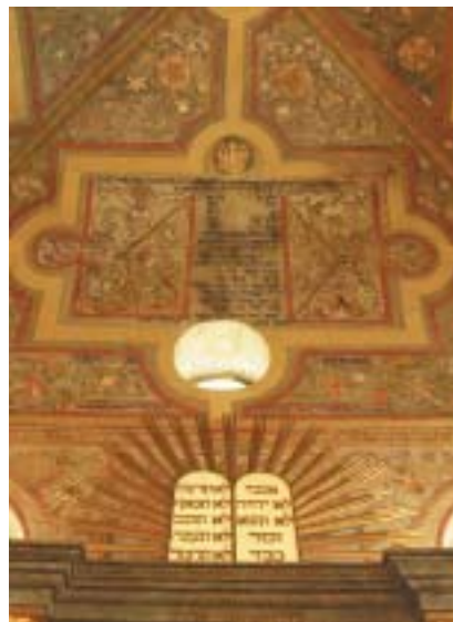
Boskovická synagoga – interiér.

Ghetto mělo v době svého největšího rozsahu na 150 domů; mnohé z nich se dochovaly, většinou v přestavbách z počátku 19. století. V roce 1848 tu žilo na dva tisíce Židů, celá třetina všech obyvatel města. Jeden z domů ghetta z roku 1826, silně zdevastované bývalé sídlo židovského obecního úřadu, rabína a židovské školy (Bílkova ulice 7), prošel v rámci projektu revitalizace celkovou rekonstrukcí a obnovou. Po dokončení stavebních a restaurátorských prací v něm byla umístěna stálá expozice, věnovaná židovským historickým sídlům v Čechách a na