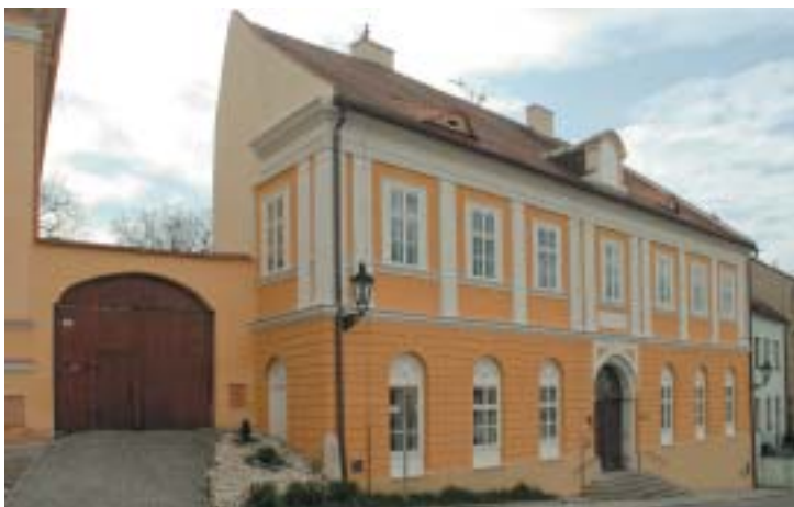
Obecní dům v Boskovicích, pohled z Bílkovy ulice.

mětihodnostem patří hrad ze 13. století na vrchu nad městem, rozlehlý zámek z počátku 19. století, kostel ze 14. století, stará radnice a v neposlední řadě i vzácná synagoga, postavená v roce 1636 uprostřed rozsáhlého a dodnes relativně dobře zachovaného židovského ghetta s původní vstupní branou. Interiér synagogy, vyzdobený bohatou barokní ornamentální výmalbou s hebrejskými nápisy a tradičními židovskými motivy, se restaurátorům v minulých letech podařilo z větší části zachránit. Celkovou stavební rekonstrukcí synagoga prošla v letech 1989–2001, v rámci projektu revitalizace byly v letech 2010–2014 provedeny další