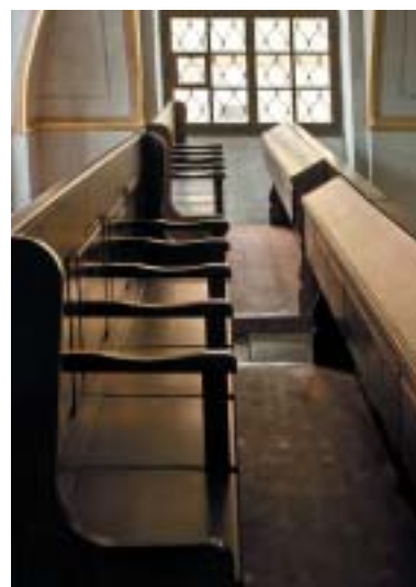
Lavice na ženské galerii.

Tématem expozice v synagoze v Breznici je Židovská vzdělanost v českých zemích . Základní koncepcí je ukázat vývoj židovské vzdělanosti v českých