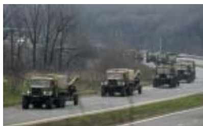
Ukrajinská armáda míří k Doněcku.

Doněck vypadá téměř jako dřív. Téměř – protože najednou se tu objevila hraniční stanoviště, betonové zábrany s pytlí písku, ozbrojení maskovaní muži se samopaly. Najednou po ulicích nejezdí skoro žádná auta. Najednou tu je strašlivé dusivé ticho. Doněck umírá. Po desáté dopoledne není otevřený jediný obchod, ani lékárna, ani kavárny, venku není vidět ani živáčka, krouží tu jen osamělý taxík. Platí večerní zákaz vycházení, takže když vyrazíte po desáté večer za kamarádem, musíte si s sebou vzít pas. Zvuk příjezdících aut mi připomíná zvuk blízkých se vojenských helikoptér. Otáčím se a vidím nákladní auto, ně-