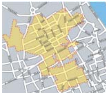
Varšavské ghetto v roce 1943.

Úplně stačí, aby člověk vyslovil slova Varšava a Židé, a už všichni začnou mluvit o ghettu, jako by se jednalo o matematický úkon, Varšava plus Židé rovná se ghetto. Ghetto, říkají historici, ghetto, říkají moji přátelé, ghetto, vyplivne internet. Pokoušela jsem se nad tím v internetu bédovat,