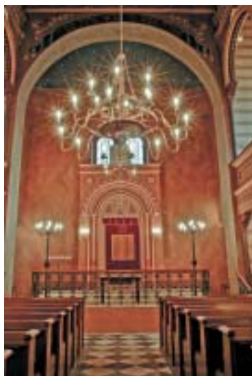
Krnovská synagoga – restaurovaný interiér.

Krnovská synagoga se – na rozdíl od naprosté většiny židovských modliteben v Sudetech, vypálených za pogromu tzv. křišťálové noci z 8. na 9. listopadu 1938 – dochovala v relativně dobrém stavu. Byla vybudována v roce 1871 místním