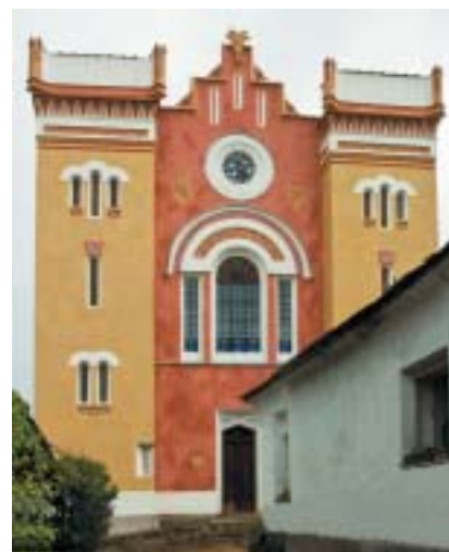
Průčelí synagogy v Cerekvi s hlavním vchodem.

Tyto stavby jsou dnes nejen dokladem bohaté kultury a historie Židů na našem území, ale také památníky tisíců zavražděných židovských obyvatel českých zemí. Mimoto jsou synagogy často také hodnotnými doklady architektu-