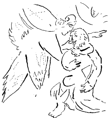
Marc Chagall: Boží vmuknutí.

Za druhé: Skutečným testem proroctví nejsou špatné zprávy, ale ty dobré. Neštěstí, katastrofy, zkáza – to nic nedokazuje. Takové události může předvídat každý, aniž by přitom riskoval reputaci či autoritu. Proroctví pro-