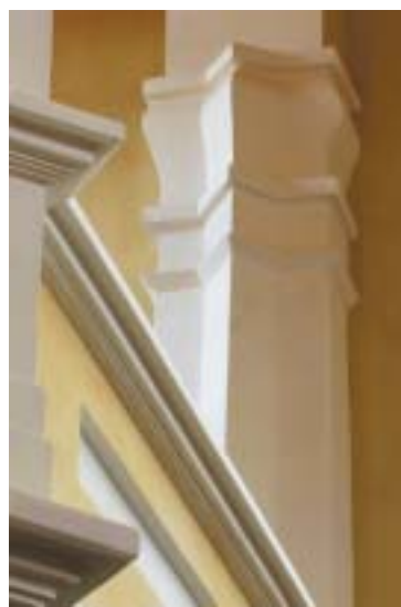
„Kubistické“ prvky, použité v interiéru.