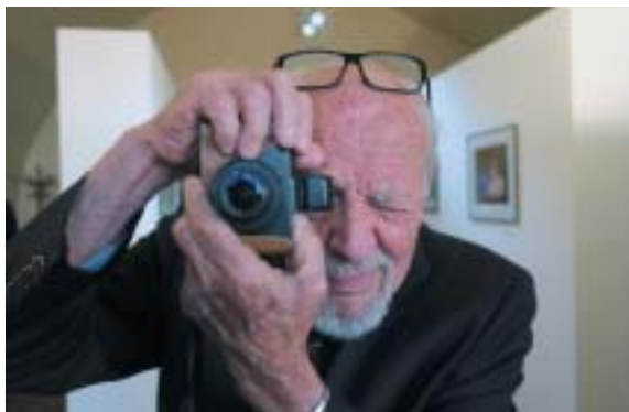
David Rubinger.

V červenci se v Praze v rámci Dnů Jeruzaléma představil izraelský fotograf DAVID RUBINGER (nar. roku 1924 ve Vídni). O jeho životě a práci jsme psali v minulém čísle, proto jen stručně zopakujme, že se před nacisty zachránil odjezdem do teh-