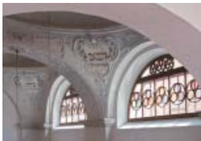
Obnovené hebrejské nápisy v klenbě synagogy.

Synagoga a expozice Rabi Löw a židovská vzdělanost na Moravě jsou veřejnosti přístupné: v dubnu a v říjnu 9.00–16.00, v květnu, červnu a září 9.00–17.00, v červenci a srpnu 9.00–18.00. Otevřeno je denně mimo pondělí, polední přestávka 12.00–13.00.