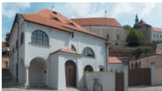
Mikulovská Horní synagoga se zámekem v pozadí.

Mikulovský zámek, zdaleka viditelná dominanta města, patřil Dietrichsteinům. Kdysi byl zámecký vrch hranicí mezi křesťanským a židovským Mikulovem – směrem na západ se rozkládala židovská čtvrť či spíše židovské město. Až do poloviny 19. století byla zdejší obec v českých zemích druhá nejpočetnější (hned po Praze) a po tři století byla také sídlem moravských zemských rabínů. Poté, co bylo zdejší ghetto v 60. a 70. letech 20. století včetně synagog (v 19. století jich fungovalo 12) surově a nesmyslně zbořeno, dokládá mikulovskou židovskou minulost především rozsáhlý a mimořádně cenný židovský hřbitov a několik budov, které ničení přežily. Mezi nimi