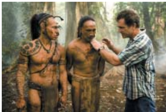
Z natáčení filmu Apocalypto .

případ slavného francouzského spisovatele Louise Ferdinanda Célina. Tento známý kolaborant a antisemita byl za své „občanské“ názory tvrdě odsouzen, jeho umělecké dílo však patří k uznávaným milníkům světové literatury. Splňuje totiž to, co minimálně dle modernistické estetiky naplňuje význam