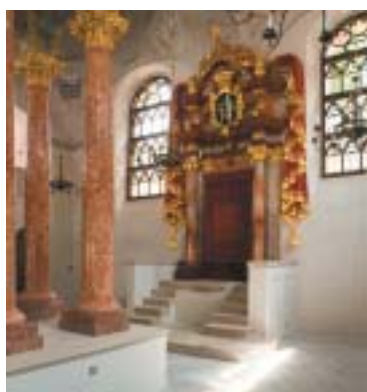
Aron ha-kodeš, skvělá práce řezbářů a restaurátorů.

Stálá expozice na téma Rabi Löw a židovská vzdělanost na Moravě přiblíží návštěvníkům osobnost proslulého Jehudy Leva ben Becalela, rabi Löwa, který ve městě ve funkci zemského rabína v letech 1553–1573 působil, rebeho Šmuela Šmelkeho ha-Levi Horovice, velké postavy chasidismu a mikulovského zemského rabína v letech 1773–1778, a mnoha dalších židovských náboženských i světských autorit, které v Mikulově nebo v dalších židovských