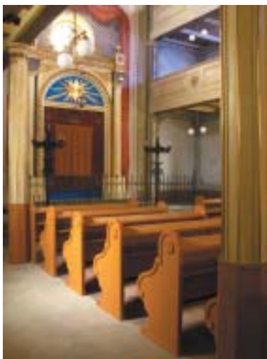
Stará synagoga, pohled na aron ha-kodeš.

Vnitřní prostor Staré synagogy je rozdělen na tři samostatné celky tak, aby se ná-