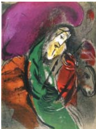
Marc Chagall: Jeremiáš .

varoval lid Ninive, že jej kvůli jeho zlotřilosti zničí. Jonáš se pokusí před tímto úkolem utéct, ale jak všichni víme, na loď, na které se plaví, sešle Hospodin bouři, námořníci hodí Jonáše do vody a spolkně ho velká ryba. Nakonec prorok doputuje do Ninive a vysloví Boží varování: „Ještě čtyřicet dní a Ninive bude vyvráceno.“ (Jon 3,4) Poté se Ninivští káli a město bylo ušetřeno. Všichni byli spokojeni – až na Jonáše: „To Jonáše velice rozzlobilo. Vzplanul hněvem. Modlil se k Hospodinu a řekl: Ach, Hospodine, což jsem to neřikal, když jsem byl ještě ve své zemi? Proto jsem dal přednost útěku do Tašríše! Věděl jsem, že jsi Bůh milostivý a plný slitování, dlouho čekající a hojný v milosrdenství, který nerad činí zlé. Proto nyní, Hospodine, vezmi prosím můj život. Lépe kdybych umřel, než žil.“ (Jon 4,1–3)