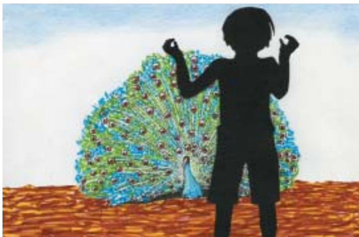
Páv v sovětské škole, božské stvoření, které se nevešlo do žádné třídní teorie...

Za války se škola rozrostla, přijímány byly nejen děti, které byly od narození hluchoněmé. V jednom doku-