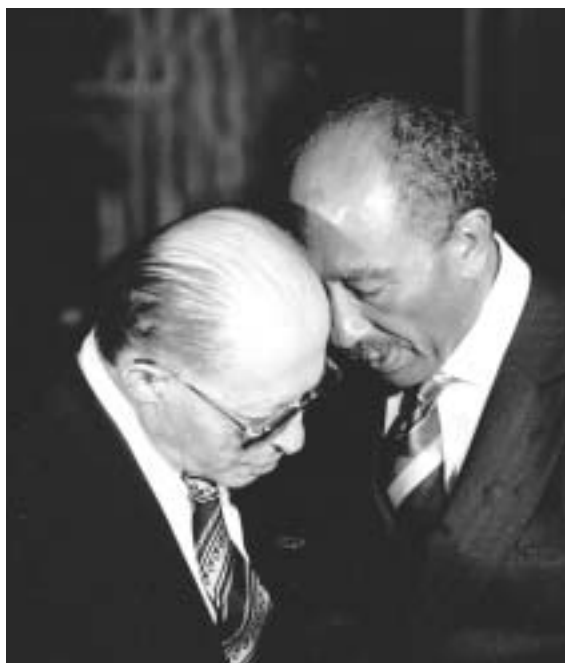
Menachem Begin a Anwar Sadat.

Já byl zrovna na Sinaji, na hranici Gazy a Sinaje, a slyším, že se něco povídá o tom, co se děje v Jeruzalémě. V deset večer přiletěla helikoptéra pro raněné, povedlo se mi tam dostat, dopravila nás do Beer Ševy, odtud jsem jel svým autem do Jeruzaléma, cestou jsem bral vojáky, kteří stopovali. Ráno 7. června jsme byli v Jeruzalémě. Nejprve jsem utíkal pozdravit ženu a děti, které jsem neviděl tři týdny, a pak jsem běžel do Starého Města. Tu fotku jsem