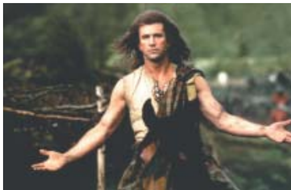
Mel Gibson ve svém Statečném srdci.

Snad neznámějším je však herecův exces z roku 2006. Tehdy ho zatkla policie, protože namol opilý řídil auto. Mezi jinými výpady a výhrůžkami Gibson pronesl k policistovi: „Z...ý Židi... Židi můžou za všechny války na světě...seš Žid?“ To už bylo pro mnohé přece jen příliš, a tak někteří filmoví tvůrci vyzvali své kolegy, aby Gibsona bojkotovali. Bojkot se sice ne zcela naplnil – multimilionář Gibson stále peníze přitahuje –,