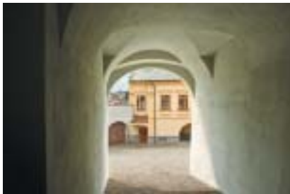
Polná, klenutý průchod rabínským domem.

Synagoga, rabínský dům a obě expozice jsou veřejnosti přístupné od května do