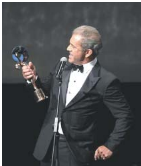
Kreativní a vášnivý: Mel Gibson s Křišťálovým globem.

Gibson junior však později otcův vliv na své antisemitské výpady popřel, čemuž je dost těžké uvěřit, neboť roku 2004 v Reader's Digest prohlásil: „Otec mi dal víru a já věřím v to, co mě učil. Ten člověk mi v životě nelhal. [...] Můj otec není žádný