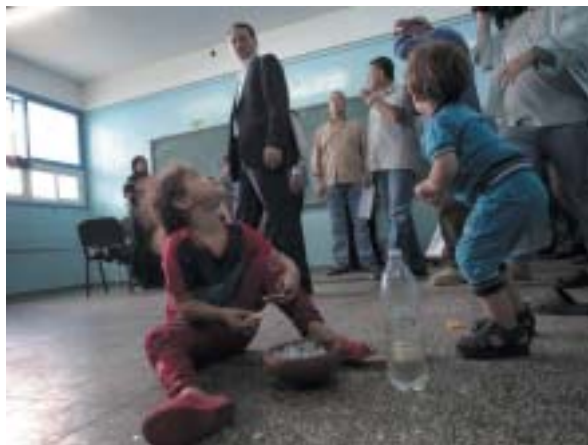
Školy OSN slouží jako úkryt uprchlíkům i raketám Hamásu.

řetězu – vedlo k chaosu ve značné části arabského světa a k posílení islamistů, ba přímo džihádistů. Jen v Sýrii je za tři roky rebelie proti režimu Bašára Asada a následného krveprolití na 170 tisíc mrtvých, což daleko převyšuje počet zabitých během všech izraelsko-arabských válek, a to na všech frontách a bojujících stranách. Jinými slovy: argument, že Izrael je hlavním problémem a nejbolavějším místem Blízkého východu, do značné míry vyčpěl.