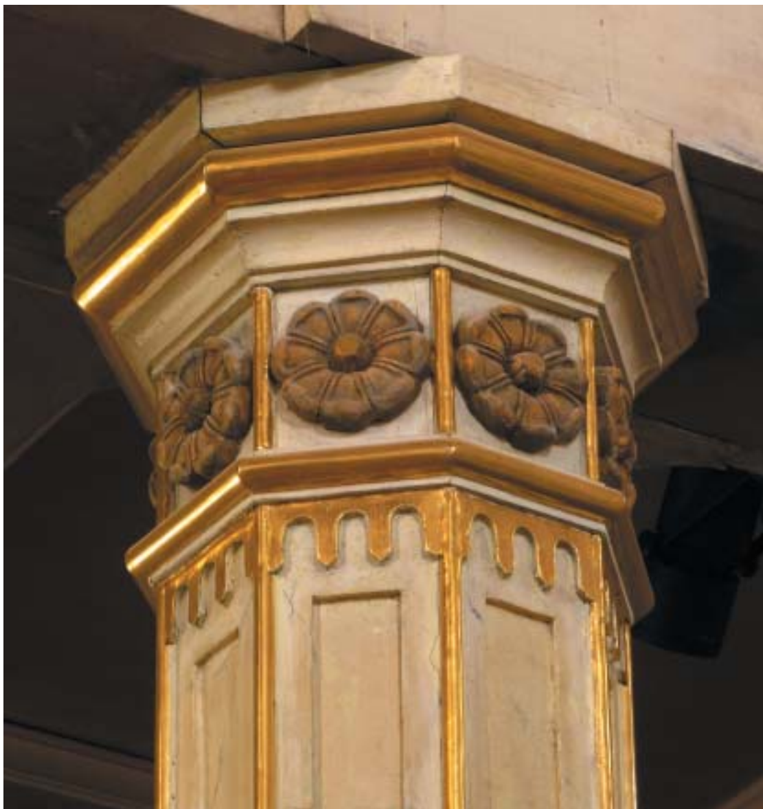
Revitalizace židovských památek v ČR – detail ze Staré synagogy v Plzni. (K textu na stranách 8–11.)

VĚSTNÍK ŽIDOVSKÝCH NÁBOŽENSKÝCH OBCÍ V ČESKÝCH ZEMÍCH A NA SLOVENSKU