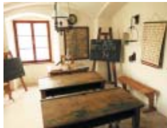
Školní třída v suterénu synagogy v Úštěku.

Židovskému školství v českých zemích , která je už několik let přístupná veřejnosti v bývalé židovské škole v suterénní místnosti synagogy. V přízemí rabínského domu najdeme expozici věnovanou histo-