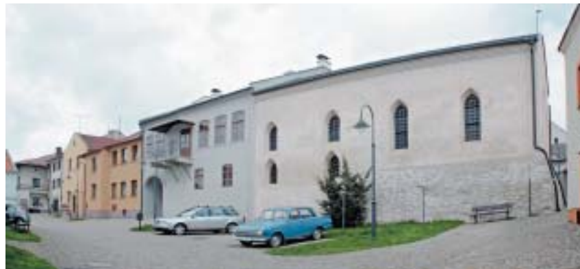
Synagoga a rabínský dům v Polné. Pohled z Malého náměstí.

Celkové náklady v rámci projektu dosáhly 31 939 000 Kč.