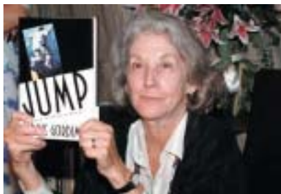
Nadine Gordimerová, New York 1991.

a o náboženství rodičů prý nikdy nemluvila. Arcibiskup o svých židovských kořenech tedy nevěděl, nicméně vždy se o osud Židů, které nazýval „staršími bratry“ ve víře, zajímal.