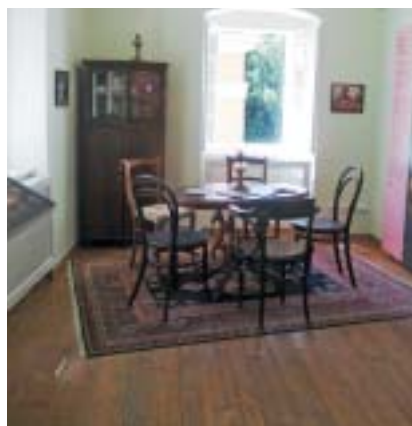
Pohled do expozice v rabínském domě v Úštěku.

Po válce uzavřená synagoga rychle chátrala, propadla se střecha a budova byla určena k demolicí. Roku 1993 převzala budovu FŽO a v letech 1994–2003 provedla její obnovu. Problémem však zůstalo pronikání spodní vody do zdi synagogy a nedokonalé odvodnění jejího okolí. Díky