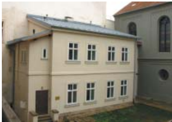
Samesův domek a Stará synagoga v Plzni.

je vyhrazeno pro krátkodobé výstavy, koncerty a kulturní pořady a současně slouží i náboženským potřebám plzeňské obce. Autory expozice věnované tradicím a zvykům jsou PhDr. Eva Kosáková a PhDr. Ale-