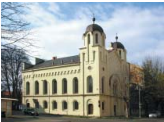
Krnovská synagoga z roku 1871.

dovská pospolitost. Po válce v ní dlouhá léta (až do roku 1997) sídlil okresní ar-