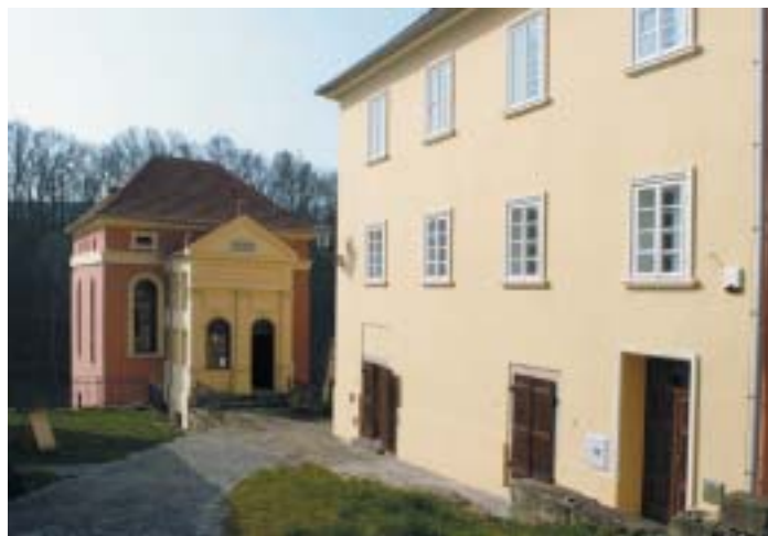
Ústěka – synagoga s obnoveným rabínským domem.

dovské uličky dřevěná škola a teprve roku 1794 si obec postavila neobvyklou novou synagogu jako věžovou klasicistní stavbu z pískovcových kvádrů. Její