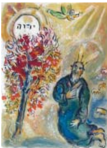
Marc Chagall: Moše a hořící keř .

250 Kč. Další informace a přihlášky na emailu kehila@bejtsimcha.cz a na tel. 603 393 558. Hlaste se, prosím, nejpozději do 8. srpna .