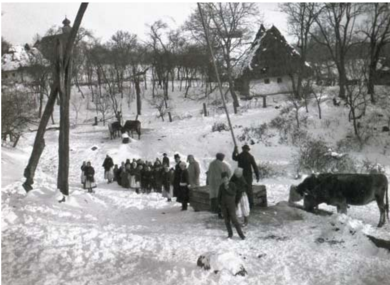
Setkání u studny, Horjany, 1922.

Sem patří Podkarpatská Rus, kterou stále mnoho obyvatel Česka mé generace (nevím jak dalece Slováci) nepovažuje za