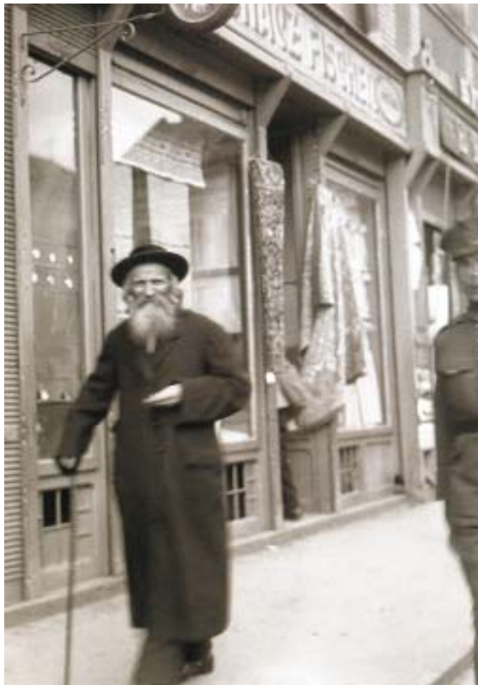
Před židovským obchodem, Užhorod, počátek 20. let.

práci i slavnosti a svátky. Fotografoval na černobílý materiál, na černobílé dia-