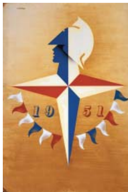
Britský veletrh, 1951. © Estate of Abram Games.

Games nikdy neslevoval z kvality svých děl, do zcela moderních (i ab-