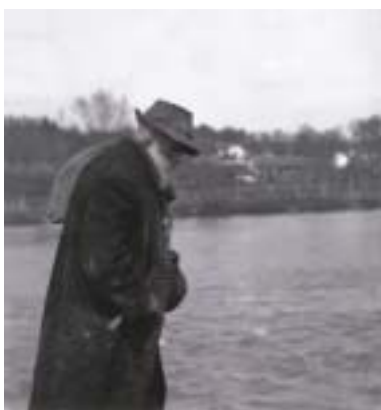
Starý Žid sám na cestě, Užhorod, počátek 20. let.

Jedním z těch, kdo si tento kraj zamilovali, nau- čili se rusínsky a vykonali hodně pro jeho poznání z české strany, byl jihoče- ský rodák Rudolf Hůlka (1887–1961), který na Podkarpatské Rusi pracov- ně pobýval na počátku 20. let 20. století a i později sem často zajížděl a dů- kladně tuto oblast proce- stoval. Tento ministerský úředník přeložil z rusínšti- ny osmnáct knih, ke kte- rým psal zasvěcené před- mluvy a doslovy, což samo o sobě představuje úcty- hodný výkon. Ale Hůlka byl také zapá- leným amatérským fotografem a zane- chal po sobě rozsáhlý fotografický archiv, jehož největší část (1451 polo-