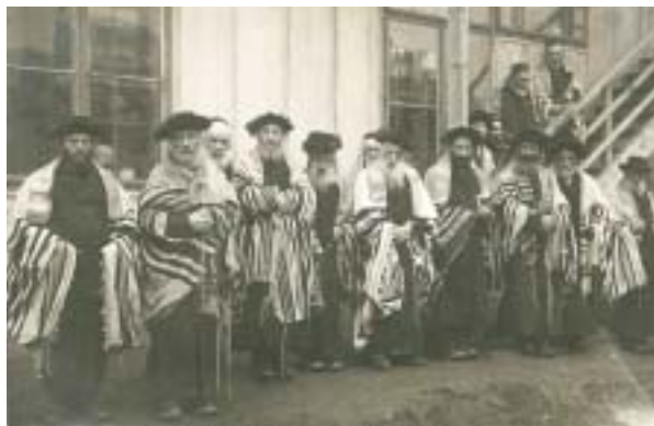
Aranžovaná fotografie z barákového tábora v Německém (Havlíčkově) Brodu, cca 1917.

„Nevalným dobrodiním ukázali se býti všem obcím, ve kterých byli ubytováni, židovští uprchlíci z Haliče. V práci, ať v hospodářské nebo průmyslové, nevypomohou nikomu za žádnou mzdu. Lze je viděti klidně rokovati od rána do večera, ve žních nebo v setí – a neudělají nic, než čachrují. (...) Přitom zůstávají důmyslně nečistí a odpuzující, aby se jim každý raději vyhnul – v kupé, kde ne-