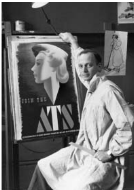
A. B. a jeho slavný plakát z roku 1941. © Estate of Abram Games.

Abram Games se narodil 29. července 1914 v londýnské chudinské čtvrti