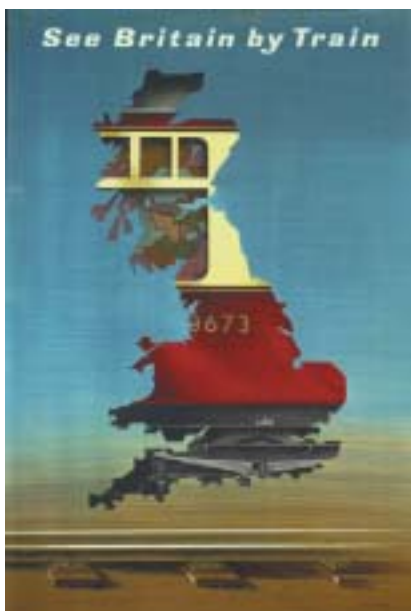
Anglie vlakem, 1948. © Estate of Abram Games.

Games samozřejmě vnímal válečnou židovskou tragédií: byl aktivním členem Jewish Relief Unit, která pomáhala perzekvovaným Židům vycestovat do bezpečí, pro tuto organizaci vytvořil i plakáty (ostatně před nacisty musela utéct i jeho budoucí žena Marianne).