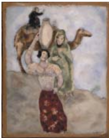
Marc Chagall: Rivka dávat pít Eliezerovi , 1931.

„V tvém bříše jsou dva národy, dvojí lid se od sebe oddělí z tvého lůna, jeden bude mocnější druhého a starší bude sloužit mladšímu.“ (1M 25,23) Rivka musela zajistit, aby požehnání dostal Jakov.