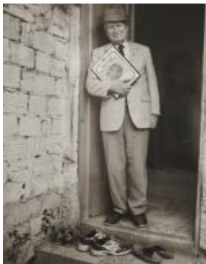
Jeden ze zachránců.

Počet zachráněných se pohyboval mezi 600–1800, v některých pramenech se uvádí i 2000. Během komunistické éry patřila ochrana Židů k tabuizovaným tématům, někteří ze zachránců byli tvrdě perzekvováni. Také kontakt se zachráněnými byl zakázaný, ti se začali hlásit teprve po pádu železné opony. Od konce 80. let vyznamenal jeruzalémský památ-