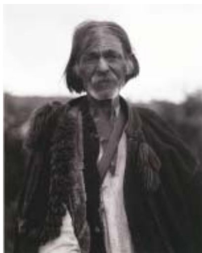
Starý Hucul z okolí Rachova, 1921.

neměly. Jednalo o Slovensko, a zejména o Podkarpatskou Rus. Pro národy,