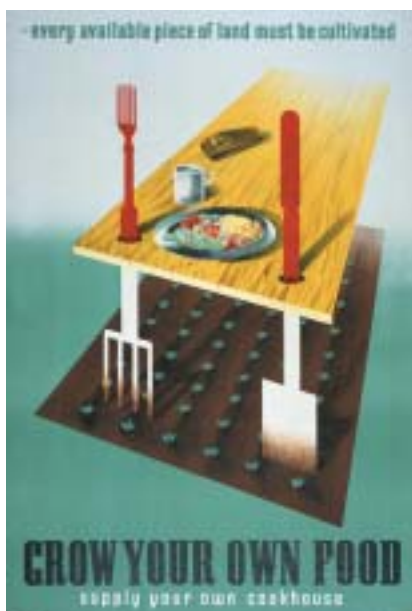
Pěstujte si vlastní potraviny, 1942. © Estate of Abram Games.

bomba) a Angličané si ji dodnes pamatují. Jiné dílo, jež zobrazovalo moderní nemocnici na pozadí zničené krajiny, zakázal jako příliš pesimistické sám Winston Churchill.