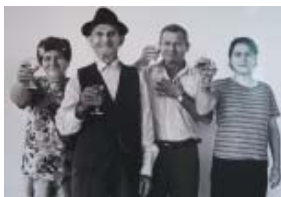
Z výstavy Besa.

mináře k moderním židovským dějinám, jehož garantem je ŽMP a Ústav soudobých dějin AV ČR. Vstup volný.