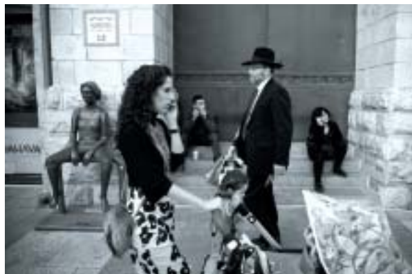
Ilustrační foto Karel Cudlín, Jeruzalém 2013.

Relevantnější je údaj Ústředního statistického úřadu. Ten zahrnuje lidi trvale žijící v Izraeli – včetně arabských oby-