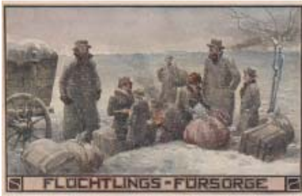
Pohlednice Péče o uprchlíky , Vídeň, pravděpodobně 1914–1915 (soukromá sbírka), zobrazuje Židy utíkající ze zničené Haliče jako pobožné lidi, ale oděné a vystupující způsobem, který by nebudil odpor u více integrovaných rakouských Židů, potenciálních sponzorů péče o uprchlíky.

„Puritzleben, ir bakimt 40, as ir lost si ajch waksen (Velevážený pane, vy-