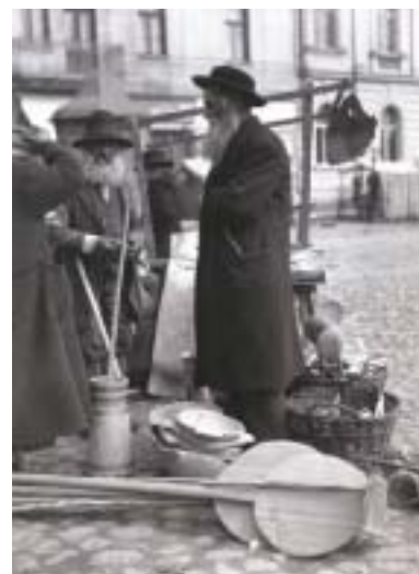
Na trhu, Užhorod, počátek 20. let.

Hana Opleštilová, Lukáš Babka: Zmizelý svět Podkarpatské Rusi ve fotografiích Rudolfa Hůlky . Vydala Národní knihovna České republiky, Praha 2014, 292 stran, 200 reprodukcí, text česky a anglicky, formát 24 x 23 cm, pevná vazba. Doporučená cena 420 Kč.