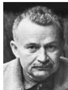
Alfréd Radok.