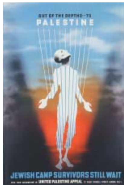
Z hlubin – do Palestiny, 1945. © Estate of Abram Games.

pravné nákresy. V dokumentech zachycuje i Gamesovo rodinné zázemí.