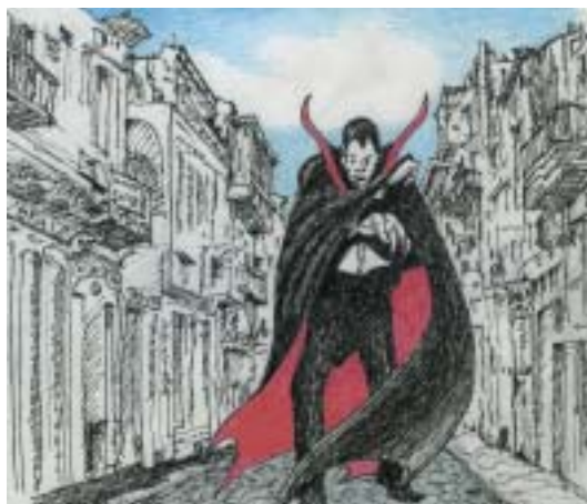
Ilustrace Jiří Stach.

co bušil holí na sklo výlohy, hrozivě vypadající mumie a jeden „hlásný“, jehož vyvolávání bylo slyšet na kilometry daleko. Hlad dělá z lidí umělce: tihle propuštění horníci s neuvěřitelným důvtipem vymýšleli celou škálu převleků. Z na černo obarvených pytlů od mouky šili šaty Zorra mstitele nebo hraběte Drákuly, z odstřížků vytažených z popelnic vyráběli škrabošky a přilbice válečníků; kdosi přišel s prašivým psem navlečeným v ponču, který uměl na zadních tancovat zamacueku , další nabízel dítě, co vydávalo skřeky jako racek.