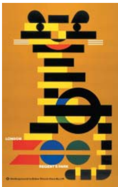
Londýnská ZOO, 1976.

Po válce se Games vrátil na volnou nohu a pracoval pro takové klienty, jako byly firmy Shell, list Financial Times , pivovar Guinness, letecké společnosti British Airways a El Al. Jeho „firemní“ plakáty jsou vtipné a nikdy nejsou podbíživé. Pro Financial Times například vytvořil obraz čtenáře ve tvaru roztažených novin, jenž sedí v podzemce, přes papírové nohy mu leží tradiční britská hůlka a vedle nich aktovka. Navrhoval i obálky knih pro nakladatelství Penguin Books či poštovní známky, mj. příležitostnou známku pro olympijské hry v Británii roku 1948. V letech 1946 až 1953 vyučoval na Královské umělecké akademii, studenti na něj vzpomínají jako na kritického, ale inspirativního a jemného učitele.