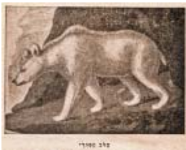
Ha-dov ha-suri – medvěd syrský.

Během expedice se mu podařilo nalézt asi třicet živočišných druhů, jež do té doby nebyly popsány. Napak mnohá zvířata, která Aharoni pozoroval a zdokumentoval, již vyhynula. Patrně nejslavnějším Aharoniho objevem byl syrský (zlatý) křeček ( Mesocricetus auratus ). Roku 1930 požádal Aharoniho parazitolog