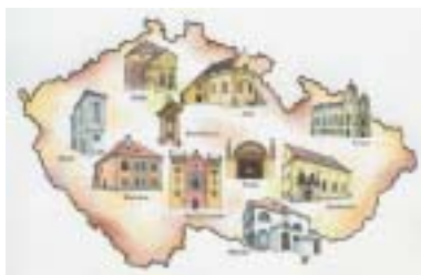
Revitalizace I – 10 hvězd. Kresba Jiří Stach.

ším měřítku – ucházet o podobný grant ještě jednou. Znamenalo to realisticky zvážit vlastní (zbývající) síly, během krátké doby připravit novou žádost a zavázat se k časově ještě náročnějším