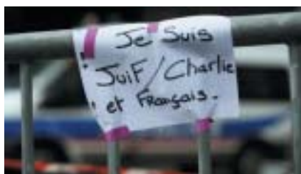
Je suis Žid / Charlie a Francouz. Improvizovaný plakát na bezpečnostní bariéře před košer obchodem v Paříži.