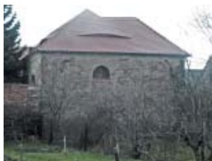
Barokně-klasicistní synagoga v Neveklově.

Projekt počítá s kompletní rekonstrukcí objektu a obnovením původních oken a vstupů i zaniklé galerie a schodiště