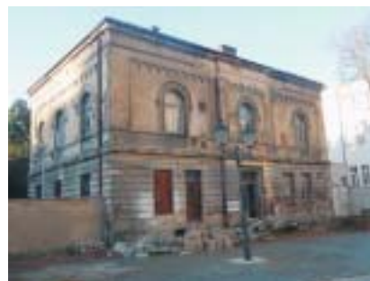
Rabínský dům za Velkou synagogou v Plzni.

Jedinou nesynagogální památkou zařazenou do nového projektu je plzeňský rabínský dům, postavený zároveň s Velkou plzeňskou synagogou na konci 19. století. Za druhé světové války i po ní tu byla umístěna laboratoř. Po roce 1989 byl objekt vrácen plzeňské židovské obci. Dnes je budova v poměrně