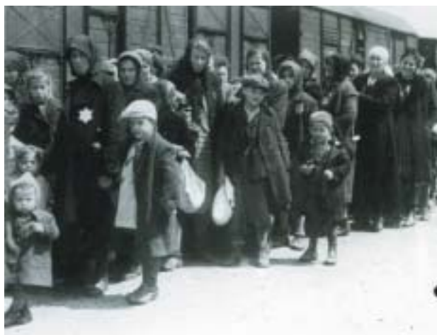
Na cestě k plynovým komorám, Birkenau, 1944.

hoří bloky, lidé zmateně pobíhají, podařilo se vybít dráty, několik opovážlivců se vrhá proti ozbrojeným strážím, za několik minut nastupují pohotovostní oddíly se psy, plamenomety a s kulomety. Kolik bezbranných lidí může zabít jeden kulomet?“ Podle Ruth Bondyové existoval plán prorazit bránu BIIb parním válcem, používaným při stavbě silnice, „Lágrovky“. Ale i kdyby se to zdařilo, co potom? „ Krčení ramen. V dřevácích a rozdrbaných vězeňských šatech, bez peněz, osobních dokladů a kontaktů nebylo kam utéct. Nalevo se nacházel karanténní tábor, napravo tábor maďarských žen; dál stál mužský lágér s cikánským táborem naproti; přes cestu byl tábor SS a na