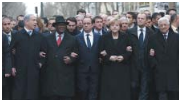
Paříž 11. ledna 2015.

Jenže už o dva dny později, v pátek 9. ledna, přepadl francouzský džihádista Amed Coulibaly košer lahůdkářství na východě Paříže, vzal několik rukojmí a čtyři z nich – frankofonní Židy z Tuniska – zavraždil. To už nebyl zápas o podobu svobody slova, ale protižidov-