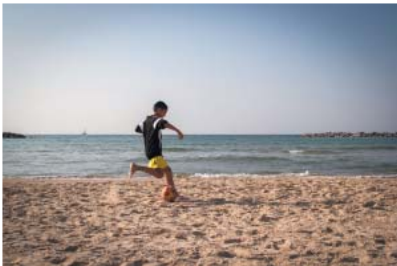
Z cyklu Pláž, 2014.

hyb je v nich však přítomen: především chůze, ale také jízda na kole, na motorce, na skejtu, vlnění moře či vanutí větru. Lidé na fotografiích očividně nespěchají, sami se řídí svým rytmem a mají svůj cíl: mladík nese kytici své milé, chlapec dobíhá míč, maminka tlačí dět-