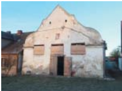
Synagoga v Polici u Jemnice.

Zpřístupněním obnovených památek veřejnosti pro FŽO práce sice nekončí – o synagogy s expozicemi je třeba se starat, udržovat je a zajišťovat v nich návštěvníkový provoz i v následujících