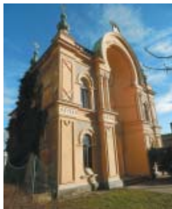
Synagoga v Čáslavi.