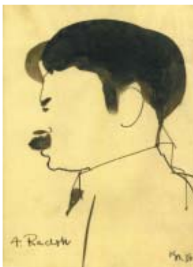
Karikatura Alfréda Radoka od Bohumila Krse, 1950.

rium a seznam základní literatury. Graficky zajímavě (byť textově poněkud chaoticky) upravená publikace tak tvoří doplněk k hlavním radokovským publikacím, především knize Zdeňka Hedbávného Alfréd Radok. Zpráva o jednom osudu (1994).