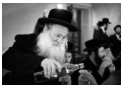
Návrat chasidů do Mikulova.

a české kinematografii představí v rozhovoru s Petrem Brodem Šárka Sladovnicková z Centra pro studium holokaustu a židovské literatury FFUK.