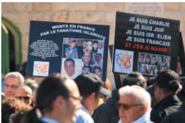
Jeruzalém 13. ledna 2015.

Není to ojedinelý názor. Totéž a ještě drsněji rozvíjí Dan Margalit v listu Israel ha-jom . V jednom ohledu, píše Margalit, jsou na tom evropští Židé lépe než jejich hostitelské státy i společnosti. Židé mají domovinu, do níž se mohou vrátit, respektive v ní najít útočiště – Stát Izrael. „Ale kam utečou Holanďané, Belgičané, Francouzi, Němci a Švédové, až se smrtelné símě Islámského státu bují v evropském