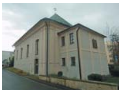
Synagoga v Poláckově Rychnově nad Kněžnou.

V letech 1993–1995 byla rekonstruována do původní podoby. Na jižním prů-