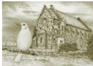
Kresba Jiří Stach.

kdy mu chybí pigment v peří. Ostatní potomci tohoto kosa budou zase černí. Pro svou bílou barvu se může stát rychlou obětí predátorů a mezi černými kosa není také vítán. Poprvé jsem ho viděl před dvěma měsíci u Ve-