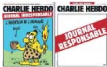
Vlevo: Charlie Hebdo , nezodpovědný žurnál. Vpravo: Konec legrace! Zodpovědný žurnál.

Obojí má přitom hranice, které jsou možná do jisté míry závislé na míře vhledu a na osobní citlivosti, ale v obecné rovině vystihují problém celkem jasně. Kreslený humor ve službách ideologie totiž na rozdíl od autentické satiry postrádá vtip, pointu, moment překvapení či prozření – posiluje jen stereotypy (v horším případě ty zcela lživé) a utvrzuje čtenáře v jeho vlastních pravdách. Tato charakteristika překvapivě spojuje propagandistický humor komunistického Dikobrazu , antisemitské kreslené vtipy kreslířů z řad radikální levice i pravice a dokonce i karikatury Mohameda z dánského deníku Jyllands Posten . Dále pak nenávistný humor cílí na celá etnika, sociální skupiny či náboženství: Mohamed s bombou místo turbanu, jak ho zveřejnil dánský deník, chce přesvědčit čtenáře