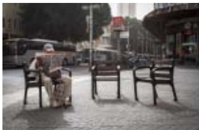
Tel Aviv.