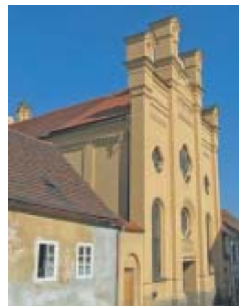
Průčelí synagogy v Písku.

Písecká synagoga v Soukenické ulici byla postavena roku 1872 v orientálním slohu s novorománskými prvky jako náhrada za starší modlitebnu, doloženou ve městě od počátku 18. století. Bohoslužebným účelům sloužila do druhé