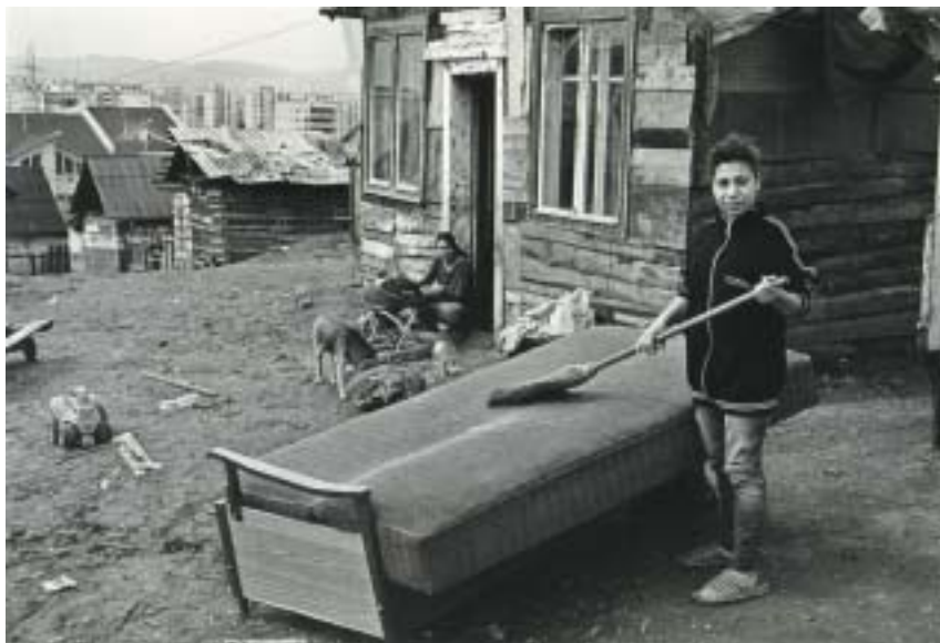
Romská osada u města Kluž.

Snímky byly roku 2013 vystaveny v klužské Městské galerii a vydány ve výpravné publikaci nazvané From the Inner Margines . Instalace vzbudila velkou pozornost: díky ní se konala konference zabývající se postavením Romů jako „lidí na okraji“ i hledáním cest, jak