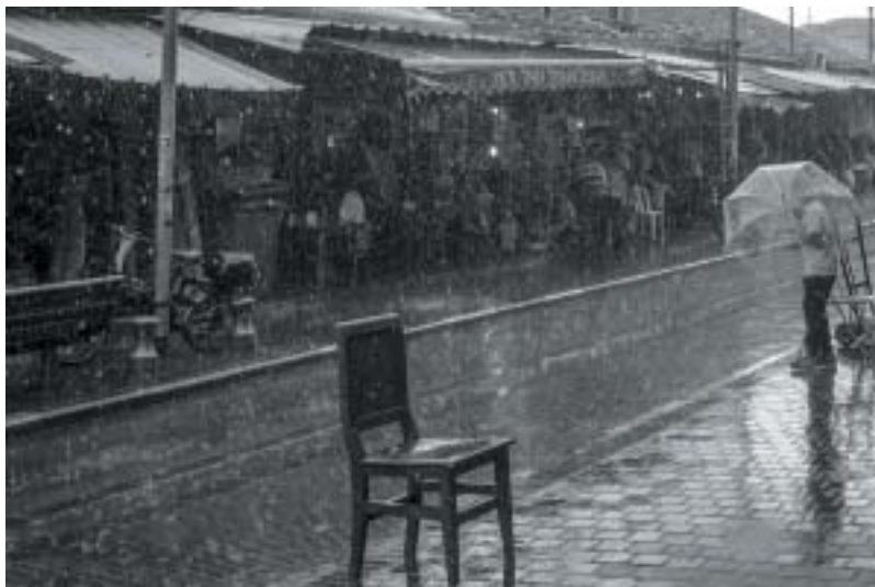
Zima v Tel Avivu, 2014

čují události neobvyklé (i když teroristické útoky se odehrály a bohužel odehrávají i zde), ale ty přirozené, všední a osobní. Nejsou to snímky akční, po-