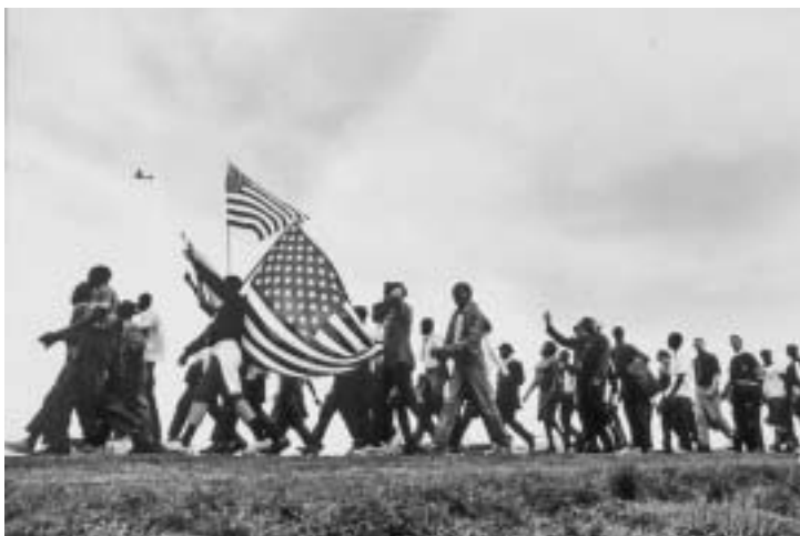
Pochod Selma – Montgomery, Alabama, USA, březen 1965.

Letos v březnu si Američané připomněli půl století od demonstrací, jež se na jaře 1965 konaly na podporu občanských a volebních práv amerických černochů v jižních státech země, obecně známých jako pochody v Selmě. Na tehdejší dobu – s jistou pýchou a vlastně i s nostalgii – vzpomínali též autoři v židovských médiích. S pýchou proto, že do boje za černošská práva se zapojila řada židovských aktivistů a rabínů, a s nostalgii proto, že podobné období tak dobrých afroamericko-židovských vztahů, jimž tehdejší aktéři přisuzují i určité starozákonní kvality a étos, se v zemi už nikdy neopakovalo.