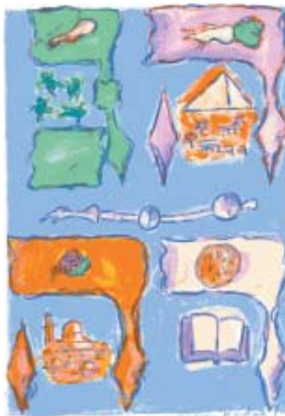
Mark Podwal: Hagada , frontispis.

Hospodin zasáhl do dějin, aby pomohl bezmocným otrokům ke svobodě, ale to se událo už hodně dávno – od té doby nechává odpovědnost na nás.