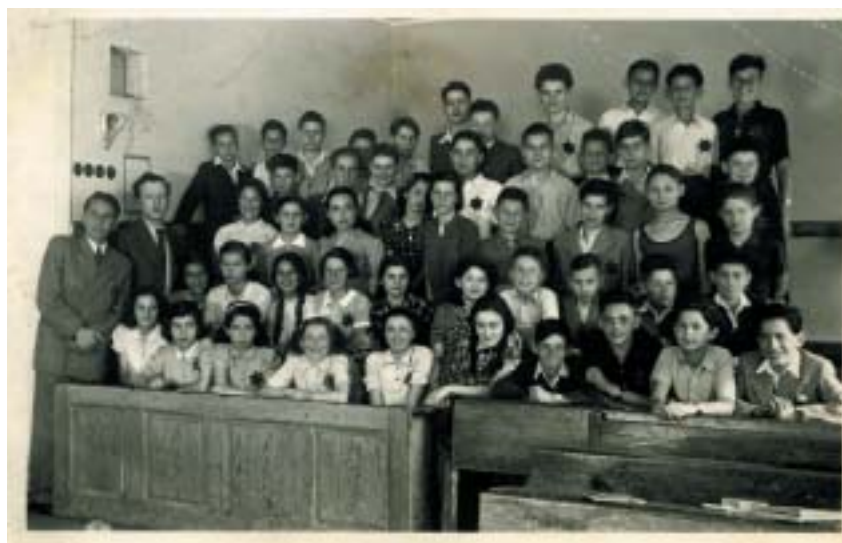
Jáchymka, třída 2. B, květen 1942.

Lektoři ITI plánují, že stará Jáchymka znovu ožije. Rozhodli se spojit znalosti o této židovské škole, jejíž pedagogové do značné míry naplňovali představu dnešní alternativní (ve smyslu liberálnější a k dětem přátelštější) výuky, s tím, co lze vypátrat o romské škole v Užhorodu. Ta byla otevřena roku 1926, vznikla na přání (a s pomocí) samotných Romů a byla první svého druhu v Československu a údajně i v Evropě. Na základě společných zkušeností těchto dvou menšinových škol vznikl s finanční pomocí Norských fondů a ministerstva školství 2,5hodinový vzdělávací program nazvaný Jáchymka – Výchova k respektu a toleranci . Zatím se s ním seznámily děti z jedné romské školy a jedné české školy v Olomouci, které se