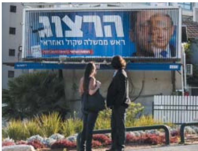
Život a bezpečí především, životní náklady až poté.