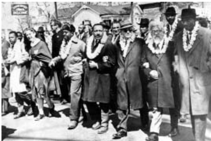
Martin Luther King Jr. (4. zprava) a rabi A. J. Heschel (2. zprava) v čele průvodu.

Druhý pochod se pod dohledem policie konal o dva dny později (ale jeho účastníci nesměli opustit hranice města a večer po něm došlo v Selmě k další vraždě) a třetí vyšel z města 21. března.