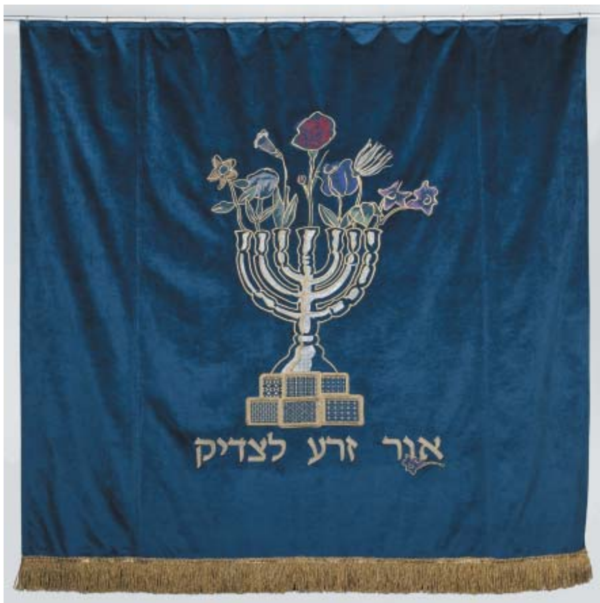
MARK PODWAL: SVĚTLO JE ZASETO SPRAVEDLIVÉMU Opona pro synagogu v Brně, 2015.

VĚSTNÍK ŽIDOVSKÝCH NÁBOŽENSKÝCH OBCÍ V ČESKÝCH ZEMÍCH A NA SLOVENSKU