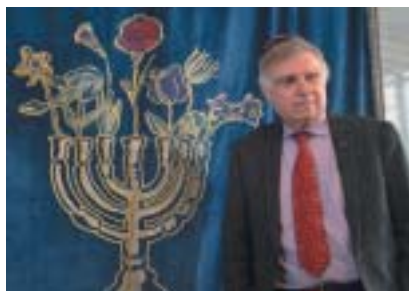
Autor parochetu Mark Podwal.

vyrůstají pestrobarevné květy. Autor ke genezi návrhu řekl: „Oddíl Tóry (Vajakhel) popisuje, jak pod dohledem Becalela, prvního židovského umělce, vznikl první svatostánek, aron ha-kodeš, a posvátné předměty.