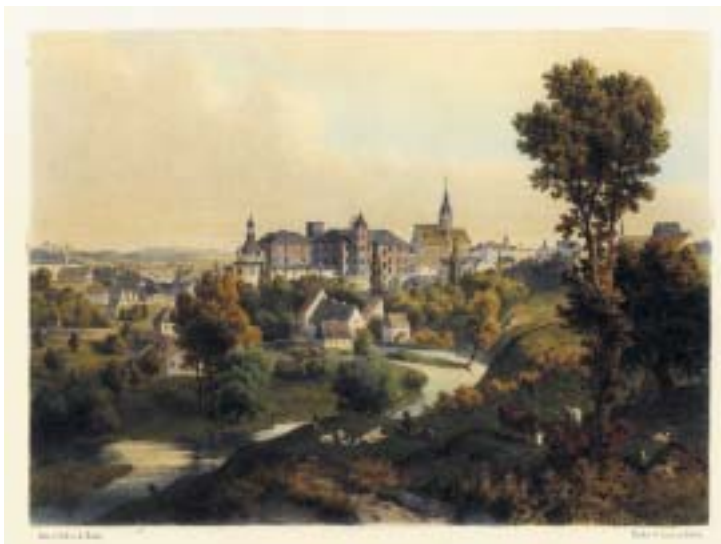
Jindřichův Hradec, litografie. Archiv Jihočeské vědecké knihovny v ČB.

Abrahamovi synové Isak a Samuel jsou pod těmito osobními jmény známi v pí-