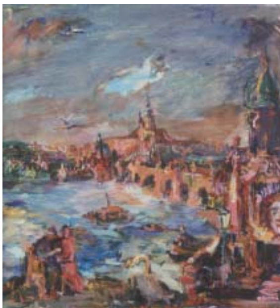
Praha – Nostalgie (detail), 1938.