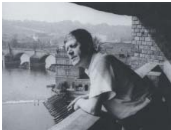
Oskar Kokoschka na terase svého ateliéru, 1935.