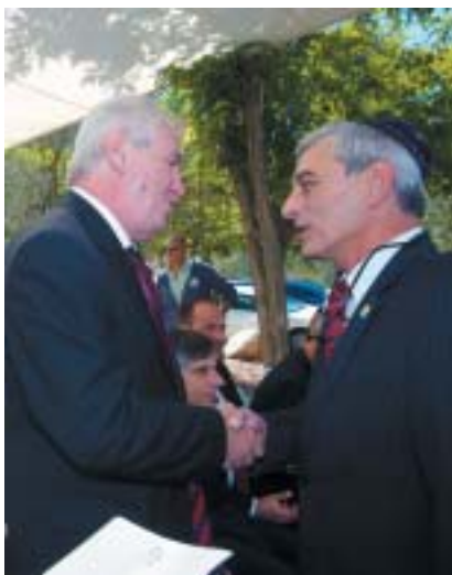
Z návštěvy v Izraeli v roce 2013.

Stejně bychom neměli mlčet k loňskému masakru v Oděse, spáchanému „nacionalisty“ na bezbranných obyvatelech, který velmi nápadně připomínal pogrom. Šest milionů mrtvých nás zavazuje k tomu, abychom nemlčeli, když se procházejí ozbrojenci se znaky SS na uniformách, když nacističtí zločinci