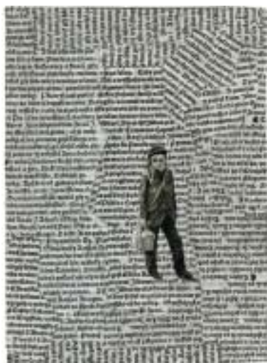
Koláže Jan Placák.

Jindřich Toman: Přechod Avarů k zemědělství. Vydalo nakladatelství Ztichlá klika v roce 2014, kolážemi ilustroval Jan Placák, 136 stran, dop. cena 350 Kč, v antikvariátu Ztichlá klika, Betlémská 10, Praha 1 (po-pá 13–19), 200 Kč.