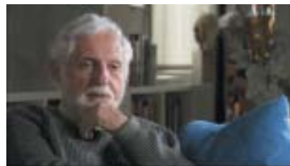
Carl Djerassi.

Po neuvěřitelně aktivním životě zemřel 30. ledna tohoto roku v San Francisku ve věku 91 let Carl Djerassi, jenž se proslavil jako „otec antikoncepční pilulky“.