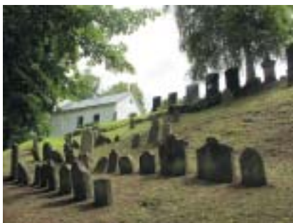
Židovský hřbitov v JH.