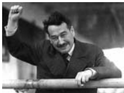
Egon Erwin Kisch, Melbourne 1934.

Před 130 lety , dne 29. dubna 1885 , se v Praze narodil německý spisovatel a novinář EGON ERWIN KISCH (zemřel 31. 3. 1948 v Praze), zakladatel moderní literární reportáže, jenž témata svých prací často čerpal v podsvětí a v židovském prostředí, hlavně pražském, ale i evropském a americkém, které poznal v exilu během druhé světové války ( Pražská dobrodružství ; Po stopách Golemových ; Pražský pitaval ; Příběhy ze sedmi ghet ). V textu Böhmische Juden eines Jahrhunderts se věnuje umělcům židovského původu, pře-