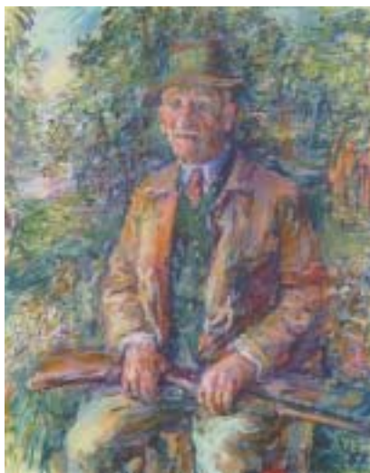
Oskar Kokoschka: Ferdinand Bloch-Bauer , 1936.