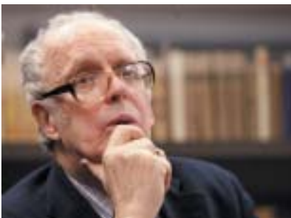
Miloš Pojar.

Dne 8. dubna by oslavil 75. narozeniny spisovatel, historik, editor a diplomat, přední znalec židovské historie a kultury MILOŠ POJAR (8. 4. 1940 Praha–23. 1. 2012 Praha). Vystudoval orientalistiku a filosofii na Karlově univerzitě, poté angličtinu v USA; dlouhá léta působil jako redaktor v nakladatelství Academia. Po pádu komunistického režimu stál u obnovy československo-izraelských diplomatických vztahů; díky němu a jeho práci ve funkci velvyslance v období