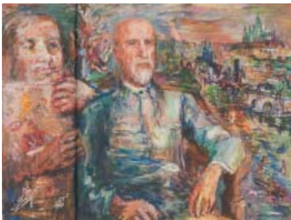
Tomáš Garrigue Masaryk, 1935/36.

Oskar Kokoschka (1886–1980) se chtěl v Praze zastavit jen krátce, na pozvání prezidenta T. G. Masaryka, aby namaloval jeho portrét. Nakonec se pobyt protáhl od konce září 1934 do poloviny října 1938. Ačkoli nebyl emigrant, s návratem do Vídně po fašizujícím převratu kancléře Dollfusse již nepočítal. K Pra-