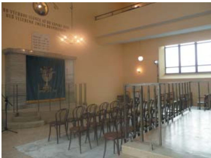
Interiér brněnské synagogy.

Kromě modrého parochetu vytváří Mark Podwal pro Brno oponu pro svátky, pokrývky na pult pro čtení z Tóry a na kantorský pultík a pokrývku pod chanukový svícen. Všechny textilie budou sametové a vyšíváné.