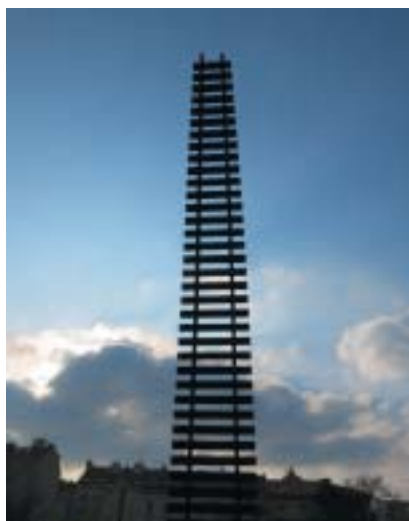
Brána nenávratna Aleše Veselého.

Součástí programu budou již tradičně přednášky a debaty významných českých akademiků, diplomatů, publicistů a umělců. Zmínit lze například debatu na téma „Kulturní bojkot Izraele: Cui