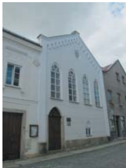
Synagoga v Jindřichově Hradci.

semných pramenech a uvádění i v literatuře, avšak uvnitř židovské komunity používali hebrejská jména Ejzik a Zaniel. Oba v dalších desetiletích zaujali místo v čele jindřichohradecké židovské