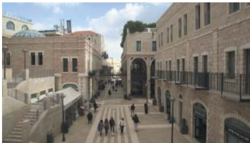
Davidovo město ve čtvrti Mamilla.

nování? Odpověď na tyto otázky je samozřejmě ovlivněna mezi jinými životním stylem budoucnosti, technologií ve stavebnictví i ekonomickou situací na trhu nemovitostí. Heslem programu v 60. letech 20. století bylo: „zahrada pro každého“, metafora, kte-