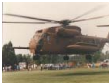
Havel s doprovodem přistává v Kfar Masaryk.