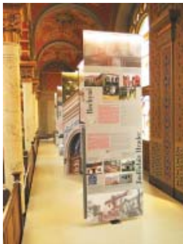
Expozice Židovské památky na pravé galerii.

Druhá stálá expozice Židovské památky a jejich rekonstrukce po roce 1989 představuje na deseti panelech a dvou obrazovkách 64 lokalit, ve kterých se tyto