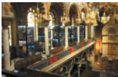
Levá galerie s panely expozice ŽOP po roce 1945.

První z nich, nazvaná Židovská obec v Praze od roku 1945 po dnešek , prostřednictvím unikátních fotografií a dokumentů zachycuje zásadní okamžiky existence pražské židovské obce od konce druhé světové války až do současnosti. „Průměrný návštěvník expozic věnovaných historii pražských Židů mohl snadno nabýt dojmu, že tato historie skončila vyvražděním většiny osob označených za neárijce za druhé světové války. Ale