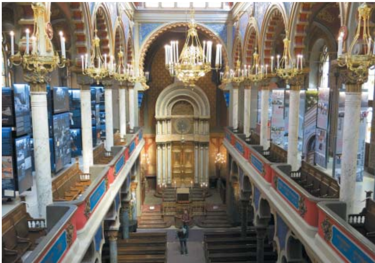
Pohled do lodi Jeruzalémské synagogy. Na levé galerii je umístěna expozice Židovská obec v Praze od r. 1945 po dnešek , na pravé Židovské památky po roce 1989 .

nost, začaly se zde pořádat koncerty a umělecké výstavy a ovšem i nadále také bohoslužby. Dnes se o její kráse a architektonické hodnotě mohou pře-