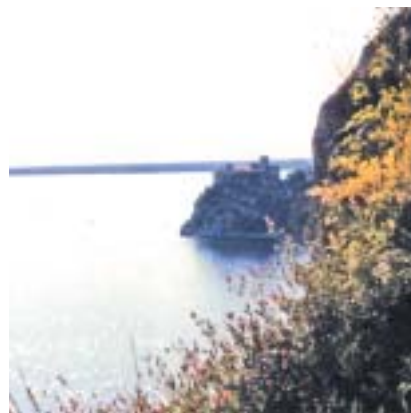
Pohled na zámek v Duinu.

Další terezínskou skladbou s prvoválečnou reminiscencí je známý melodram Píseň o lásce a smrti korneta Kryštofa Rilka podle básně R. M. Rilka. Když byl Ullmann převelen do Barcoly u Terstu, pozoroval ze své kóty v blízkosti města Duino zdejší zámeček, v němž pár let předtím básník žil a pracoval. A Ullmann si Rilkeho báseň nechal poslat a přímo na své pozorovatelně ji četl. (am)