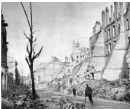
Fotografie ze zničené Varšavy archiv.

Je to už celých dlouhých i krátkých sedmdesát let, co skončila nejničivější a nejvražednější ze všech válek, co jich bylo, druhá světová válka. Během ní za strašných okolností zahynulo šest milionů evropských Židů, ale mezi oběti patří také miliony Rusů, Poláků, Ukrajinců, Indů, jenom Číňané vyčíslili své oběti na deset milionů, Francie, Velká Británie a USA přispěly každá svým půlmilionem a Němci, kterým vůdce sliboval světovládu, zahynulo na sedm a půl milionu. Celková bilance je neuvěřitelná: 62 537 400 mrtvých. Víc než polovinu z toho tvoří oběti mezi civilním obyvatelstvem.