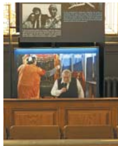
Detail panelu z expozice ŽOP od roku 1945.

Přijďte se do synagogy v Jeruzalémské ulici 7 v Praze 1 podívat. Budete obdivovat její secesně stylizovaný maurský sloh, bohatou a opět barvami zářící výzdobu, barevné vitráže ve velkých oknech, zlacené hebrejské nápisy, tepané lustry i opravené varhany. Z výstav se dozvíte mnoho zajímavého o vzdálené i nedávné židovské historii. A v neposlední řadě se také na chvíli vymaníte z hektického provozu okolního města, okusíte uklidňující atmosféru „nového chrámu“, a jak si přáli jeho zakladatelé,