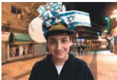
Izrael. Foto Karel Cudlín, 2014.

ním Spravedlivý mezi národy a čestným občanstvím Státu Izrael), bojoval i ve varšavském povstání roku 1944.