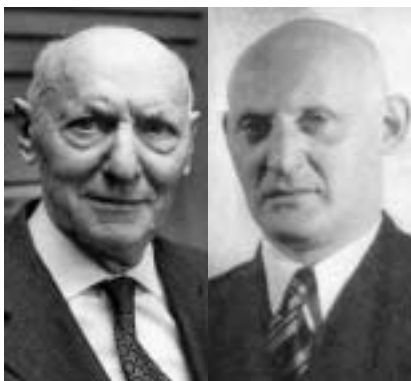
Isaac Bashevis a Israel Jošua Singerové.

Vysoce ceněná literární tvorba bratří Singerů, Israela Jošua a Isaaca Bashevisa, je známá po celém světě. Už méně se ví, že spisovatelkou byla i jejich starší sestra Esther (1891 Bilgo-