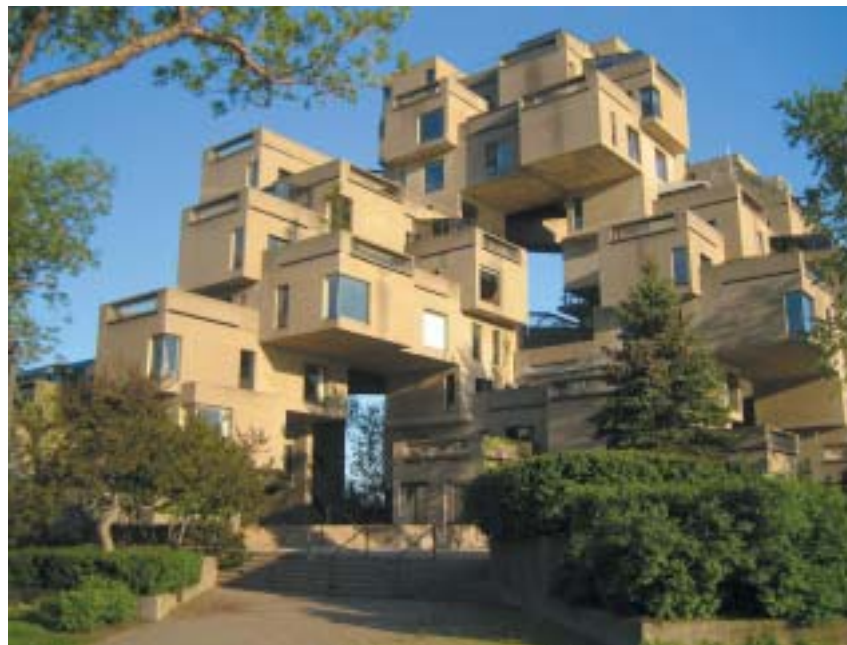
Habitat 67 spojuje výhody bydlení v rodinném domku s městskou hustotou osídlení.

Mezitím stačil Safdie podat projekt do mezinárodní soutěže na stavbu Centre Pompidou v Paříži, vyhlášené v prosinci 1970. Ze 681 podaných návrhů mu porota udělila druhé místo (první získal italský architekt Renzo Piano, jehož