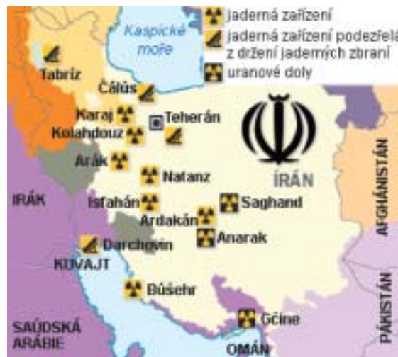
Mapa známých íránských zařízení.

Netanjahu má pravdu ve své kritice jednotlivých bodů dohody. Dokládá to i článek na webu Debka, který rozebírá Obamův rozhovor pro The New York Ti-