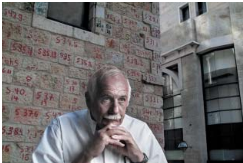
Moše Safdie v jeruzalémské čtvrti Mamilla.

dent z každé školy architektury v zemi jel podívat na to, jak se stavějí domy, do Spojených států. Já měl to štěstí, že jsem mohl jet roku 1959. Jenže jsem tam viděl hlavně byty ve výškových budovách, ve kterých nechtěl nikdo bydlet, kde bujelo násilí a lidé tu nebyli šťastní. Mezitím postavil Le Corbusier L'Unité d'Habitation v Marseille, a vypadalo to, jako by zradil