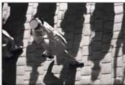
Charles de Gaulle, Alžír 1958.

ního světa, překvapivě promyšlení jiných cest, široké znalosti z mnoha oborů a nepřeborné bohatství českého jazyka.