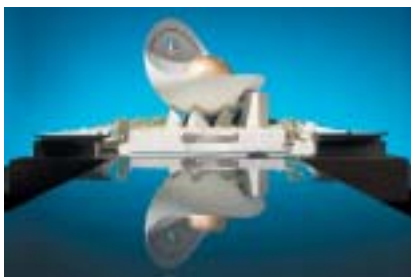
Návrh mešity v Dubaji, 2008.

Tenhle vtíp mě napadl, možná ne úplně vhod, když jsem na výstavě o práci architekta Mošeho Safdieho v centru