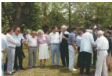
Čekání na prezidenta, Kfar Masaryk, 1990.