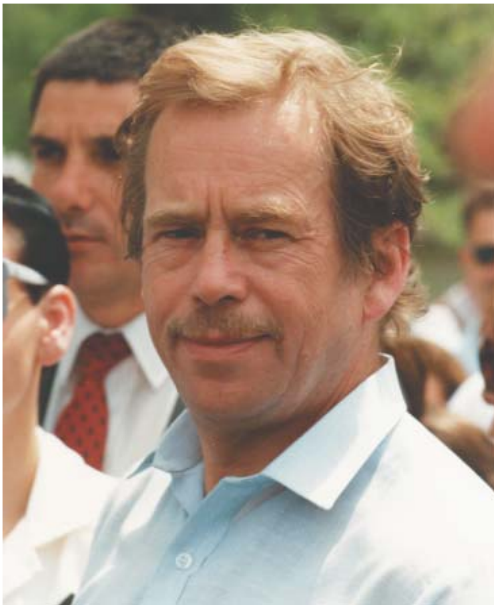
Před pětadvaceti lety navštívil prezident Václav Havel poprvé Stát Izrael. K článku na stranách 8–9.

VĚSTNÍK ŽIDOVSKÝCH NÁBOŽENSKÝCH OBCÍ V ČESKÝCH ZEMÍCH A NA SLOVENSKU