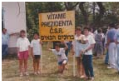
Baruchim habajim, uvítání v Kfar Masaryk.

dým úkolem. Praha byla po staletí duchovním centrem Evropy, městem, v němž žily tři národy, jejichž kultury se vzájemně prolínaly, ovlivňovaly se a soutěžily spolu. Němčina jako druhý