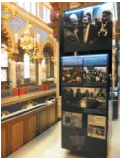
Jeden z panelů expozice ŽOP od roku 1945.

svědčit jak Pražané, tak i návštěvníci z celé republiky a ze zahraničí. A ne-