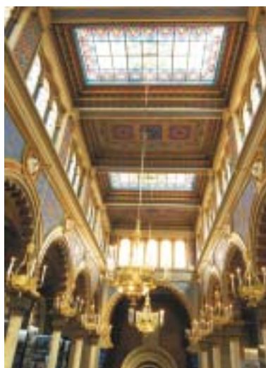
Pohled do stropní části.

a od té doby se prakticky každý rok udělalo něco pro záchranu krásné stavby. Došlo k restaurování vitráží oken, obnově modlitebny v prvním patře, restaurování hlavního průčelí a portálu synagogy, nástěnných maleb v interiéru i k postupné obnově vnitřního zařízení. Práce postoupily tak daleko, že bylo možné synagogu otevřít pro veřej-