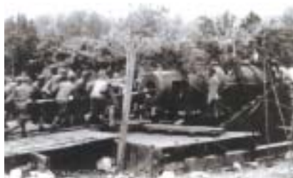
Houfnice v akci v údolí Soči.