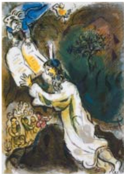
Mojžiš přijímá desky s Desaterem. Marc Chagall.

znamená žít ve věrném vztahu s Bohem. Tento vzor nalézá v Abrahamovi a Sáře.