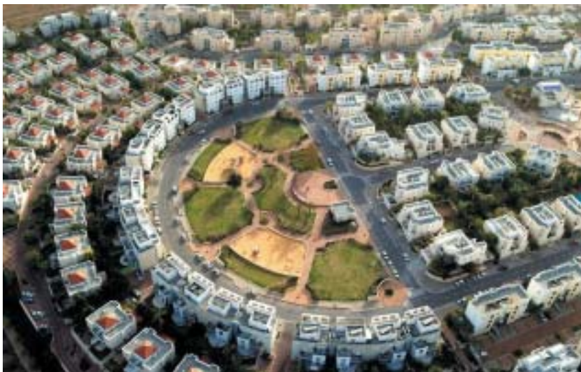
Základní kámen města Modiin, postaveného dle projektu M. Š., byl položen roku 1993.

tu. Na konci se pak hranol jakoby otevírá v otevřený prostor, hledící do údolí Ejn Kerem. Safdie tu jako ve většině svých děl využívá propojení krajiny s budovou a metaforu východiska z holokaustu do světlé budoucnosti v Izraeli. Sám říká, že má rád narativní architekturu, budovy, které vyprávějí příběh.