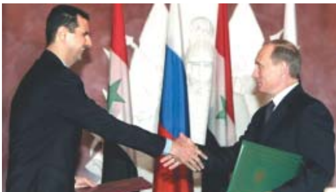
Syrský prezident Bašár Asad a Vladimir Putin.

Zprv je to politické selhání Arabů. Co nabízí jejich svět mladým? Přísné monarchie, vojenské diktatury, islámské teokracie či vražedný chaos. Tunisku