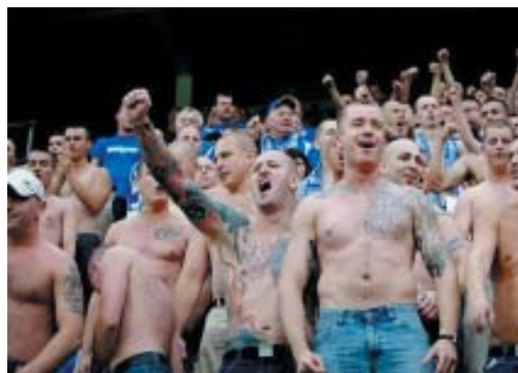
Fanoušci Wisly, odpůrci Cracovie, přezdívaní Anti Jude Gang.

Nejjednodušší odpověď by byla, že jde o nezaměstnané mladíky se základním vzděláním. Ano, takoví tam jsou a není