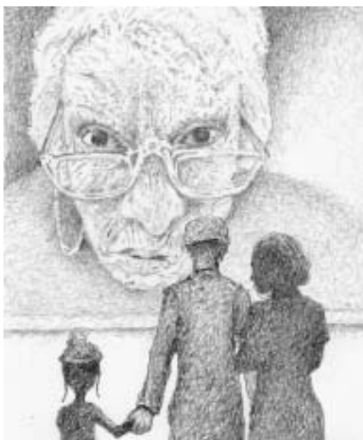
Ilustrace Jiří Stach.

nepopsatelné tajemství Krymu, ale až ho odhalovali sebevíc, stále zůstávalo tajemstvím. Pracovnice muzea dokonce ani nebyla z Krymu, ale z Petrohradu, na pohled však vypadala jako ochránkyně tajemství. Ukázala mladým voskové figurky harémových žen a eunuchů, měděné džbány, fontánu, která pamatovala Puškina. „Viděl jsem hřbitov mrtvých chánů, poslední místo tyranů...“ Muzejní pracovnice řekla, že je zítra ráno zavede do Čufut-Kale, ale na noc se jich ujmout nemůže, pro-