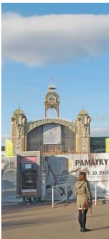
Výstaviště v Praze v Holešovicích.

Na veletrhu proběhlo také mnoho doprovodných akcí, konferencí, seminářů, workshopů i výstav. Zabývaly se možnostmi financování kulturního dědictví, novými technologiemi v oblasti rekonstrukcí a restaurování památkových objektů, ozvučením kostelů a sálů a mnoha dalšími tématy,