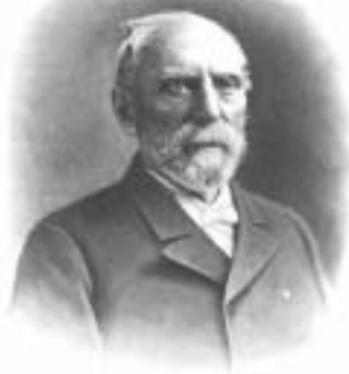
Charles Louis Fleischmann.