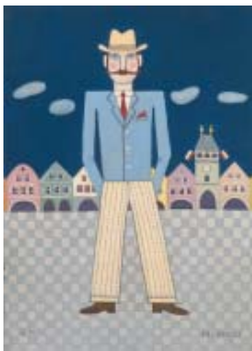
Fešák na náměstí v Lounech, 1992.

zdědil po otci, stejně jako velkou lásku ke zvířatům. V brandýském domě měli psa a kočky, ježky a jeden čas také ochočenou kavku, kterou tatínek vykoupil od kluků, kteří jí chtěli naříznout jazýček a „naučit“ ji tak mluvit. A tak ptáci na Munkových