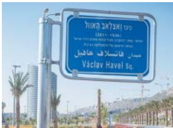
Náměstí Václava Havla v Haifě.