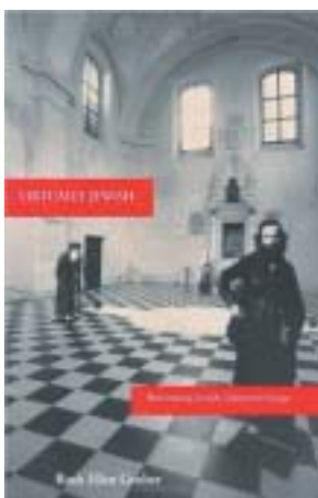
Obálka knihy Virtually Jewish .