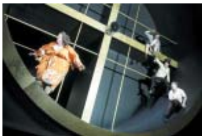
Inscenace Amerika v režii Wolfganga Engela podle Kafkova románu.