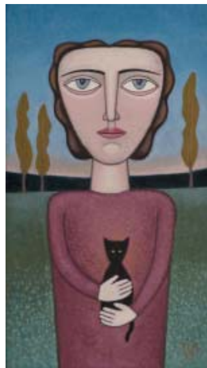
Dívka s kočkou, 1995.

V lednu 1957 si Viktor Munk poznamenal do deníku: „Rád se vracím do míst, kde jsem prožíval dětství. Oživují tu ve