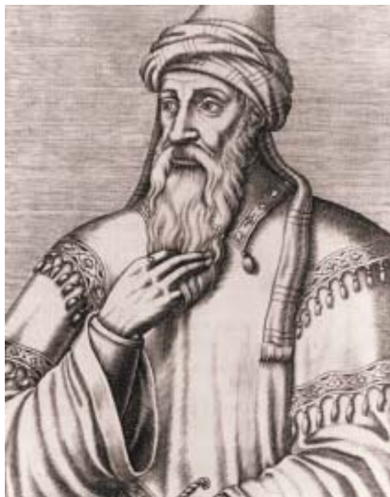
Portrét Moše ben Maimona od neznámého středověkého autora.

Postupně tak před námi vyvstává olbřímí a zároveň pokorná postava muže, stravovaného úsilím, aby za-