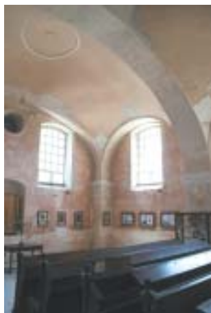
Interiér synagogy v Lošticích.

Monkeys ( 6. 11. od 20.00 v Jazz klubu Teplice), vernisáž výstavy Anna Franková – odkaz pro současnost s přednáškou ( 10. 11. v aule gymnázia), projekce filmů, přednášky a divadelní představení. Program naleznete na www.teplicky-cimes.cz .