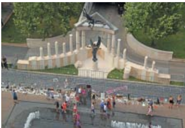
Kontroverzní památník na budapeštském náměstí Svobody.

V současnosti nastal jakýsi „klid zbraň“, Maďarsko předseda Mezinárodní aliance památky na holokaust (IHRA) a Or-