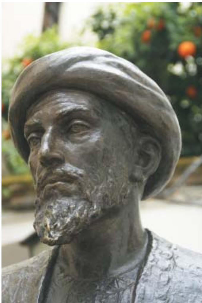
Detail Maimonidesova pomníku v Córdobě.

Vidíme tu paradox, který vyvolává zájem a zvědavost. Má snad jeho