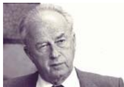
Jicchak Rabin.

Rabinův vrah si odpýváka doživotní trest. Během něho se oženil, bylo mu dovoleno, aby ho manželka několikrát navštívila, a dočkal se i syna. Jeho rodina žádala o propuštění, které by podle ní mělo přijít letos, po dvaceti letech ve vězení. Ale nikdo nečeká, že by se tak stalo. Kneset přijal již roku 2001 zákon „Jigal Amir“, který zakazuje zkrácení trestu vrahovi premiéra. Místo, kde byl na dnešním Rabinově náměstí zabit, se každoročně stává památkem, kam přicházejí tisíce lidí zapálit svíci. Ale dosud, a dnes snad ještě výrazněji, platí to, co napsal roku 2005 k výročí atentátu izraelský spisovatel David Grossmann: