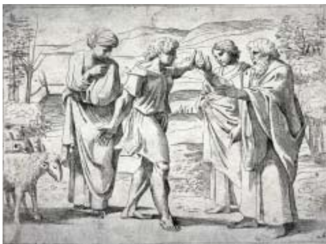
Sisto Badalocchio: Jakov a Lavan , 1607.

a o tom, jak Hospodin Židy zachránil od smrti a vyvedl je z otroctví. Proč se tedy v Hagadě hovoří o tom, že faraonovy příkazy vlastně nebyly úplně nejhorší a že Lavan byl ještě krutější? Jako by to nedávalo smysl – ať už z pohledu Hagady nebo ve vztahu ke skutečným faktům, jak je zaznamenává biblický text.