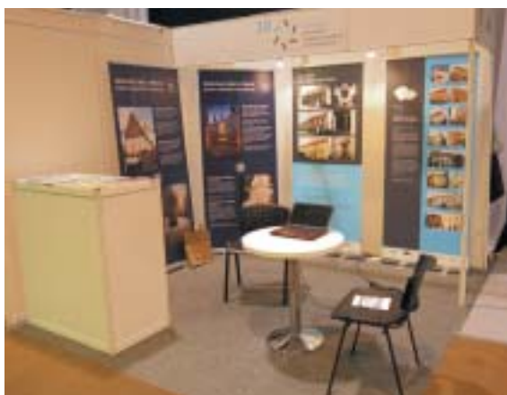
Stánek ŽOP a FŽO na veletrhu.

Pro toho, kdo má k minulosti a jejím památkám vztah, nebo se dokonce nějakou měrou podílí na snaze je zachovat, opravit a zpřístupnit, bylo pro-