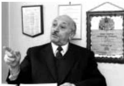
Simon Wiesenthal ve Vídni.

že tato sociální síť se stává prostředkem pro podněcování protizidovského násilí. Žalující tvrdí, že Facebook spojuje útočníky a díky společné „základně“ se pak podporují v násilí proti Židům. Žalobci žádají, aby Facebook prokázal právní a morální odpovědnost a takovéto vzkazy, stránky a hlášky aktivně sledoval a mazal.