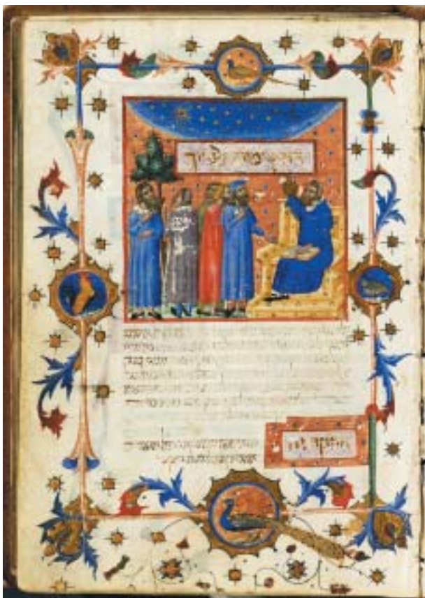
Illuminovaný rukopis More nevu'chim (Průvodce bloudících) z roku 1347.

může zabývat pouze archeologie myšlení (dokonce i v případě, že by spolu s Michelem Foucaultem přiznával oné archeologii veškerý její význam), a že tedy patří do oblasti vyhrazené medievalistickým specialistům.