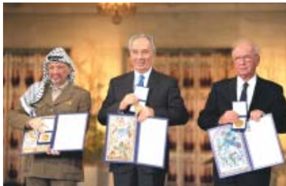
Za dohody v Oslu byla v roce 1994 Jicchaku Rabinovi, Šimonu Peresovi a Jásiru Arafatovi udělena Nobelova cena míru.

Podle tohoto názoru Palestinci vnímají celý Izrael – nejen Západní břeh a Gazu – jako analogii s Alžírskem: jako arabskou zemi, z které byli nakonec cizí kolonialisté vyhnáni. Proto byste Izrael – a to ani v hranicích před rokem 1967 – marně hledali v palestinských učebnicích a proto Palestinci trvají na tom, že se nikdy ne-