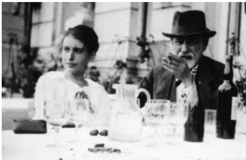
AF s otcem v Haagu, 1920. Snímky na této straně jsou z archivu Muzea Sigmunda Freuda ve Vídni.

V Londýně Freud strávil poslední rok života, zemřel 23. září 1939. Po jeho smrti se Anna vrhla znovu do práce: přednášela o dětské psychologii, ale hlavně: v poklidné čtvrti Hampstead založila domovy pro sirotky či děti, o které se rodiče (či rodič, většinou osamělá matka) nemohli starat, Hampstead War Nurseries. Praktickou péči spojovala s analýzou a snahou pomoci tím, že se dítě naučí rozpoznávat a zvládat obtížné pocity. Své teorie předávala kolegům,