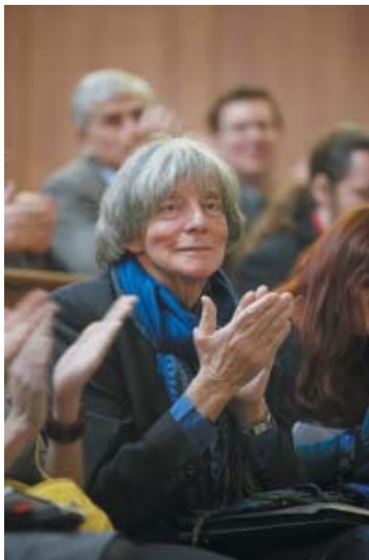
A. Glucksmann jako účastník debaty o svobodě, uspořádané na FF UK v Praze při příležitosti 20. výročí sametové revoluce.

ská Evropa narazila na osvícené „nevěřící“, jejichž existence zpochybňovala její neomylnost a nakonec ji přiměla vynalézt humanistické svobodné posuzování těch nejposvátnějších textů. Ve věku národů Židé bezděčně ztělesňovali Evropu bez hranic svolným pohybem zboží, idejí a citění, což jim jakožto páriům a lidem bez vlasti vyneslo odsouzení od veškerého