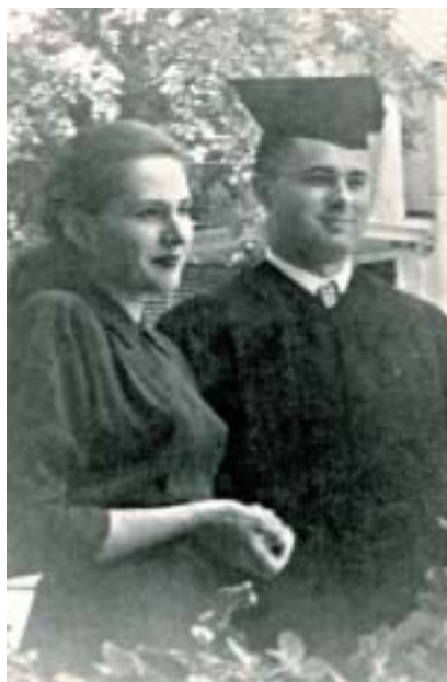
Mladí manželé, 50. léta.