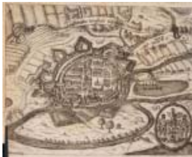
Historická veduta Českých Budějovic.

Přestože nikdo nepřiznal účast na zabiti chlapce, bylo sedm Židů 12. prosince upáleno na pozemku nového židovského hřbitova před Rožnovskou branou. Dalších třináct Židů bylo odsouzeno k trestu smrti utopením a verdikt byl vykonán pravděpodobně v noci z 29. na 30. prosince. Memorbuch Chevra kadiša v Krakově uvádí, že počet jmen zavražděných jde do dvou stovek.