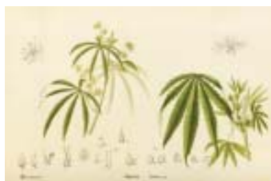
Cannabis sativa je nejrozšířenějším druhem konopí.

Přes vědecké výsledky a případové studie se většinová lékařská obec a farmaceutický průmysl konopí stále brání a převládá potřeba jeho užití regulovat. V různých zemích, kde je užití pro lékařské účely legální, existují různé modely regulace a distribuce. V Izraeli je 8 licencovaných pěstitelů, 600 registrovaných konopných patentů a 22 000 pacientů s licenci pro užívání. Získání této licence upravuje tzv. procedura 106, ta stanovuje postup a různé lhůty na základě závažnosti onemocnění. Na základě diagnózy dle seznamu závažných onemocnění má pacient nárok na licenci pro užití konopí. Např. v případě onemocnění rakovinou získá pacient licenci do 48 hodin. U gastrologických či neurologických onemocnění se lhůty pohybují v rozmezí od 3 do 12 měsíců a jsou podmíněny vyčerpáním jiných způsobů léčby. O licenci, kterou