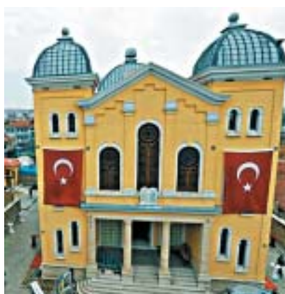
Znovu otevřená synagoga v Edirne.

dém Státu Izrael. Nyní zde tvoří jejich potomci více než polovinu obyvatel. Třicátý listopad byl přitom pamětním dnem uprchlíků z blízkovýchodních zemí ustanoven v Izraeli teprve nedávno, v roce 2014. Hlavní upomínkovou akcí v Izraeli byla pondělní ceremonie na Teddyho stadionu v Jeruzalémě.