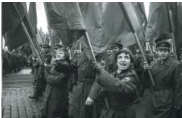
Praha, 1. máj 1985.

Fotografie jsou nainstalovány ve velkém formátu, lze je tedy pozorně zkoumat a rozeznávat detaily tváří i krajiny, jako to děláme u obrazů. Zvláštní pocit, že se před námi vyvstávají zcela konkrétní výjevy, či dokonce scény, které jsme mohli sami vidět a patří nějakým způsobem i do našich životů, je umocněn instalací v přízemí, kdy se