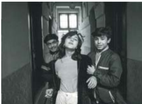
Žižkov, Praha 1982.

Cudlínem i přehled Cudlínových výstav a knižních publikací. Své dojmy z Cudlínových snímků shrnul na vernisáži výstavy dne 30. června rabín a spisovatel Karol Sidon. Jeho text přinášíme v úplném znění. (am)