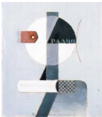
Vladimír Němucha: Kluk rádio , 1999. Ilustrace z knihy Zloději všedních okamžiků .

Mastěrkovové a Olgy Potapovové, které pocházejí ze soukromé sbírky Vsevoloda Někrasova.