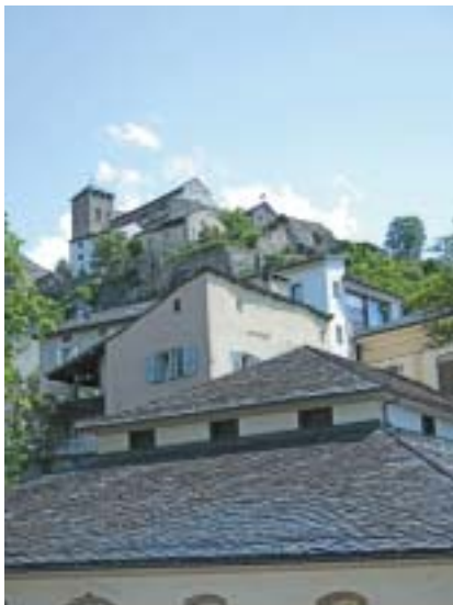
Sion – pohled z města na bývalou katedrálu.

jem. Navíc se vysoko nad ním nachází Crans-Montana, dvě obce, které se spojily v jedno zařízení na drahou a přepychovou dovolenou v zimě pro lyžaře, v létě pak zejména pro milovníky golfu.