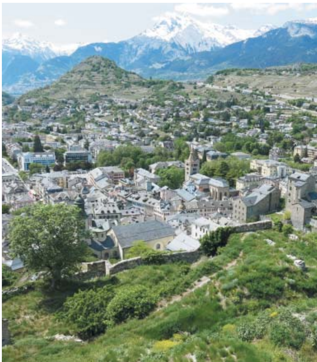
SION V LE VALAIS

VĚSTNÍK ŽIDOVSKÝCH NÁBOŽENSKÝCH OBCÍ V ČESKÝCH ZEMÍCH A NA SLOVENSKU