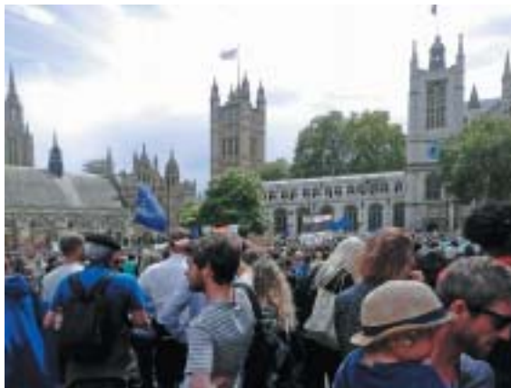
Milióny Britů žádaly vypsání nového referenda. Desítky tisíc jich 2. července vyšlo v Londýně na demonstraci na podporu setrvání v EU.

V Británii povstaly figury jako Nigel Farage či Jeremy Corbyn, v USA Donald