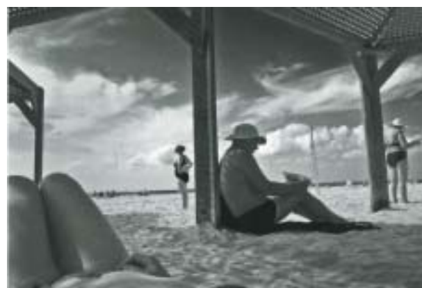
Tel Aviv, Izrael. 2012.

Zdánlivě z jiného soudku je fotka vyzáblé modelky v bikinách, předvádějící za rozbřesku svobody na módní přehlídce své zubožené tělo jako ideál ženské krásy. Inu, dovezená móda ze světa, kte-