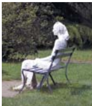
George Segal: Žena se slunečními brýlemi na lavičce, Muzeum P. Gianaddy, Martigny.

Martigny samo má svou keltskou a římskou historii, již dosvědčuje zachovalý římský amfiteátr a torzo římského paláce. Pro Římany a všechny jejich následovníky na vojenských výpravách mělo Martigny význam jako tranzitní bod