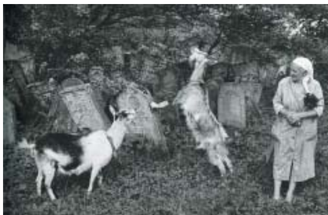
Kosiv, Ukrajina 1996.

vydával hledat krásu do jeho zdevastovaného zadního traktu, na jehož opravy ještě