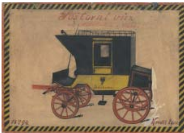
Poštovní kočár od Rohrbachra z Vídně. Kresba Viktor Katz, 1894.

číslo jedna, že mluvil jen česky, zatím co jiní ještě němčili. Byl pyšný na tatínkovu práci osvětovou a organizační, neboť tatínek raději nechal poštu poštu a jako člen městského zastupitelstva a zakladatel a předseda místního Okrašlovacího spol-