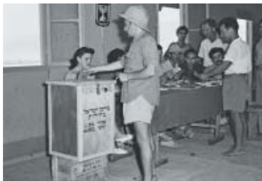
Volby do Knesetu v Izraeli v roce 1951.

1920 a pravidelné volby se v něm konaly až do roku 1944. Aby bylo zaručeno rovné zastoupení všech skupin a předešlo se vzniku majoritního systému, byl přijat poměrný zastupitelský systém a následně se prvních voleb účastnili kandidáti z 20 (!) stran a kandidátních listin. Největší frakce, socialistická Achdut ha-avoda (Jednota práce), získala 70 ze 314 křesel. Byl zvolen i výkonný výbor ( Vaad leumi ), ale vzhledem k tomu, že žádná strana neměla většinu, musela být vytvořena koalice. Její složení (labouristé, umírněné náboženské strany, liberální sionisté) do značné míry předurčilo konsenzuální