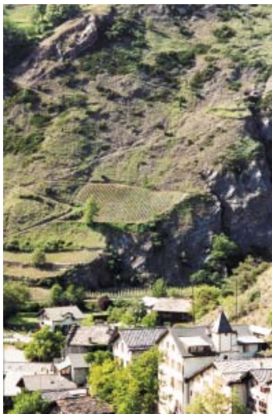
Vinice na strmých až kolmých svazích u Raronu.

stejně půdě a v podobné poloze, se projevuje v charakteru, chuti i vůni. A právě rozmanitost podloží, ze kterého si réva bere látky a minerály, spolu se skutečností, že slunečné podnebí i výrazné teplotní rozdíly mezi dnem a nocí ve Valais jsou ideální pro vývoj, kvalitu a zrání hroznů, způsobuje mimořádnou rozmanitost místního vína. Jedna odrůda, například všudypřítomné Chasselas, ve Valais nazývané Fen-