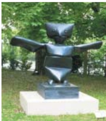
Max Ernst: Velký asistent , expozice v Martigny.

a křeslo v Kongresu za Louisianu. Stejně jako v minulosti i nyní zakládá svou kampaň na populistické obhajobě práv bílých Američanů nižších vrstev, neboť „nikdo jiný“ tak prý nečiní.