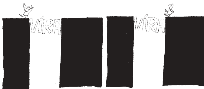
Kresba Ivan Steiger. Izajáš 11,2.

své jednání vysvětluje v paršat Vaetchanan, stalo se tak lemaanchem , kvůli vám: Hospodin se na mne kvůli vám rozhněval a nevyšlyšel mne, a Hospodin mi řekl: Máš dost, už o této věci znovu nezačíněj! Prikáž však Jehošua a ujisti ho a posil, jelikož ten přejde před čelem toho lidu a přidělí jim do dědictví zemi, kterou ty vidíš. Moše se těmito slovy vrací k tomu, co předeslal v již v první paraše knihy Dvarim při rekapitulaci odmítnutí pokolení pouště dobytí Svatou zemi. Ale i na mne se Hospodin kvůli vám rozlítl, řka: Ani ty tam nepřijdeš! Jehošua, Nunův syn, jenž stává před tebou, ten je tam přiveď, toho potvrď, protože on to bude, kdo Jisraelel přidělí zemi do dědictví! Verdikt tedy padl v důsledku toho, že lid tváří v tvář nepříteli nevěřil, že je Bůh v jeho nitru. Oproti podobné větě v paršat Vaetchanan, kde „kvůli vám“ zní v originále lemaanchem , použil ale Moše v paršat Dvarim slovesa biglalchem . Biglal znamená, že se něco stalo v důsledku něčeho, lemaan však znamená udělat něco pro někoho. Jestliže se tedy Hospodin na Mošeho rozlítl v důsledku nevěrnosti lidu jeho nejvyššímu Já, je to něco jiného, než že se na Mošeho rozhněval pro jejich dobro. I výraz „rozhněval“ je slabší než „rozlítl“, protože rozhněvání, evra , podobně jako avera , přestupek, naznačuje přechodnost činu. Proto jsou i úvodní dvě slova „máš dost“ vykládána tak, že tentokrát Bůh Mošeho utěšil, že jeho zásluhy tím nejsou