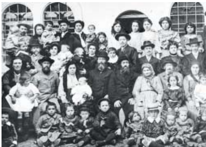
Každá komunita se musela rozhodnout, kdo má nárok účastnit se její správy.

ji nejrůznější autoritářské a nedemokratické režimy – vojenské diktatury, vláda jediné strany, komunismus, dynastická nebo personální diktatura – a v některých případech jejich kombinace. Proč je Izrael – příklad popsaný výše – jiný a jak to, že je stále scho-