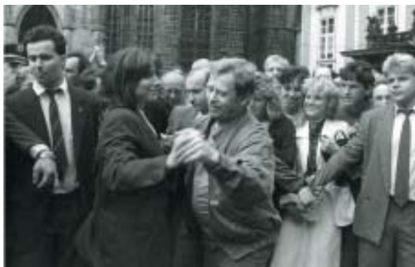
První svobodné volby, Praha 1990.

Tváře pochodujících lidových milic na Prvního máje, holdujících představitelům státního teroru mimo obraz. Milicionáři byli před třiceti lety pastvou pro objektivy i jiných fotografů, ale jim byly sváteční demonstrace režimu pro smích. Režim při svých orgiích odhaloval vědoucímu oku