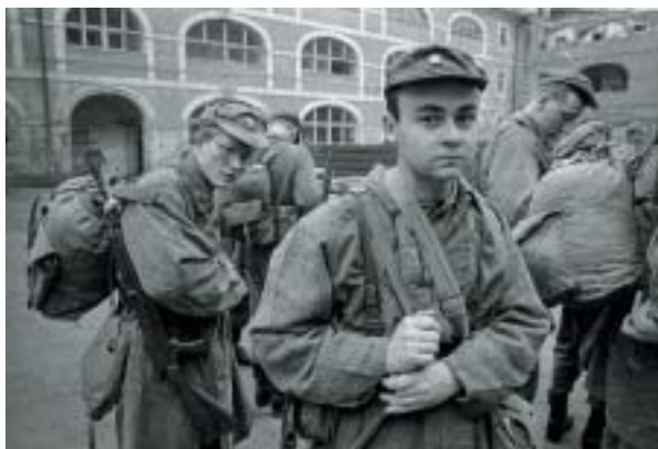
Přijímač, Západní Čechy 1988.

Jenom několik fotografií vypovídá o tom, co nemá rád a čeho se bojí. Je to podivuhodně nezúčastněný dav lidí na chodníku, přihlížející lidské tragédii. Nezajímá je neštěstí, k němuž tady došlo, jen se na ně nalepili jako mouchy na mucholapku. Na sto lidí, jakoby vyříznutých z mnohem početnějšího zástupu, a přitom v těch tvářích nenajdeš