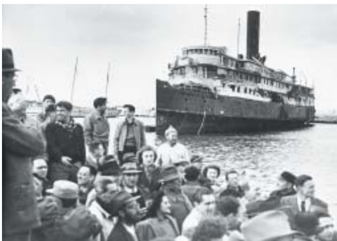
I sekulární Židé si s sebou přinesli tradice a zkušenosti ze židovské kehily.

rovnostářské a jiné naopak více oligarchické. Všechny ale vycházely ze zastupitelského principu, kdy si členové komunity volí své funkcionáře a ti zase přijímají určitou odpovědnost vůči svým voličům. I když Židům scházela výkonná moc – suverenita – měli bohaté politické zkušenosti: v matrikách a archivech lze najít doklady o mocenských bojích, vnitřních koaliciích, hlasování o přijímání a vylučování jednotlivců a frakcí nebo odtržení nespokojených menšin, které si