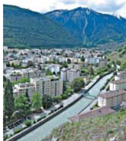
Pohled na Martigny od hradu Batiáz.

I tady je možné strávit příjemný den, překročit po historickém dřevěném mostě La Batiáz řeku La Drance a navštívit vysoko nad údolím hrad Batiáz, který je – jak jinak – obklopený vinicemi. V barech tu, jako všude na francouzském i italském venkově, postávají stálí hosté u barových pultů a v ruce drží skleničku vína nebo také kávu. Přidat se k nim a trochu si i popovídat je možné i příjemné. Anebo zajít do vyhlášené švýcarské destilérie Luis Morand, která v Martigny sídlí, a pořídit si na památku slavnou Williamine, pálenku z hrušek, jež existuje i v košer verzi.