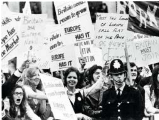
Před 45 lety Londýňané demonstrovali pro vstup do Británie do Evropského hospodářského společenství. Roku 1973 do něj Británie vstoupila.

Turecko-izraelská dohoda o urovnání obsahuje konkrétní body. Umožní Turecku posílat pomoc do pásma Gazy, ale pouze přes izraelský přístav Ašdod, takže zboží bude pod kontrolou. Naproti tomu svůj původní požadavek, aby Izrael blokádu Gazy úplně zrušil, Turecko neprosadilo. Za vítězství ale může vydávat to, že Izrael uvolní 20 milionů dolarů na odškodné rodinám lidí zabitých na lodi Mavi Marmara. Izrael by sice mohl vydávat za své vítězství slib Ankary, že zabráni přípravě teroristických aktivit proti Izraeli ze svého území, ale jestli by na plnění takového závazku někdo vsadil výplatu, to už je jiná otázka.