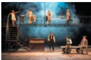
Hostinec: Jednoduchá a přitom nápaditá scéna současné Periferie.