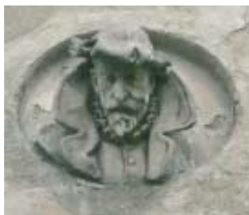
Portrét Jakoba Gartnera z roku 1896–1897.

V prostorách Arcidiecézního muzea v Olomouci je od 19. října otevřena mimořádně zajímavá výstava, nazvaná