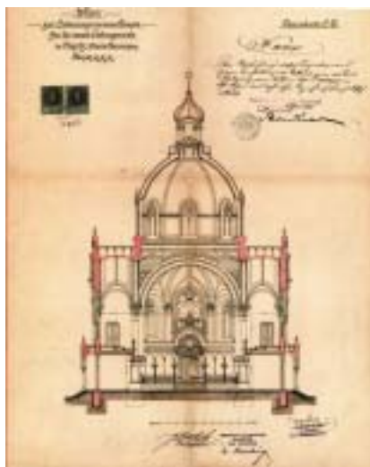
Návrh olomoucké synagogy, příčný řez.

Výstava má dvě části. První dokumentuje stavbu samotnou, představuje její-