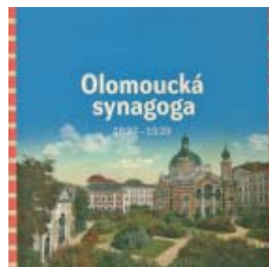
Obálka publikace vydané k výstavě.

Výstava Olomoucká synagoga 1897–1939 v Arcidiecézním muzeu v Olomouci (Václavské náměstí 1) potrvá do