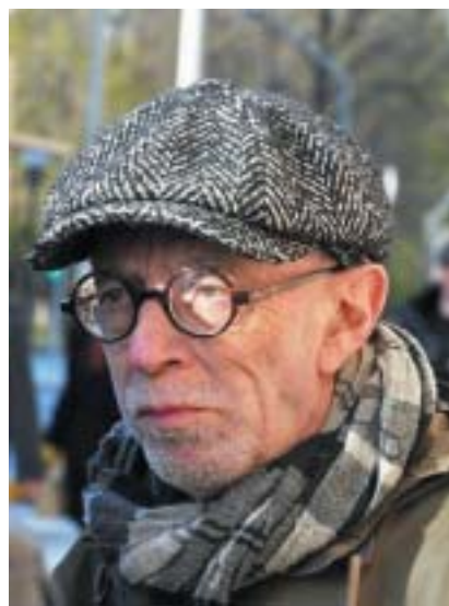
Lev Rubinštejn.

Opozičně naladěný jsem už od mládí, především v otázkách estetiky. Být v kontrakultuře je můj přirozený stav.