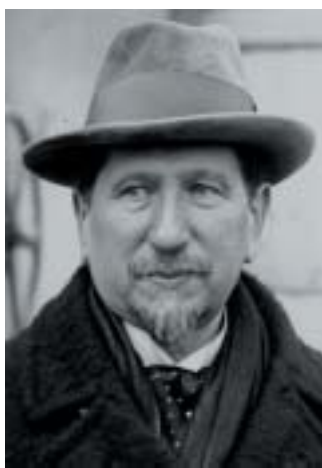
Nachum Sokolov (1859–1936).

mezi Británií a Francií, podle „čáry v písku“ vedené od východu na západ od Středozezemí po západní hranici Persie. (Rusko mělo dostat rozsáhlý pás východní Malé Asie.) Jenže Palestina zahrnovala tolik protichůdných zájmů, že si vynucovala zvláštní status. Podle mapy vytvořené Sykesem a Picotem měla připadnout severní Galilea Francii; přístavy Haifa a Akko Bri-