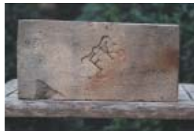
Na některých cihlách byla vyražena značka, iniciály FK.