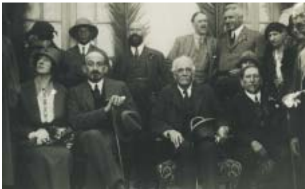
Sedící zprava: Nachum Sokolov, lord Arthur Balfour, Chajim Weizmann, 1925.

Druhé vysvětlení praví, že si Britové s podporou sionismu pospíšili, neboť to považovali za cestu, jak ospravedlnit v pová-