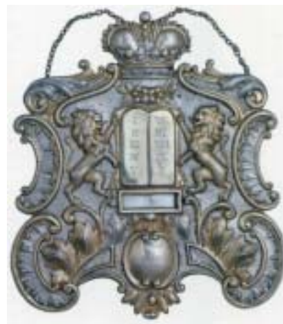
Štít na Tóru z olomoucké synagogy, Vídeň 1897.

K výstavě byla vydána dobře připravená i vypravená publikace, která kromě