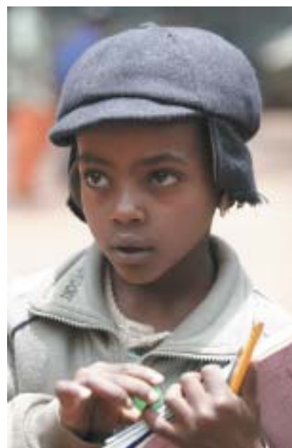
Žák židovské školy v Addis Abebě.

Vzhledem k protestům, kterých se účastnili i někteří členové Knesetu, revokovala izraelská vláda v roce 2016 své rozhodnutí a rozhodla, že v průběhu pěti let bude i těm 9000 falašmuroů, tisíci se dosud v táborech v Etiopii, umožněno přistěhování. První část v počtu 1300 osob má dorazit už v roce 2017. Pro celou záležitost byl vytvořen rozpočet a Benjamin Netanjahu s rozhodnutím své vlády seznámil poslance etiopského parlamentu během své oficiální návštěvy země vloni v létě. Na závěr celé operace v roce 2020 se předpokládá uzavření táborů, ve kterých jsou čekatelé na vystěhování soustředěni. Rabínské autority v Izraeli však nadále trvají na tom, aby se falašmurové, aspi-