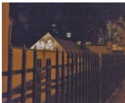
Projekce v areálu Pinkasovy synagogy.

sledování a vyvraždění českých a evropských Židů a Romů a dějiny druhé světové války obecně, dějiny židovských komunit, problematiku antisemitismu a rasismu a vzdělávání o holocaustu a proti projevům rasové netolerance. Za první rok své existence shromáždila prvních 500 svazků, které jsou součástí fondu dodnes. V současnosti knihovní fond obsahuje přes 6500