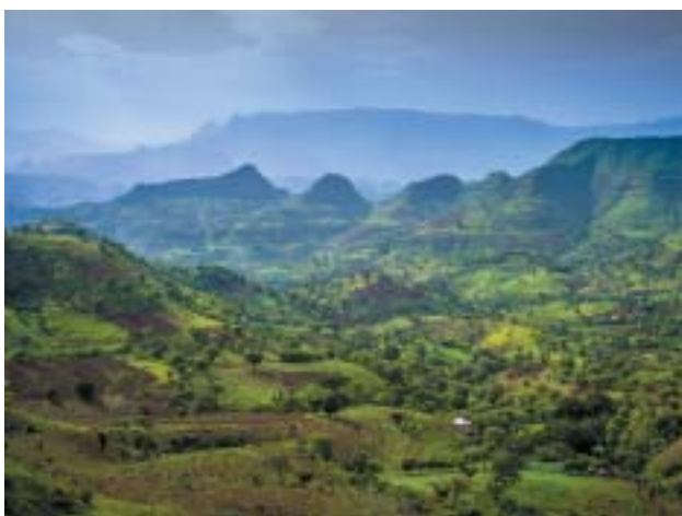
Simienské hory v provincii Gondar, tradiční oblasti Falašů.

Byla jsem v Izraeli v době, na kterou připadá Sigd, svátek, který je vlastní Židům z Etiopie. Každoročně se při této příležitosti v měsíci chešvan, přesně padesát dnů po Jom kipur shromažďují v Jeruzalémě u hradeb Starého Města ti-