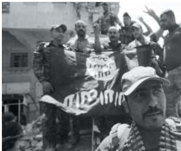
Členové jednotek iráckého ministerstva vnitra pózuji v mosulském Starém Městě s vlajkou Islámského státu otočenou vzhůru nohama.

Většina západních politiků považuje válku proti sunnitským radikálním skupinám