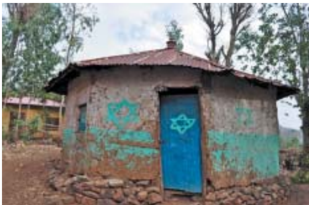
Vesnická synagoga, Woloka, Etiopie.

Stejně jako Karaité neznají příslušníci Beta Jisrael autoritu Talmudu a řídí se pouze psanou Tórou – obřizku vykonávají osmý den, dodržují kašrut, šabat, svátky Sukot, Šavuot a Pesach i Roš hašana a Jom kipur. Naopak svátky jako Chanuka a Purim, které v Tóře zmíněny nejsou, neznají.