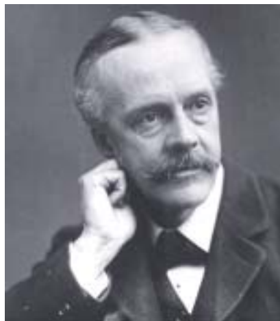
Lord Arthur Balfour (1848–1930).

Další způsob, jak snížit význam Balfourovy deklaráce, je přeskočit čas rovnou do