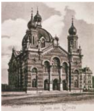
Olomoucká synagoga, foto z počátku 20. století.

Návštěvníkům této synagogy, olomouckým Židům a jejich obci, která za tragických okolností zanikla v roce 1942, je pak věnována část druhá, zachycující náboženský život předváleč-