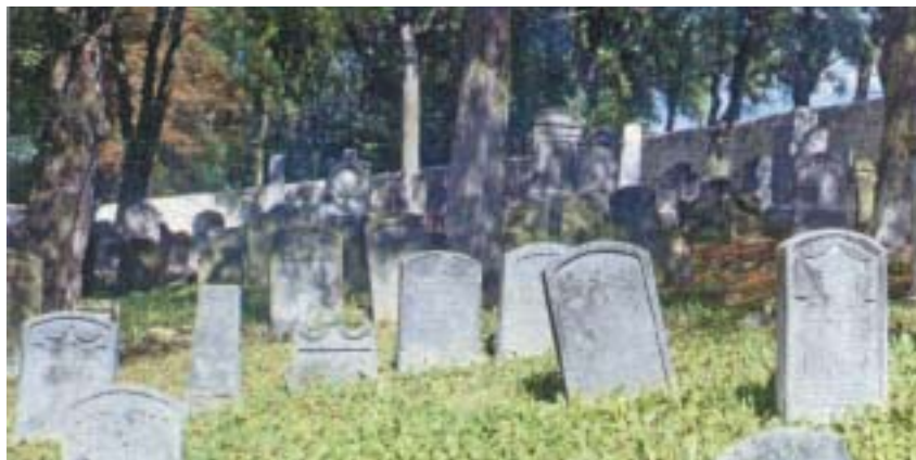
Hřbitov u Hřívčic, současný stav.

znamné židovské památky do důstojného stavu. Devastovaný hřbitov se však začal měnit k lepšímu až zhruba od roku