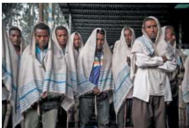
Muži Beta Jisrael po ranní modlitbě.

Přesto především díky vytrvalosti, se kterou dodržovali pravidla rituální čistoty stanovená v Tóře, si dokázali po staletí udržet sociální i ekonomickou