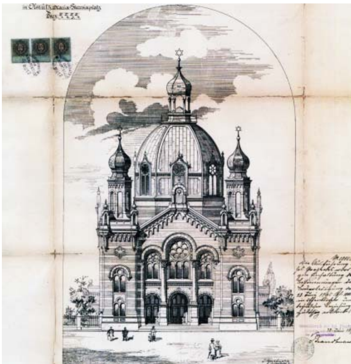
Jakob Gartner: Návrh hlavního průčelí olomoucké synagogy, 1895. (K textu na straně 11.)

VĚSTNÍK ŽIDOVSKÝCH NÁBOŽENSKÝCH OBCÍ V ČESKÝCH ZEMÍCH A NA SLOVENSKU