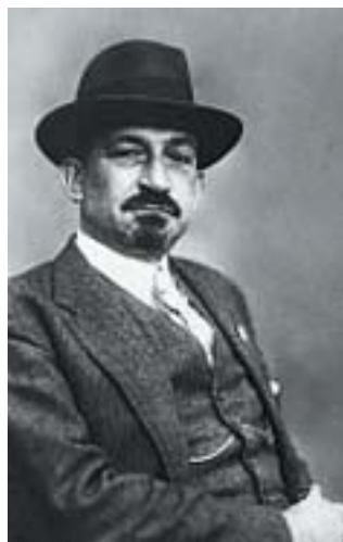
Dr. Chajim Weizmann (1874–1952).

Sokolov se vrhl do diplomatických jednání, propagandy a lobbování, brázdil přitom Evropu, Ameriku a osmanskou říši. Když vypukla první světová válka, byl poslán do Británie, kde spojil síly s dyna-