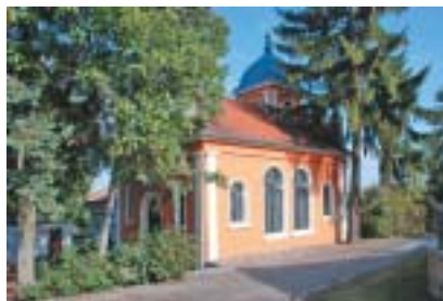
Obřadní síň židovského hřbitova v Lounech.

Dnešní vlastník Židovská obec Teplice usiluje dlouhodobě o uvedení této vý-