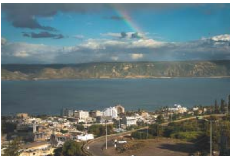
Dobrá zpráva: až se postaví další odsolovací stanice, bude se čerpat sladká voda do jezera Kineret.

Na tom není samo o sobě nic nového. Že v regionu panuje nedostatek dešťo-