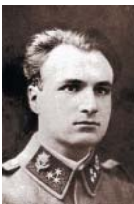
Franz Janowitz.

Na 17. listopad připadá 120. výročí narození novináře, nakladatele, publicisty a politika JULIA FIRTA (pův. jm. Fürth; 17. 11. 1897. Sestrou u Sedlčan–27. 5. 1979 Mnichov). Absolvoval plzeňské gymnázium, poté obchodní školu. Pracoval nejprve v bance, později jako úředník lihovaru v Plzni. Po roce 1929 spolufundil nakladatelství Borový a roku 1936 byl jmenován generálním ředitelem vydavatelského concernu Lidové noviny Jaroslava Stránského, roku 1939 emigroval do Anglie, během emigrace byl přednostou informační správy Československého národního výboru v Paříži, poté i členem Státní rady Československé. Po válce se vrátil do ČSR a byl významným členem národně socialistické strany, v letech 1945–1946 byl poslancem Prozatímního Národního shromáždění za národní socialisty, a poté poslancem Ústavodárného Národního shromáždění. V letech 1945–1948 byl také ředitelem nakladatelství Melantrich.