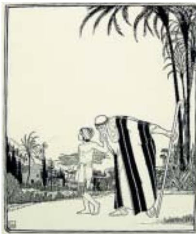
Efraim Moses Lilien: Abraham a Jicchak.

obnovil, poukazují na hlubší význam těchto studní v kontextu rodové nauky, i důvod, proč je Pelištové zasykávali. Když Jicchakovi služebníci našli studnici živé vody, gerarská pastýři jednali s pastýři Jicchakovými, tvrdíce: „Ta voda je naše!“ a poněvadž s ním jednali, pojmenoval tu studnu Esek, jednání. Tvrzení, že je ta voda „naše“, zní oprávněně. Voda, život, je pro všechny. Přesto však lidé jako Avraham vodu života objevují, a jimi, jako Pelištové, se zase objev snaží zasykat prachem a zakrýt. Přičemž důvodem k tomu je malicherná žárlivost na Boží požehnání, jímž Bůh žehná těm, kdo v zemi objevují prameny života. Jicchak měl totiž stáda bravu a stáda skotu a rozsáhlé služebnictvo a Pelištové mu záviděli.