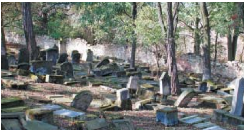
Hřbitov u Hřívčic, stav v roce 2009.

Když se řekne Peruc, vytane lidem na mysli zejména Oldřich a Božena, kteří pohřební bratrstvo Chevra kadiša pro Hříškov a okolí.