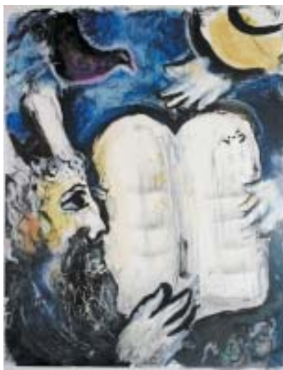
Litografie: Marc Chagall.

obličej světlem. Jak mu předtím Bůh řekl: „Všechn ten lid, v jehož nitru jsi, spatří, jak děsivý je to skutek, který s tebou konám!“ K tomu je však třeba dodat, že něco podobného se stalo každému z těch, kdo v den Svátku darování Tóry byli přítomní zjevení Božího majestátu na Sinaji, kdy je Bůh oslovil v jejich nejhlubším nitru prvními příkazy Desatera: Já jsem Hospodin, tvůj Bůh, jenž tě vyvedl z Micrajim, z domova otroků. Nedělej si jiné bohy na mé tváři! To byl totiž důvod, proč lid, vědom si svého hříchu, odložil každý svou ozdobu ze Sinaje (2M 33,6). Tóra nijak nespécifikuje, co vlastně byla tato ozdoba , ale je zřejmé, že to byl odraz Boží přítomnosti, podobně jako světlo, vyzařující z Mošeho obličej po jeho druhém sestupu. Zatímco v Den smíření jeho obličej zářil vnitřním světlem, oni Mošeho očekávali, zbaveni svých ozdob. Výklad možná nalézáme v obraze spravedlivých v životě olam haba , kde podle Berachot 17a spravedliví sedí se svými korunami na hlavách a těší se ze svitu Boží přítomnosti , ale i v citátu