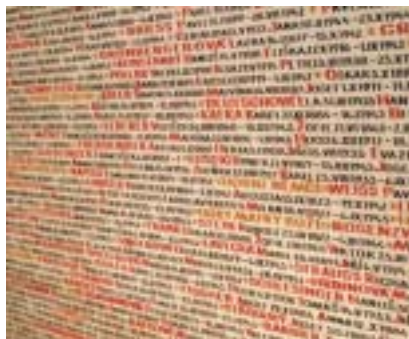
Památník šoa v Pinkasově synagoze v Praze.

4) Žijete v Izraeli. Napište krátký příběh začínající slovy: „Probudil jsem se, podíval jsem se na kalendář a uvědomil jsem si, že jsem spal/a 70 let, je rok 2018.“