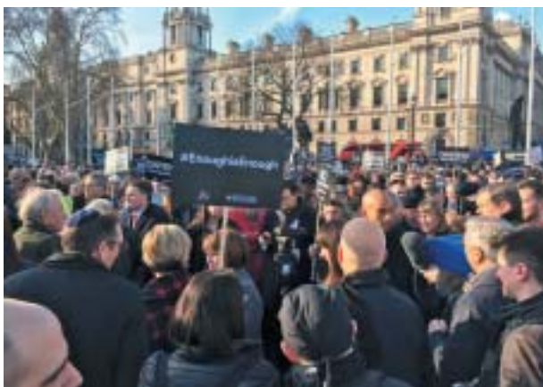
„Máme toho dost!“ Břežnová demonstrace v Londýně.

Seamus Milne se stal po Corbynově volebním vítězství stranickým ředitelem pro ko-