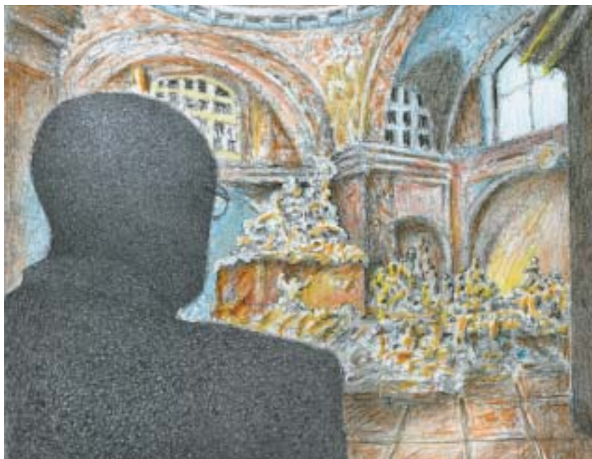
Ilustrace Jiří Stach.

K psaní mě přivedl samizdat, potřeba lidského společenství. Předat zprávu, poselství, to byl hlavní účel psaní a také opisování textů. Psal jsem všechno možné, básničky, drobné prózy, eseje i zábavné proslovy na večírky. Když se pak z nastřádaných textů zrodila tlustá kniha Fernety , kterou mně vydal Torst, byl jsem sám překvapen.