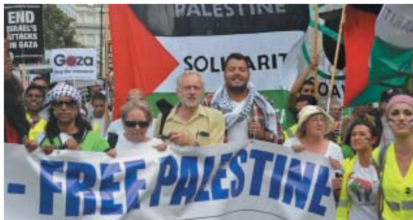
Jeremy Corbyn při jedné z protizraelských demonstrací.

Po Corbynově zvolení se britští Židé, liberální demokraté, ale i řada samotných členů Labour Party zděsili – Corbyn se mezi zasvěcenými rozhodně netěšil pověstí seriózního a zodpovědného politika, spíše poněkud výstředního rebela. Narodil se roku 1949, nedokončil univerzitní studia, v 17 letech vstoupil do Labour Party, která se stala jeho životem i živobytím. V roce 1974 byl zvolen zastupitelem v londýnském obvodu Haringey, kde zasedal až do roku 1983, kdy