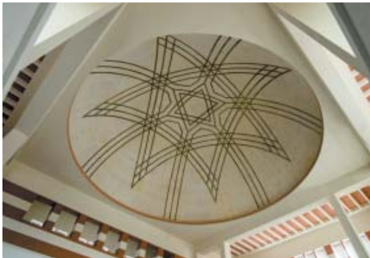
Malba Dávidovej hviezdy v kupole.

kala budovu späť do svojho vlastníctva, bola príliš malá, aby ju dokázala sama využiť. Na premietacom plátne by sa ešte možno aj dnes striedalo napätie, akcia, romantika a fantázia,