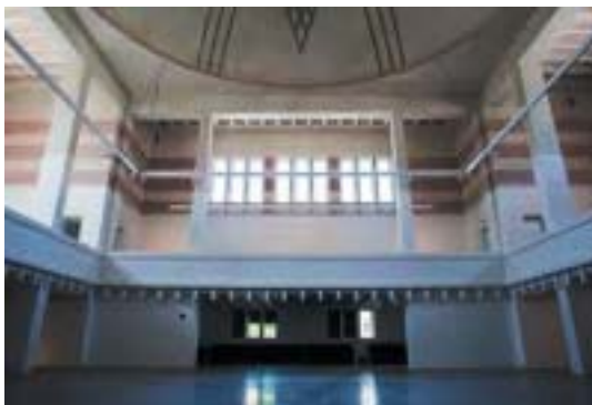
Interiér vrátený do pôvodnej podoby.

Z Prahy do Žiliny presťahovaná Vysoká škola dopravná (dnešná Žilinská univerzita) tu otvára 6. septembra 1960 školský rok a od roku 1962 dostáva