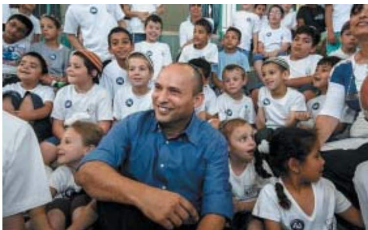
Ještě scházejí dva miliony. Ilustrační foto archiv.

K nejistotě zavádí palestinská akce zvaná Pochod návratu. Je to protestní shromáždění