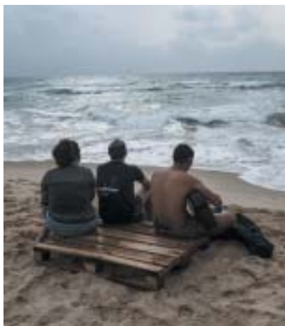
Izrael, duben 2018.

semitským motivem, které se ve Francii odehrály od roku 2006, i fakt, že na 50 tisíc Židů se z obav o život a životy svých blízkých raději odstěhovalo z centra Paříže. Žádají co nejrychlejší nápravu, aby „Francie nepřestala být Francií“.