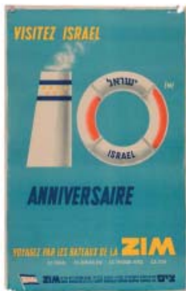
Otte Walsh: Navštivte Izrael!

ve středoevropských dějinách Masarykovy univerzity v Brně při příležitosti 150. výročí Warburgova narození v říjnu 2016.