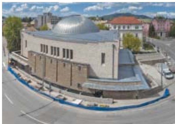
Synagóga po rekonštrukcii. Foto Peter Snadík, 2016.

Žilinskí Židia, ktorí prežili holokaust, po vojne už nedokázali zaplniť svoj veľký chrám. Ešte pred nástupom komunizmu v Československu v roku