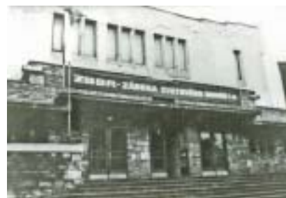
Synagóga v 80. rokoch 20. storočia.

Maľba Dávidovej hviezdy v kupole je jednou z najpôsobivejších častí diela. Evanjelik Peter Behrens vo svojom jedinom projekte synagógy docielil dynamickú až mystickú atmosféru in-