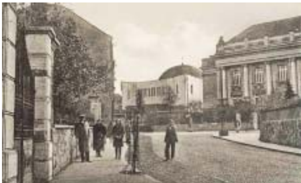
Neologická synagóga pred 2. svetovou vojnou.

Súpis Židov v Žiline zaznamenal v roku 1852 celkom 169 osôb, pričom mesto malo v tom istom čase 2422 obyvateľov. Židovská komunita si postavila modlitebňu, za mestom kúpila pozemok, kde zriadila cintorín a vznikla aj prvá, súkromná, židovská škola (1850). Komunita v meste nadobúda spoločenský a hospodársky význam.