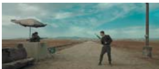
Checkpoint kdesi v izraelské poušti.

Se svým druhým celovečerním snímkem Foxtrot se Maoz po devíti letech do Benátek vrátil a získal druhé nejvyšší ocenění – Velkou cenu poroty. Snímek zprostředkovává surreálnou armádní zkušenost mladých vojáků a zabývá se tématy viny, ztráty a traumatu, která se v izraelské spo-