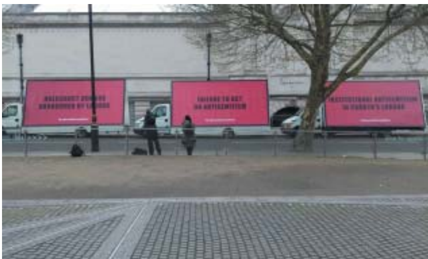
Inspirace filmem: tři protestní billboardy objíždějí centrum Londýna.

ná o kritiku Izraele bez antisemitismu a na webu má Jewdas i návod, jak rozlišit skutečný rasismus od oprávněné kritiky. Recept je jednoduchý: nezobecňujte, berte lidi jako jednotlivce s chybami, které činí právě onen konkrétní jednotlivce (nikoli celý národ či náboženská skupina). Potud je vše jasné a srozumitelné.