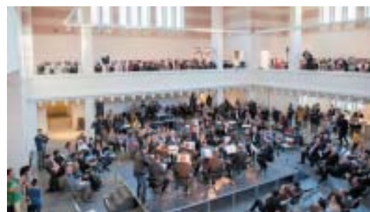
Koncert pre darcov v máji 2017.

Chceme, aby vznikajúca kultúrna inštitúcia a jej program boli z 21. storočia, aby sa tu diali veci, ktoré budú premyslenou kombináciou kritickej reflexie, produkcie umenia a komunitného živo-