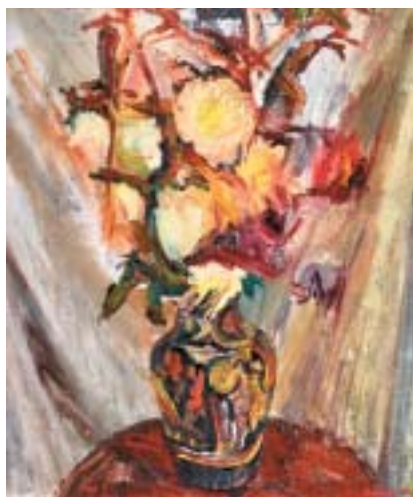
Květiny ve váze, 1944.

Ač Bomberg věděl, že nepatří ke Clarkovým oblíbeným, z nouze požádal válečný výbor o zakázku. Nakonec ji (spolu s určitou podporou) dostal: namalovat podzemní sklad munice v Tutbury. Po mnoha skicách navrhl rozměrnou nástěnnou malbu pro budoucí památník, zachycující připravené bomby a vozíky na kolejnici odvázející zbraně. Nebyl to jasný obraz „s příběhem“, spíše plátno oplývající temnou energií a výbušností. Komise návrh odmítla, přijala jen Bombergovy menší