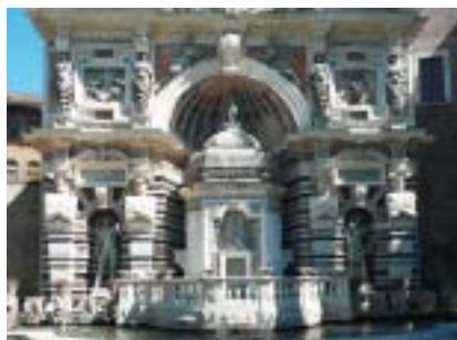
Varhanní fontána po opravě v roce 2003 opět hraje.

Pozůstatky Hadrianových staveb však nejsou jedinou pamětihodností, pro