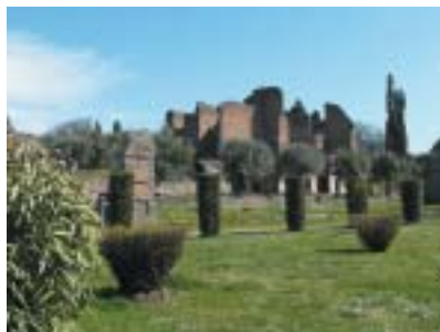
Jeden z paláců Hadrianovy vily.

Tivoli, antický Tibur, asi šedesátitisícové město ležící 30 kilometrů severně od hlavního města na úpatí Tiburtinských hor, je pojmem, pod kterým si lidé představují různé a často velmi odlišné skutečnosti. Kdysi bylo Tivoli synonymem houpaček a střelnic, jejichž provozovatelé s oblibou nazývali své atrakce podle zábavního parku stejného jména,