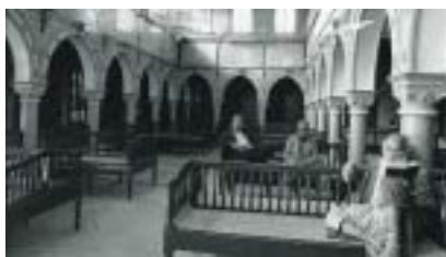
Synagoga El Griba na Džerbě, 1995.