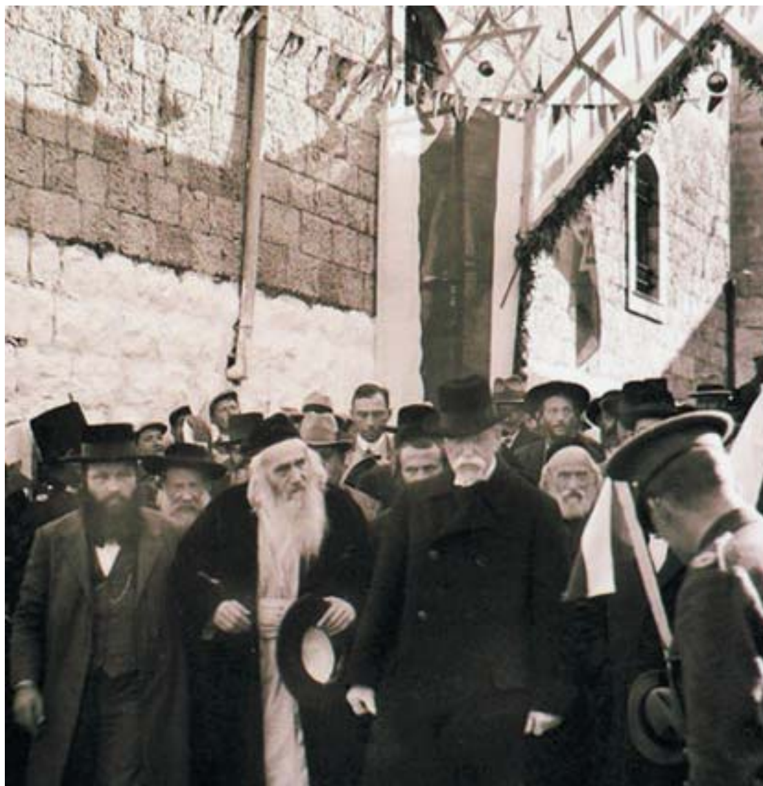
Návštěva prvního československého prezidenta ve Svaté zemi v roce 1927 se stala základem dobrých vztahů mezi Českou republikou a Izraelem.

VĚSTNÍK ŽIDOVSKÝCH NÁBOŽENSKÝCH OBCÍ V ČESKÝCH ZEMÍCH A NA SLOVENSKU