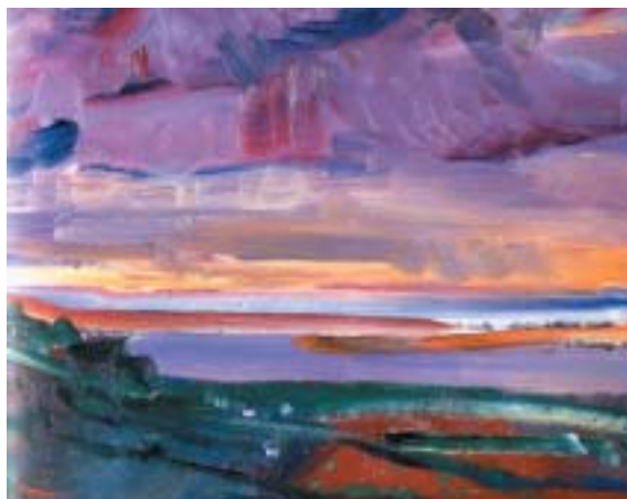
Pobřeží v Devonu, 1946.

(viz Rch 9), ale svobodněji, s citem pro hmotu jako vyjádření vlastního pocitu z ní, ať tíhy či vzdušnosti a pomíjivosti. V tomto duchu vytvořil několik olejů toledské katedrály zachycené z výšky, v pozadí s horskými vrcholy.