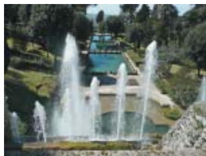
Jezírka v pohledu od Varhanní fontány.

Pozoruhodné je vlastně všechno, co se v zahradách nachází. Varhanní fontána, kde voda otvírá ventily varhanních trubek a vhání do nich vzduch, takže hrají jako skutečné varhany. Když papež Řehoř XIII. navštívil vilu d'Este v roce 1572, trval na tom, aby mohl vidět celý mechanismus. Domníval se totiž, že za fontánou se skrývají muzikanti, kteří hudbu provozují. Krásná je Fontána draků, Oválná fontána, Fontána sova, Neptuno-