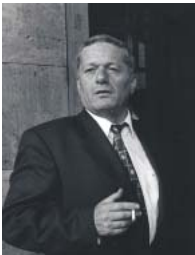
Z rodinného archivu.

Přinášíme část smuteční řeči, kterou při posledním rozloučení přednesl Michael Žantovský.