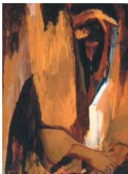
Slyš, Jisraeli, 1955.

Tento pohled pak zúročil v obraze Večer v londýnské City (1944), v němž po-