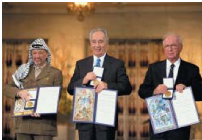
Rok po podepsání dohody z Osla získali všichni tři aktéři Nobelovu cenu za mír.

UNRWA je zvláštním unikátem. Fenomén palestinských uprchlíků vznikl v historické vlně po druhé světové válce, kdy svět byl uprchlíky zaplaven. Nejvíce (odhadem až 15 milionů) jich bylo v Indii a Pákistánu po rozdělení Britské Indie na hinduistický a muslimský stát. V Německu se nacházelo přes 10 milionů bezprizorných soukmenovců z východní či střední Evropy, v jiných zemích desítky tisíc Řeků coby produkt tamní občanské války. A dalo by se pokračovat. Ale dnes už byste uprchlické tábory pro Němce, Indy či Řeky nenašli. Pouze pro Palestince, a to i 70 let po válce, jež je vyhnala. A jen pro ně funguje UNRWA, zatímco za zbytek světa odpovídá Úřad vysokého komisaře OSN pro uprchlíky (UNHCR).