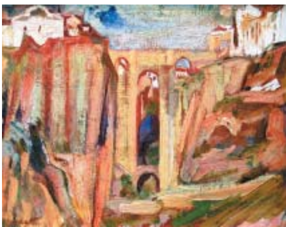
Most v Rondě, 1935.

Po návratu z Palestiny se Bomberg věnoval malbě portrétů, ale již srpnu 1929 vyrazil do Španělska, kde se na půl roku usadil v Toledu. Přivábila ho sem působivá a rozmanitá architektura z dob, kdy