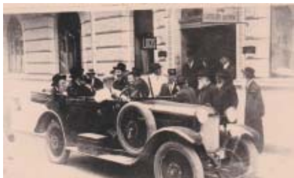
Účastníci konference Agudas Jisroel v Mariánských Lázních, 1937.

Ještě v létě 1937 tak v Mariánských Lázních došlo k významné události: konal se tam nejvýznamnější židovský kongres, jaký kdy město zažilo, a zároveň to byl největší kongres vůbec. Agudas Jisroel, dvacet pět let předtím založená zastřešující organizace do té doby oponující zbožných židovských stran, svolala na srpen 3. světový kongres ortodoxního židovstva. Nikoli nepodobně karlovarským sionistickým kongresům dominovala akce atmosféře lázeňského města, s tím jediným rozdílem, že Mariánské Lázně byly menší a účastníci nápadnější. Neboť i když ve třicátých letech přicestovalo do