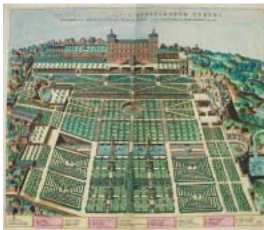
Etienne Dupérac: Plán Villy d'Este a přilehlých zahrad z roku 1570.

nejkrásnějším dílem italské (a tedy světové) renesanční zahradní architektury. Nechal si je zbudovat v letech 1550–1572 kardinál Ippolito II. d'Este. Měl celou řadu církevních titulů a funkcí, ale papežem, i když se o to