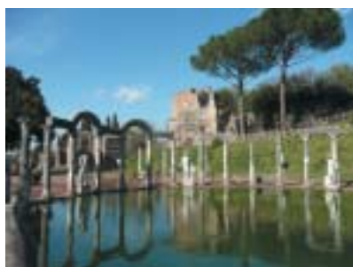
Kanakopos s průplavem obklopeným kolonádou soch.

Publius Aelius Hadrianus (76–138 o. l.) se stal císařem v roce 117. Vládl římské říši, která za jeho předchůdce Traiana dosáhla maxima své územní velikosti, jednadvacet let. Spíš než na výboje se zaměřil na administrativní stabilizaci říše