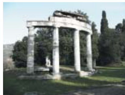
Venušin chrám obklopený polokruhovým sloupovím.

Hadrianus navštívil prakticky všechna významná místa své rozlehlé říše od Británie po Orient. Však také strávil na cestách a pobytech mimo Itálii skoro polovinu své vlády. Brzy poté, co se stal císařem, zahájil stavbu, která se stala světoznámou. Spíš než k vládním záležitostem byla určena k odpočinku a studiu a byla nazvána – jak jinak – Hadrianova vila, italsky Villa Adriana. Budovy a zahrady, rozmístěné na ploše 120 hek-