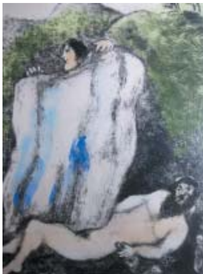
Marc Chagall: Plášť k zakrytí Noacha.

otroků bude svým bratrům! (9,21–27). Přitom zůstává záhadou, proč by proklínal syna, o němž je předtím jen napohled zbytečná zmínka, že byl Cham jeho otcem?