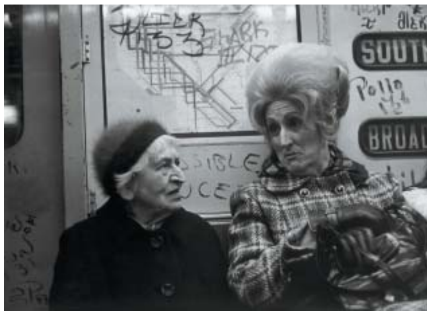
Z podzemní dráhy. New York 1975.

z nich zachytila kresbu a nápis, který by mohl být i mottem její tvorby: „Tlačítko do tajné chodby: stiskni.“ Na snímku z roku 1943 tu pouliční perspektivou vi-