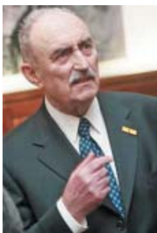
Jiří Loewy.

Před 15 lety, 1. ledna 2004 , zemřel v německém Wuppertalu politik, publicista a vydavatel