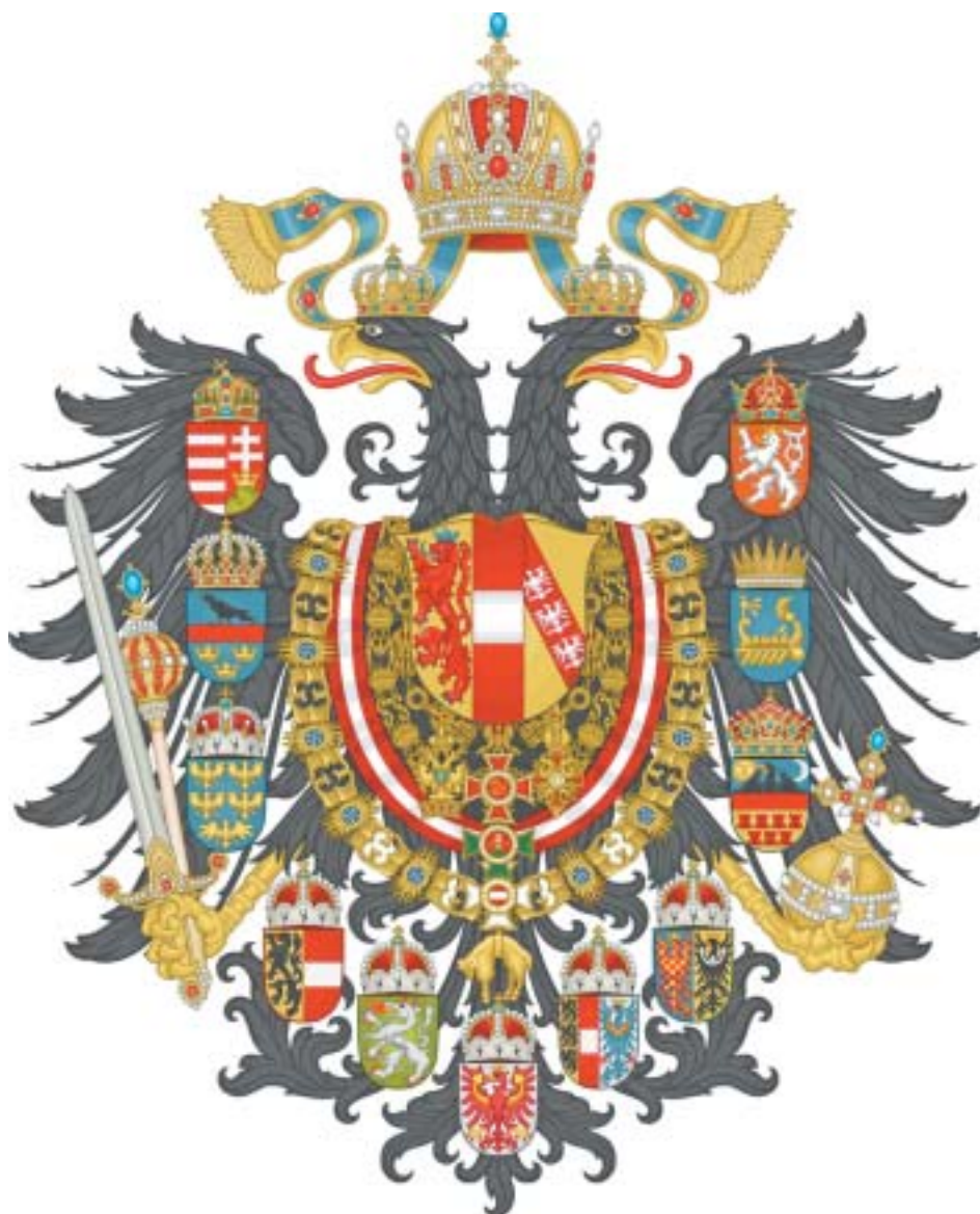
Velký státní znak rakousko-uherské říše. (k rozhovoru s Garym B. Cohenem na stranách 6–9)

VĚSTNÍK ŽIDOVSKÝCH NÁBOŽENSKÝCH OBCÍ V ČESKÝCH ZEMÍCH A NA SLOVENSKU