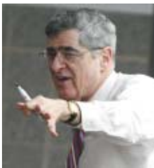
Gary B. Cohen.

Profesor GARY B. COHEN (nar. 1948) se jako první historik zaměřil na sociální dějiny středoevropského prostoru a pražského německojazyčného obyvatelstva v závěrečné etapě Rakouska-Uherska. Je autorem základní publikace na toto téma The Politics of Ethnic Survival: Germans in Prague, 1861–1914 (Princeton University Press, 1981; druhé vydání, Purdue University Press, 2006), která česky vyšla pod názvem Němci v Praze 1861–1914 (Karolinum, Praha 2000). Pracoval na ní v rámci své doktorské dizertace a sleduje v ní politický vývoj v daném období i každodenní život obyvatel české metropole. Byl jedním