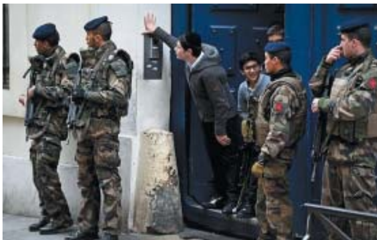
Židovská škola v Paříži ve čtvrti Marais.

Cílem průzkumu nebylo zjistit počty potenciálních přistěhovalců do Izraele. Bylo jím zjistit pocit bezpečí Židů v Evropě, doložit, jak se ten pocit vyvíjí v čase (stejně průzkumy byly vypracovány v letech 2008, 2011 a 2015) i jak se vyvíjí regionálně. Z publikovaných