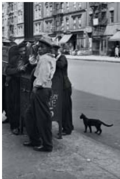
New York, 1945.