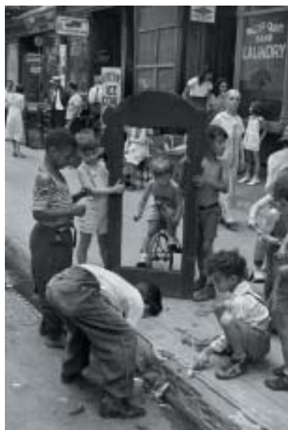
New York, 1940.