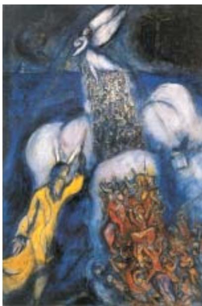
Marc Chagall: Přechod přes Rudé moře.

a když před nimi skryji svou tvář, stane se potravou a najdou si ho mnohá neštěstí a utrpení, takže si řekne: „Nenašla si mne všechna ta neštěstí proto, že v mém nitru není mého Boha?“ (5M 31,16–17)