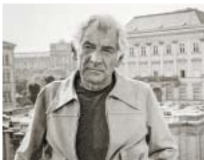
Leonard Bernstein ve Vídni.

maďarských židovských obcí Mazsihisz mají nedostatky v účetnictví, které se vztahuje ke státům dotované obnově synagogy a projektu muzea v Budapešti. Skupina Mazsihisz taková nařčení odmítla a odsoudila „podněcování“ vůči svému předsedovi.