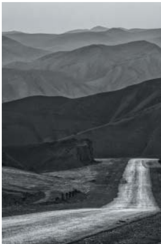
Západní břeh, Nabi Musa 2009.

Několik let poté, roku 1999, byl premiérem zvolen Ehud Barak. Byl roz-