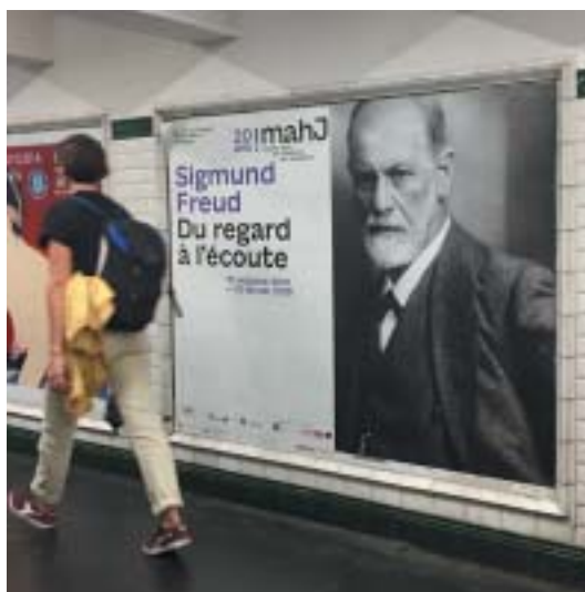
Návrat do města nad Seinou.

Výstava je rozdělena na devět částí, každý sál je ve znamení určitého klíčového pojmu – neurobiologie, psychoanalýza,