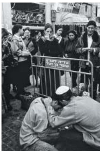
Pěší zóna po bombovém útoku, Jeruzalém 1999.

Ale když jsme se usadili k večeři a klábosili u sklenky vína, vytratilo se i toto minimální uznání skutečnosti. Dozvěděla jsem se, že židovský národ