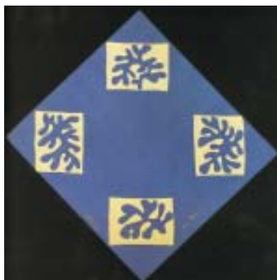
Šátek podle Henriho Matisse.