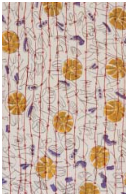
Ostnatý drát. Potisk látky od H. Moorea, 1946.