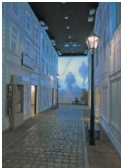
Muzeum Polin – pohled do expozice.

(Báseň Czesława Miłosze citována v překladu Vlasty Dvořáčkové.)