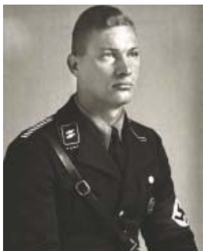
Člen Leibstandarte SS. Foto A. Sander, 1940.

přivřezence a její oběti. V oddíle nazvaném Poslední lidé jsme viděli snímky politických vězňů, mezi nimiž zvláště vynikla známá fotografie polonahého muže. Sander však zachytil i dělníky nuceně nasazené na