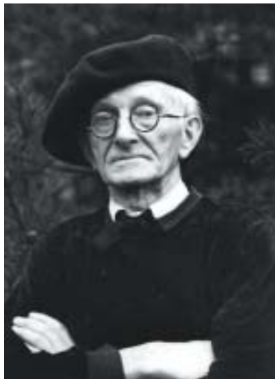
August Sander.

Přibližně z roku 1938 pocházejí díla, na kterých Sander zachytil pronásledované Židy a další osoby, které se staly terčem brutální perzekuce, tj. pronásledované, ale jeho objektiv zaměřil i na jejich pronásledovatele. Právě tento oddíl byl vystaven v Paříži.