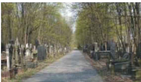
Židovský hřbitov v ulici Okopowá.

Na konci ulice Mordechaje Anielewicze, tam, kde se protíná s ulicí Okopowou, se rozkládá jedna z mála zachovaných památek na židovskou Varšavu – židovský hřbitov. Byl založen v roce 1806 a informační tabule udává, že je na