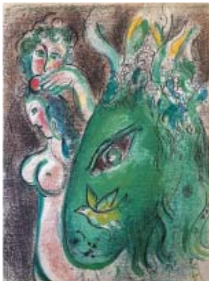
Marc Chagall: Stvoření – Ráj.

od níž oba kozly přijal. Tím více samozřejmě zaráží způsob, jak s ním bylo naloženo a komu nebo čemu byl určen.