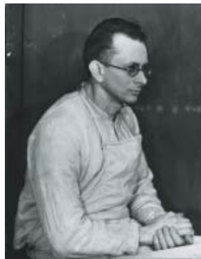
Politický vězeň. léta 1936–1940.

Mezi fotografiemi pronásledovatelů jsme naopak viděli vojenské šarže, dobře živěného muže ve vojenském mundúru, pohledného mladíka v brýlích v povýšeném postoji a v uniformě SS. Portrétní snímky obětí a jejich pronásledovatelů byly umístěny ve stejné výstavní síni na protilehlých stranách. Kontrast byl nápadný, zarážející... A návštěvník vůbec nemusel vyznávat žádnou speciální teorii o lidských typech, aby si pomyslel své, přinejmenším to, že nitro člověka jeho fyziognomie neutají.