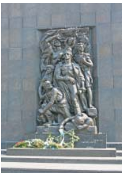
Pomník hrdinů varšavského ghetta.

Přepadení Polska nacistickým Němcem a Sovětským svazem v září roku 1939, rychlá porážka polské armády a konec samostatnosti Polské republiky znamenaly ve svých důsledcích také