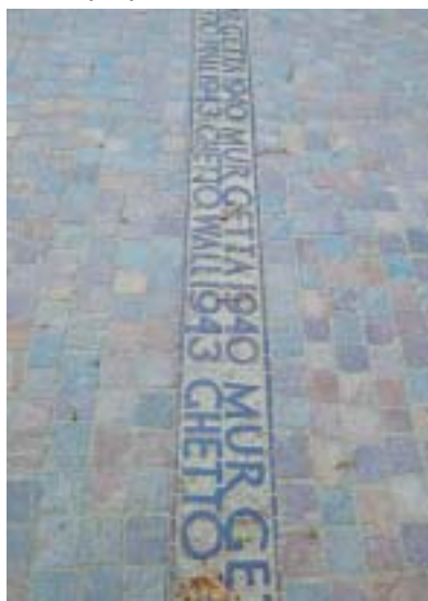
Vyznačení hranice varšavského ghetta.

Město, které má už téměř 1 800 000 obyvatel, je v dnešní podobě z naprosto rozhodující části postaveno právě v letech, které Palác kultury a vědy na jedné straně a Libeskindův obytný mrakodrap na straně druhé časově vymezují. Stavěly se široké ulice a třídy, dostávaly jména po těch, které byly spojeny s předválečnou Varšavou, a tak se dnes znovu