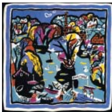
Šátek dle návrhu Juliana Trevelyana.

Moore, stejně jako Topolski, patřil k oficiálním válečným umělcům. Kvůli válce se nemohl věnovat svému bytostnému umění – tvorbě rozměrných plastik –, a tak kreslil výjevy z válkou zkoušené metropole a ochotně přijal Ascherovu nabídku. Vytvořil šátek s názvem Tři stojící postavy ve dvou barevných kombinacích a Rodinné uskupení