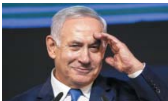
Benjamin Netanjahu popatě.

Někdo v tom může vidět nefér podporu z ciziny jednomu kandidátovi, ale ač se o kampani píše, že byla špinavá (Bibi osočil Gance z mentální nestability), vyhnula se obviňování, že ji skrytě ovlivnily zahraniční temné síly v podobě počítačových trollů či hackerů. Ne, heslem byla spíše otevřenost. Až taková, že Bibi před volbami prohlásil, že hodlá anektovat areály veškerých osad na Západním břehu