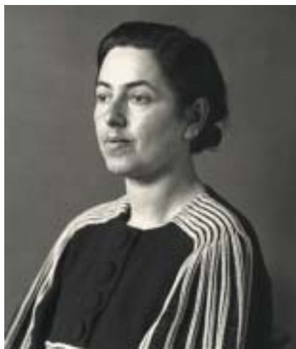
Pronásledovaná.