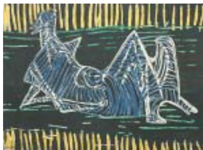
Nástěnná textilie Ležící postava . H. Moore, 1949.

Svět textilií v podání manželů Ziky a Lídy Ascherových, jak jej představuje výstava, kterou lze zhlédnout v pražském Uměleckoprůmyslovém muzeu, je nádhernou podívanou. Ale nejen to: Prostřednictvím rozmanitých artefaktů vypoovídá o lidské odvaze, nápaditosti, energii a hledání originálních řešení. A také o poválečné atmosféře, snaze zapomenout na válečné útrapy a o hledání krásy a dokonalosti