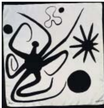
Šátek dle Alexandera Caldera.