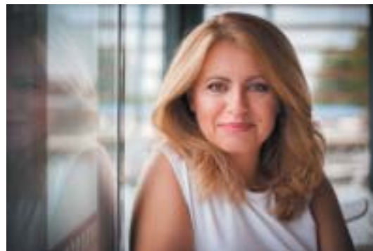
Zuzana Čaputová.

Prezidentská kampaň na Slovensku nie je ani zďaleka „fair-play“. Na prezidentských kandidátov sa vylievajú veďrá špiny, prekrúcajú sa ich slová, vytvárajú sa konšpirácie, vymýšľa sa minulosť, ktorá nemá styčné body s rea-