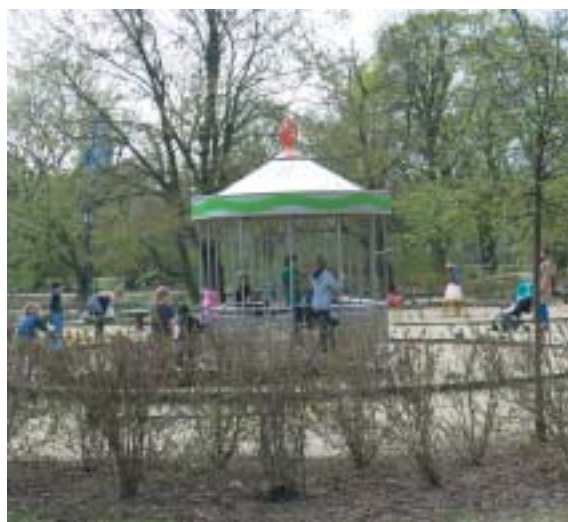
Kolotoč v Ogródu Krasieńskich.

11. VIII. 1940 – Navštívil jsem hřbitov při ul. Okopowá. Porada s SS ve věci spolků, které byly oficiálně rozpuštěny. Úvaha na hřbitově. Dají nám po-