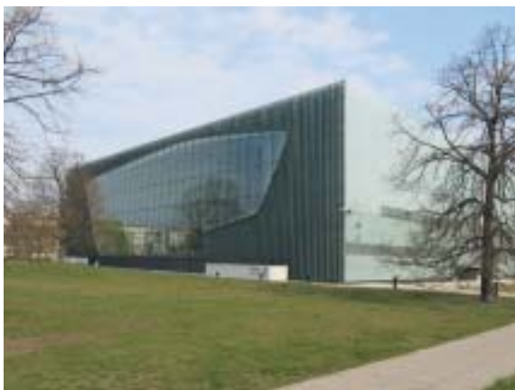
Budova varšavského židovského muzea Polin.

Budova muzea, podle návrhu skupiny finských architektů vedené Rainerem Mahlamäkim, byla postavena nedávno, v letech 2009–2013, a pro veřejnost byla stálá muzejní expozice otevřena ještě o rok později. Nachází se v těsné blízkosti Anielewiczovy ulice, v auten-