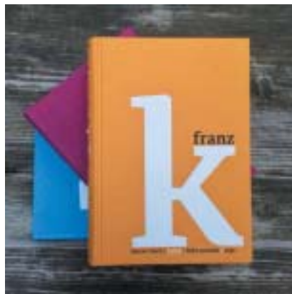
Životopisnou trilogii vydalo nakladatelství Argo.