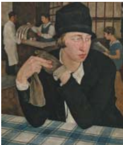
V hostinci, 1927.

Portrétní umění jako by už nemělo v současném umění opodstatnění. Díky touze mnoha tvůrců šokovat a za každou cenu být něčím novým je vše, co je spojováno s tradicí, vnímáno jako zastaralé a nemoderní. Portrétní