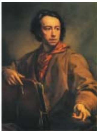
Anton Raphael Menges: autoportrét, 1775.

Anton se jako jeho otec stal malířem, a dokonce byl roku 1745 jmenován saským dvorským malířem. Hojně cestoval po Španělsku a Itálii (zde konvertoval ke katolictví). Je pokládán za jednoho z otců uměleckého směru klasicismu, nepřijímal