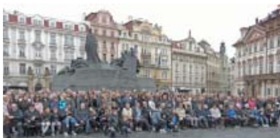
...a znovu v neděli 12. května 2019.

Na stránkách společnosti www.45aid.org lze mj. nalézt ručně malované mapy zemí s označením měst, z nichž sirotci pocházeli, ke každé zemi jsou přiřazena konkrétní jména. Z československých měst to byly Ústí nad Labem, České Budějovice, Liberec, Pardubice, Olomouc, Ostrava, Brno, Bratislava, Žilina, Ban-