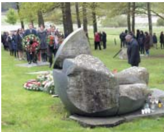
Kladení věnců u pomníku zavražděných Romů.

V Letech u Písku, na místě, kde stával pracovní a kárný tábor, přeměněný od 1. srpna 1942 na tábor cikánský, se