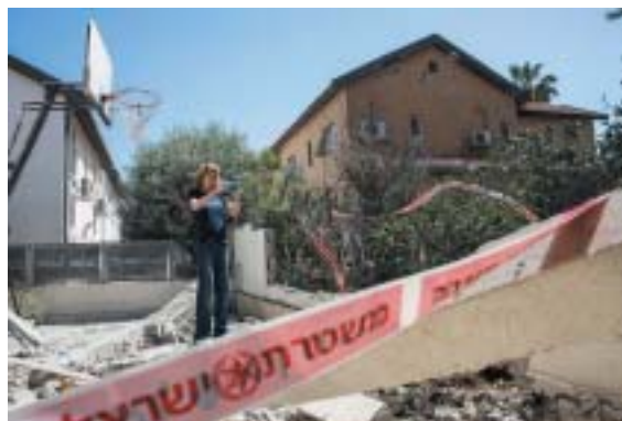
Reálné škody nejsou na pohled zničující.

Izraelská média zaměřila pozornost na dvě roviny. Jednak na život v postiže-