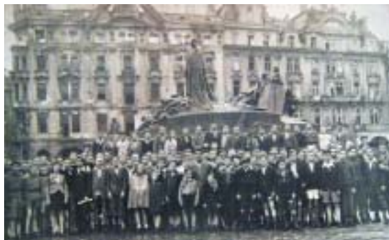
Boys 45 na Staroměstském náměstí před sedmdesáti čtyřmi lety...

trvá tak čtyři hodiny, je to milá, ale poměrně krátká společenská záležitost. V Praze jsme si hodně povídali. Bylo to zvláštní: ačkoli se mnozí předtím nezna-