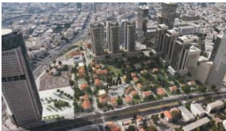
Sarona dnes, v sevření mrakodrapů Tel Avivu.

Tak tomu bylo až do roku 1917, kdy Britové dobyli Palestinu, komunitní centrum, kde se templáři společně mod-