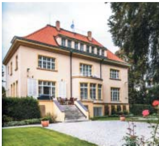
Vila Zátorka.