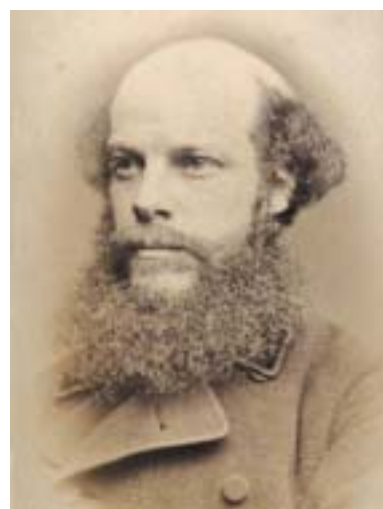
Laurence Oliphant.

Největší z těchto obcí, ve které žije přes tři sta osob, je v Haifě. Dnes, po čtrnácti letech, ve kterých se střídaly dílčí úspěchy i větší či menší prohry, se zdá, že kolonisté směřují k relativní prosperitě.