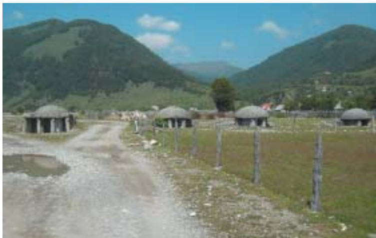
Památka na komunistického diktátora Hodžu – bunkry všude a na věčné časy.

Nacisté žádali seznam všech Židů zdržujících se v zemi. Albánský ministr vnitra Deva odmítl rozkaz splnit a trval na tom, že se jedná o vměšování do vnitřních záležitostí. Migranti však museli zmizet: mnoho Albánců, jak muslimů, tak křesťanů, poskytlo Židům azyl, živobytí, ošacení i falešné dokumenty. Albánci riskovali vlastní životy i životy svých rodin. Proč? Protože podle starobylého etického kodexu zvaného besa (ve smyslu čestného slibu) je samozřejmé pomáhat každému, kdo je v nouzi. Na konci války žilo v zemi 2000 Židů, tedy mnohem více, než když vypukla. V okupované Evropě to byl zcela ojedinělý fenomén. Jeruzalémský památník Jad vašem dosud ocenil 63 albánských zachránců jako Spravedlivých mezi náro-