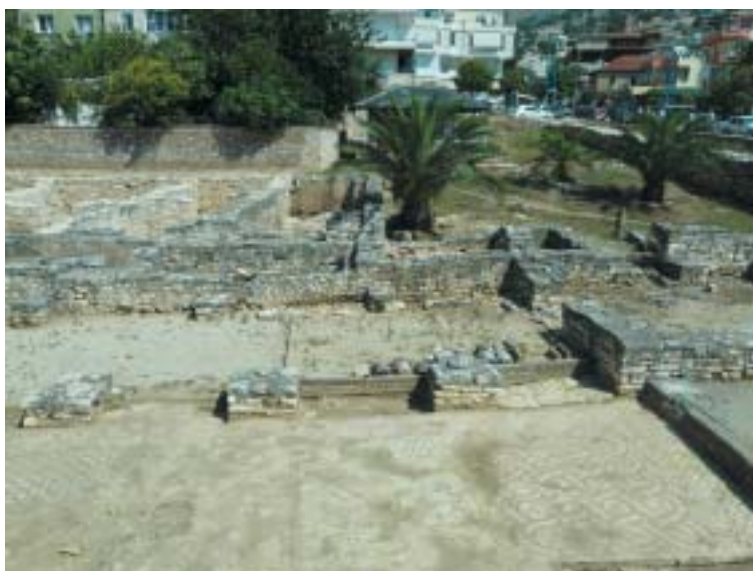
Ve městě Saranda byly nalezeny zbytky antické synagogy z 5. století.

To, že o Albánii víme tak málo, způsobil hlavně diktátor Enver Hodža, kte-