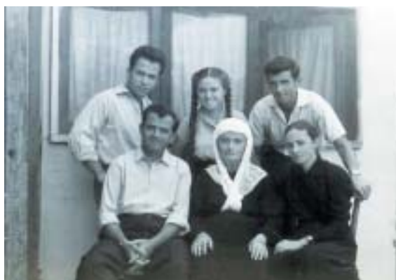
Albánští Židé se svými zachránci.

Korčë. Přes snahu Řeků, Srbů a dalších, kteří se pokoušeli strategicky výhodně položenou zemi Osmanům vyrvat, se v průběhu první balkánské války, koncem roku 1912, Albánii podařilo vyhlásit nezávislost. V roce 1924 byla zrušena monarchie a vznikla republika.