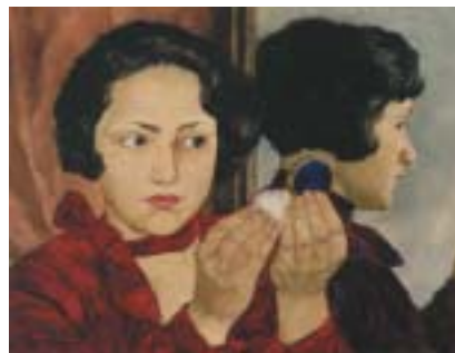
Ruská dívka s pudřenkou, 1928.

Lotte Laserstein: Face to Face , Berlinische Galerie, Landesmuseum für Moderne Kunst, Alte Jakobstrasse 124–128, 5. 4.–29. 7. 2019.