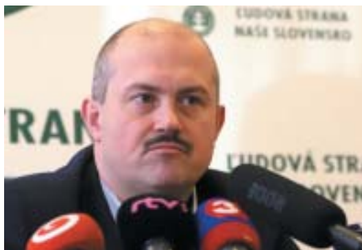
M. Kotleba po prezidentských voľbách.

Trochu inak vidia veci sympatizanti Kotlebu a slovenského fašizmu. Súdne rozhodnutie chápu ako svoje víťazstvo a v zhode s komentátormi prognostikujú nárast preferencií ĽSNS. Najnovšie výskumy preferencií politických strán im dávajú v tejto veci za pravdu. V máji zverejnené výsledky prieskumov posunuli ĽSNS na priečku druhej najsilnejšej strany v slovenskom parlamente. Podľa