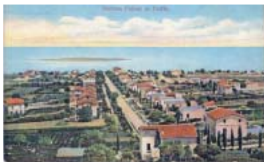
Německá kolonie v Haifě na dobové pohlednici.

Osadníci měli k dispozici jen omezené prostředky, navíc vázané nejrůznějšími poplatky a taxami. Na investice do vlastního budování osady a usedlosti peníze chyběly. Počáteční zápas o přežití byl tvrdý a urputný. Němečtí osadníci neznali místní jazyk ani hospodářské poměry v oblasti a nevěděli, jaký způsob obdělávání půdy se tu dá použít. A už vůbec neznali povahu ani zvyky místních obyvatel, kteří je zvědavě sledovali jako něco podivného a kuriózního. Nebyli také zvyklí na zdejší klima. Proti tomu všemu mohli postavit jen svou víru, vytrvalost a odhodlání. Ale díky nim se nakonec udrželi, a to nejen v Haifě, ale dokázali rozšířit své aktivity