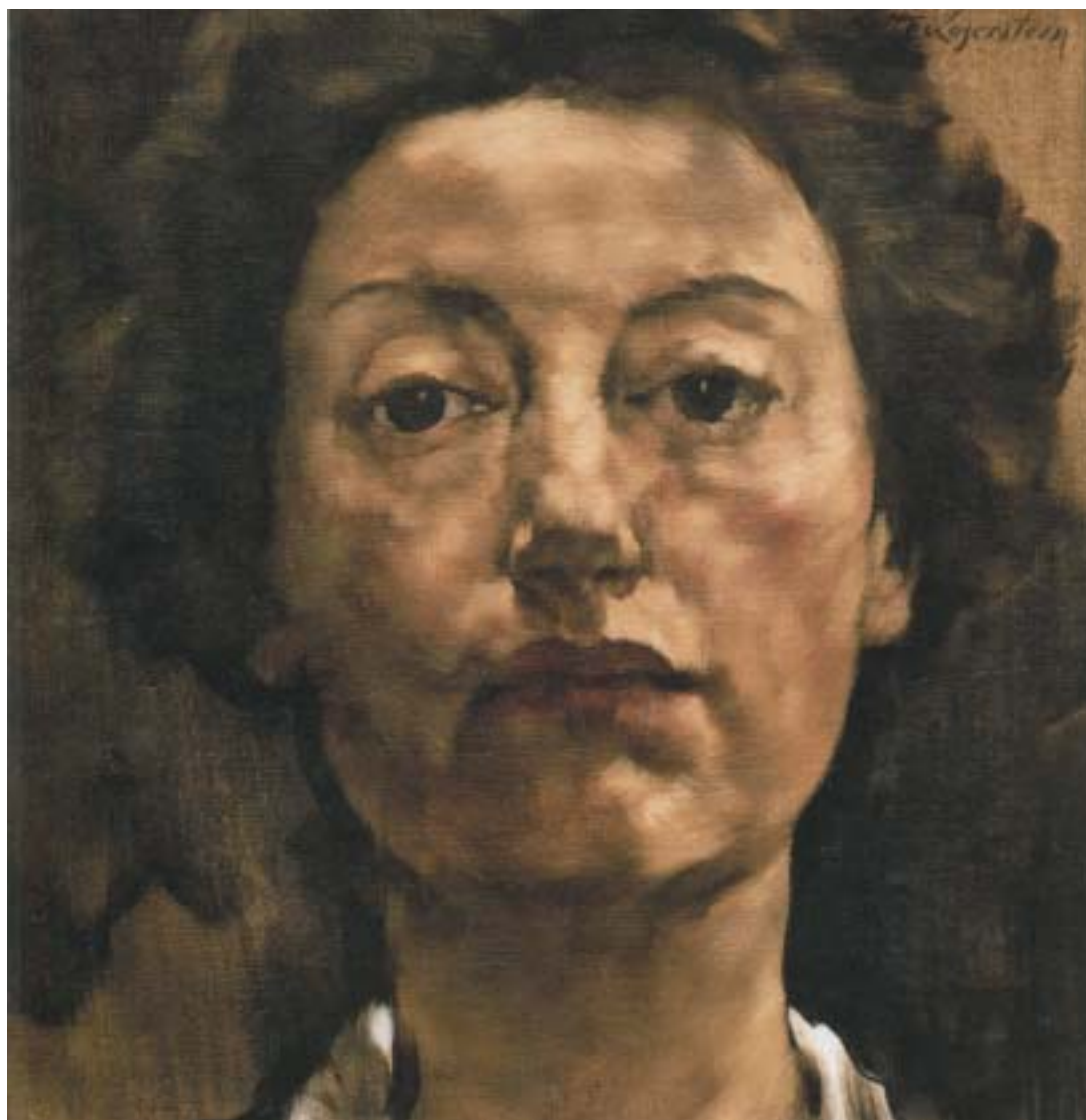
LOTTE LASERSTEIN: AUTOPORTRÉT EN FACE, 1934. (K textu na stranách 12–13.)

VĚSTNÍK ŽIDOVSKÝCH NÁBOŽENSKÝCH OBCÍ V ČESKÝCH ZEMÍCH A NA SLOVENSKU