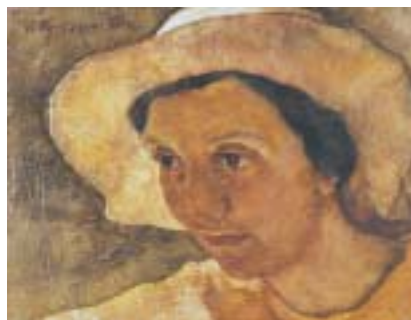
Žena v letním klobouku, 1929.