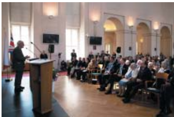
30. dubna 2019 – poděkování po osmdesáti letech.