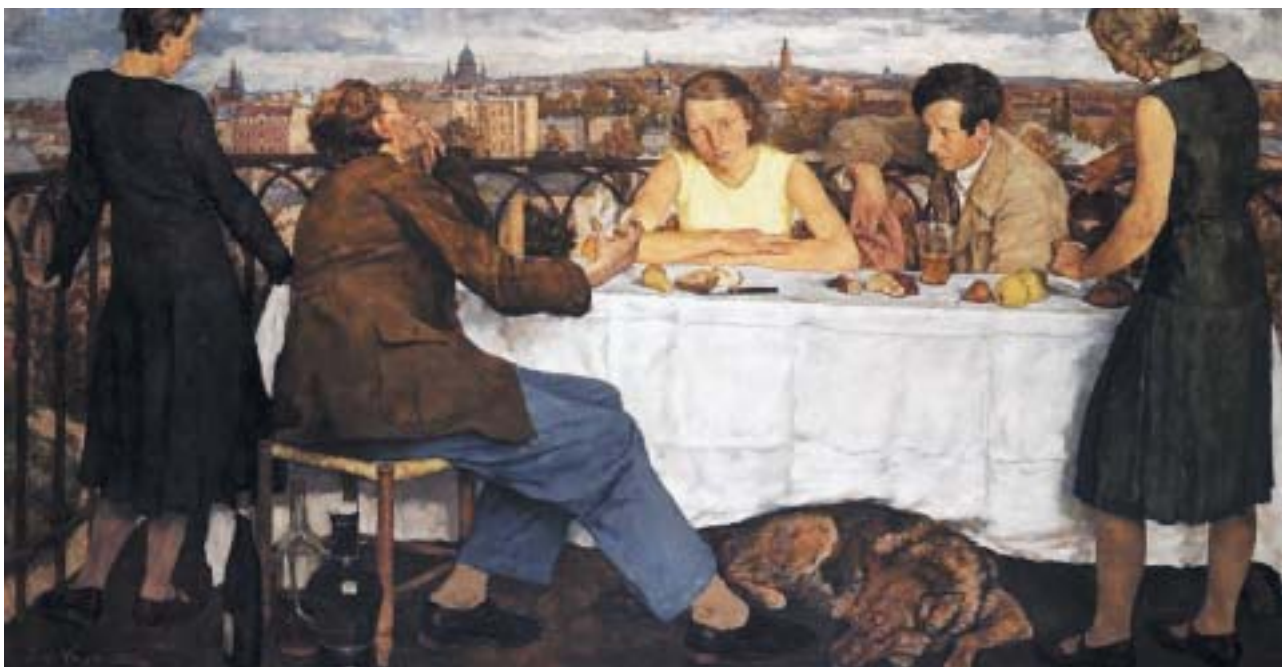
Večer na terase v Postupimi, 1930.

další velký obraz Diskuse . Tři muži, tísňící se v malém, zřejmě podkrovním pokojíku či ateliéru, sedí těsně vedle sebe, okénko při stropu zavřené, aby ani slovo neproniklo k nepozvanému uchu ven. Spiklenci vzrušeně diskutují, pravděpodobně o politické situaci a směřování země, píše se rok 1934 a Hitler je již rok u moci. Na zemi leží o čtyři roky