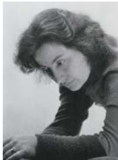
Lotte Laserstein, 1933.

očima. Obraz lemují po stranách dvě černě oblečené, zády k divákovi otočené ženy, z jejichž postoje cítíme loučení a rezignaci. O čtyři roky později maluje