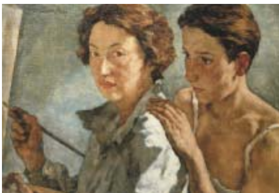
Já a můj model, 1929.