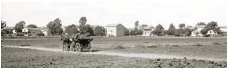
Sarona v roce 1900.

Sarona, v pořadí třetí kolonie, kterou založili templáři ve Svaté zemi, byla hospodářsky nejúspěšnější. Její prosperita