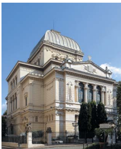
Podle průzkumu se evropským Židům nejlépe žije v Itálii. Velká synagoga v Římě, foto L. Andronico.