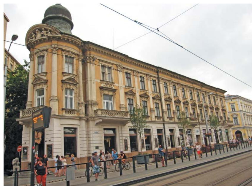
Hotel Krym na rozhraní Štúrovej ulice a Šafárikovho námestia (pôvodne hotel Bláha).

Sláva Krymu zapadla v priebehu deväťdesiatych rokov minulého storočia. V priestoroch s bohatou tradíciou sa dnes nachádza kaviareň Thema. Pred vchodom do Themy je osadená socha a informačná tabuľa s fotografiou zá-