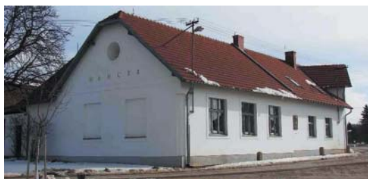
Hostinec-pension Mahler v Kalištích – dnešní stav.