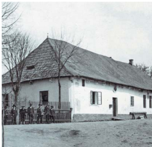
Mahlerův rodný dům v Kalištích.

a hlavně jeho Třetí symfonií, ve které jako střih se objevuje několikrát rakouská vojenská večerka, kterou Mahler slyšival z jihlavských kasáren až do rodného Kaliště. A tu hudbu jsem převedl do