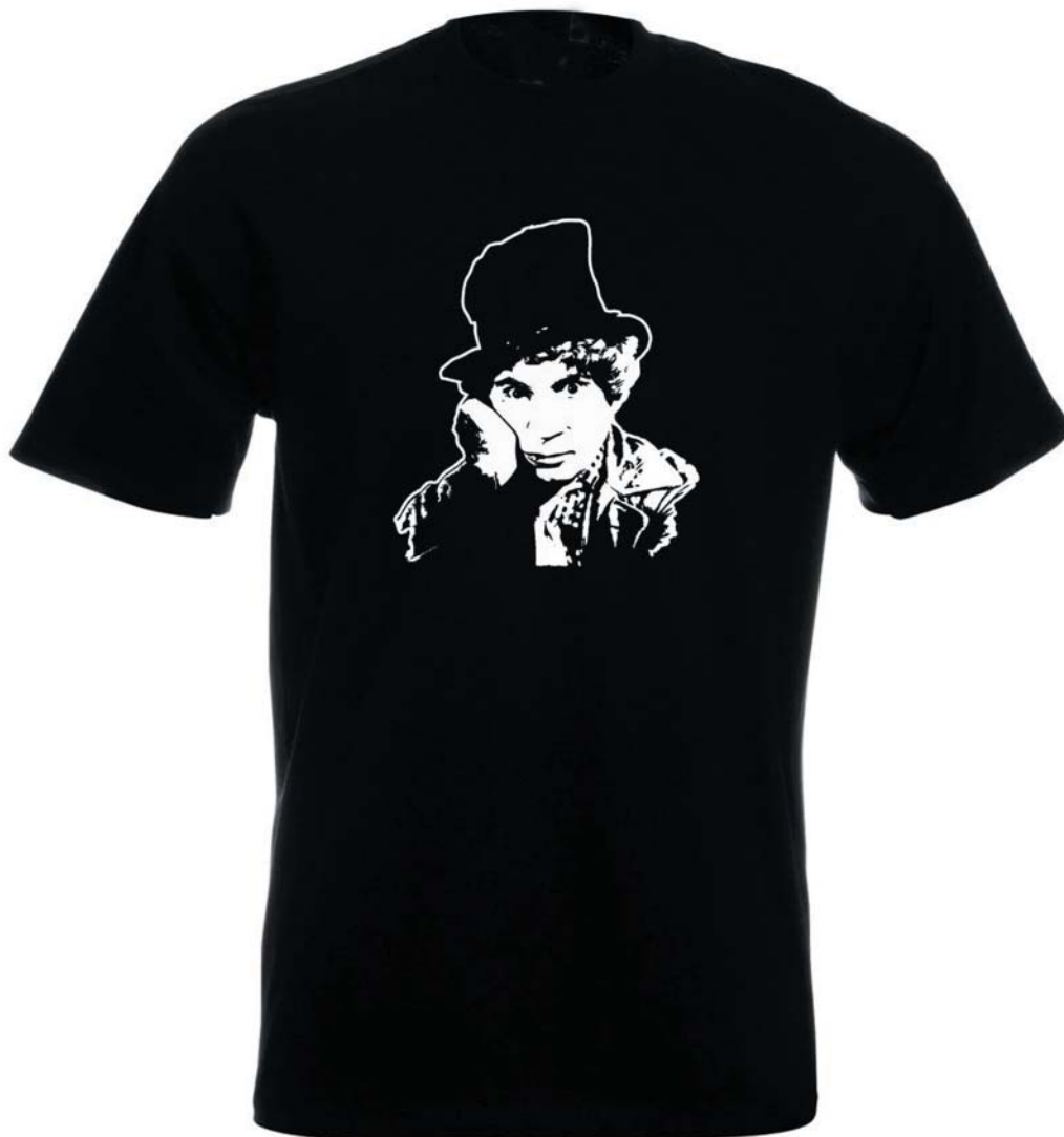
Harpo Marx. (K textu na stranách 16–19.)

VĚSTNÍK ŽIDOVSKÝCH NÁBOŽENSKÝCH OBCÍ V ČESKÝCH ZEMÍCH A NA SLOVENSKU