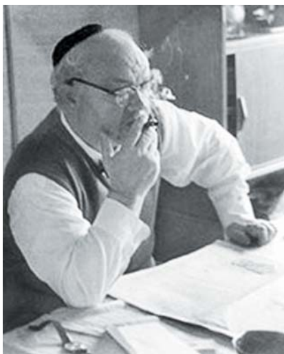
Kritik Baruch Kurzweil, 60. léta.

Před 115 lety, 22. července 1907 , se v Brtnici u Jihlavy narodil BARUCH (BENEDIKT) KURZWEIL . Kurzweilův otec působil v Brtnici jako rabin, dědeček z matčiny strany byl rabinský učenec. Studium Tóry a Talmudu se věnoval i Baruch, soustavně četl i německá klasická díla a později se zajímal