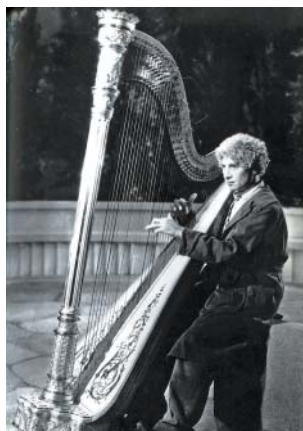
Harpo Marx. Záběr z filmu Lovci divé zvěře, 1930.