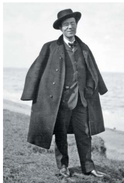
Gustav Mahler okolo roku 1890.