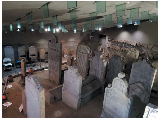
V temnom podzemí majú rabíni dôstojné miesto posledného odpočinku.

Po skončení tohto fyzicky, nábožensky aj psychicky náročného procesu R. Neumann s uspokojením oznámil záchranu spomenutých dôležitých hrobov: „Veľký zážrak sa uskutočnil, cesta bola upravená podľa plánu a rabínske hroby sa predsa udržali na pôvodnom mieste. (...) Tieto hroby sa nachádzajú v mauzóleu, ktoré teraz leží v hĺbke 5 metrov pod úrovňou cesty.“ Pred hrozbou zničenia (aj zrakmi