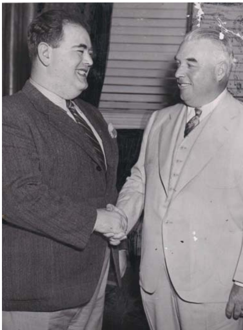
D. Unreich so šéfom bostonskej polície J. Timilty.

Ku „kultovým“ bratislavským kaviarňam patrila počas takmer celého 20. storočia kaviareň a reštaurácia hotela