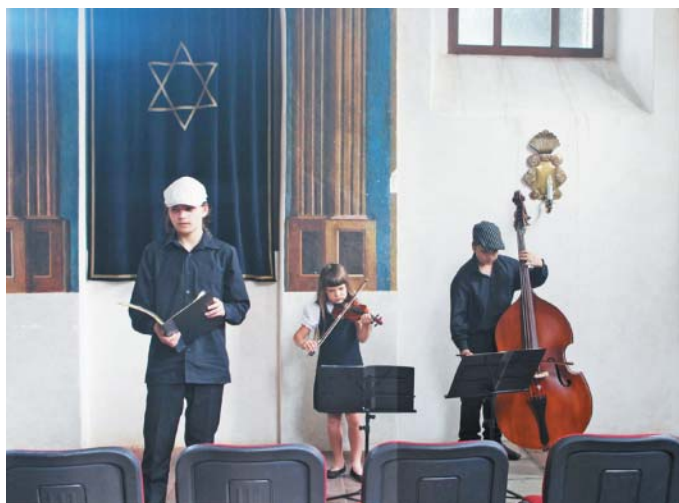
Klezmer trio v ledečské synagoze.

9. června 1942 bylo úterý. Připomeňme, že to bylo pět dní po smrti d'áblova pohůnka obergruppenführera SS Reinharda Heydricha a den před vypálením Lidic. V ono úterý 9. června se dle německého nařízení museli všichni občané židovského vyznání z Ledče a okolí shromáždit právě zde, na ledečském nádraží. Odtud s nimi odjel v 16 hodin motorový vlak do Světlé a pak dále do Kolína, kde bylo ve staré škole shromážděno židovských občanů z celého kolínského a čáslavského kraje. Z Ledče to