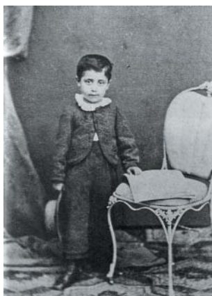
Gustav Mahler pětiletý.