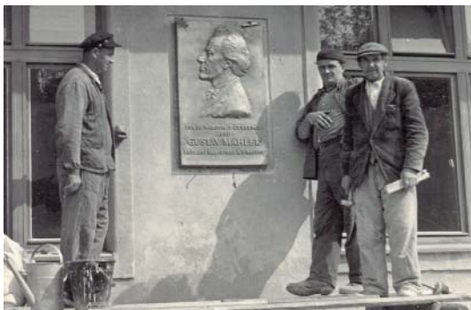
V r. 1960 byla na Mahlerův rodný dům umístěna pamětní deska.