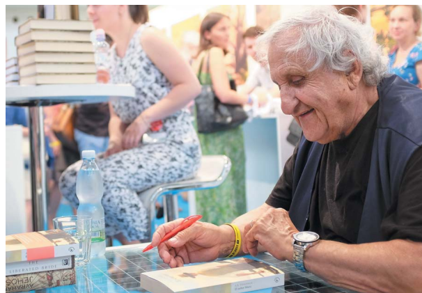
A. B. Jehošua podepisuje na festivalu Svět knihy překlady svých románů, 2018.

doxní domácnost – nenosil jsem klobouk, rodiče mě posílali do sekulární školy. Židovskou tradici jsem tedy znal, ale spíše než k sefardskému židovství jsem byl vychováván k izraelství. Myslím, že to byla tak trochu zásluha mé matky, která se sefardským prostředím nikdy úplně nesplynula. Celá její rodina zůstala v Maroku, kontakty jsme moc nepřestovali, a tak hlavní identitou, k níž se