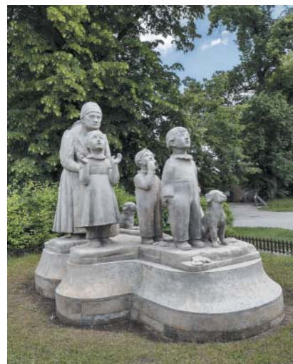
Stoletá Babička s dětmi od O. Gutfreunda.

Sousoší v Ratibořicích se nejlépe pozoruje z dálky, z aleje od Viktorčina splavu a Starého bělidla: skupina se vynořuje postupně na cestě od Ludrova mlýna, jako by nám přicházela naproti. Z blízkosti působí postavy statictější. Sochař však zachytil zvědavý pohled dětí k nebi, neboť na něm dle babiččina návodu právě hledají své hvězdy.